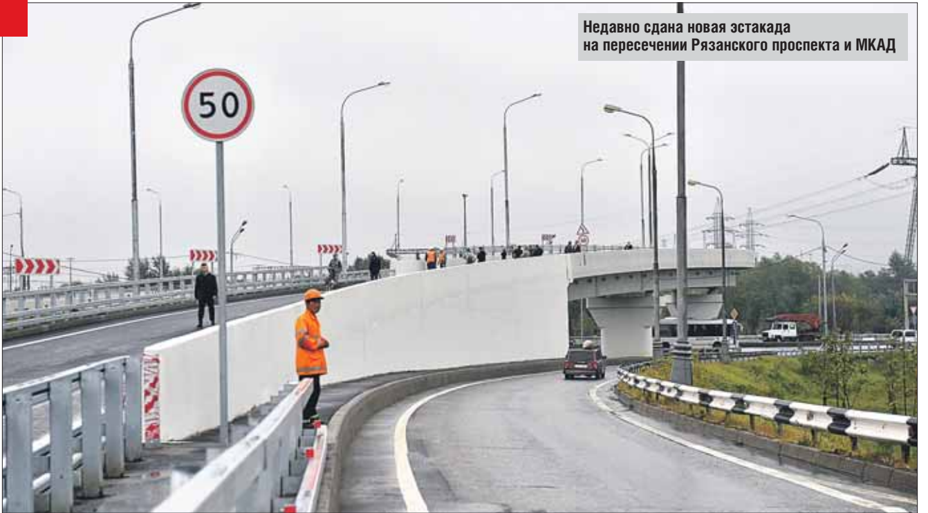
Недавно сдана новая эстакада на пересечении Рязанского проспекта и МКАД

С 2011 года одним из приоритетов строительной политики города стало возведение объектов социальной инфраструк-