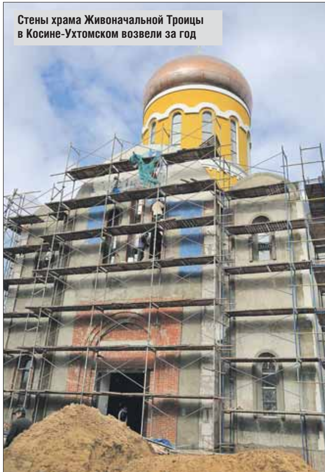
Стены храма Живоначальной Троицы в Косине-Ухтомском возвели за год

Храм в честь Введения во храм Пресвятой Богородицы (ул. Кетчерская, вл. 2) уже построен и от-