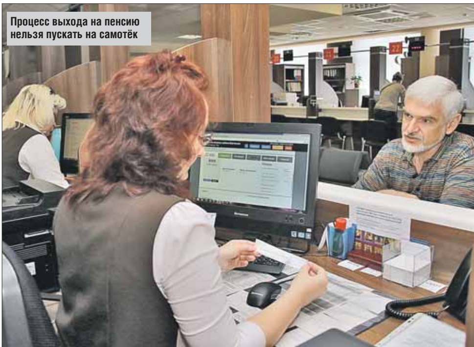
Процесс выхода на пенсию нельзя пускать на самотёк

Третье условие — наличие индивидуального пенсионного коэффициента не ниже 6,6, он тоже с каждым годом будет расти. Эта цифра зависит от уплачен-