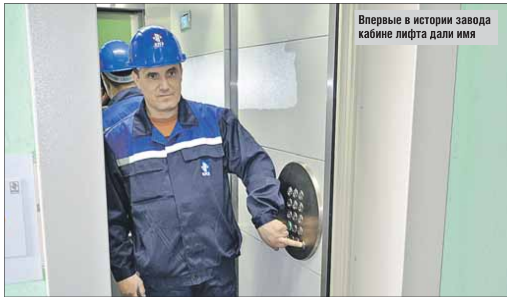
Впервые в истории завода кабине лифта дали имя

Справа от входа — испытательная установка: по шахте высотой этажа в три вверх-вниз ездит кабина. Сверху заготовительно-прессовый цех виден как на ладони. Вот рабочие вытаскивают на станках заготовки шкифов — для колёс с бороздками, на которые будут накручиваться металлические тросы. Рядом — стол, где нарезают алюминиевые пороги: их устанавливают на входе в кабину и в проёме шахты. Чуть дальше