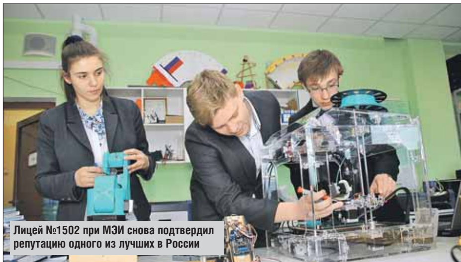
Лицей №1502 при МЭИ снова подтвердил репутацию одного из лучших в России

Подведены итоги ежегодного рейтинга лучших 500 школ страны, в котором Москва оказалась в числе городов-лидеров. В число лучших в России вошли и 14 общеобразовательных учреждений нашего округа. Это гимназия №1530 «Школа Ломоносова» в Сокольниках, новокосинские гимназии №1512 и №1048 «Новокосино», гимназия №1563 в Гольянове, гимназия №1504 и лицей №1502 при МЭИ в районе Ивановское, Московская педагогическая гимназия-лаборатория №1505 в Преображенском, измайловские гимназия №1290, школа с углублённым изучением математики, физики и информатики №444 и Измайловская гимназия №1508, лицей №429 «Соколиная гора», гимназия №1516 в Северном Измайлове, школа №2036 в Косине-Ухтом-