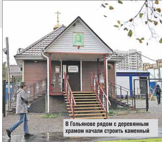
В Гольянове рядом с деревянным храмом начали строить каменный

— В храме будет уникальный иконостас — из мрамора. Но он не должен казаться монументальным, он как бы будет парить в воздухе, подчёркивая пре-