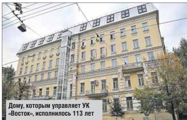
Дому, которым управляет УК «Восток», исполнилось 113 лет

Пятиэтажное здание прямо напротив следствен-