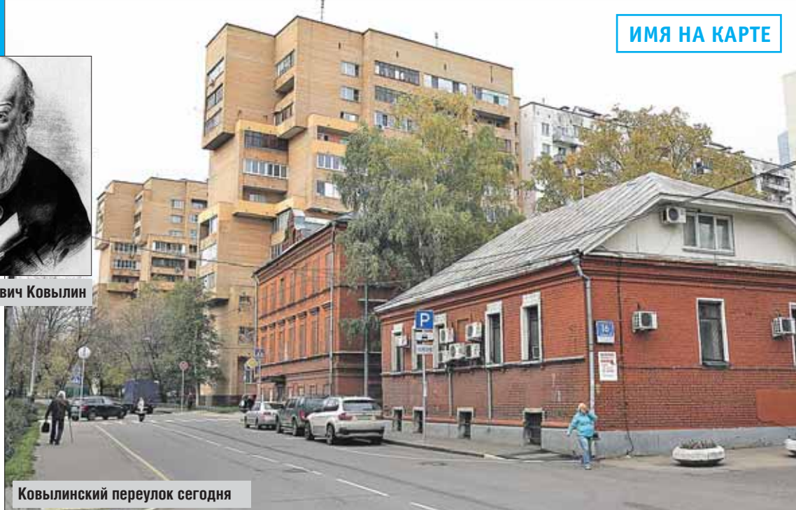
Ковылинский переулок сегодня

во время эпидемии чумы 1771 года власти разрешили старообрядцам построить в Преображенском больнице и создать кладбище. На средства куп-