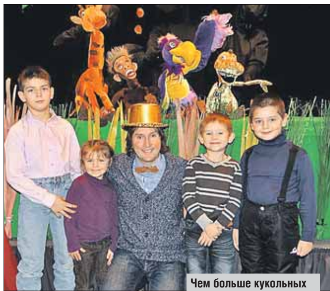
Чем больше кукольных театров, тем лучше

Жюри фестиваля будет состоять из пяти воспитанников актёрской школы Рыжего театра — одиннадцати-двенадцатилетних ребят. Спектакли будут оцениваться в семи номинациях. Приз зрительских симпатий достанется спектаклю, набравшему наибольшее количество баллов от зрителей, которые будут оценивать постановку по пятибалльной шкале. Один приз «За мужество и верность профессии» будет вручён вне