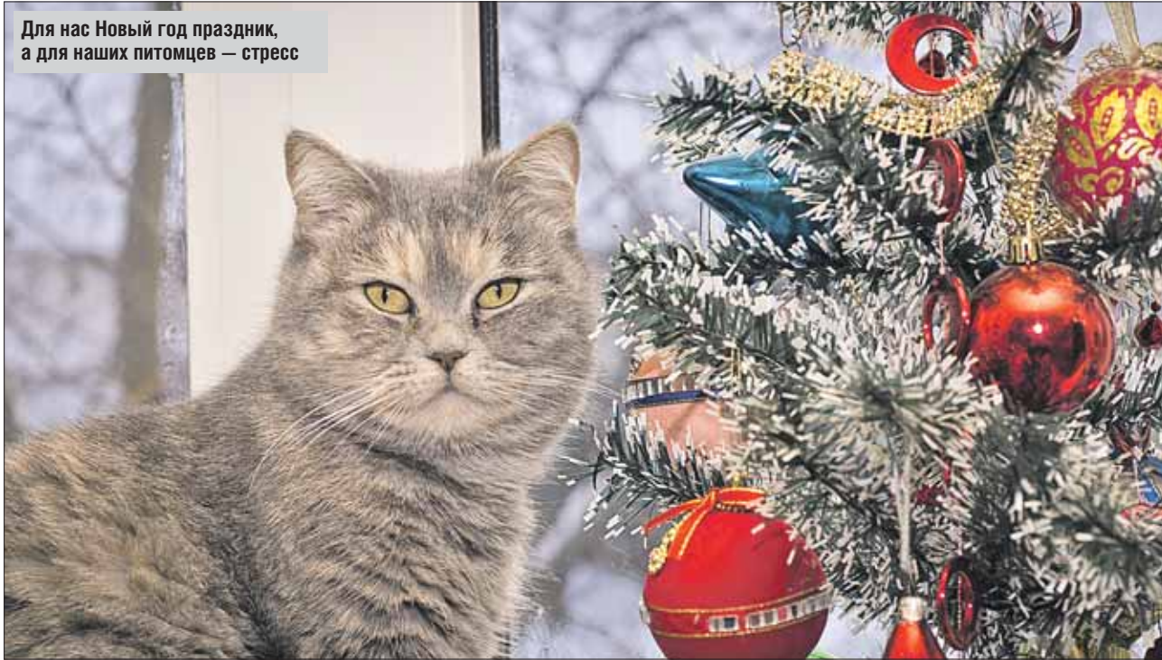
Для нас Новый год праздник, а для наших питомцев — стресс

вотным лучше уменьшить количество мяса или рыбы в рационе в полтора-два раза, применять корма с низким содержанием белка.