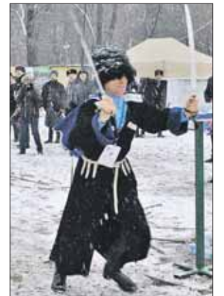
Казак в Измайлове нравится

Фестиваль военного искусства казаков «Казарла» прошёл в минувшую субботу на базе конноспортивного клуба «Измайлово». Десятки казаков с Дона, Кубани, Терек, Волги, из других регионов собрались тут, чтобы похозяйничать в рубке, метании ножа, продемонстрировать мастерство владения кнутом. Выступления мастеров были очень зрелищными: попробуй-