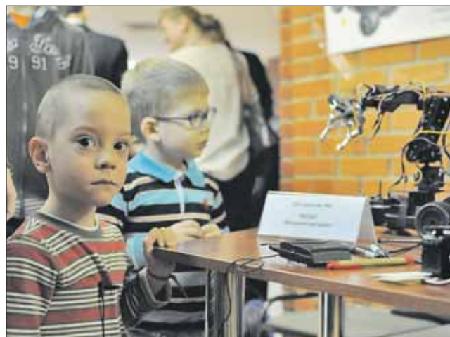
Каждая школа представила свои кружки и секции

— Изначально это был обычный конструктор. От-