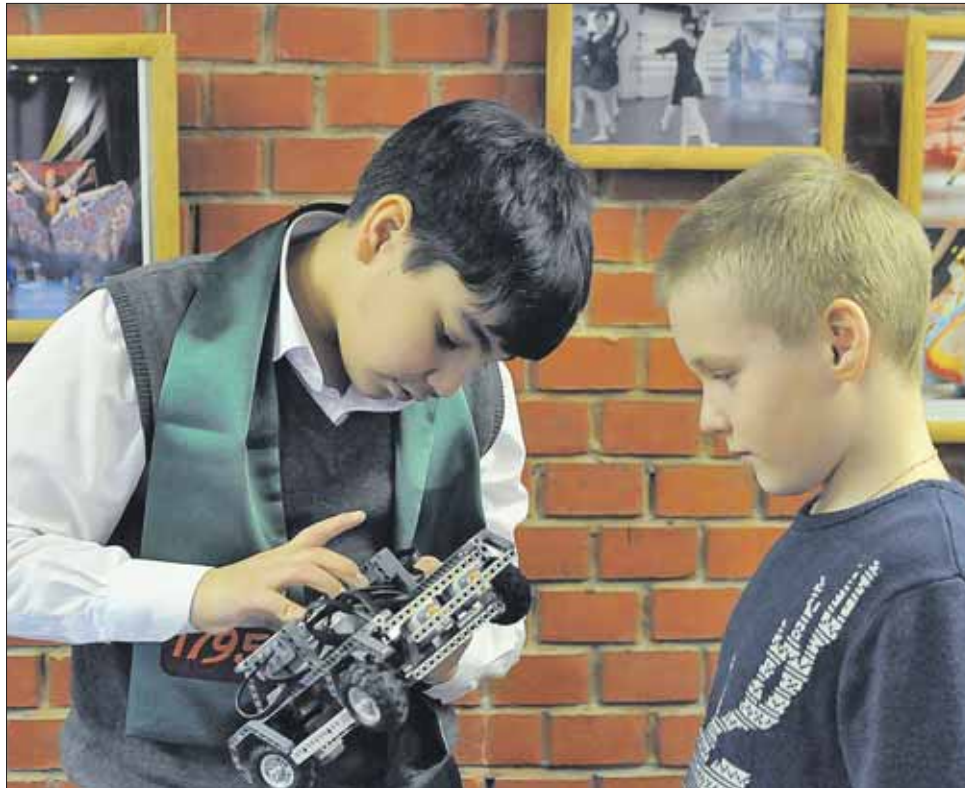
На фестивале работали десятки мастер-классов

— Робот находится в разработке. Его использование