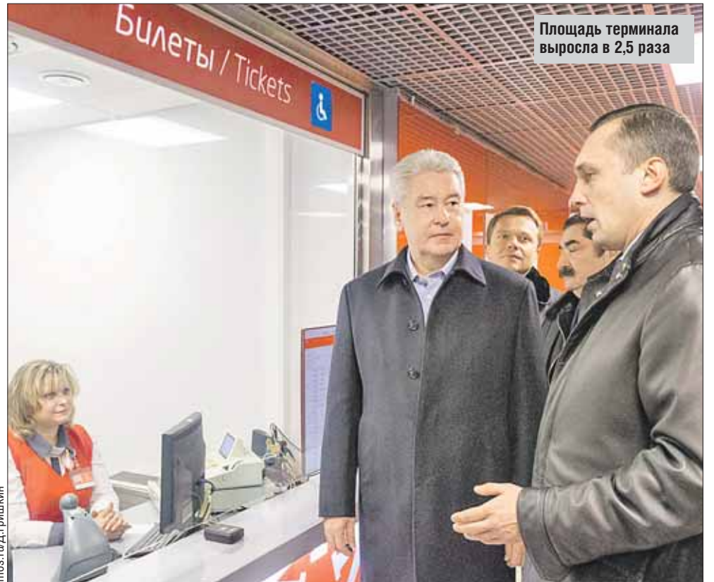
Площадь терминала выросла в 2,5 раза

Всего за три месяца, с сентября по декабрь текущего года, на Павелецком вокзале были проведены необходимые ремонтно-реставрационные работы. В результате площадь терминала увеличилась в 2,5 раза и сейчас составляет 2 тыс. кв. метров; вместо трёх билетных касс теперь пять, в том числе одна для маломобильных групп граждан. Также билеты на аэроэкспресс можно приобрести в 16 билетных автоматах. В итоге пропускная способность термина-