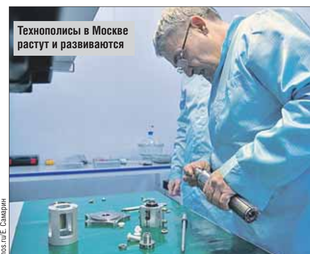
Технополисы в Москве растут и развиваются