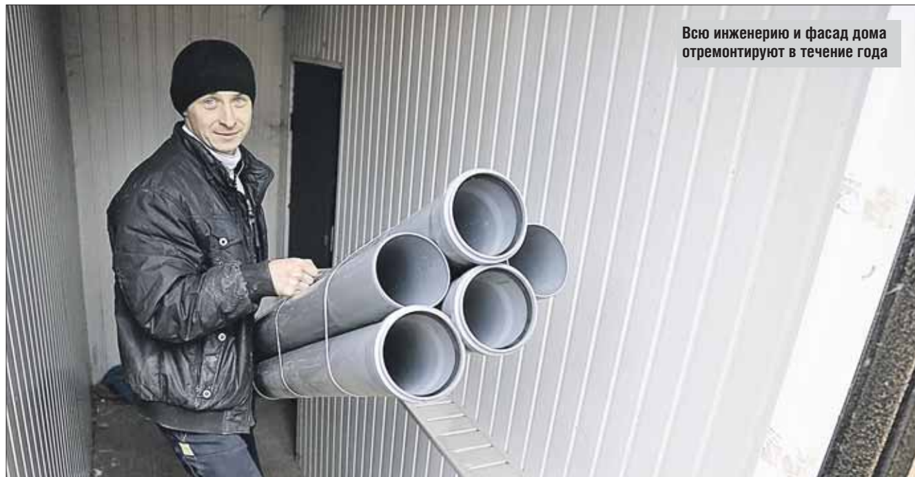
Всю инженерно и фасад дома отремонтируют в течение года

В подвале кирпичной пятиэтажки 1959 года постройки тепло, сухо и чисто: здесь размещаются офисы и склады, которые сейчас освобождены в связи с капремонтом.