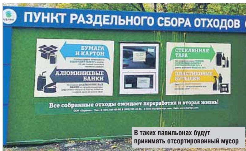
В таких павильонах будут принимать отсортированный мусор

— Эксперимент в Северо-Восточном округе показал, что раздельный сбор мусора востре-