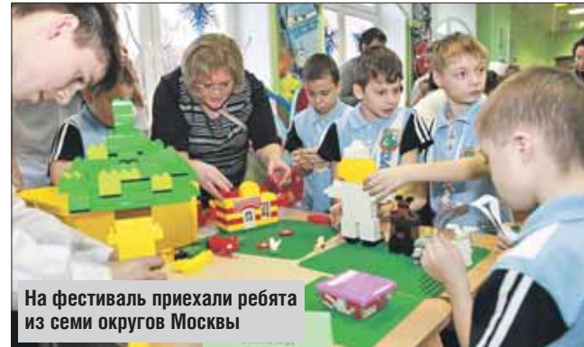
На фестиваль приехали ребята из семи округов Москвы