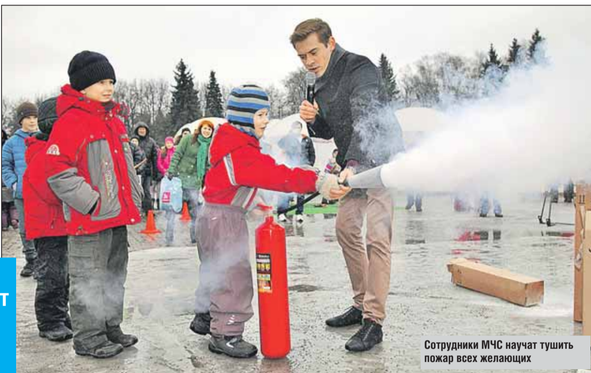
Сотрудники МЧС научат тушить пожар всех желающих

И дети, и взрослые смогут поучаствовать в викторинах и конкурсах