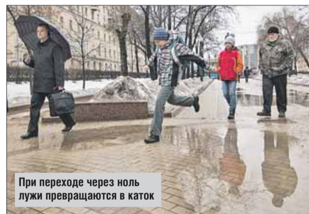
При переходе через лужи превращаются в каток

Автовладельцам надо постараться не парковать свои машины под деревьями и вблизи линий электропередачи.