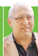
Рубрику ведёт Валерий КИОНОВ

Как богач-красавец стал святым чудотворцем