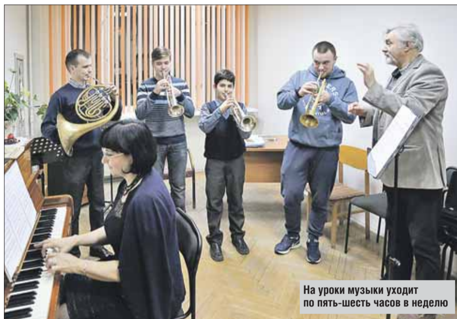
На уроки музыки уходит по пять-шесть часов в неделю

В конце весны в музыкалках проходят вступительные экзамены. Тестировать будут слух, ритм и музыкальную память. Для этого маленьких «абитуриентов» попросят напеть мелодию, прохлопать ритм вслед