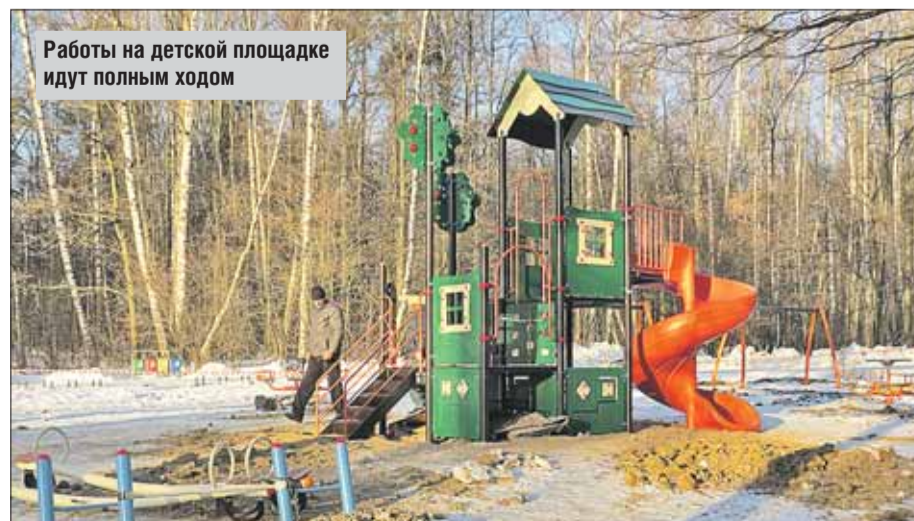
Работы на детской площадке идут полным ходом