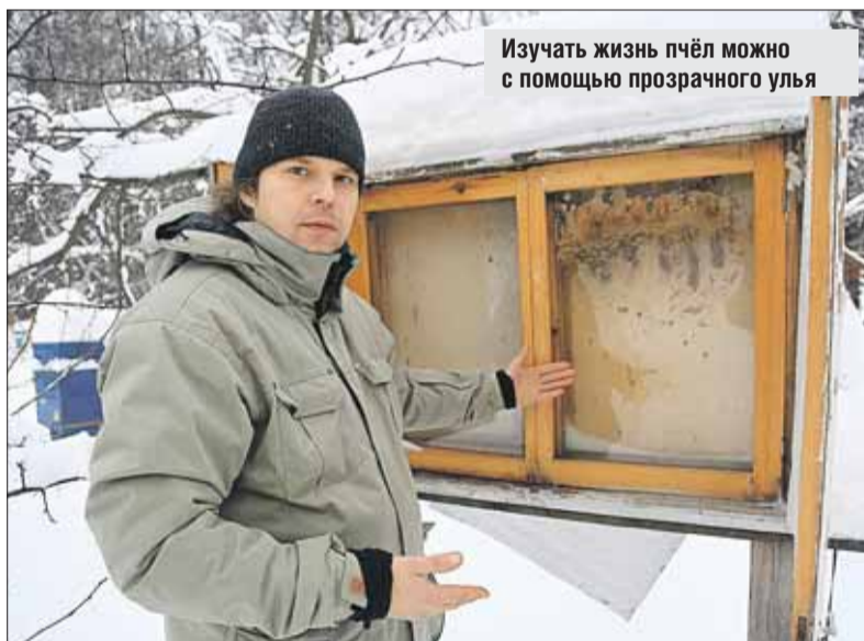
Изучать жизнь пчёл можно с помощью прозрачного улья

ст. м. «Измайловская», далее пешком по парку; ст. м. «Шоссе Энтузиастов», далее на троллейбусе (№68, 30) или трамвае (№8, 36 или 20) до остановки «3-я Владимирская улица», затем пешком по парку