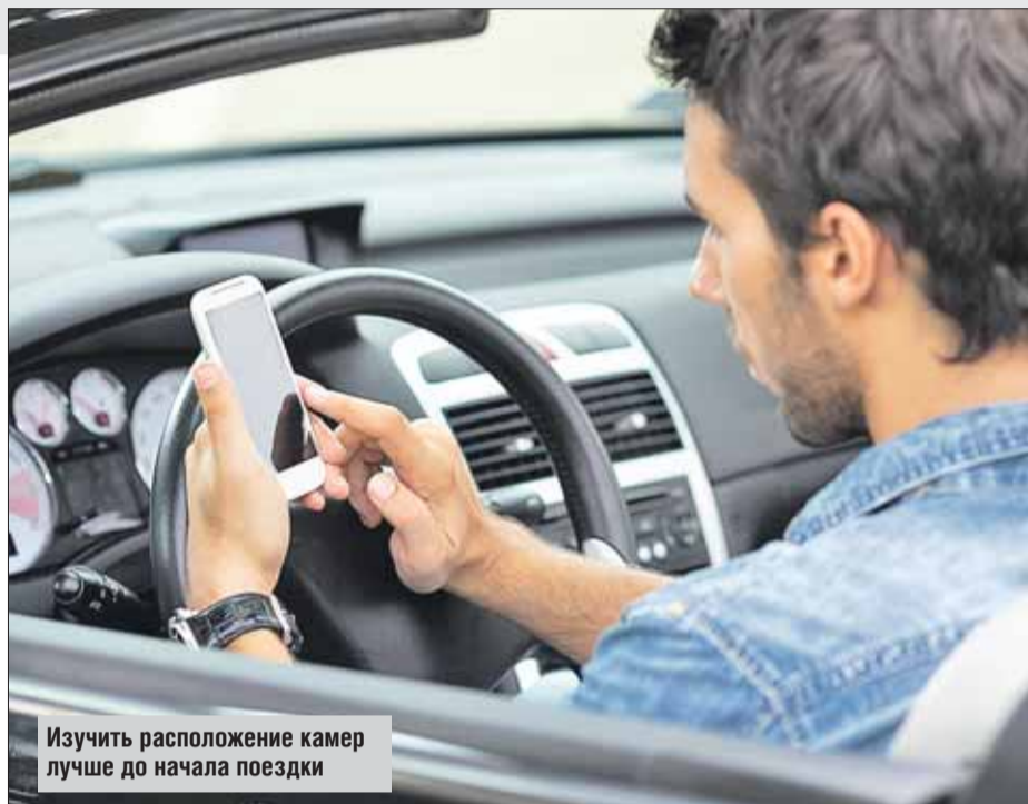
Изучить расположение камер лучше до начала поездки

На том же маршруте испытываю второе популярное приложение —