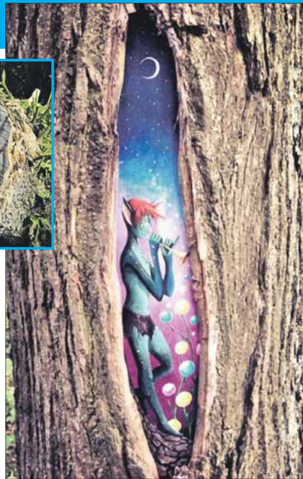
Морозобойна становится как будто окном в сказочный мир