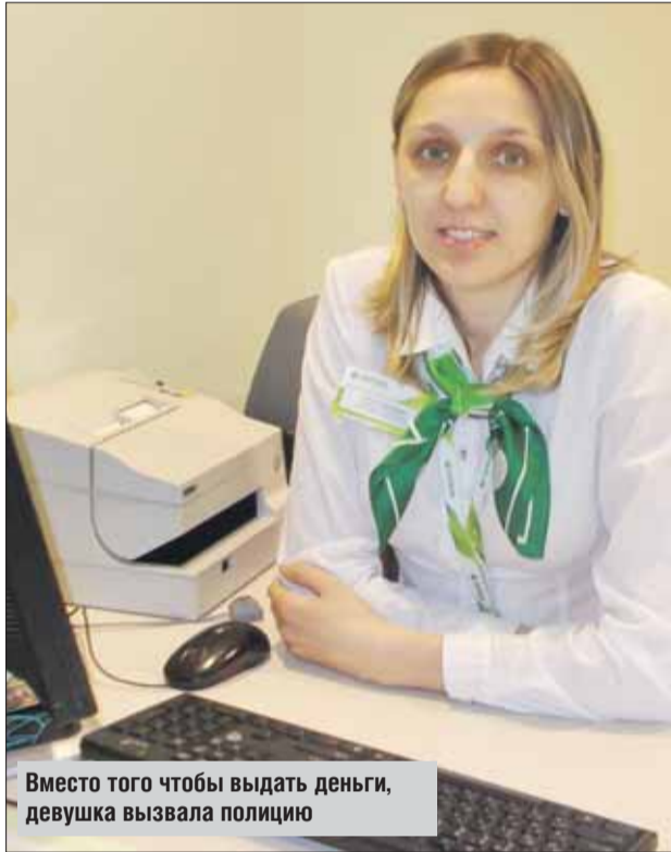
Вместо того чтобы выдать деньги, девушка вызвала полицию