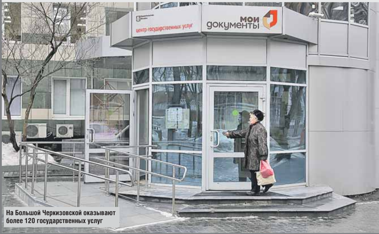
На Большой Черкизовской оказывают более 120 государственных услуг