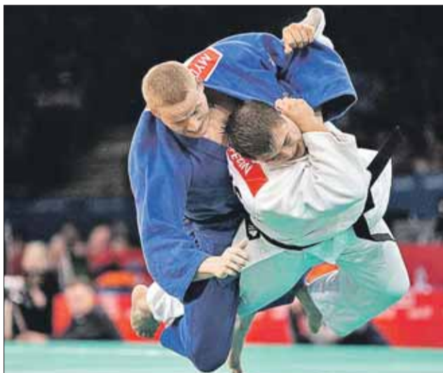
В дзюдо можно победить более сильного противника за счёт ловкости

— Нагрузки в дзюдо вполне приличные, так что