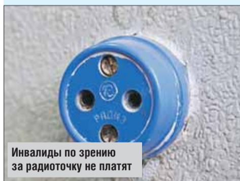
Инвалиды по зрению за радиоточку не платят

По информации Городского центра жилищных субсидий г. Москвы, полностью освобождены от оплаты радиоточки инвалиды по зрению 1-й и 2-й группы. По вопросу учёта льгот в едином платёжном документе (ЕПД) нужно обратиться в центр госуслуг своего района, а при его отсутствии — в ГКУ «Инженерная служба» района. Если платёжки оформляет собственная бухгалтерия ТСЖ или ЖСК, то обращаться следует к бухгалтеру.