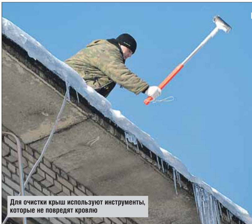
Для очистки крыш используют инструменты, которые не повредят кровлю

Эпидемия гриппа и ОРВИ в столице пошла на убыль. Об этом сообщил заместитель мэра Москвы Леонид Печатников. В целом по всем демографическим группам населения Москвы заболеваемость гриппом и ОРВИ в настоящее время остаётся выше эпидемического порога на 13%, что на 18% меньше аналогичного показателя на 31 января. При этом заболеваемость в наиболее уязвимой группе детей до двух лет опустилась ниже эпидпорога на 5,6%.