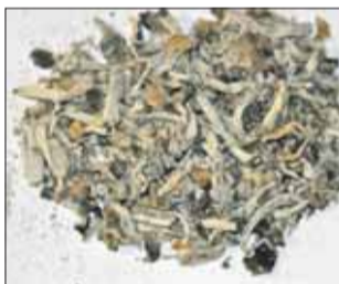
Из-за этих грибов киноману теперь грозит тюремный срок

В ходе досмотра у 24-летнего уроженца Краснодарского края оперативники