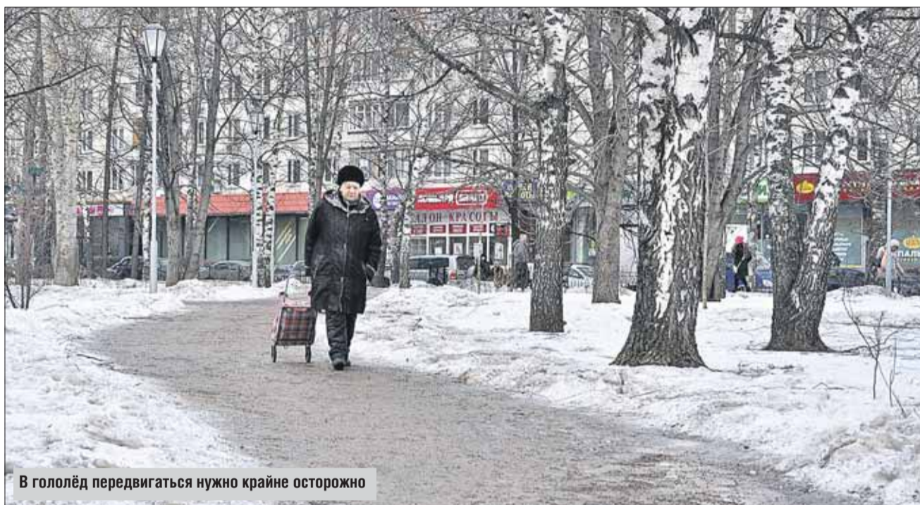
В гололёд передвигаться нужно крайне осторожно

Всего в городе ГУП «Мосводосток» обслуживает более 110 тысяч водоприёмных колодцев. Для их очистки используют специализированную откачивающую технику: отечественные илососные машины КО-507, КО-510, комбинированные машины ДКТ-245, ДКТ-255, каналопромывочные машины, а также импортную технику на шасси Man, Mercedes-Benz, Unimog и другие.