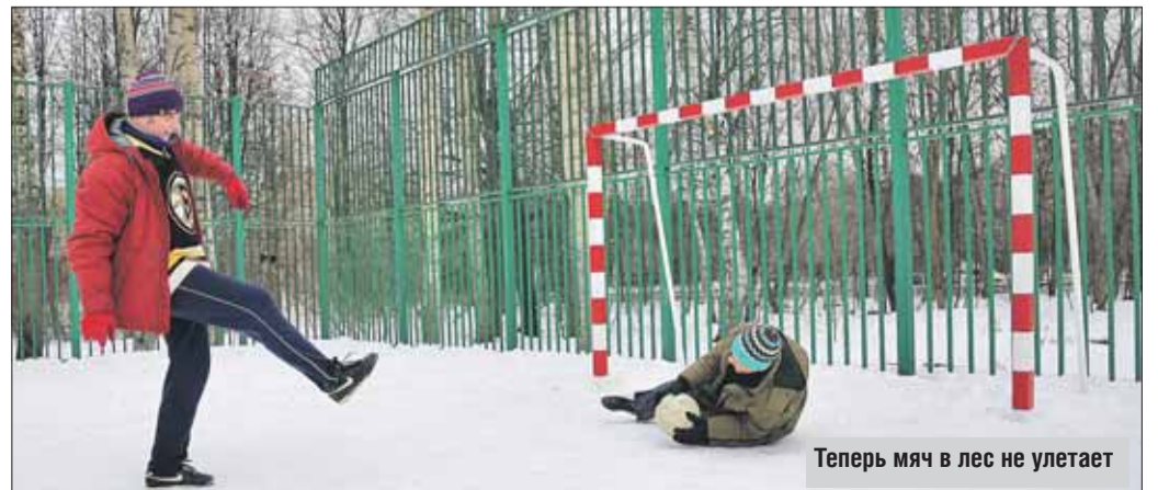
Теперь мяч в лес не улетает