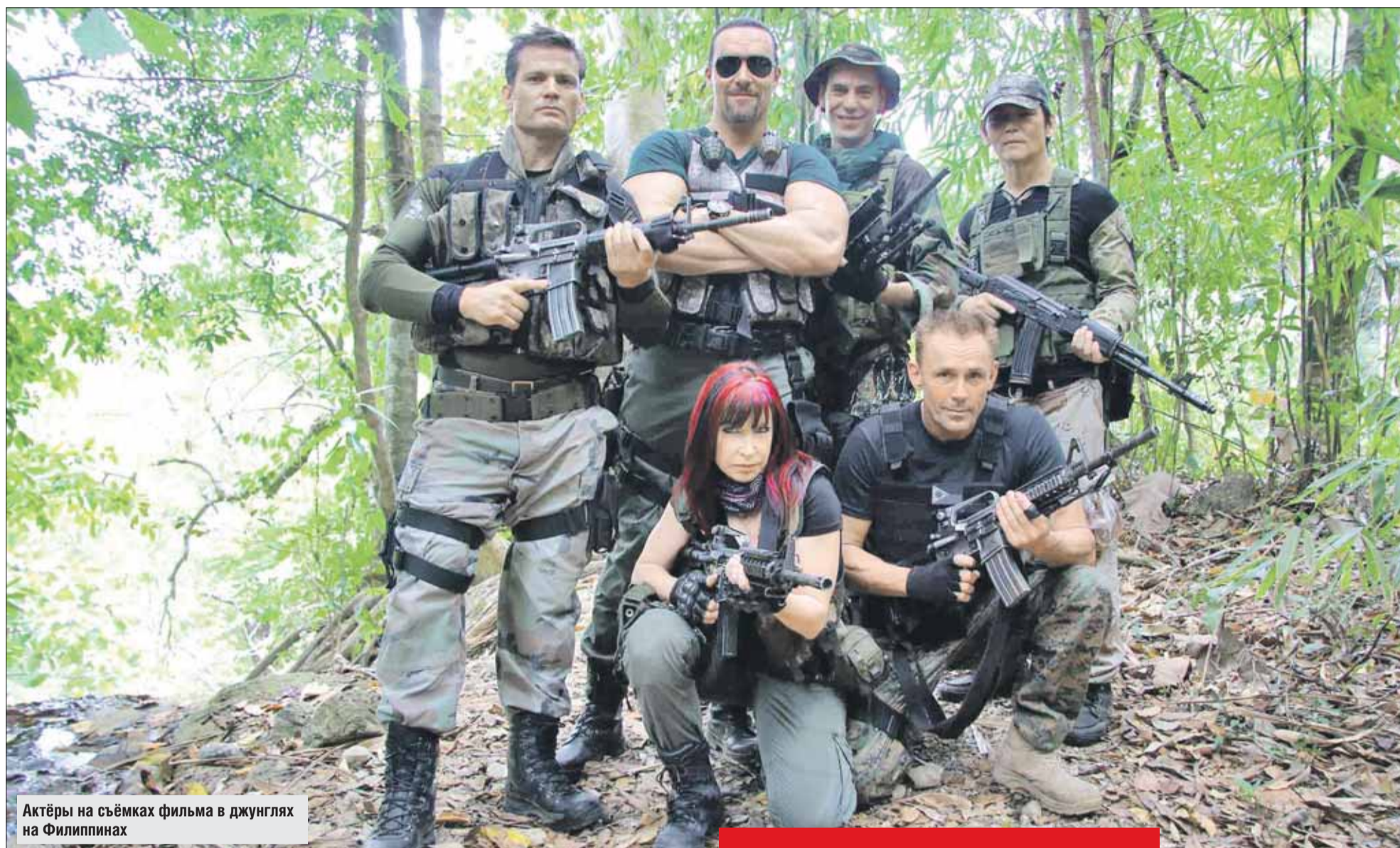
Актёры на съёмках фильма в джунглях на Филиппинах

ред режиссёром! Приехал сниматься в голливудском кино, а мне костюма даже не досталось!