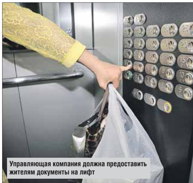
Управляющая компания должна предоставлять жителям документы на лифт