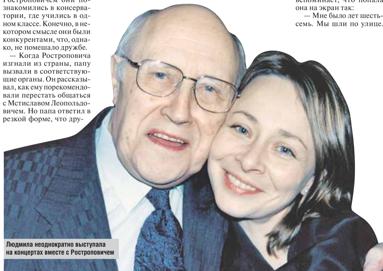
Людмила неоднократно выступала на концертах вместе с Ростроповичем