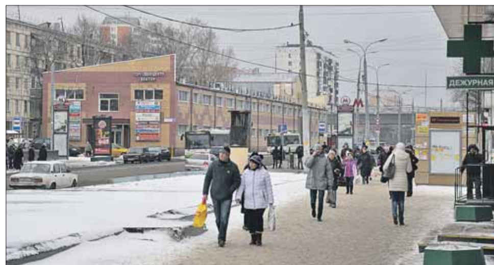
Уже мало что напоминает о снесённых объектах