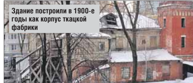
Здание построили в 1900-е годы как корпус ткацкой фабрики

Здание построили в 1900-е годы как корпус ткацкой фабрики: на 1-м