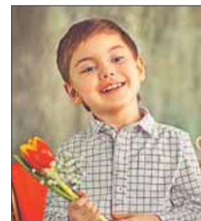
Участие бесплатное, но необходима регистрация по ссылке mosartcentre.timepad.ru/event/295810/