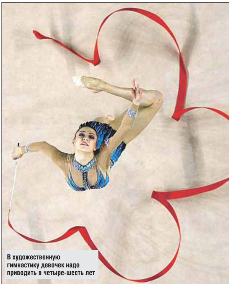
В художественную гимнастику девочек надо приводить в четыре-шесть лет

— Надо понимать, что любой спорт — а спорт высших достижений в особенности — травматичен. Боксёры регулярно получают по голове, что весьма непо-