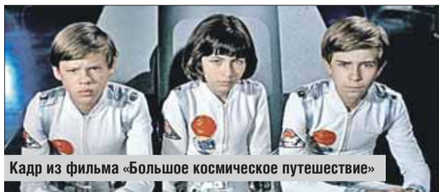
Кадр из фильма «Большое космическое путешествие»