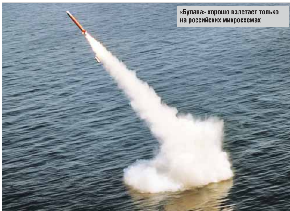
«Булава» хорошо взлетает только на российских микросхемах

История нынешнего «Лит-Фона» началась ещё в 30-х годах прошлого века. Уже тогда умные головы сообразили, что для радиоаппаратуры нужны пьезоэлектрические кристаллы. В первые дни войны предприятие получило задание изготовить резонаторы для военных радиостанций. Спешно началась работа по организации производства кристаллов сегнетовой соли и изделий из них. Первое оперативное оборонное задание предприятие получило в связи с необходимостью создания прибора для обнаружения авиабомб замедленного действия: эти бомбы тогда сыпались на Москву градом. Сотрудники предприятия за считанные дни изготовили опытный об-