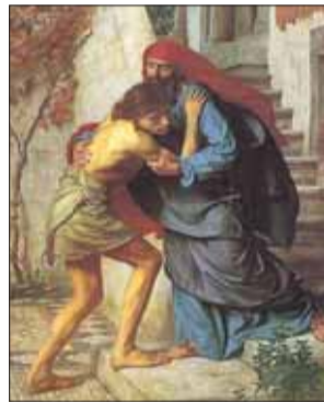
Возвращение блудного сына. 1869 г. Английский художник Эдвард Джон Пойнтер

И вот эта простая, казалось бы, история стала источником великого множества произведений искусства, а по количеству различных толкований впол-