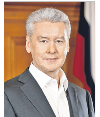
Мэр Сергей Собянин

Вынужденной мерой при благоустройстве станет ликвидация некоторых троллейбусных маршрутов в центре города. Их заменят новыми российскими