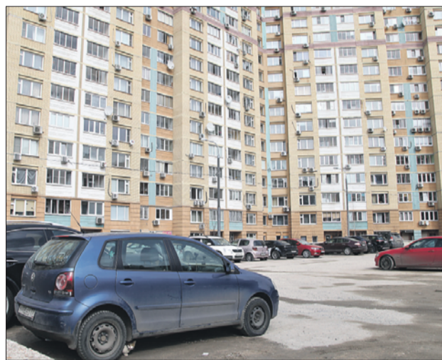
В следующем году жители новостройки на 4-й Гражданской смогут припарковаться в подземном гараже

— Это брошенный заказ Департамента строительства города Москвы. В настоящее время технический заказчик делает выверку, чтобы опре-