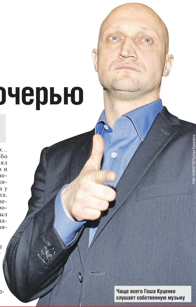
Чаще всего Гоша Куценко слушает собственную музыку