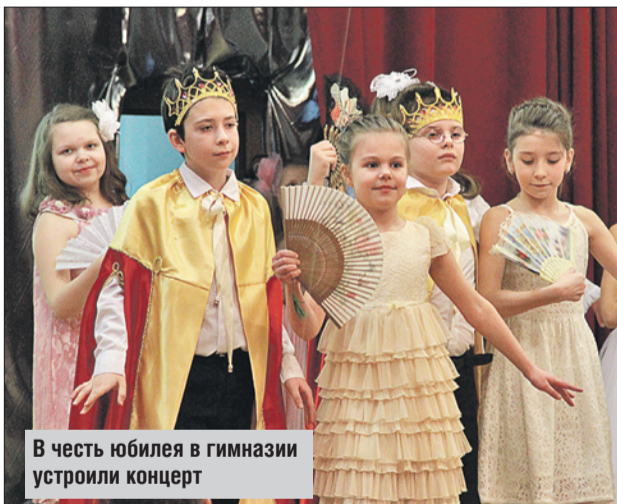
В честь юбилея в гимназии устроили концерт

— Я пришла работать в гимназию 50 лет назад и по опыту могу сказать, что дети очень изменились, — отмечает