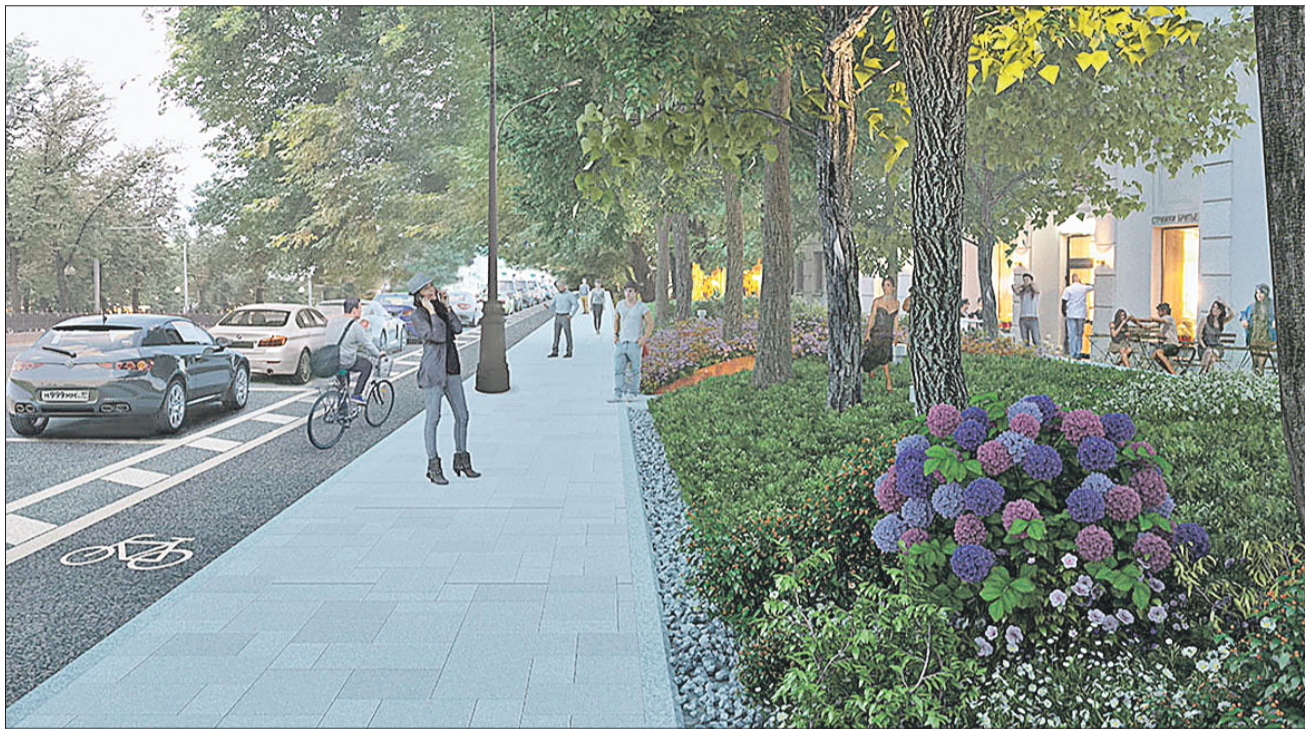
Так должен выглядеть Чистопрудный бульвар после масштабного озеленения

Москву ждут масштабные работы по программе «Моя улица»