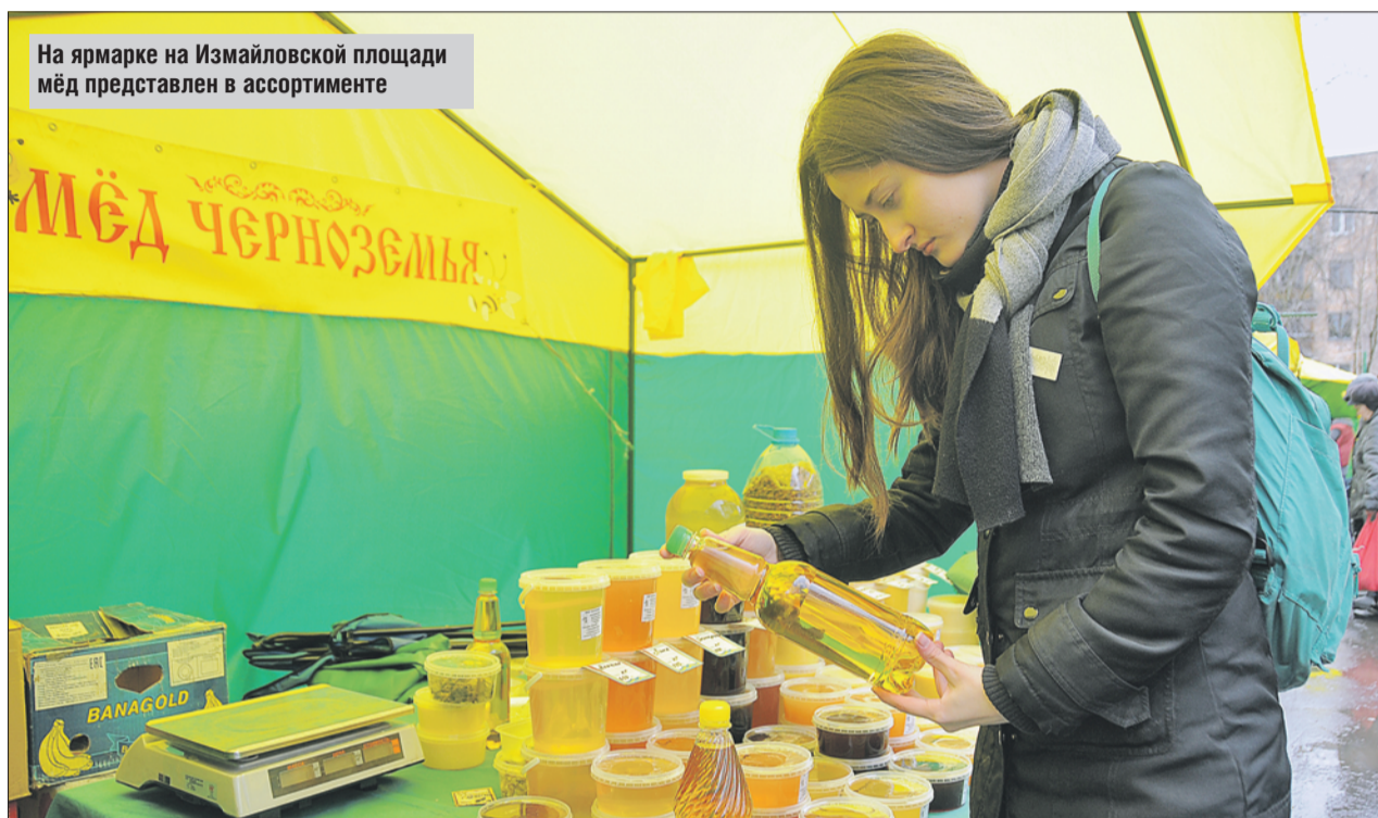
На ярмарке на Измайловской площади мёд представлен в ассортименте

Около ярмарки на Измайловской площади даже к концу работы не припар-