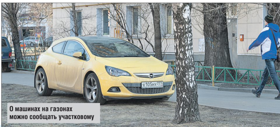
О машинах на газонах можно сообщать участковому

→ После организации платной парковки у м. «Преображенская площадь» большинство водителей ведут себя цивилизованно. Но некоторые организовали «дикую» парковку на тротуарах и газонах у дома 3, корп. 1, на улице Б. Черкизовской, в автобусном кармане у соседнего дома 3, корп. 1, и поблизости под знаком «Остановка запрещена». Не знаю, почему на них не действует съёмка автомобиля ЦОДД.