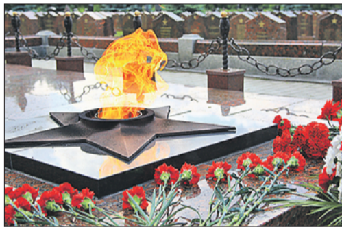
Мемориал на Преображенском кладбище

Ветеранские организации ВАО примут участие в весеннем благоустройстве памятных мест округа. Работы пройдут с 15 апреля по 8 мая.