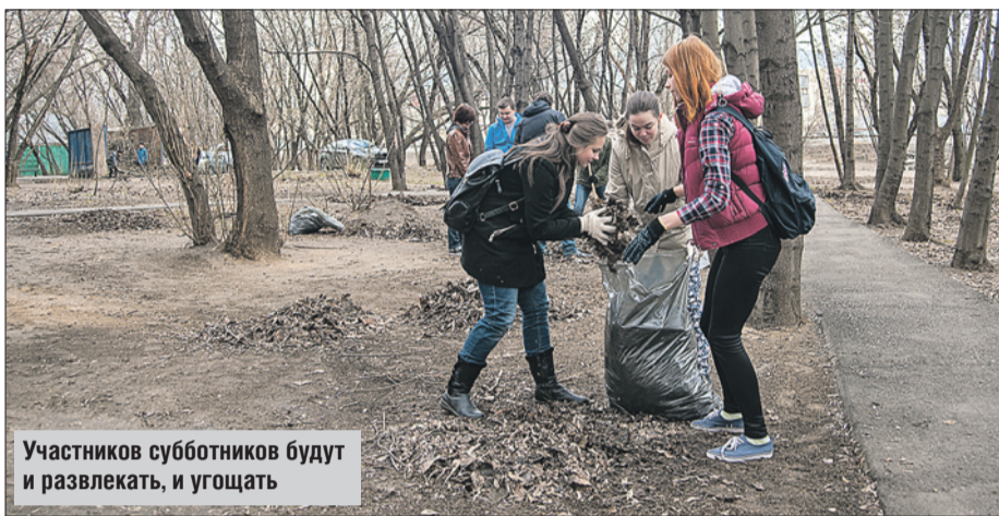
Участников субботников будут и развлекать, и угощать

— Планируем, что всего в уборке на наших площадках — в парке «Радуга», Терлецкой дубраве, Ивановском лесопарке и в парке у Владимирско-