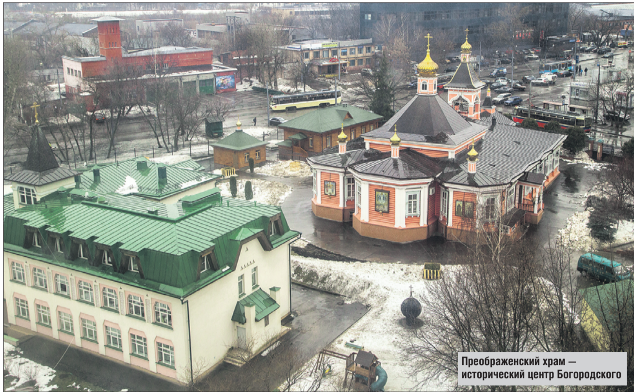
Преображенский храм — исторический центр Богородского

Он также сообщил, что по многочисленным просьбам жителей на месте снесённых гаражей на