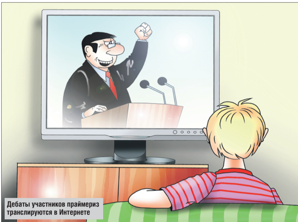
Дебаты участников праймериз транслируются в Интернете