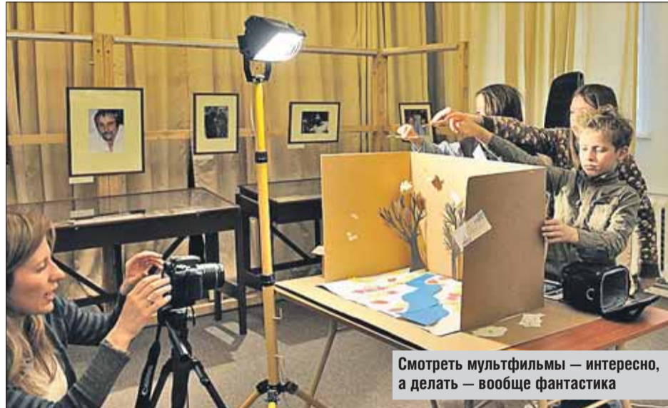
Смотреть мультфильмы — интересно, а делать — вообще фантастика

Будьте бдительны: киноквартирник в библиотеке пройдёт на день раньше, чем везде, а именно 22 апреля . Вход свободный, начало в 20.00, окончание в полночь. Регистрация требуется только для команд, участвующих в квесте, тел. (499) 161-3219 .