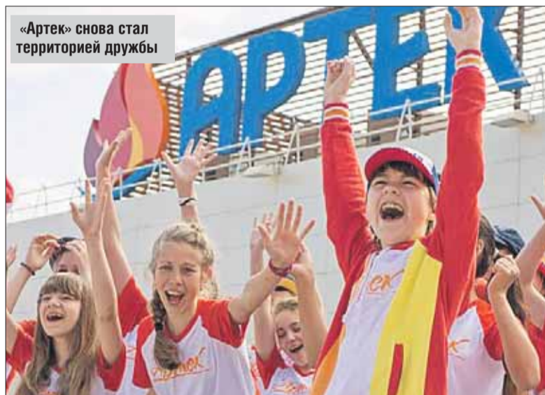
«Артек» снова стал территорией дружбы

На секциях ребята выступили с 93 исследовательскими проектами. Доклады, если су-