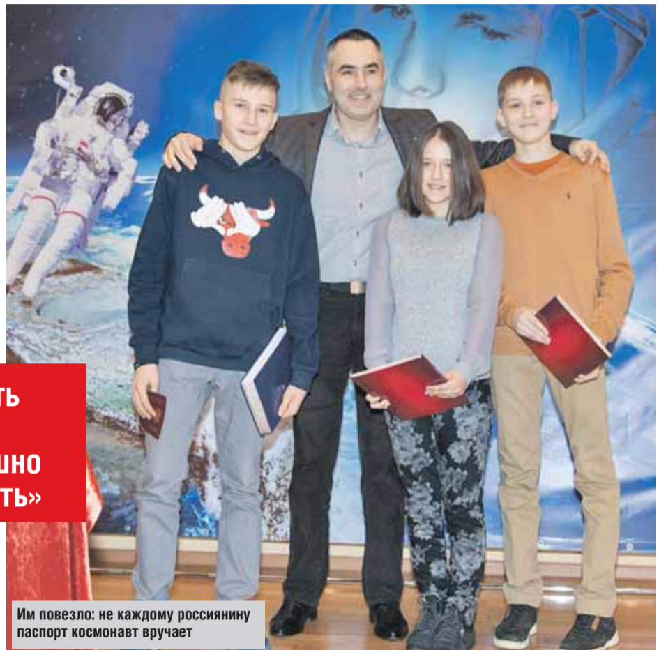
Им повезло: не каждому россиянину паспорт космонавт вручает