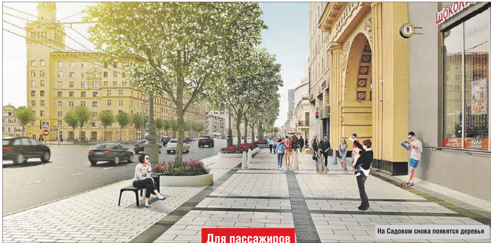
На Садовом снова появятся деревья

В центре Москвы начались масштабные работы по программе «Моя улица»