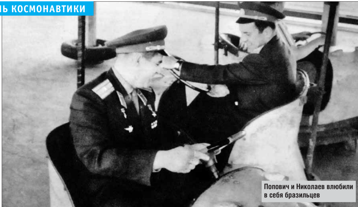
Попович и Николаев влюбили в себя бразильцев

Встречал первого космонавта шикарный кортеж. Подобраться к Гагарину было нельзя: он всё время находился в кольце охраны, фотографи-