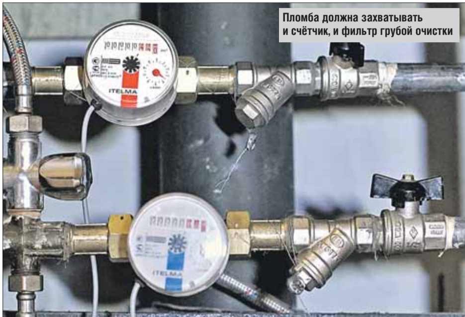
Пломба должна захватывать и счётчик, и фильтр грубой очистки