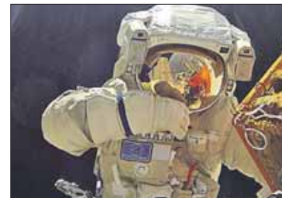
Селфи российского космонавта Сергея Волкова

Выставка работает до 30 апреля . Мария ГУСЕВА