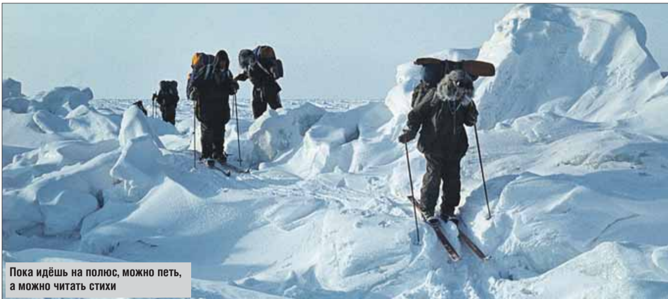
Пока идёшь на полюс, можно петь, а можно читать стихи

И ведь всё это время он преподавал математику в Институте стали и сплавов. Одно непонятно: то