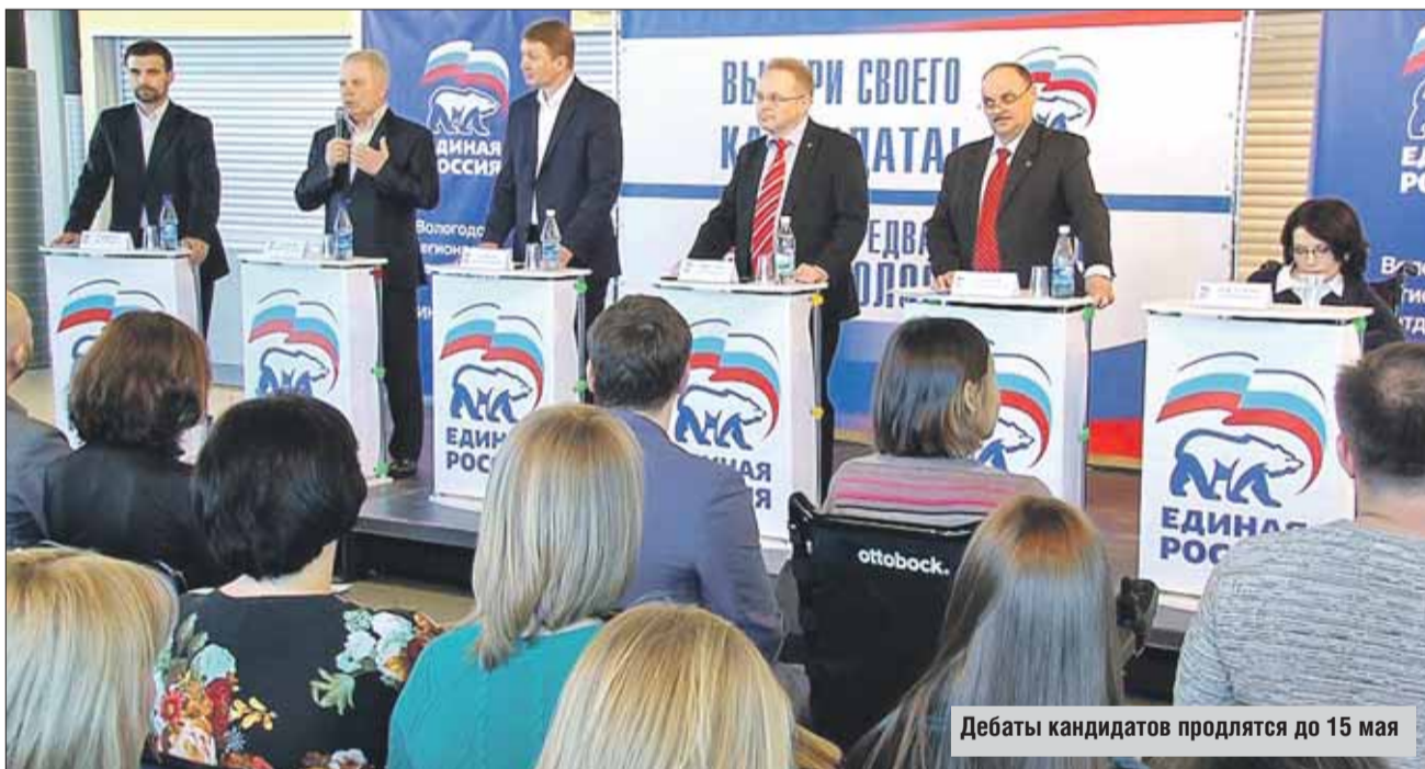
Дебаты кандидатов продлятся до 15 мая