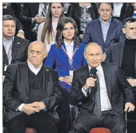
Во время медиафорума

более эффективными землепользователями являются крупные сельскохозяйственные предприятия, поэтому нужно внимание сосредоточить именно на них. А я, например, согласен с вами, что... это совсем не значит, что нужно нарушать права мелких и средних предпринимателей в этой области... Обязательно посмотрим на это, — резюмировал глава государства.