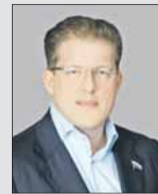
Антон Жарков, депутат Государственной думы

Работа Государственной думы — это сложный процесс, в котором задействовано большое количество специалистов. Каждому пленарному заседанию предшествует подготовительная работа, от качества которой напрямую зависит качество принимаемых парламентом законов. Кроме аппарата палаты, к этой работе привлекаются эксперты и представители общественности. К примеру, в рамках нашего Комитета по транспорту и строительству организован Экспертный совет по строительству, промышленности строительных материалов и проблемам долевого строительства, который возглавил опытный строитель Владимир Иосифович Ресин.