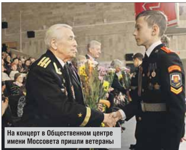
На концерт в Общественном центре имени Моссовета пришли ветераны

ском кладбище и у Вечно-го огня на площади Мухоморова.