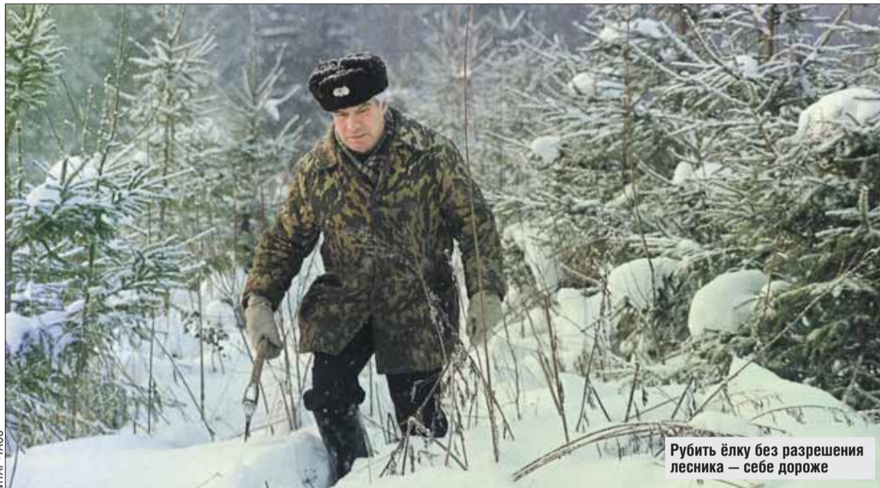
Рубить ёлку без разрешения лесника — себе дороже

Почти во всех районах ВАО 20 декабря открываются ёлочные базары