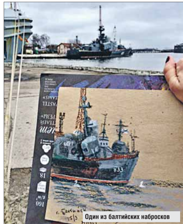
Один из балтийских набросков