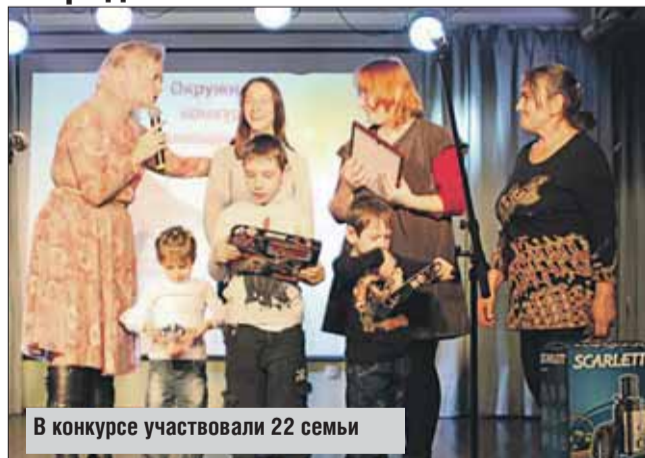
В конкурсе участвовали 22 семьи

Ежегодный конкурс замещающих семей округа «Наш тёплый дом» прошёл в центре социальной помощи семье и детям «Измайлово». В нём участвовали 22 семьи опекунов, попечителей, приёмных родителей, а также усыновившие детей.