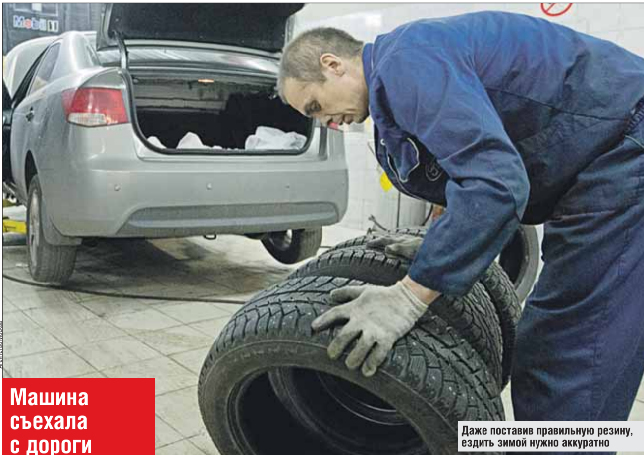
Даже поставив правильную резину, ездить зимой нужно аккуратно

— Износу подвержены любые шины: и летние, и зимние, и с шипами, и без. Судя по отзывам тех, кто