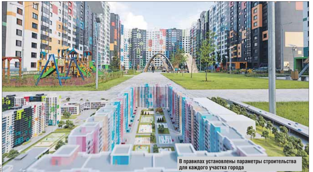
В правилах установлены параметры строительства для каждого участка города

Документ фиксирует текущее состояние городской среды, исключая возмож-