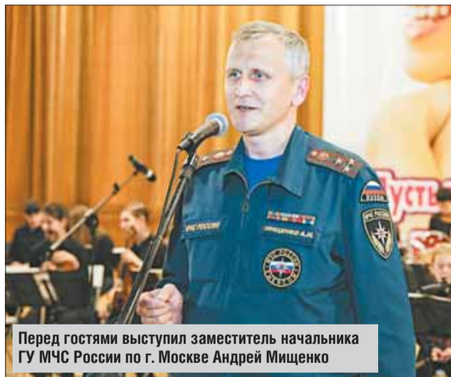
Перед гостями выступил заместитель начальника ГУ МЧС России по г. Москве Андрей Мищенко