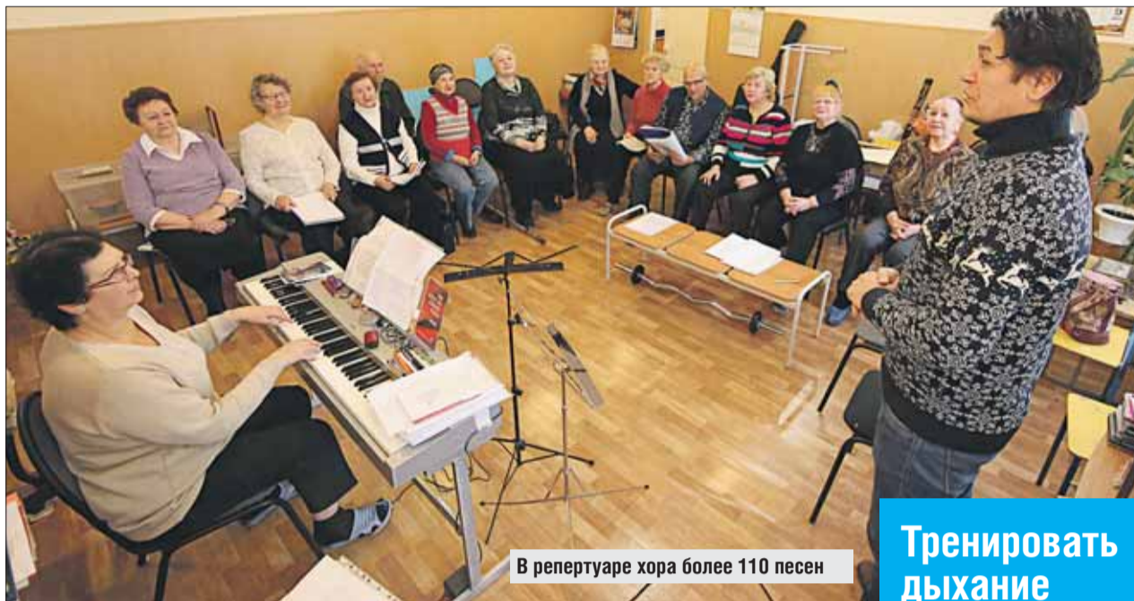
В репертуаре хора более 110 песен

— Наши хористы — дети войны, много пережившие и выстрадавшие. Их выступления никого не оставляют равнодушным. Так, на концерты приходят внуки наших солистов с друзьями, которые поначалу настроены скептически. Потом они про-