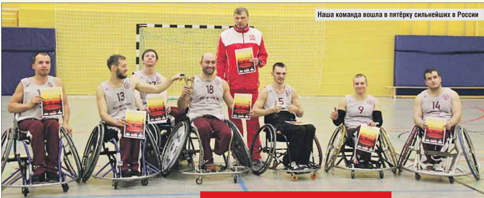
Наша команда вошла в пятёрку сильнейших в России

Паралимпийцы округа привезли золото из Берлина