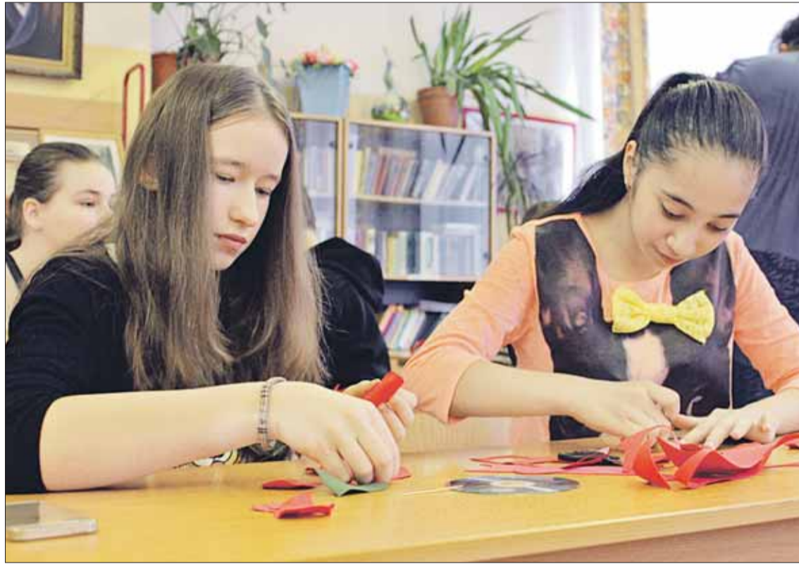
В мастер-классах участвовали и дети, и родители

— Фестиваль межрайонного совета директоров школ — это демонстрация наших результатов. Например, в прошлом году наши ребята стали победителями конкурса «Дети — детям» в номинации «3D-бум». Они сделали пособие для слепых детей,