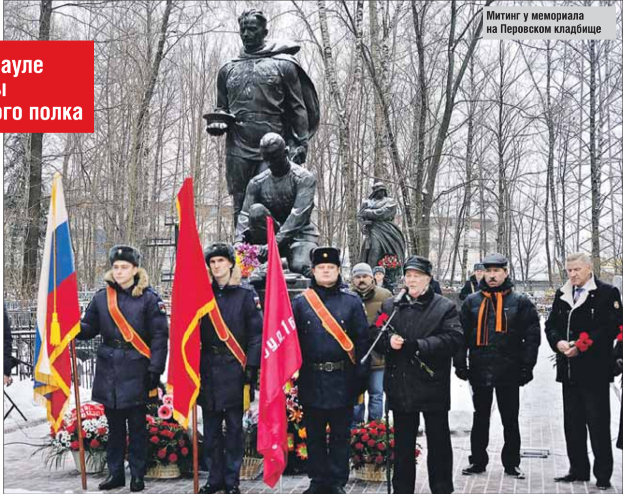
Митинг у мемориала на Перовском кладбище

В тот же день митинги прошли у памятника Маршалу Советского Союза Константину Рокоссовскому, у воинского мемориала на Перов-