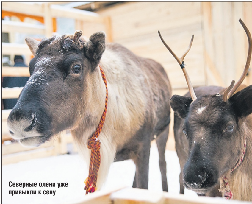
Северные олени уже привыкли к селу