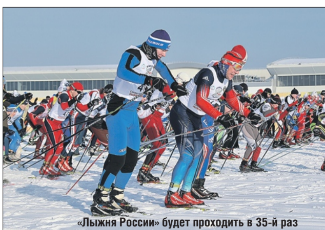
«Лыжня России» будет проходить в 35-й раз

В ВАО забег состоится 11 февраля на стадионе «Авангард» (ш. Энтузиастов, 33). Принять участие в гонке могут граждане России и иностранных