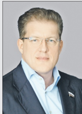
Антон Жарков, депутат Государственной думы

В конце прошлого года Государственная дума в первом чтении приняла правительственный законопроект об организации дорожного движения в Российской Федерации. Законопроект вызвал бурю дискуссий. Особый резонанс получили статьи, в которых говорится о платных парковках и праве местных властей вводить плату за въезд на определённые участки дорог.