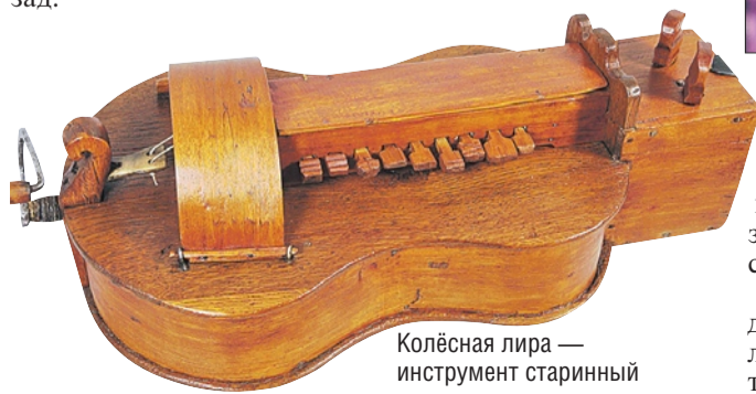
Колёсная лира — инструмент старинный