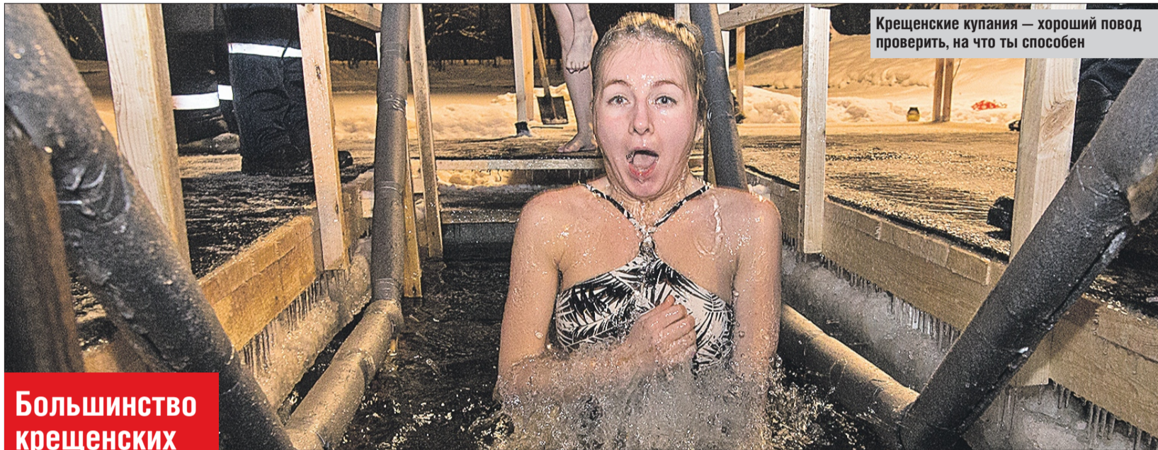
Крещенские купания — хороший повод проверить, на что ты способен

У самой полыньи возвышается крест из прозрачного льда. У его подножия мерцают лампы. Сама площадка возле пруда хорошо освещена, много полиции, медики стоят наготове. Тех, кто решил окунуться в ледяную купель, очень много. Возле тёплых раздевалок очередь — 150 человек. И люди продолжают прибывать. Про обстановку на купелях Майского пруда я узнала заранее: за событиями возле пруда можно было наблюдать на сайте парка «Сокольники» в режиме онлайн-трансляции, например посмотреть длину очереди или проследить за родственниками-пловцами. Очередь движется своим чередом, но замёрз-