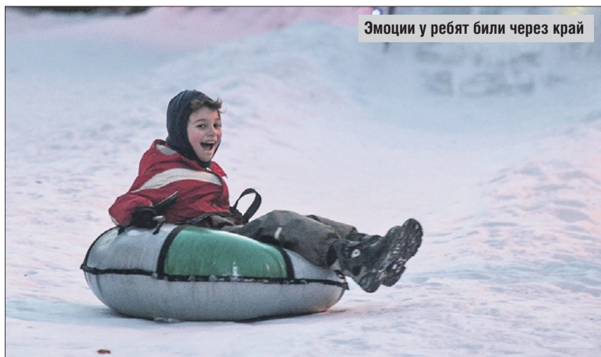
Эмоции у ребят били через край