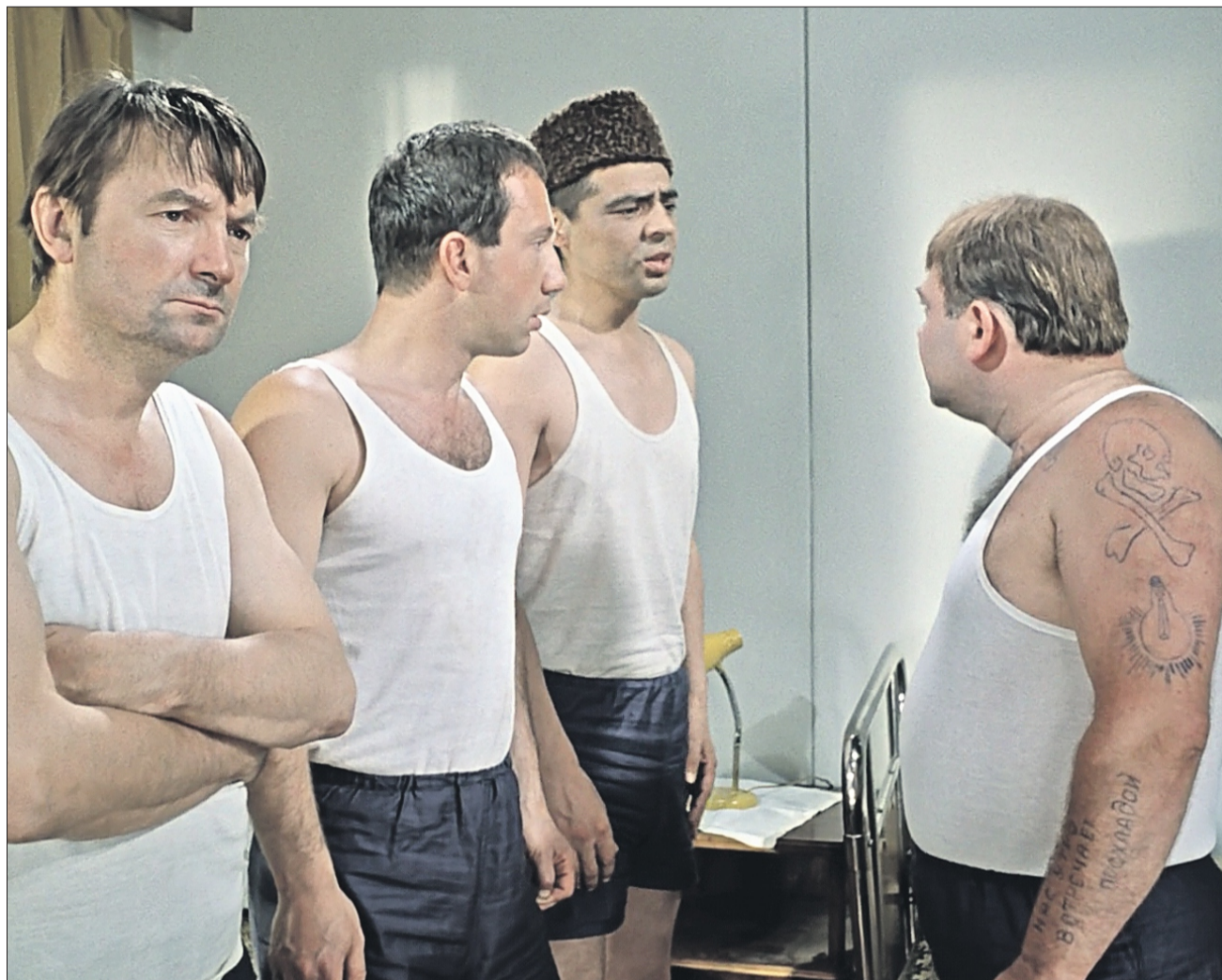
Писать сценарий «Джентльменов удачи» Данелия пригласил Викторю Токареву

— Сергей Владимирович был замечательной личностью, очень интересной. И познакомились мы тоже очень интересно. Когда я работала учительницей музыки, меня попросили позвать какого-нибудь детского поэта на встречу с детьми. Я стала звонить известным поэтам. Первым был Твардовский. Он не мог прийти по причине глубокого запоя. Потом я позвонила Светлову. Он не мог прийти по причине глубокого запоя. Кому бы я ни звонила, все они были либо в запое, либо не считали нужным прийти. Учительница звонит: «Боже мой, что делать?!» И тут Михалков, который меня не знал и первый раз слышал по телефону, сказал: «Позвоните мне в тот день в одиннадцать утра, напомните о встрече!» Я решила не будить так рано человека и позвонила в двенадцать. А он закричал в трубку: «Почему я вас жду целый час?» Короче говоря, он приехал в школу. Там дети все выстроились полукругом за спинами сидящих. Михалков уже выступал, как вдруг одна девочка с грохотом упала: ей стало плохо — по какой причине, я не знаю. Михалков говорит: «Что там происходит?» Я ему отвечаю: «Девочка упала». «Что, я буду гово-