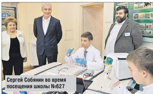
Сергей Собянин во время посещения школы №627

В своём недавнем исследовании международная консалтинговая компания KPMG отметила, что сейчас в школах Москвы используется большинство ключевых элементов «умного города» (smart city), характерных для наиболее