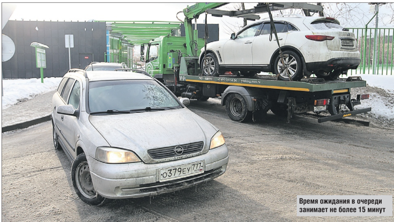
Время ожидания в очереди занимает не более 15 минут

Возврат автомобиля можно оформить на месте в любое время дня и ночи