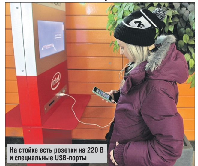
На стойке есть розетки на 220 В и специальные USB-порты

На 27 станциях столичного метрополитена появились специальные стойки для зарядки мобильных телефонов, планшетов и других гаджетов. Одна стойка появилась и в ВАО, в вестибюле станции метро «Новокосино». По сообщению пресс-службы Московского метрополитена, стойки оснащены розетками на 220 В и специальными USB-портами.