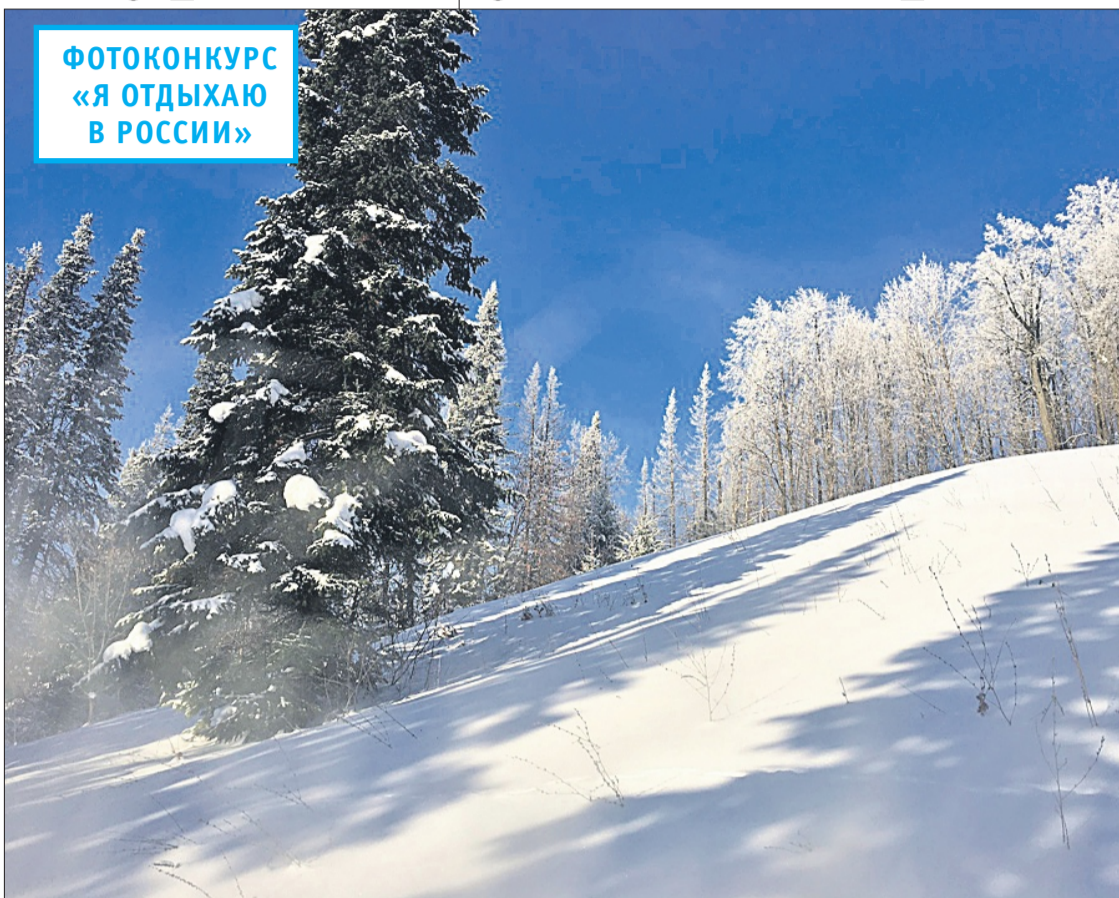
ФОТОКОНКУРС «Я ОТДЫХАЮ В РОССИИ»