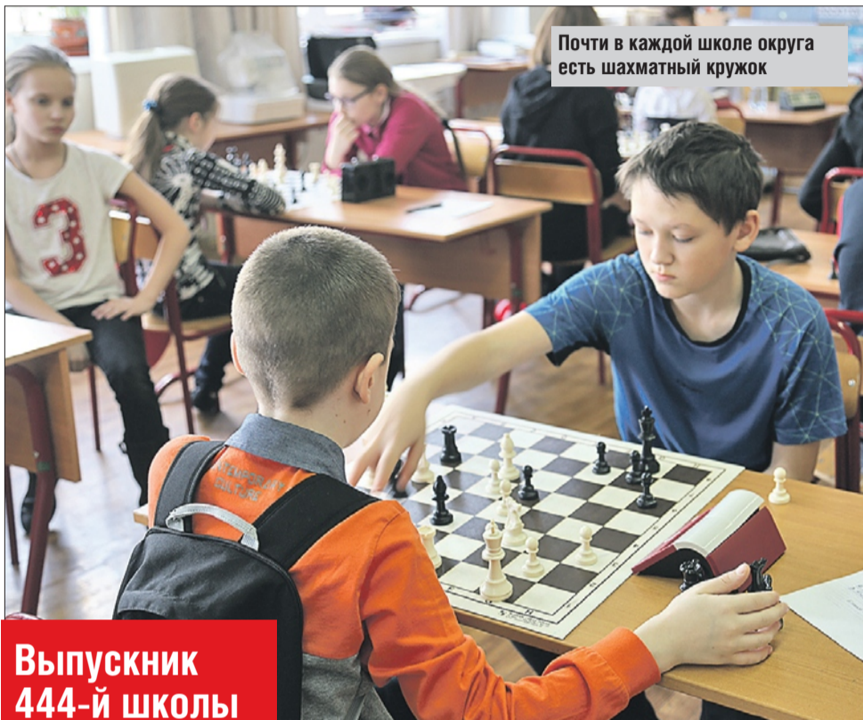
Почти в каждой школе округа есть шахматный кружок

Как в школах Восточного округа растят гроссмейстеров