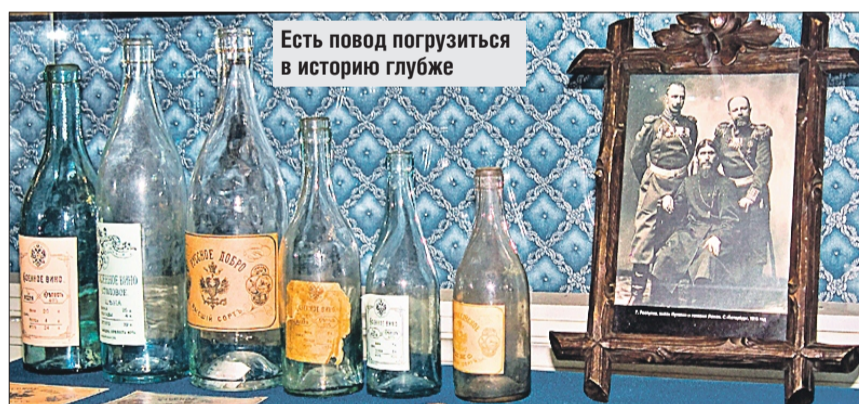
Есть повод погрузиться в историю глубже

Адрес: Измайловское ш., 73ж.