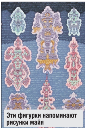
Эти фигурки напоминают рисунки майя