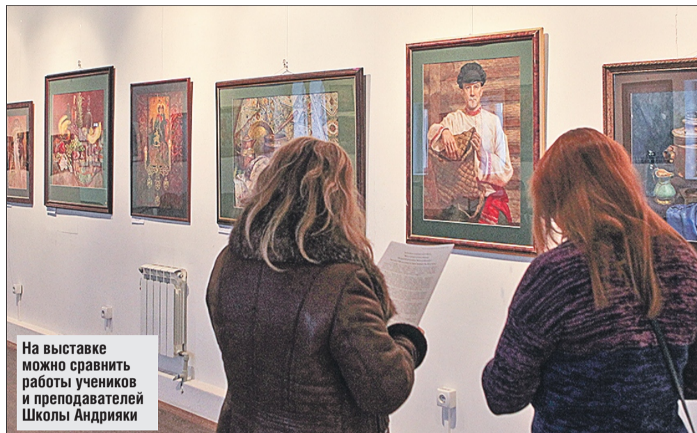
На выставке можно сравнить работы учеников и преподавателей Школы Андрияки

Выставка продлится до 9 апреля , цена билета — 100-150 рублей (льготный и полный)