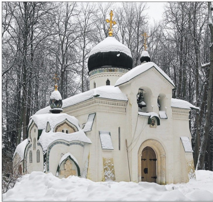
Церковь Спаса Нерукотворного в Хотькове сделана по проекту живописцев Васнецова и Поленова