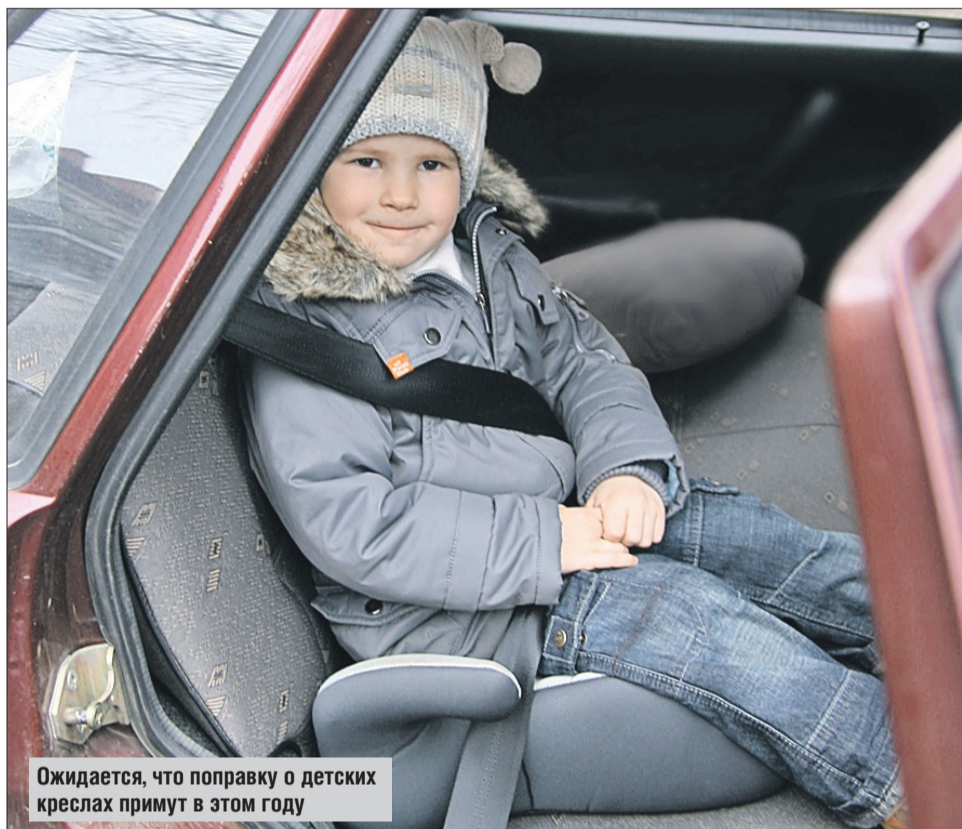
Ожидается, что поправку о детских креслах примут в этом году

В прошлом году стали известны коэффициенты, повышающие стоимость полиса ОСАГО для злостных нарушителей ПДД. Возможно, уже в ближайшее время они будут утверждены. Поправка предусматривает семь ступеней такой «злости». Для тех, кто совершит не менее пяти грубых нарушений за год,