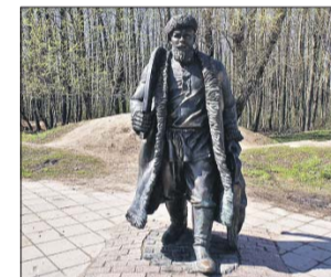
Памятник ямщику в Терлецком лесопарке