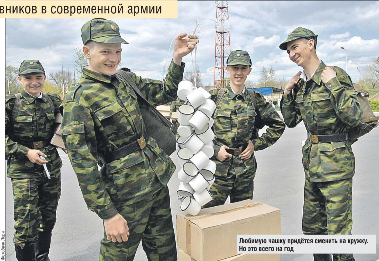
Любимую чашку придётся сменить на кружку. Но это всего на год

Чтобы составить себе полную картину изменений, мы поговорили с уважаемыми людьми нашего округа о том, как служилось бойцам в середине XX века, и о том, как служится сегодня нашим землякам.