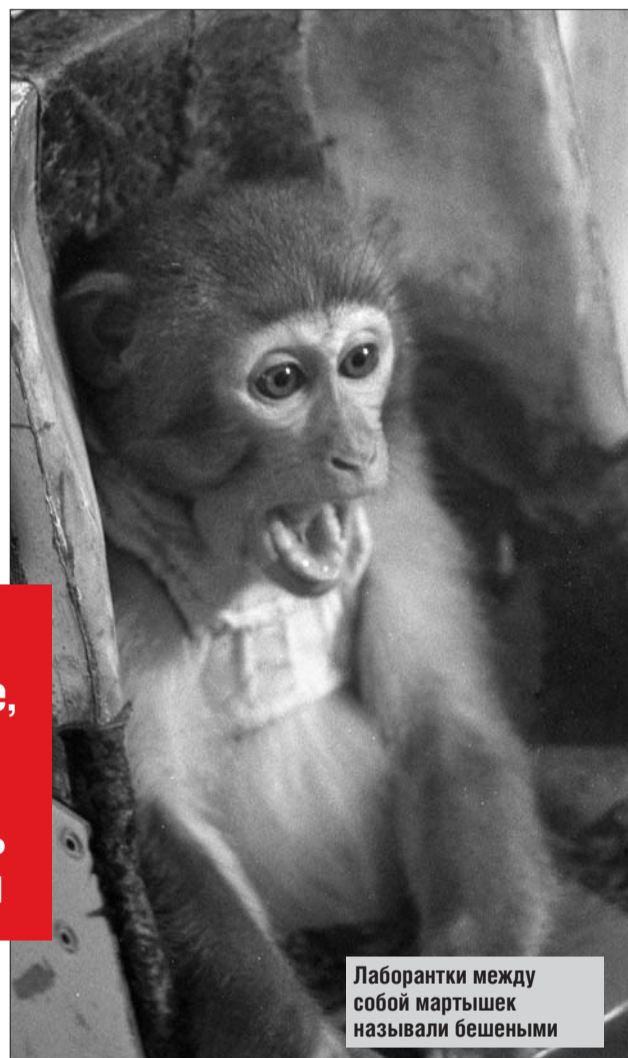
Лаборантки между собой мартышек называли бешеными

В общем, собаку ставят в деревянный бункер, участки тела — лапы, спину, голову — закрывают тем или иным защитным материалом и начинают облучать. Дозиметрист фиксирует дозу, приборы показывают, сколько рентген. Потом собаку отводят в вива-