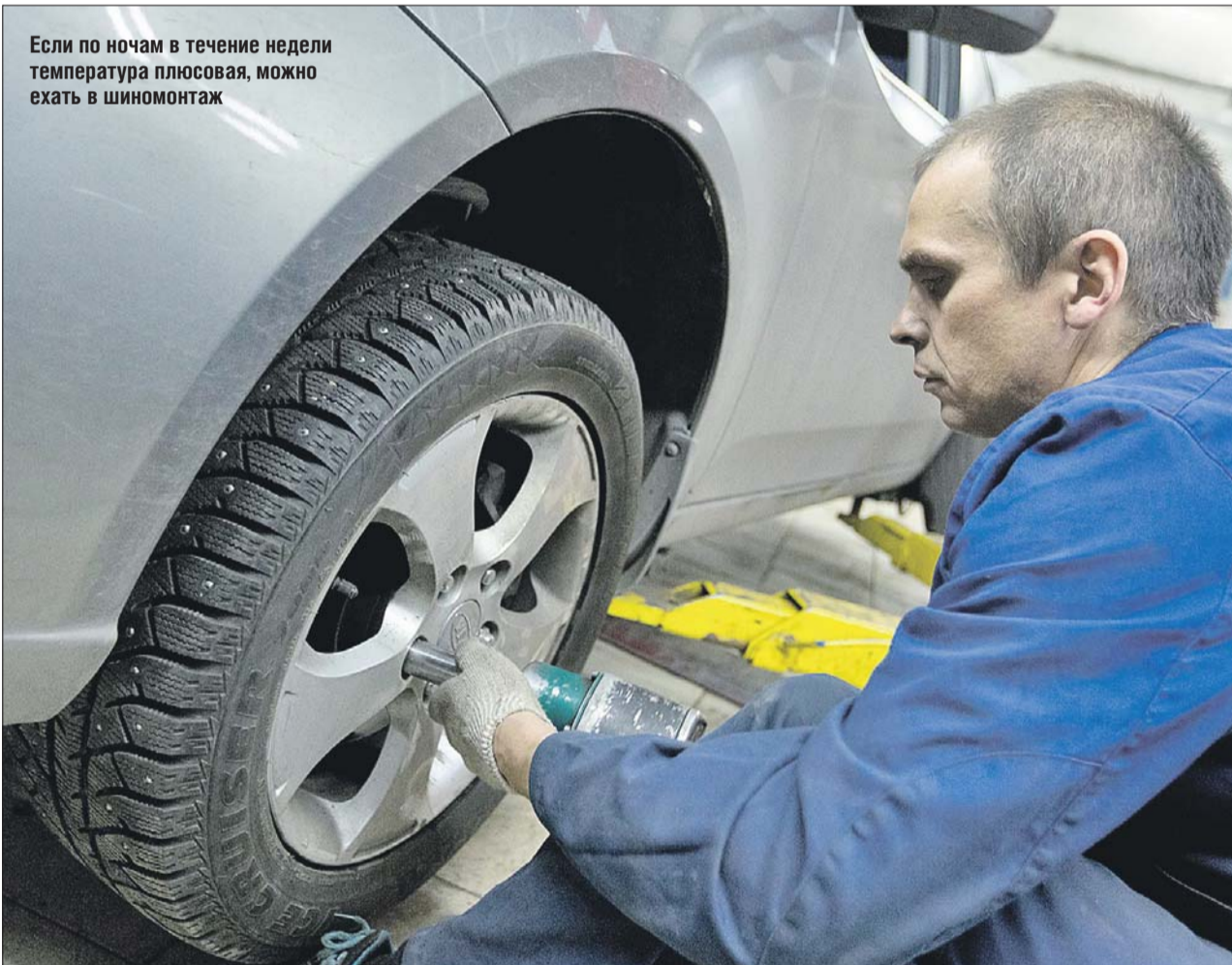
Если по ночам в течение недели температура плюсовая, можно ехать в шиномонтаж

Увы, не все придерживаются этих простых принципов. Морозной