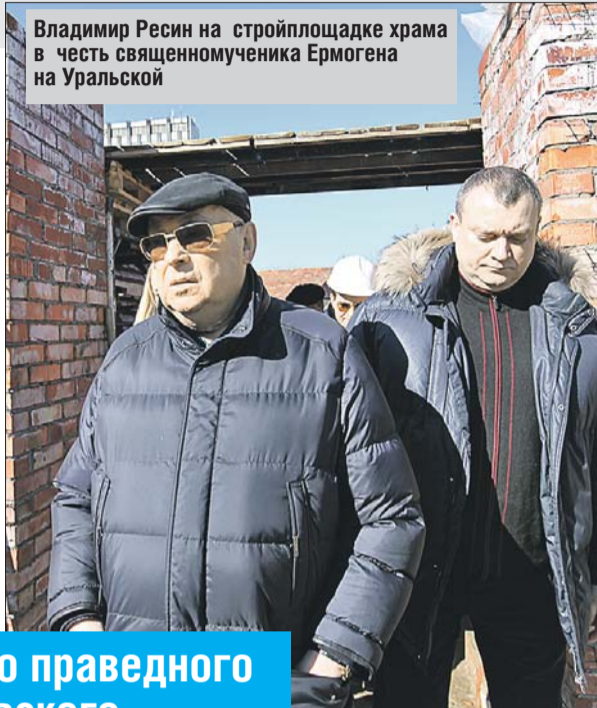
Владимир Ресин на стройплощадке храма в честь священномученика Ермогена на Уральской

храма, решили сделать не мраморный, а классический деревянный пятиярусный иконостас с басмой, золотом и серебром.