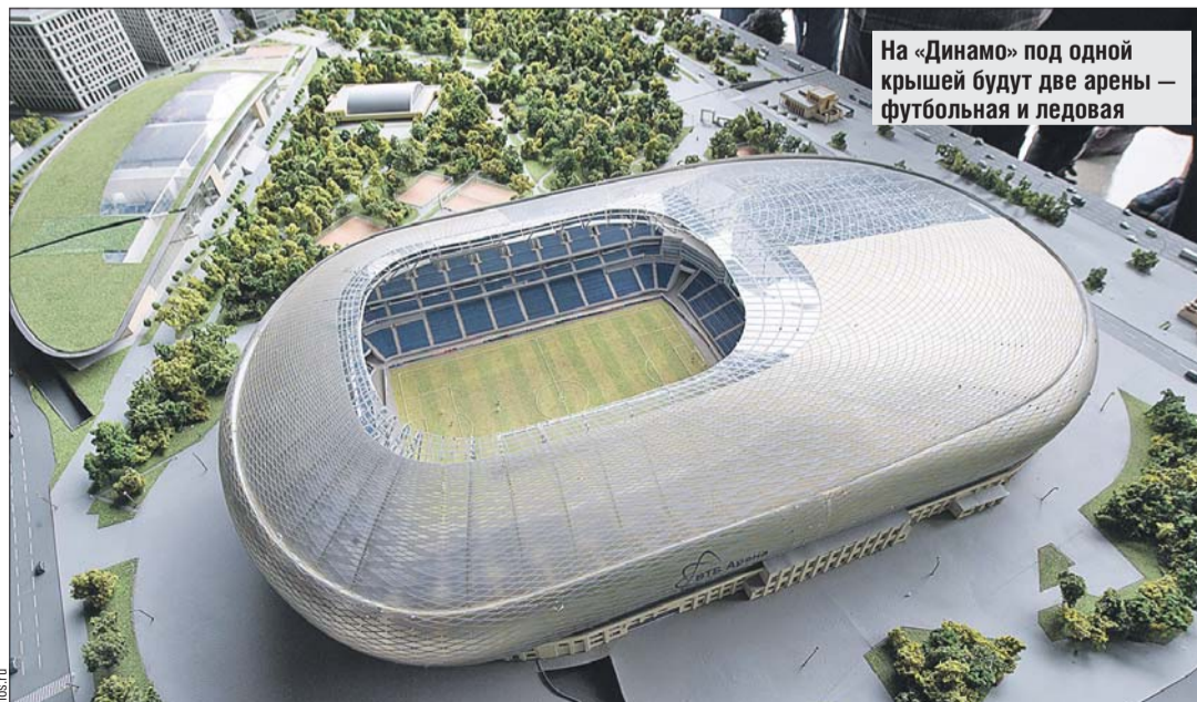
На «Динамо» под одной кровлей будут две арены — футбольная и ледовая