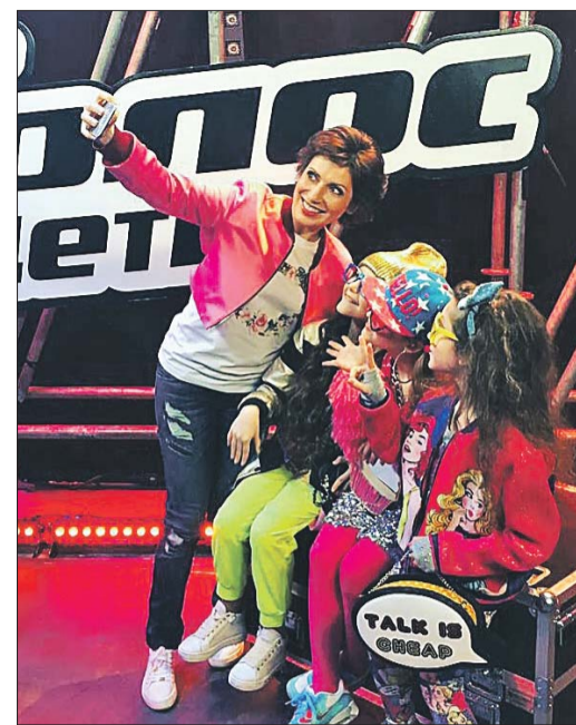
Светлана идёт на всякие ухищрения, чтобы раскрепостить детей

Бывают родители, которые хотят сделать из своих детей маленькие машины для шоу-бизнеса