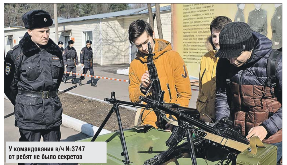
У командования в/ч №3747 от ребят не было секретов