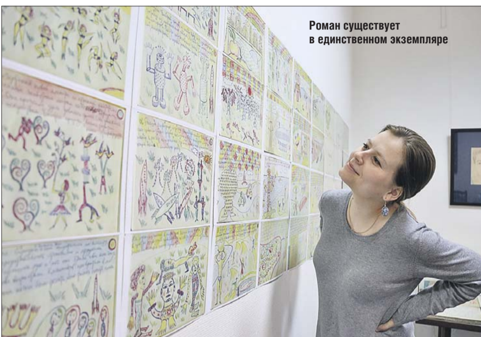
Роман существует в единственном экземпляре