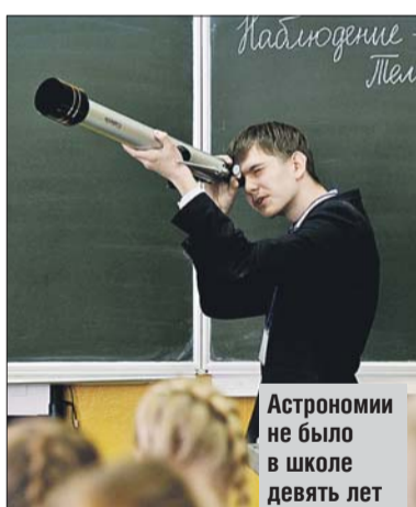
Астрономии не было в школе девять лет