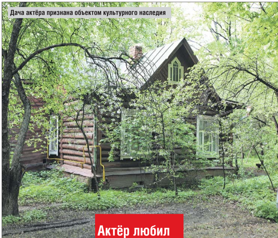
Дача актёра признана объектом культурного наследия

Речь идёт о старинном деревянном доме на ул. Алексея Дикого, 16, который довольно необычно выглядит по соседству с типовыми многоэтажками. На придомовом участке, огороженном забором, растут деревья, из-за чего дом напоминает чудом сохранившуюся в мегаполисе дачу. Впрочем, это и была дача народного артиста СССР Алексея Дикого (1889–1955). Большую часть жизни он отдал работе в театре. Его самые известные работы в кино — главные роли в фильмах «Кутузов» и «Адмирал Нахимов». Имея квартиру в Москве, Алексей Дикий любил отдыхать в Новогирееве летом, копясь