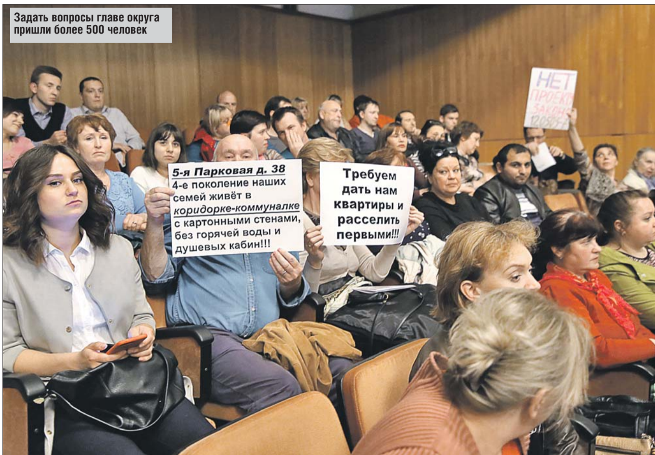
Задать вопросы главе округа пришли более 500 человек

— В нашем округе целые кварталы застроены пятиэтажными домами, так называемыми хрущёвками. Они свой срок службы почти «выжили», и задача власти — не допустить дальнейшего ветшания и массового превращения их в аварийное жильё, — прокомментировал выступление своего заместителя Ти-