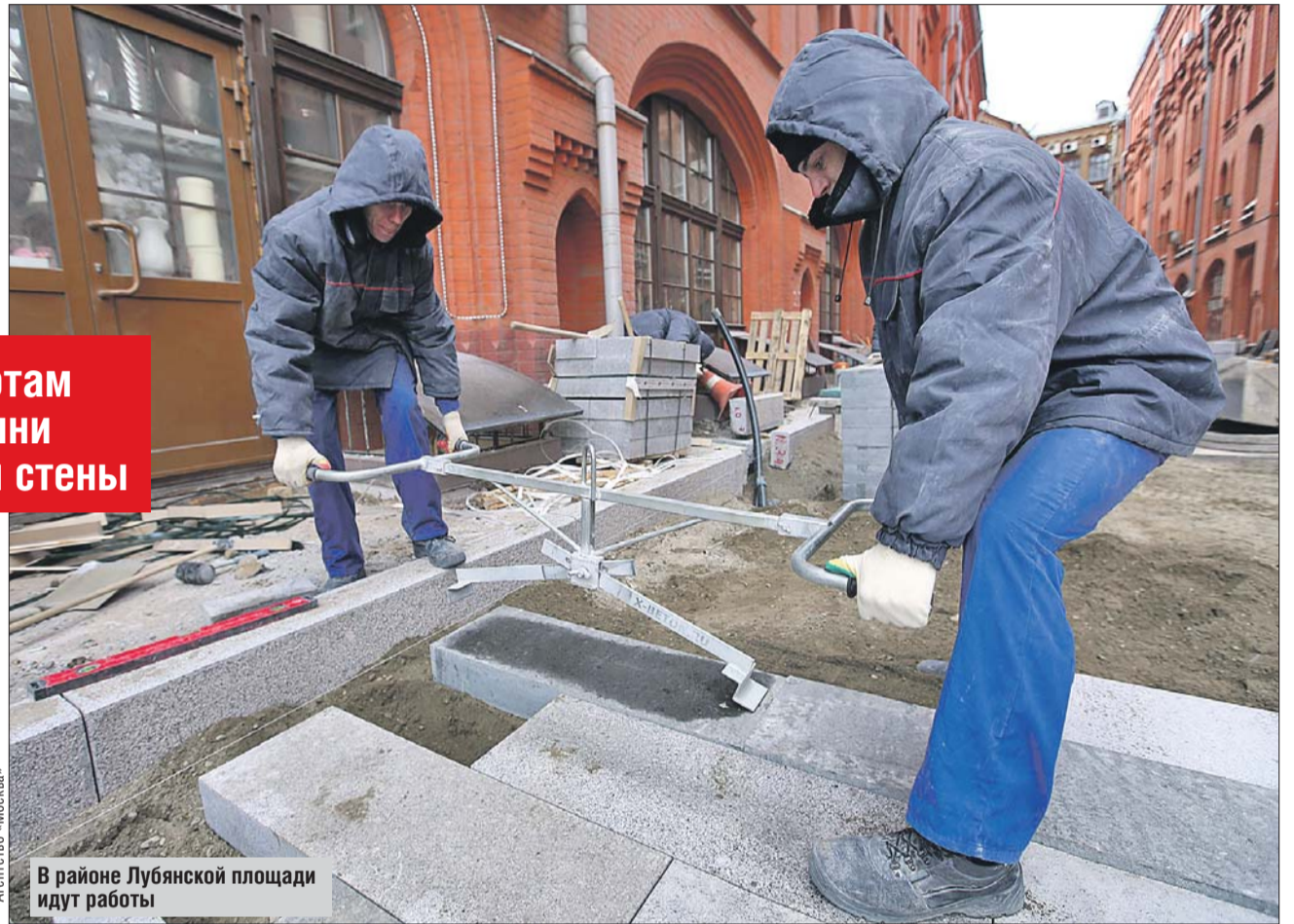
В районе Лубянской площади идут работы

Во время ремонта водопровода на Славянской площади археологи на глубине 2 метров нашли фрагменты белокаменно-