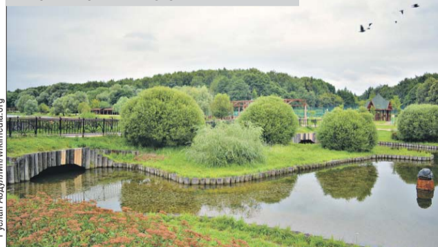
В парке «Терлецкая дубрава»

чены москвичами в проекте «Активный гражданин». Горожане высказали мнение о том, какие именно элементы благоустройства хотят видеть в парках. Их пожелания были учтены городскими властями.