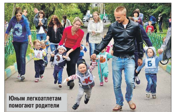
Юным легкоатлетам помогают родители