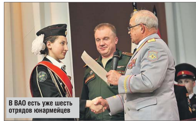
В ВАО есть уже шесть отрядов юнармейцев

Первый слёт юнармейцев Восточного округа прошёл 17 мая в гимназии №2072 в Перове. Всего в ВАО уже сформированы шесть отрядов, в рядах которых состоят 174 человека.