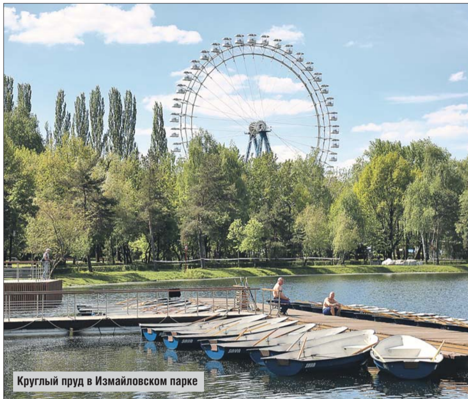
Круглый пруд в Измайловском парке