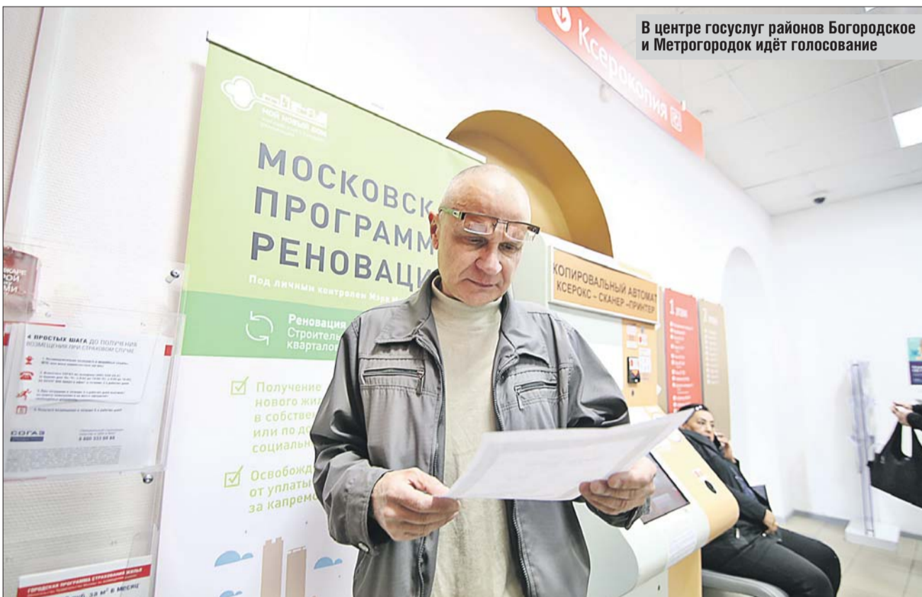
В центре госуслуг районов Богородское и Метрогородок идёт голосование

В столице идёт голосование по программе реновации