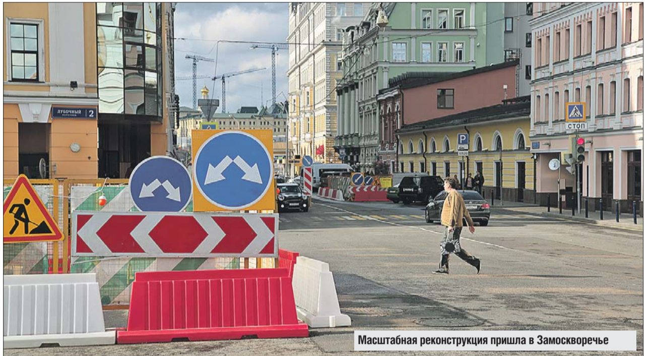
Масштабная реконструкция пришла в Замоскворечье

С Лужкова моста на набережную перенесут знаменитые «деревья любви» — скульптуры, на которые новобрачные вешают памятные замочки. К 20 имеющимся деревьям добавят ещё восемь