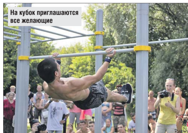
На кубок приглашаются все желающие