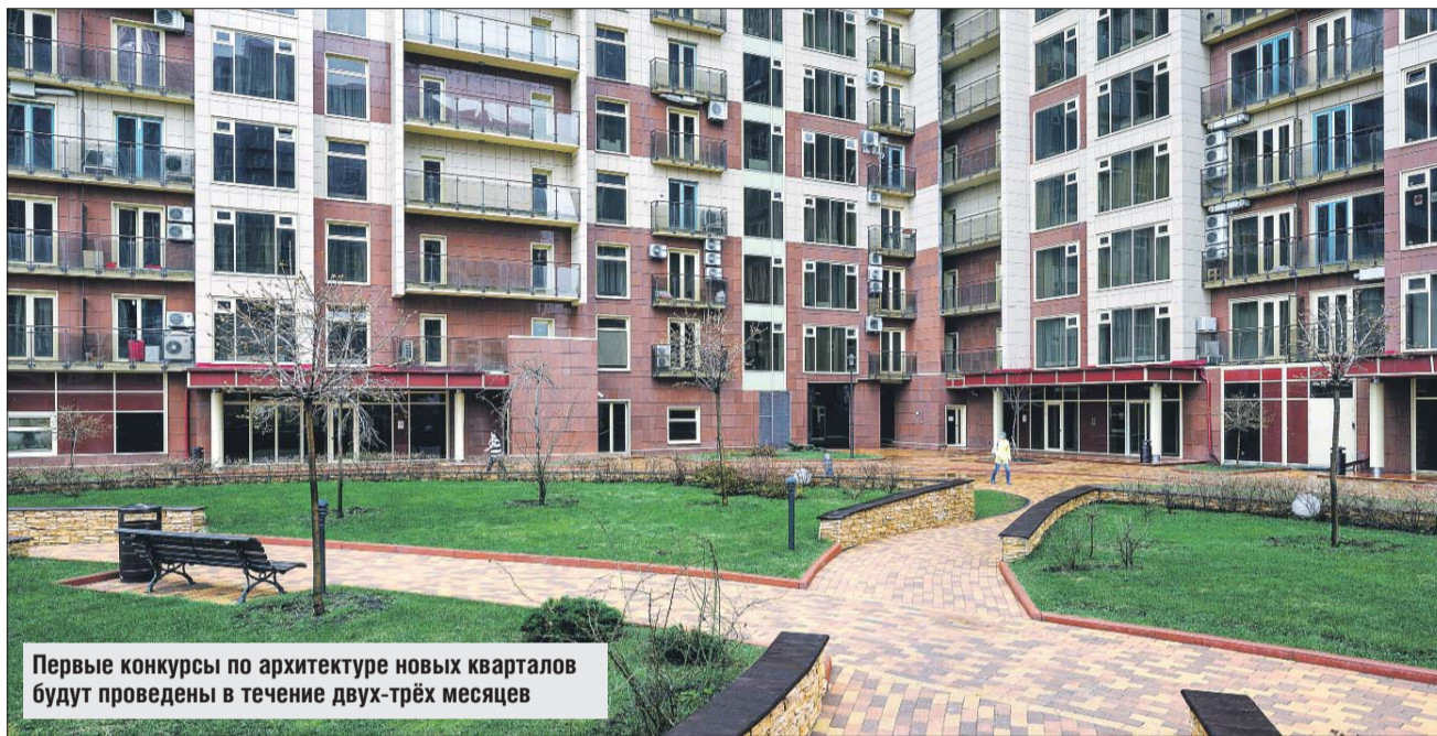
Первые конкурсы по архитектуре новых кварталов будут проведены в течение двух-трёх месяцев

лению любой территории позволит поэтапно преобразовать её в более комфортную, многофункциональную среду с сохранением деревьев и созданием новых парковых территорий.