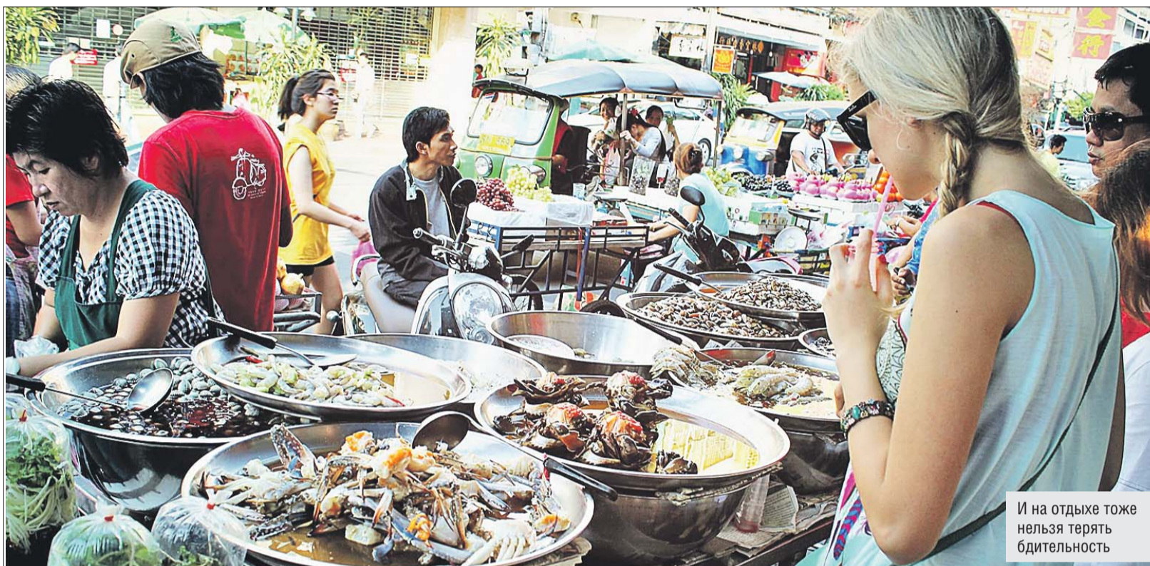
И на отдыхе тоже нельзя терять бдительность

Что следует иметь в виду, отправляясь на отдых в Тунис и в Таиланд