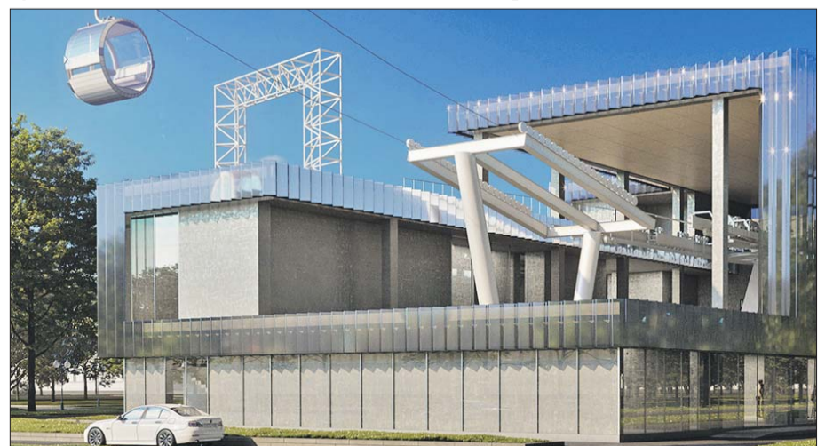
Канатку планируют запустить к чемпионату мира по футболу