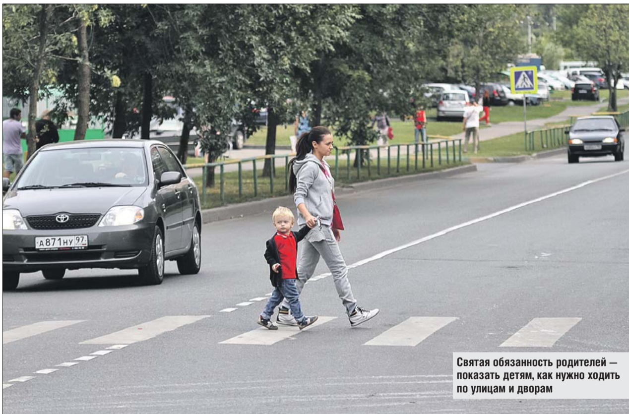
Святая обязанность родителей — показать детям, как нужно ходить по улицам и дворам

◆ Вывод: усвойте сами и объясните детям, что крупногабаритный транспорт — грузовики, автобусы — требует особого внимания. Его водители могут не видеть, что происходит возле самой машины, кроме того, она может закрыть обзор другим водителям, едущим по соседним рядам. Лучше всего подождать, пока большая машина проедет.