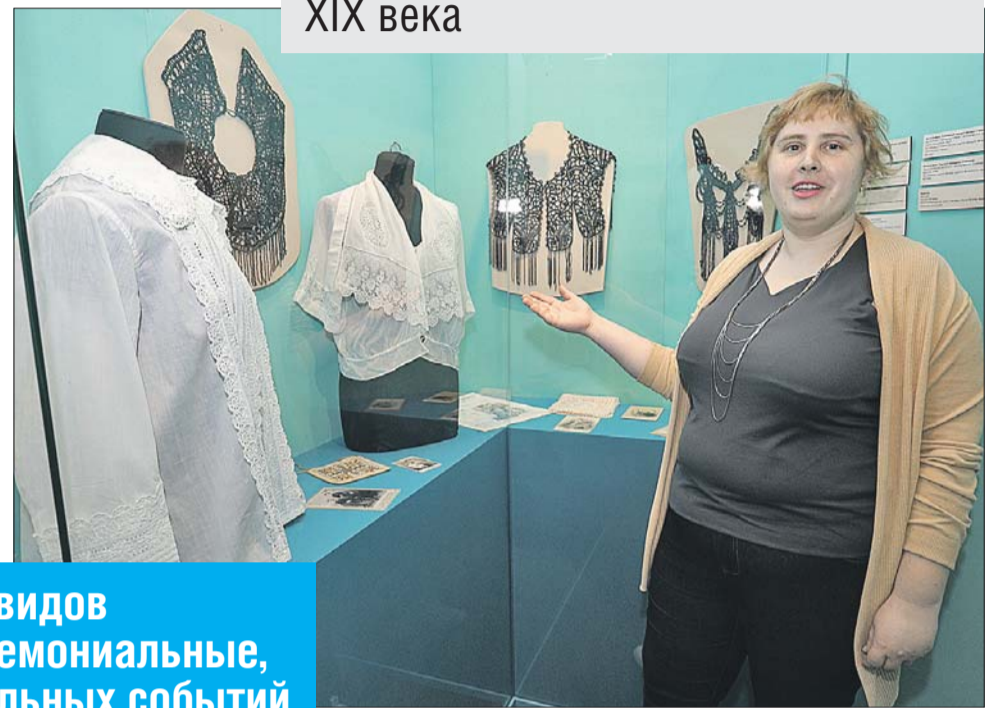
От многих видов женской одежды остались одни названия

ные на праздники, тягостные по случаю печальных событий и от нечего делать. Кроме того, для похода в гости отводились определённые часы. Пренебречь правилами мог, пожалуй,