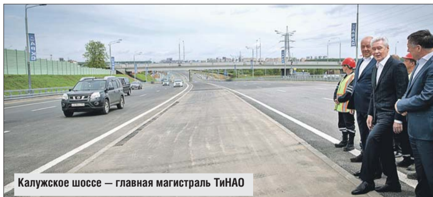
Калужское шоссе — главная магистраль ТиНАО

Мэр Москвы Сергей Собянин объявил о завершении первого этапа реконструкции Калужского шоссе, открывая движение по участку от МКАД до деревни Сосенки.