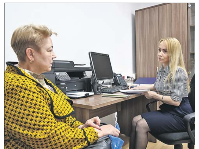
Юристы стараются помочь людям разобраться в предложениях властей

— Мы живём на улице Короленко, в трёх соседних домах 1961 года постройки. Очень хотим в программу, но нас в списке на голосование не включили, — рассказывает одна из посетительниц. — Пришли сюда, чтобы получить грамотные пояснения, как оформить протокол собрания.