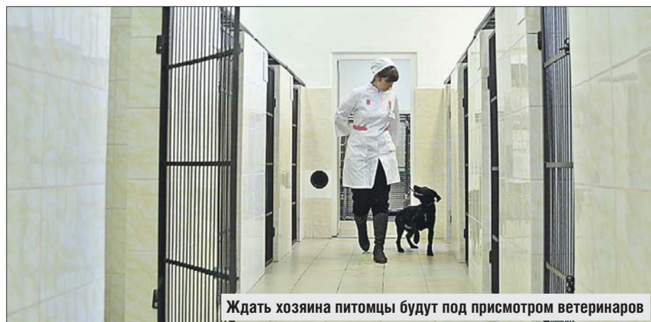
Ждать хозяина питомцы будут под присмотром ветеринаров

◆ ГБУ «Мосветстанция»: ул. Юннатов, 16а, тел.: (495) 612-1212, (495) 612-7421, круглосуточно, без выходных