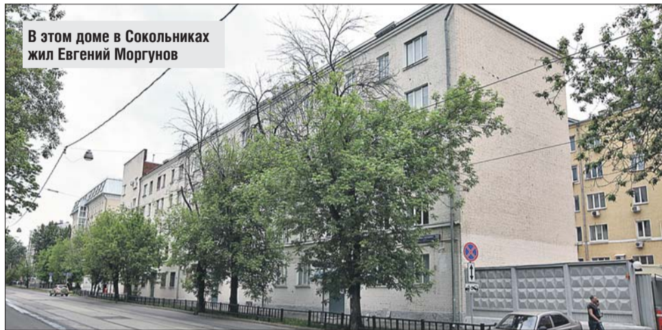
В этом доме в Сокольниках жил Евгений Моргунов