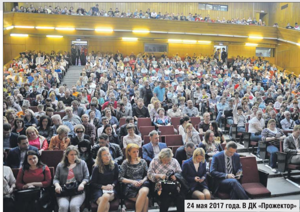
24 мая 2017 года. В ДК «Прожектор»

Большое количество вопросов касалось процедуры голосования по проекту программы реновации, которая сейчас идёт в столице. Так, житель района Перово спросил префекта, может ли принять уча-