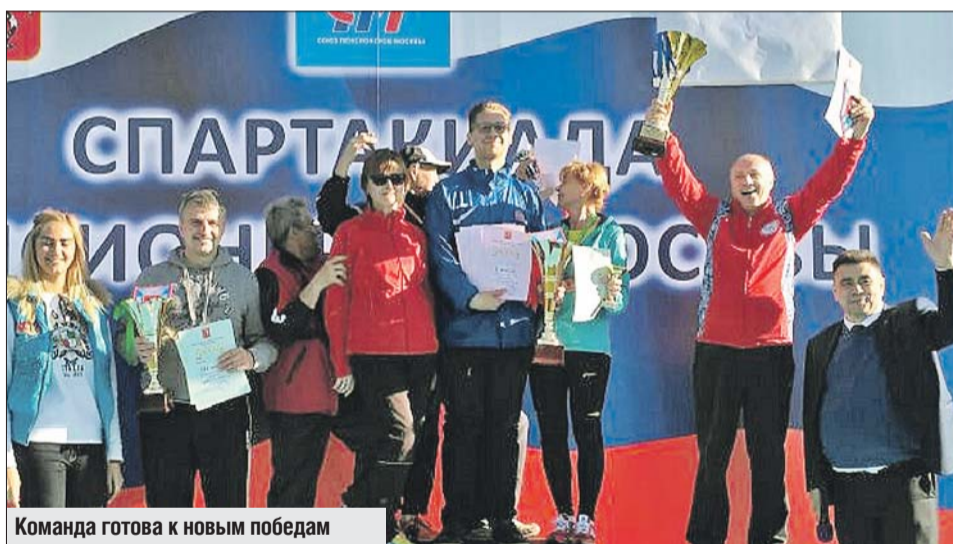
Команда готова к новым победам