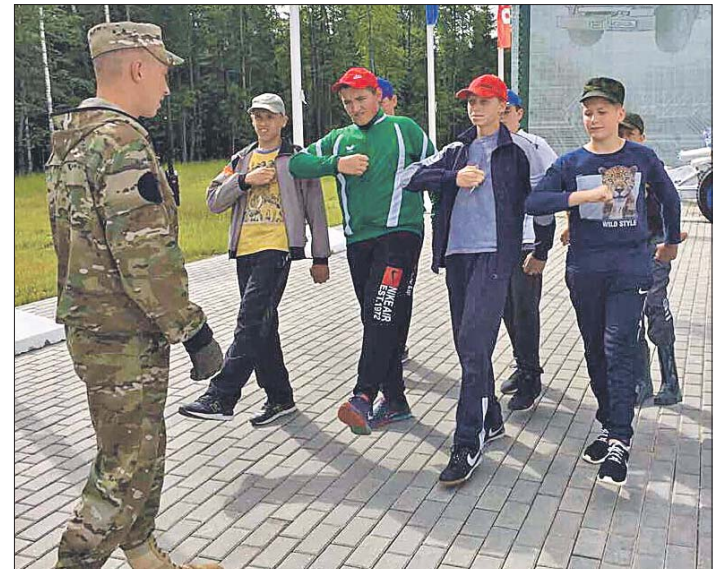
Строевая подготовка — это, конечно, скучно, но без неё нет армии