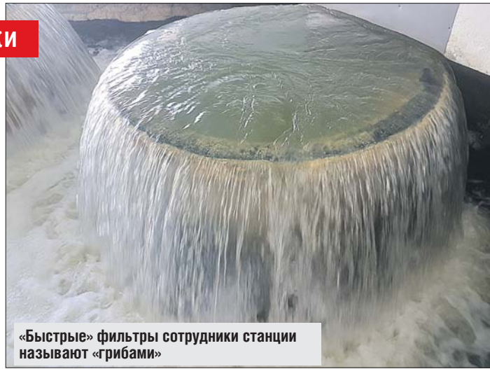
«Быстрые» фильтры сотрудники станции называют «грибами»

Станции водоподготовки в районе Восточный исполнилось 80 лет