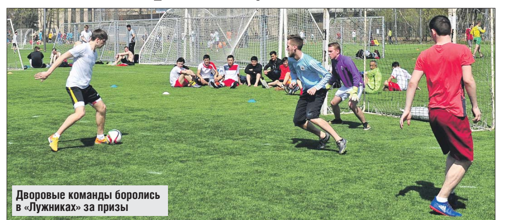
Дворовые команды боролись в «Лужниках» за призы