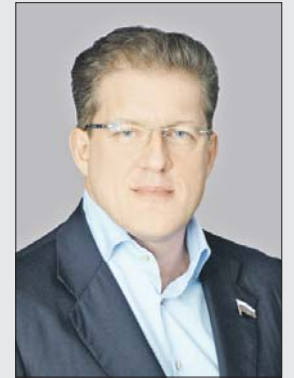
Антон Жарков, депутат Государственной думы от Восточного округа

1 августа президиум Правительства Москвы утвердил программу реновации, и сразу же были опубликованы списки домов, вошедших в программу. Само собой, наш округ занял 1-е место по числу сносимых домов. И это было ожидаемо, поскольку по итогам наших встреч с жителями было ясно, что подавляющее большинство высказывалось в поддержку программы реновации.