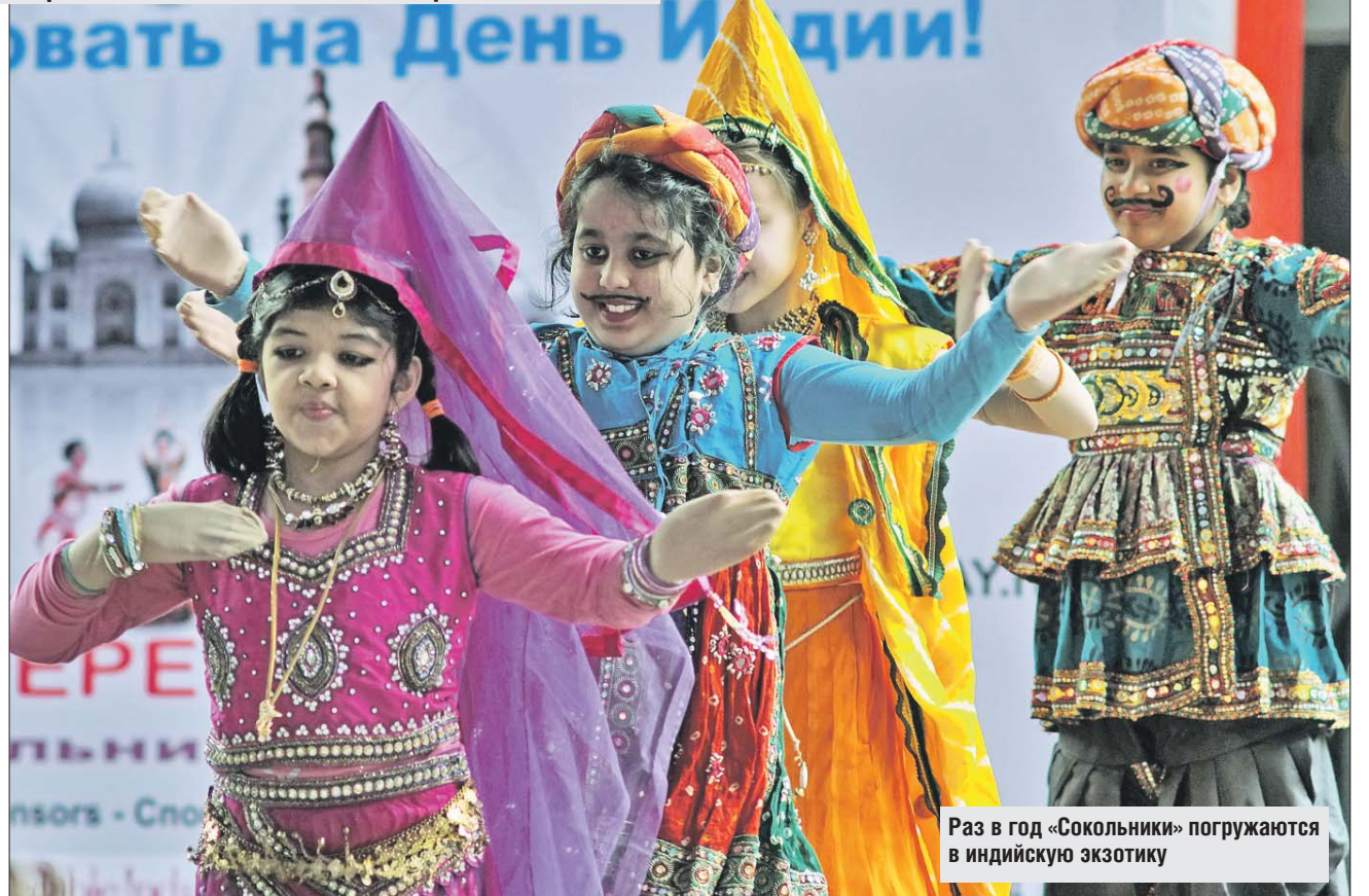
Раз в год «Сокольники» погружаются в индийскую экзотику