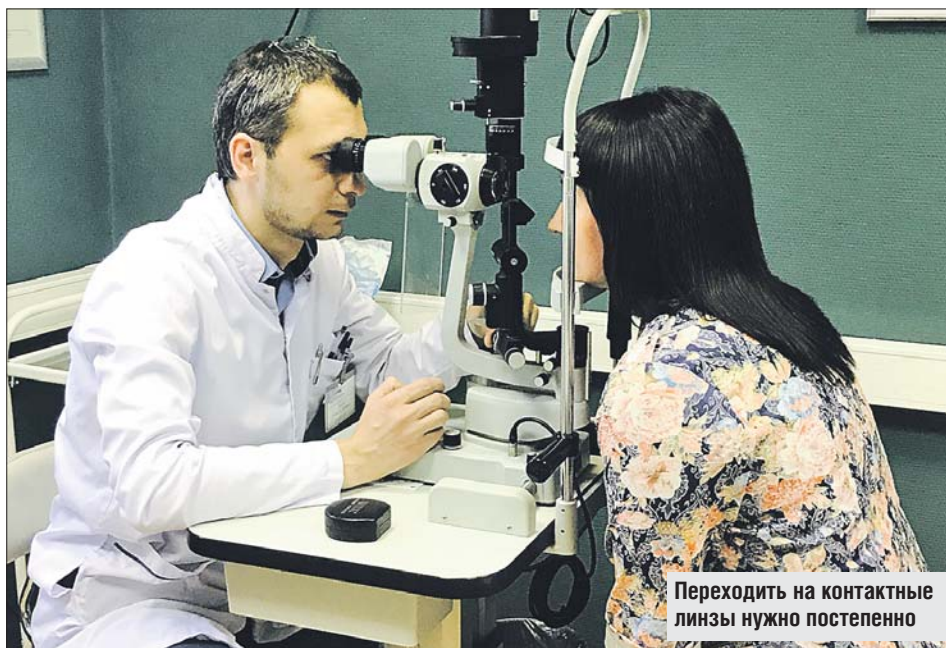
Переходить на контактные линзы нужно постепенно

Однодневные линзы просты в применении и нет необходимости в дополни-