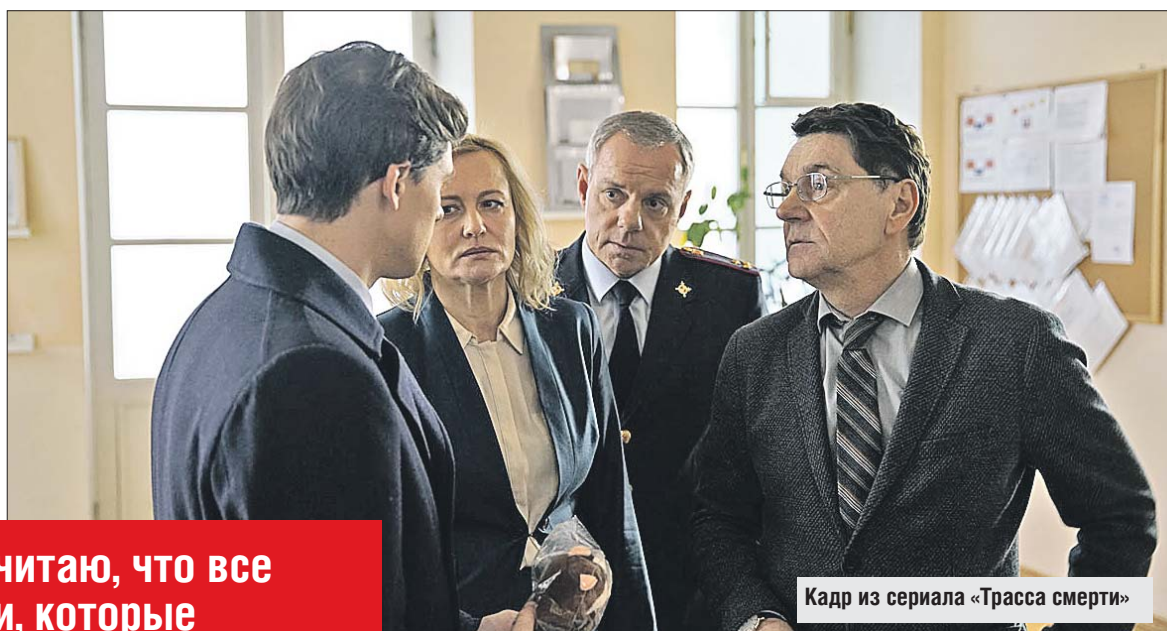
Кадр из сериала «Трасса смерти»

Не считаю, что все люди, которые отказываются от своих детей, подонки