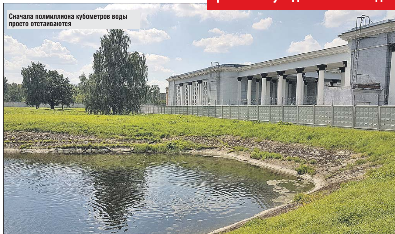
Сначала полмиллиона кубометров воды просто отстаиваются

Коагулянты, попадая в воду, захватывают грязь и вредные примеси и уходят с ними на дно