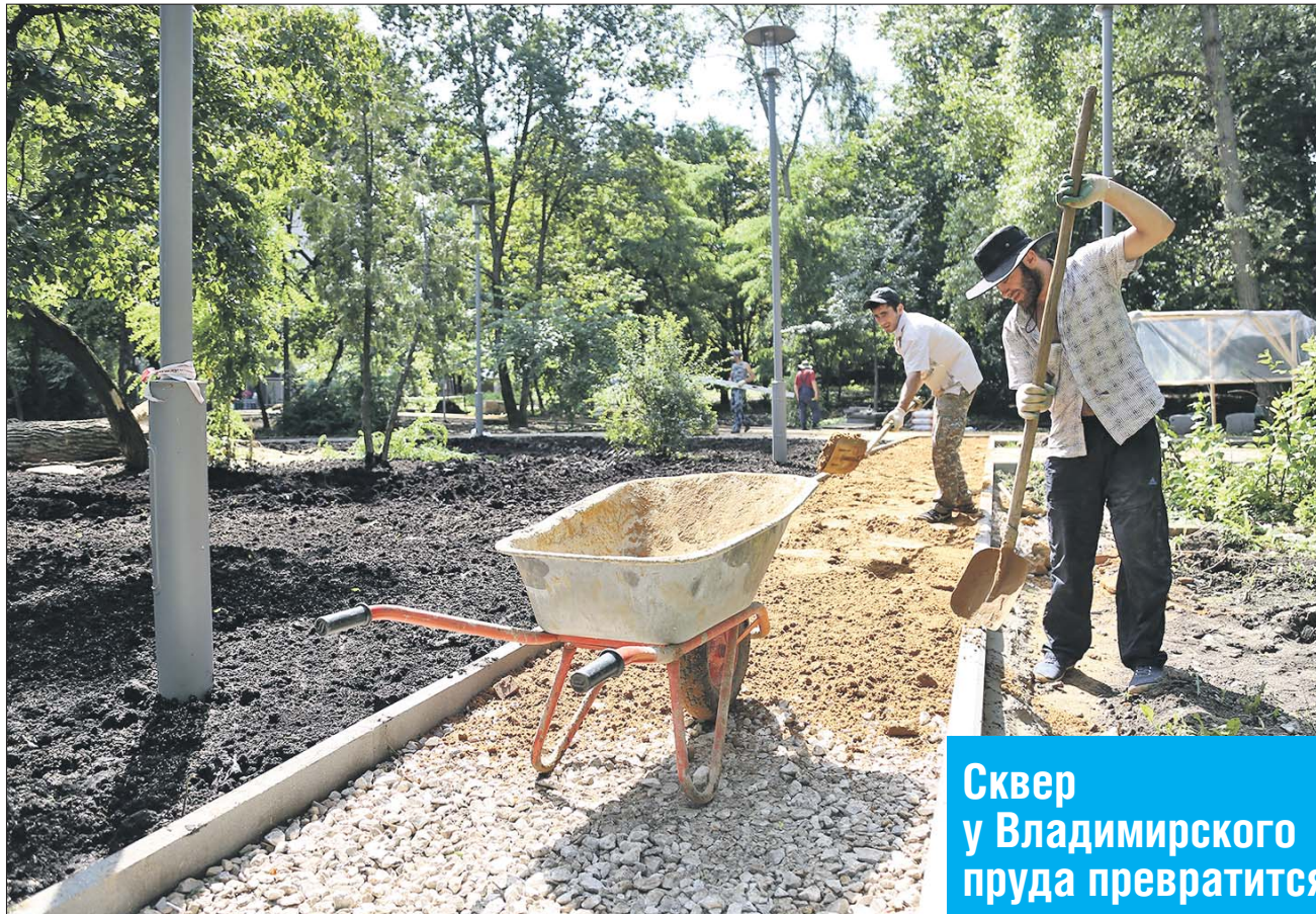
Сквер у Владимирского пруда превратится в уютную зону отдыха

В Восточном округе благоустраивают новые зоны отдыха