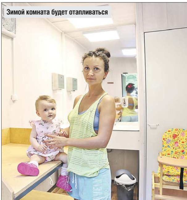
Зимой комната будет отапливаться

Комната матери и ребёнка открылась недавно в Перовском парке культуры и отдыха. Она расположена рядом с детским клубом «Крошка Енот».