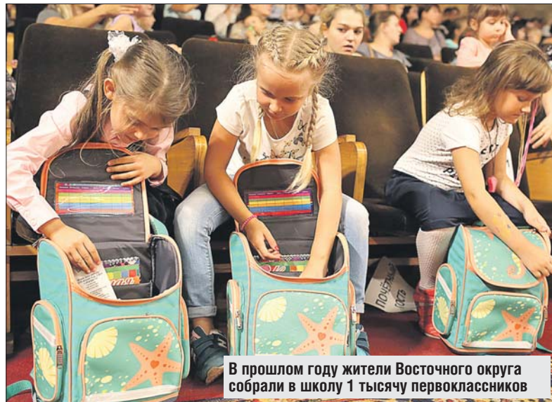
В прошлом году жители Восточного округа собрали в школу 1 тысячу первоклассников