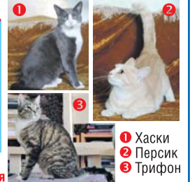
1 Хаски 2 Персик 3 Трифон