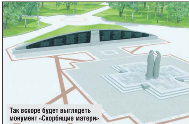
Так вскоре будет выглядеть монумент «Скорбящие матери»