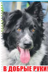
В ДОБРЫЕ РУКИ!