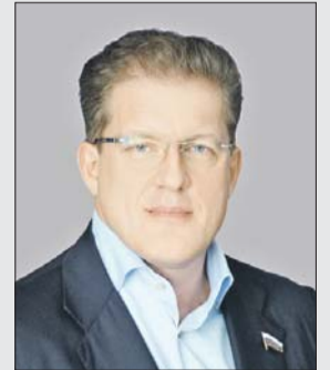
Антон Жарков, депутат Государственной думы от Восточного округа

Закон о фонде долевого строительства разрабатывался вместе с дольщиками