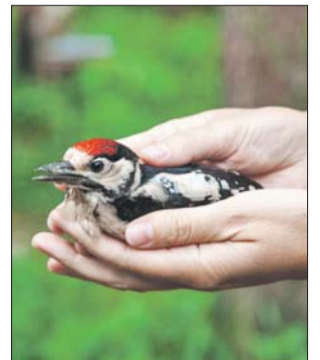
Одна из спасённых в орнитарии птиц

Свой четвёртый день рождения отметил в минувший уик-энд орнитарий в Сокольниках. В честь этого для орнитария был куплен брудер — своего рода реанимация для птиц. Деньги на аппарат собирали через пожертвования.