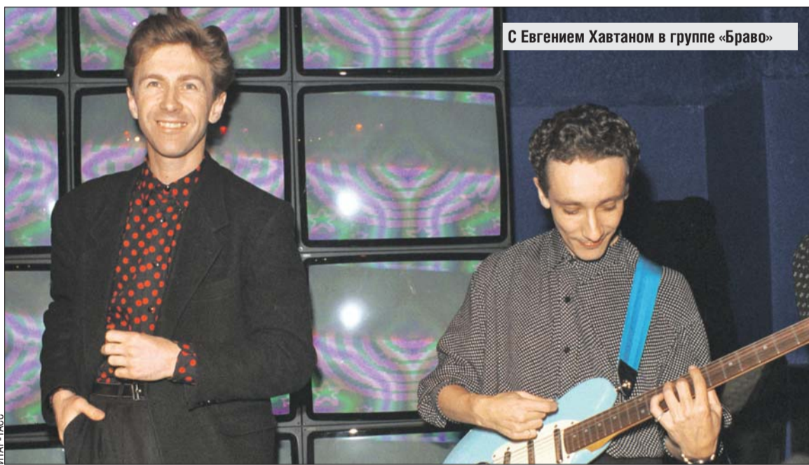
С Евгением Хавтаном в группе «Браво»