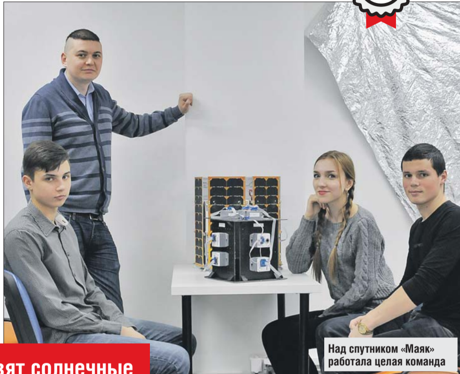
Над спутником «Маяк» работала целая команда

А кроме того, они выступают в роли аэродинамического тормозного устройства — способствуют постепенному сбросу скорости, благодаря чему спутник будет летать во-