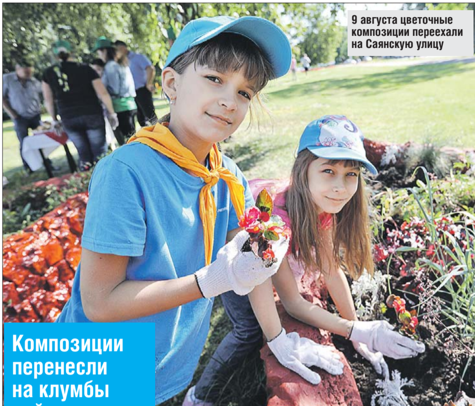
9 августа цветочные композиции переехали на Саянскую улицу

— В конкурсе на лучший цветник приняли участие жители всех районов Восточного округа, — отметили в префектуре ВАО. — Конкурсанты получили памятные подарки, был разыгран