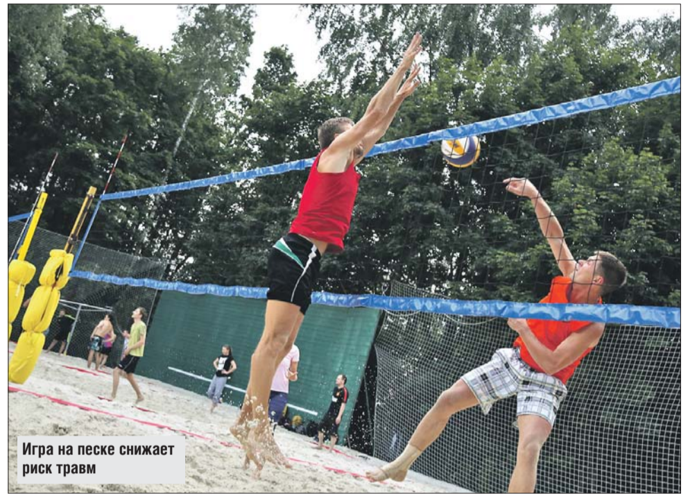
Игра на песке снижает риск травм

В минимальной степени, потому что противников разделяет сетка, физического контакта между ними нет. А ещё в пляж-