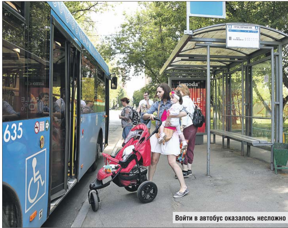
Войти в автобус оказалось несложно