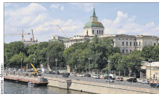
На набережной много уникальных памятников архитектуры