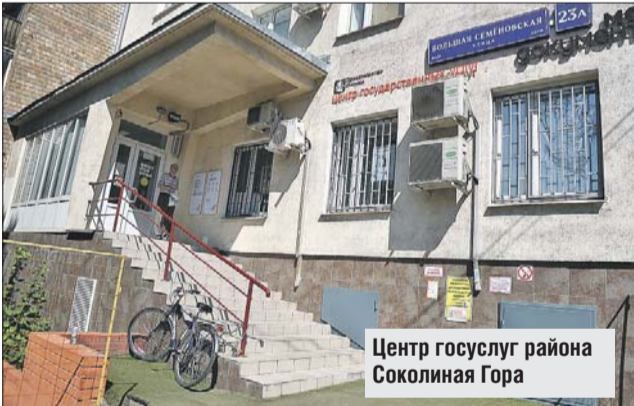
Центр госуслуг района Соколиная Гора

Стало проще оформить документы москвичам при смене места жительства или приобретении жилья. В ряде столичных центров госуслуг теперь можно заказать необходимые документы в этих ситуациях в одном окне единым пакетом.