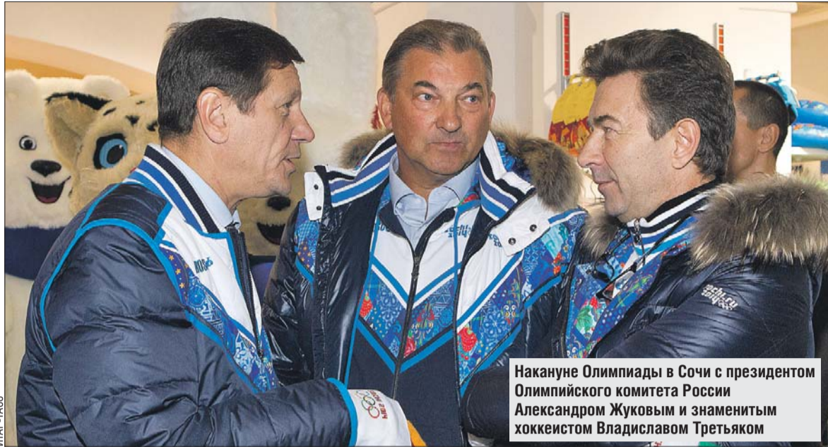
Накануне Олимпиады в Сочи с президентом Олимпийского комитета России Александром Жуковым и знаменитым хоккеистом Владиславом Третьяком