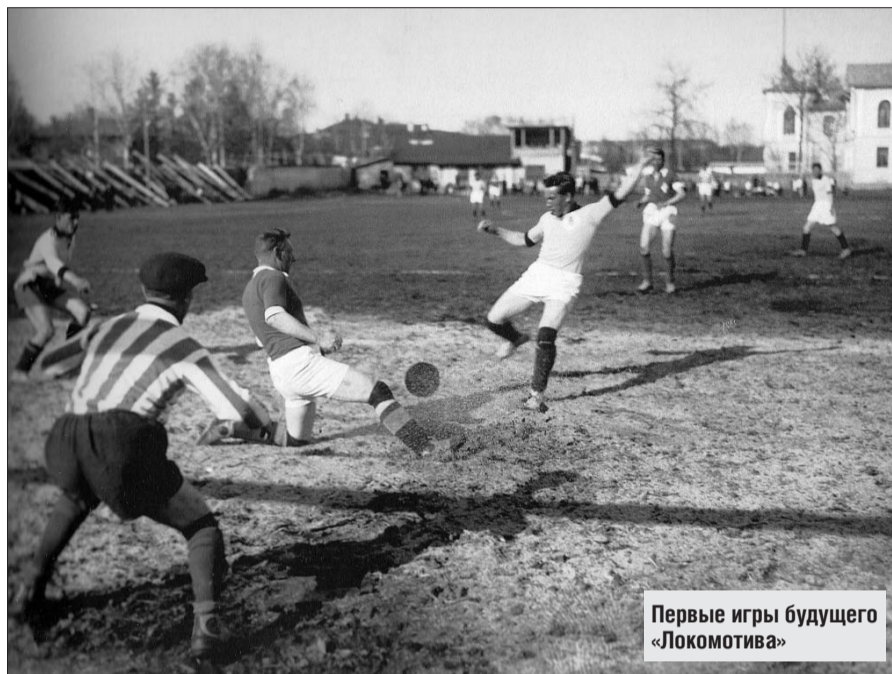
Первые игры будущего «Локомотива»

— По итогам 30 туров чемпионата «Локомотив» и московский