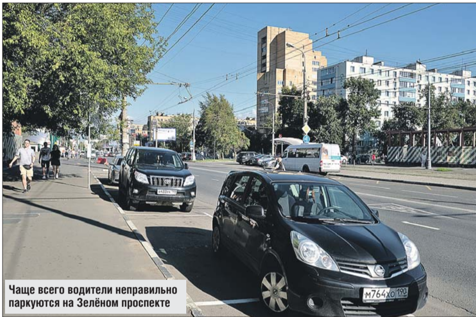
Чаще всего водители неправильно паркуются на Зелёном проспекте

Избежать этого просто. В ГИБДД дали дельный совет: от «зебры» до машины должно быть минимум шесть целых бордюрных камней. Длина каждого 90-100 см, и подсчёт даёт полную гарантию, что расстояние будет не меньше положенного.