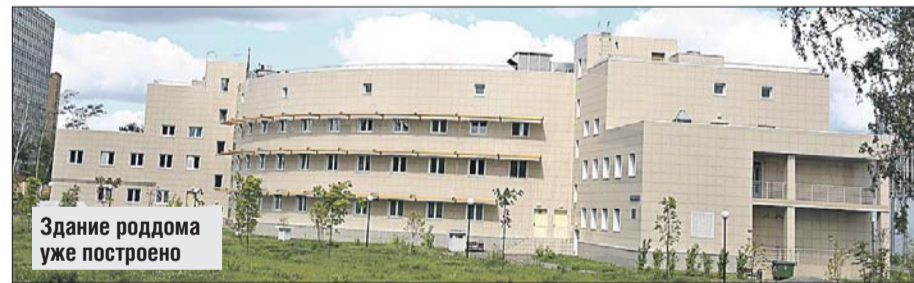
Здание роддома уже построено