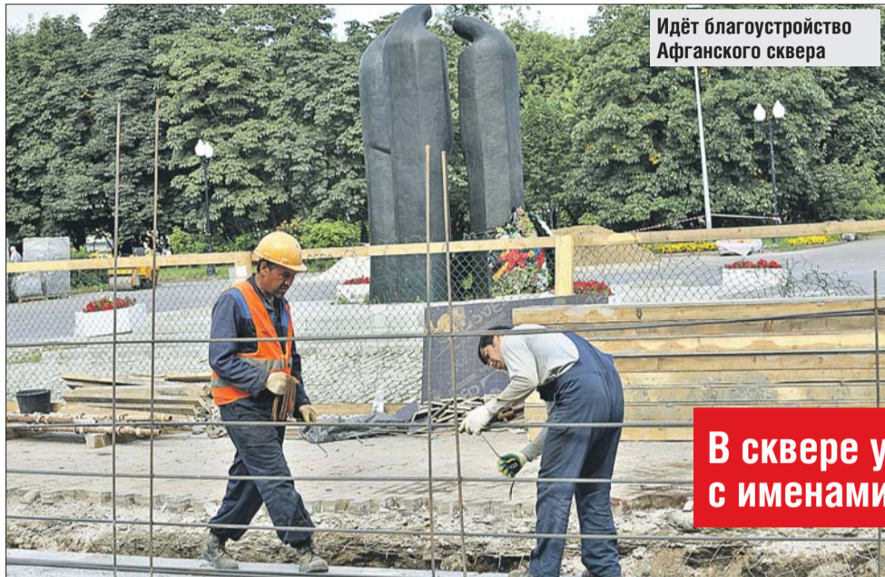
Идёт благоустройство Афганского сквера

В округе полным ходом идёт благоустройство зелёных зон