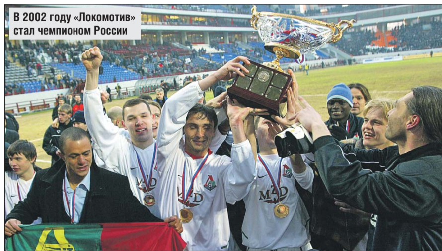
В 2002 году «Локомотив» стал чемпионом России

◆ Музей «Локомотива»: ул. Большая Черкизовская, 125, стр. 1 (вход между 12-м и 13-м секторами северной трибуны стадиона).