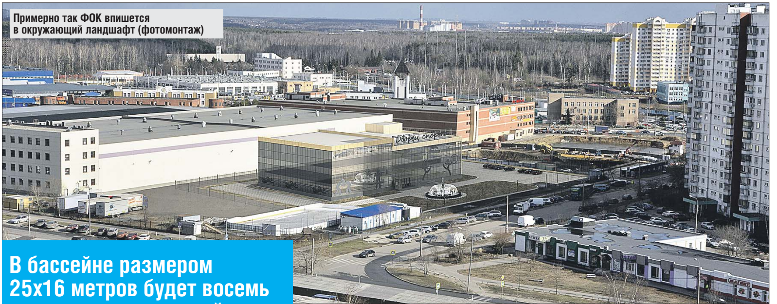
Примерно так ФОК впишется в окружающий ландшафт (фотомонтаж)

В бассейне размером 25х16 метров будет восемь дорожек с переменной глубиной от 1,2 до 2,5 метра