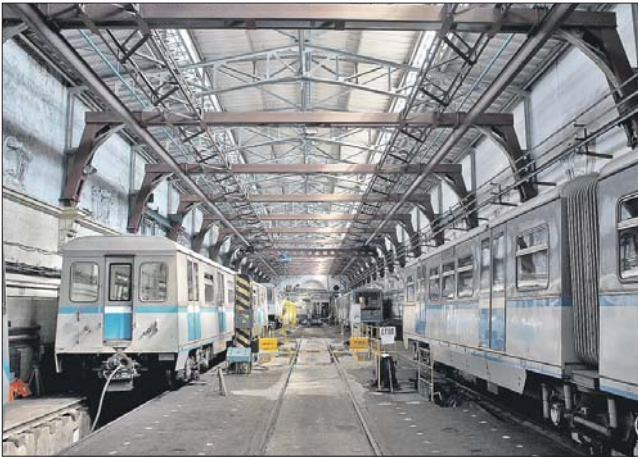
Современный вид нефа