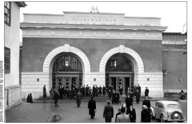
Фасад вестибюля станции «Первомайская». 1954-1955 годы