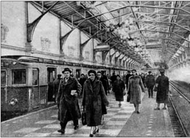
Платформа станции «Первомайская». 1955-1960 годы

Станция в 1950-е годы располагалась в другом месте