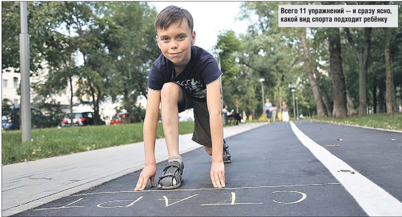
Всего 11 упражнений — и сразу ясно, какой вид спорта подходит ребёнку

Следующий раздел — отжимания. Ребёнок уве-