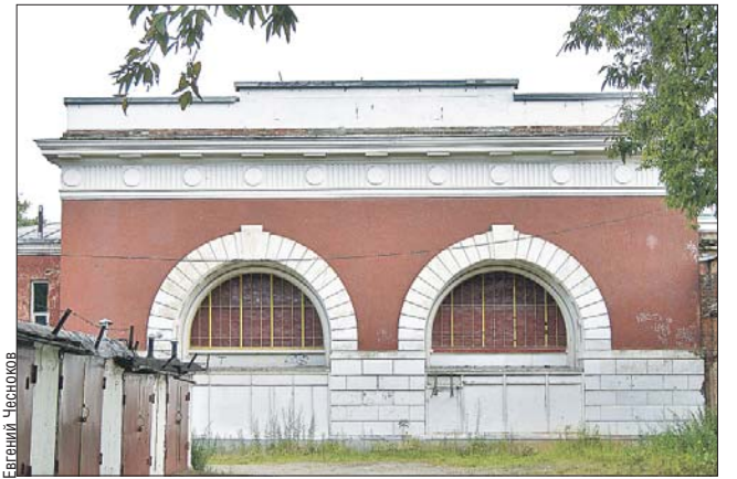
Современный вид здания