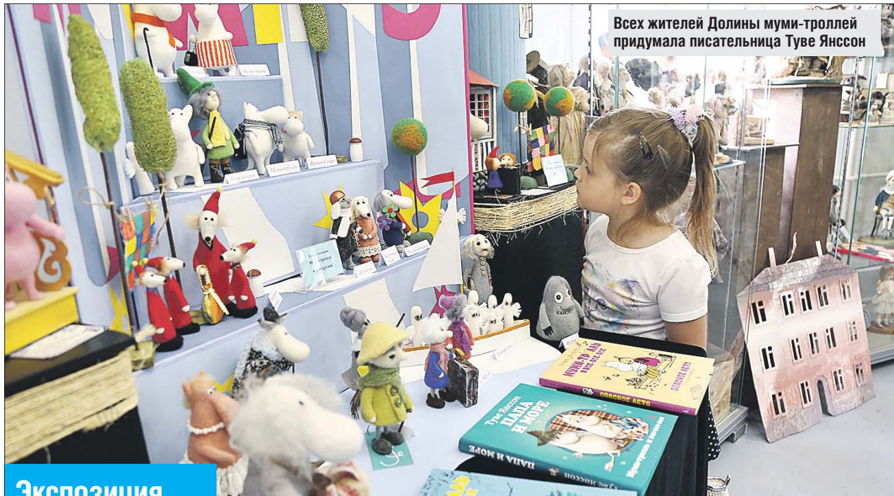
Всех жителей Долины муми-троллей придумала писательница Туве Янссон

«Котолето» организовано совместно с Театром кошек Юрия Куклачёва. Тут