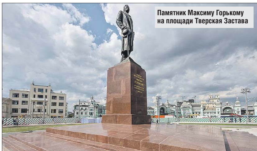
Памятник Максиму Горькому на площади Тверская Застава

Мэр Москвы Сергей Собянин осмотрел ход работ по реконструкции площади Тверская Застава.