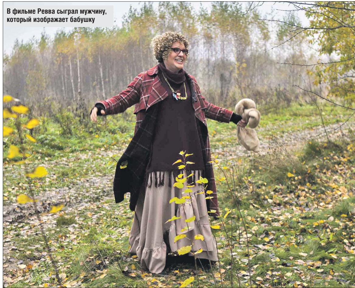
В фильме Ревва сыграл мужчину, который изображает бабушку