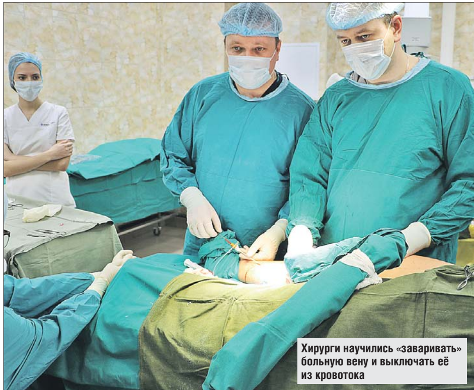
Хирурги научились «заваривать» больную вену и выключать её из кровотока

Корреспондент «ВО» расспросила флебологов 15-й больницы об опасном заболевании — варикозе