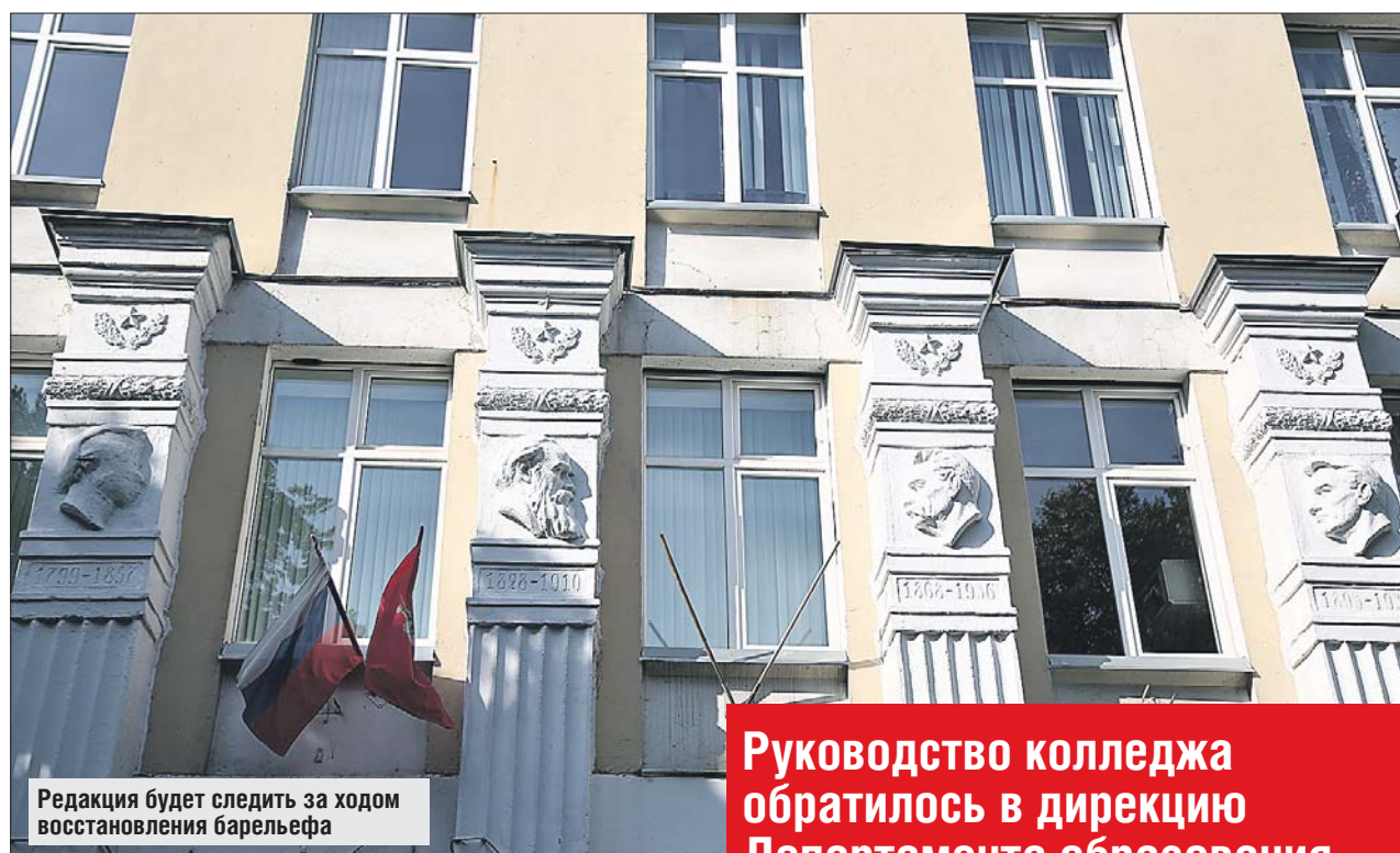
Редакция будет следить за ходом восстановления барельефа

Однако выяснилось, что здание не является памят-