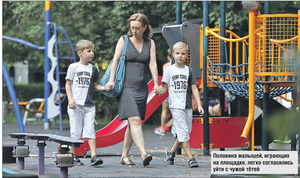
Половина малышей, играющих на площадке, легко согласились уйти с чужой тетей