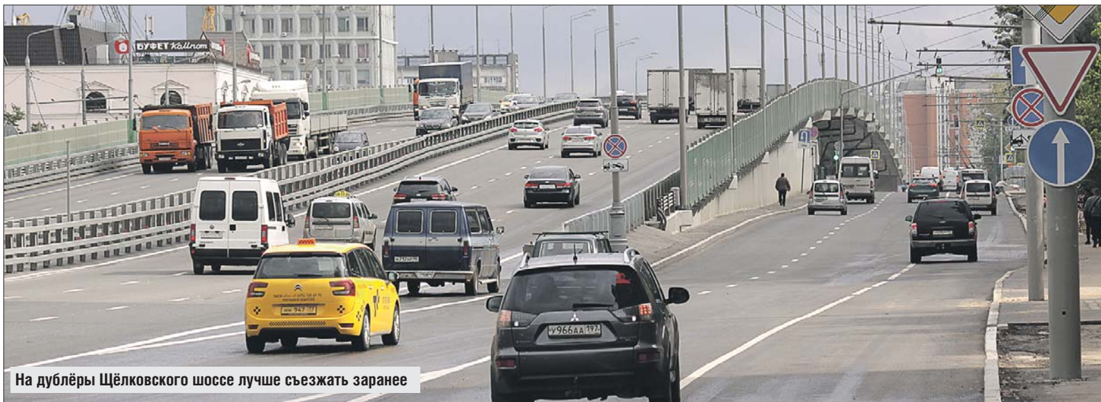
На дублёры Щёлковского шоссе лучше съезжать заранее

Какие вопросы возникают у водителей на обновлённом Щёлковском шоссе