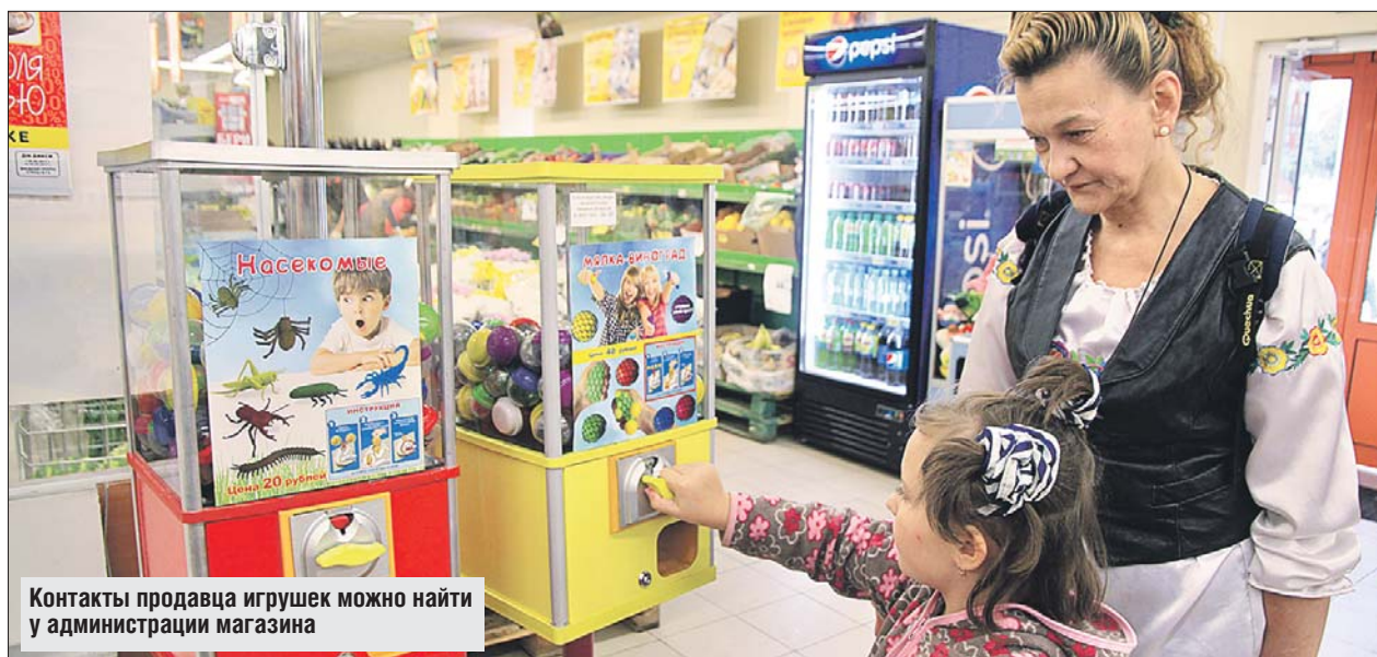
Контакты продавца игрушек можно найти у администрации магазина