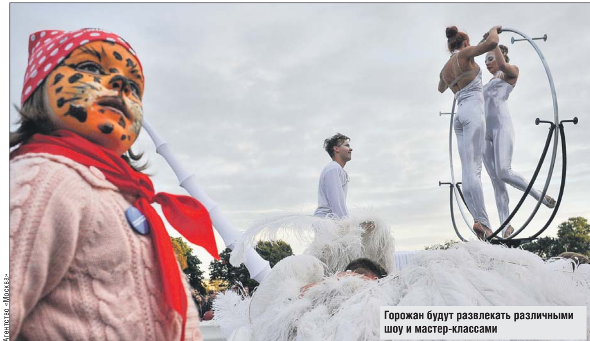
Горожан будут развлекать различными шоу и мастер-классами

В спортивной зоне пройдут «Весёлые старты» и показательные выступления по силовому экстриму. С 12.00 мож-