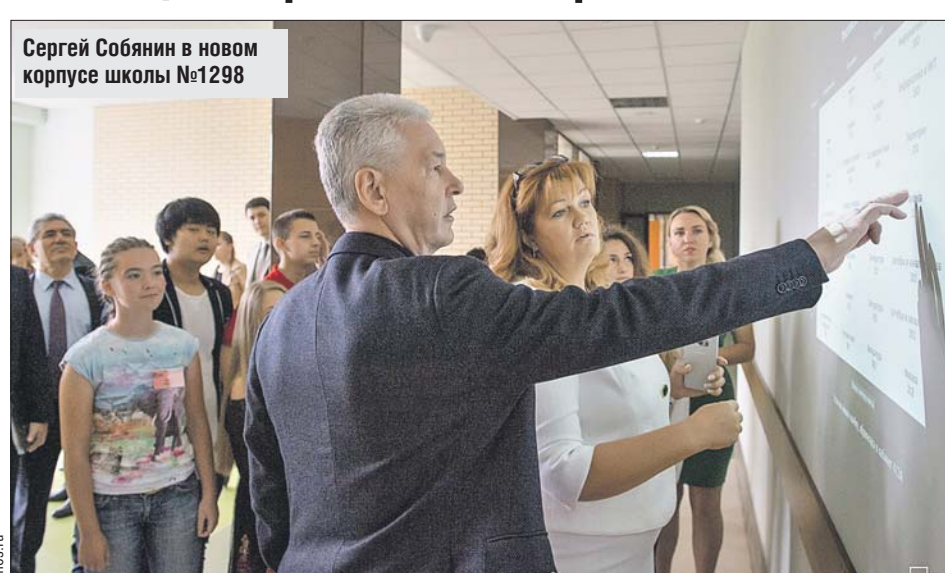
Сергей Собянин в новом корпусе школы №1298

Как заметил Сергей Собянин, классы в новом корпусе оснащены со-