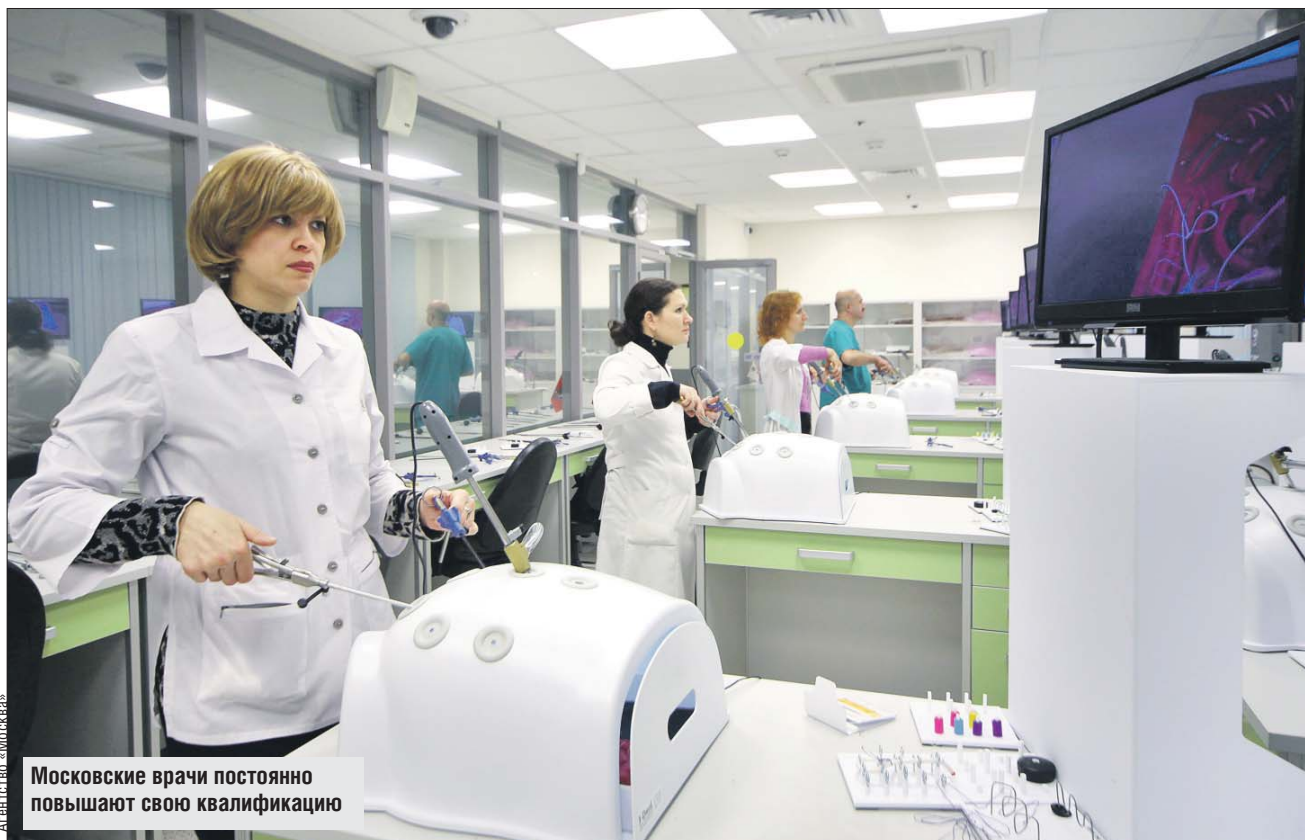
Московские врачи постоянно повышают свою квалификацию

Отбор кандидатов будет проходить открыто, на конкурсной основе, в несколько этапов. На первом в проект предпола-