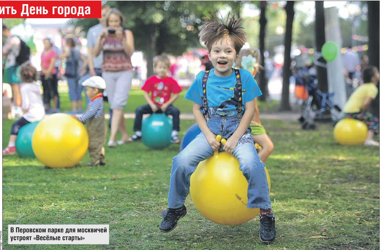
В Перовском парке для москвичей устроят «Весёлые старты»

Также можно будет освоить две старинные игры: крокет, где игроки должны провести шар по маршруту из колец, ударяя по нему специальными молоточками, и серсо.