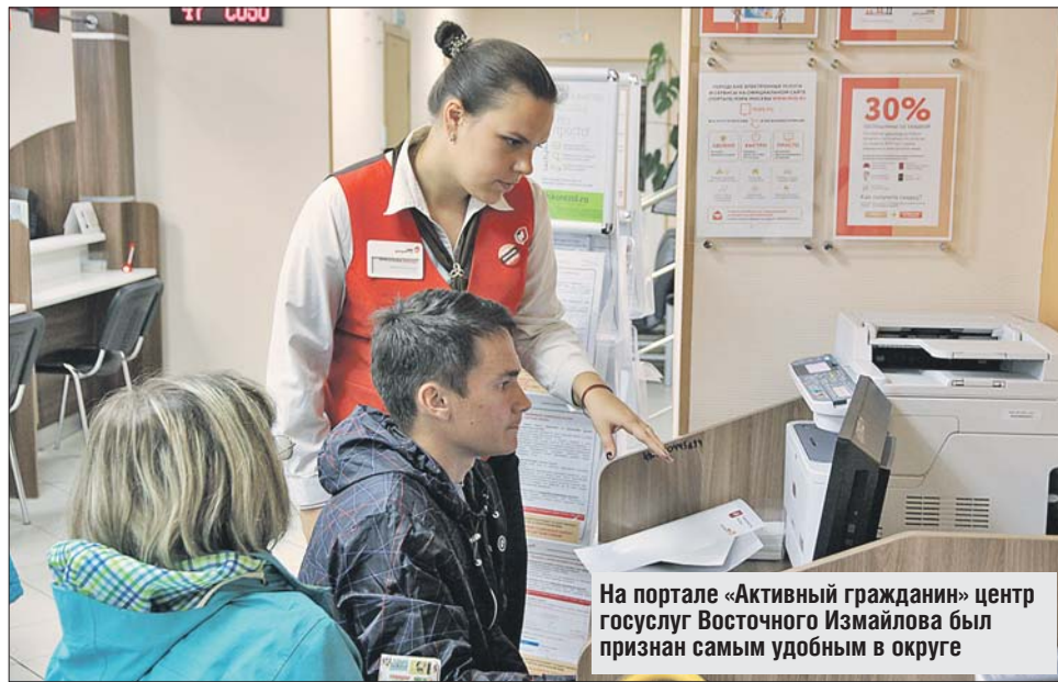
На портале «Активный гражданин» центр госуслуг Восточного Измайлова был признан самым удобным в округе

Столичным центрам «Мои документы» исполнилось шесть лет