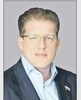
Антон Жарков, депутат Государственной думы от Восточного округа

К своему 870-летию Москва подошла как один из самых быстро развивающихся мегаполисов мира! Город начал стремительно преобразовываться и становиться удобнее для жизни, красивее и привлекательнее именно в последние годы, когда активные москвичи стали принимать участие в процессах его развития.