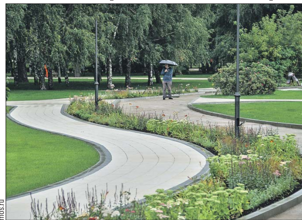
Обновление «Сада будущего» завершат осенью

— Я надеюсь, что те образцы работ, которые сейчас мы делаем, — так, как это выглядит, — жителям Ростокина понравятся, как и жителям Свиблова, которое тоже