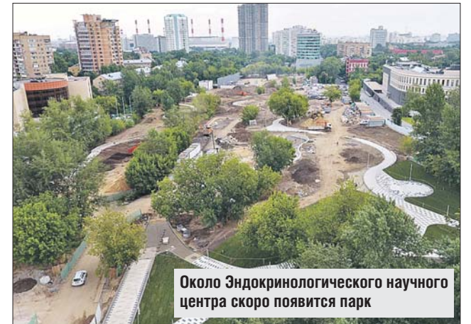
Около Эндокринологического научного центра скоро появится парк

К октябрю 2017 года в Москве появятся три новых парка: в Южном округе — парк «ЗИЛ», на Северо-Западе — парк «Ходынское поле» и на Юго-Западе Москвы — парк около Эндокринологического научного центра. Как сообщает пресс-служба городского Департамента капитального ремонта, сейчас на всех площадках активно идут строительные работы.