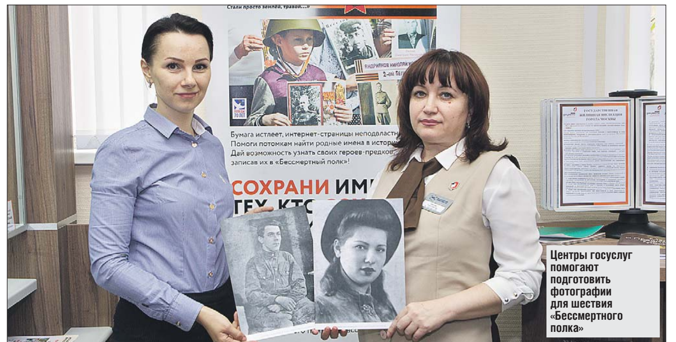
Центры госуслуг помогают подготовить фотографии для шествия «Бессмертного полка»