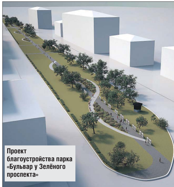
Проект благоустройства парка «Бульвар у Зелёного проспекта»

Для комфортных прогулок была создана развитая тропиноподобная сеть: более 4,3 тысячи кв. метров дорожек выложили плиткой среднего размера. На территории установили по 35 скамеек и урн. Каменные лавочки с деревянными сиденьями имеют любопытную форму: от полукруглых