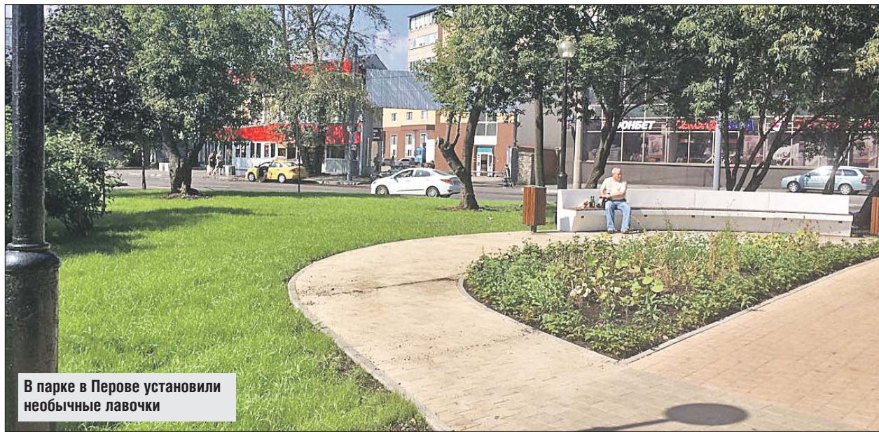
В парке в Перове установили необычные лавочки

На бульваре установили дизайнерские лавочки