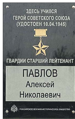
Новая памятная доска