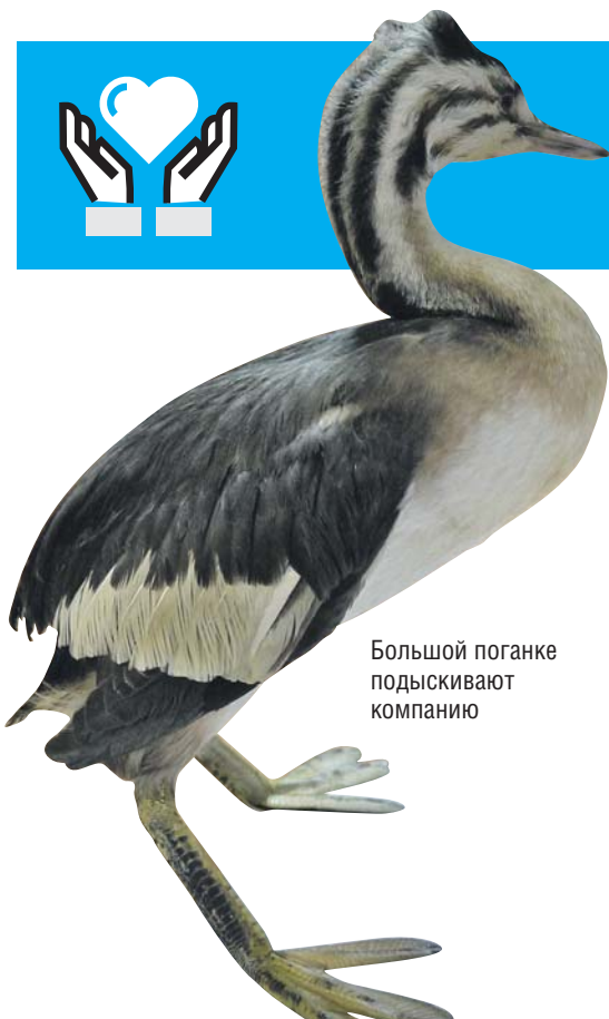
Большой поганке подыскивают компанию

◆ Орнитарий парка «Сокольники»: 8-926-630-0311, Вадим Мишин