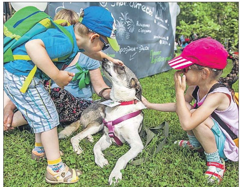
◆ Приют «Дубовая роща»: facebook.com/pora.domoy.show