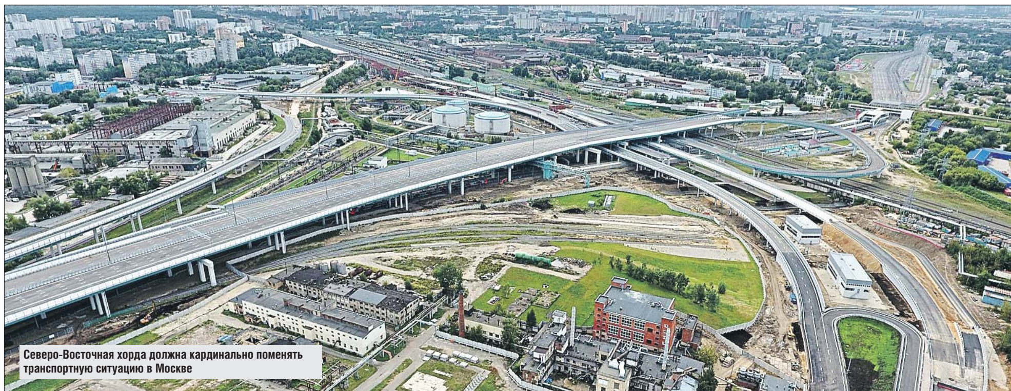
Северо-Восточная хорда должна кардинально поменять транспортную ситуацию в Москве

К реновации мы привлекли лучшие архитектурные силы города