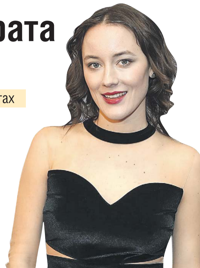
Вадим Тараканов / ИА Столица

Беседовала Лариса Зелинская (ИА «Столица»)