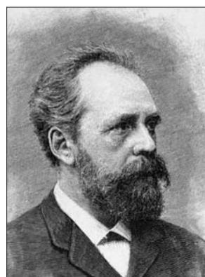
Самим появлением парк «Сокольники» обязан Сергею Третьякову