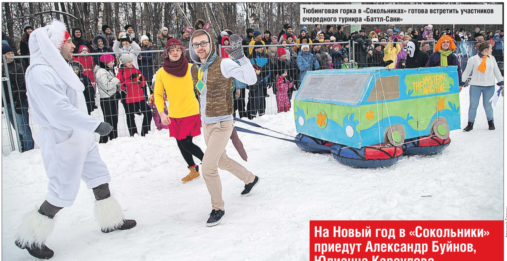
Тюбинговая горка в «Сокольниках» готова встретить участников очередного турнира «Баттл-Сани»

Где в округе встретить Новый год и Рождество