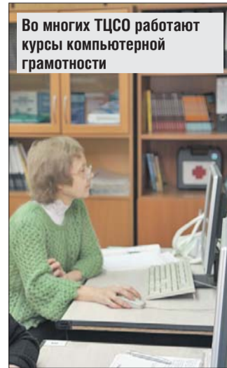
Во многих ТЦСО работают курсы компьютерной грамотности

? Я инвалид, ветеран труда, одинокий человек. Могу ли я получить какую-то помощь от Совета ветеранов? Куда ещё можно обратиться?