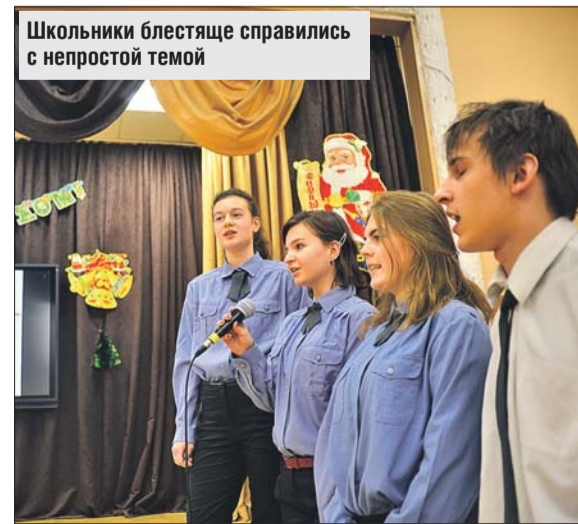
Школьники блестяще справились с непростой темой