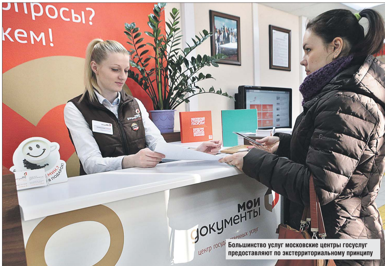
Большинство услуг московские центры госуслуг предоставляют по экстерриториальному принципу

Московские центры госуслуг перейдут на новый стандарт обслуживания