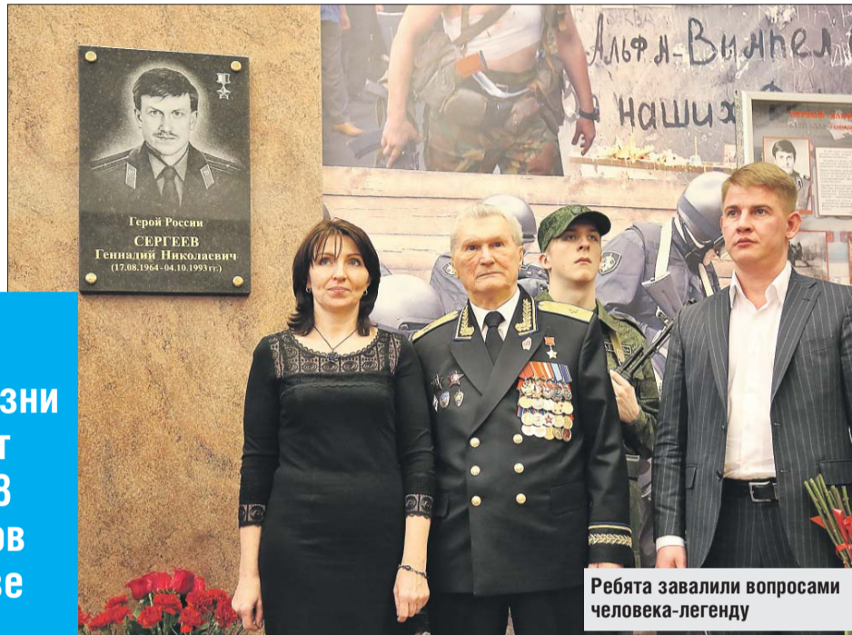
Ребята завалили вопросами человека-легенду

Самой главной операцией в жизни генерал считает спасение в 1988 году школьников во Владикавказе