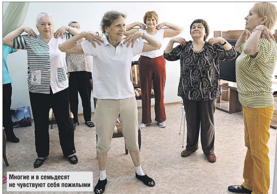
Многие и в семьдесят не чувствуют себя пожилыми

В рамках программы «Активное долголетие» в ноябре стартовал ещё один образовательный проект — «Серебряный университет». Столичный Департамент труда и соцзащиты населения вместе с Московским педагогическим