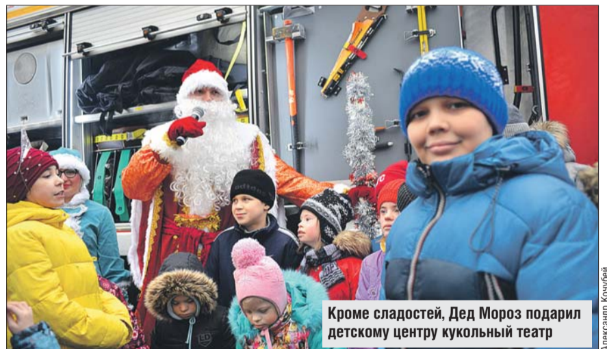
Кроме сладостей, Дед Мороз подарил детскому центру кукольный театр