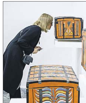
А кто-то собирает старинные сундуки

— Мы приглашаем не только коллекционеров традиционных предметов искусства, таких как картины или скульптуры. Собрания простых, повседневных, даже стран-