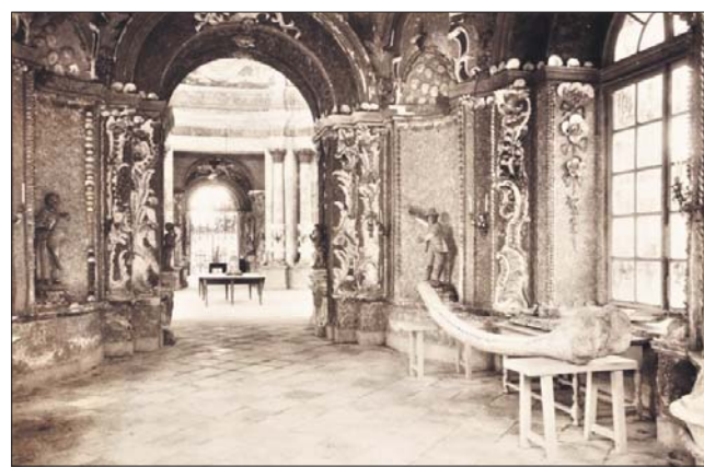
Интерьеры павильона «Грот». 1883-1886 годы