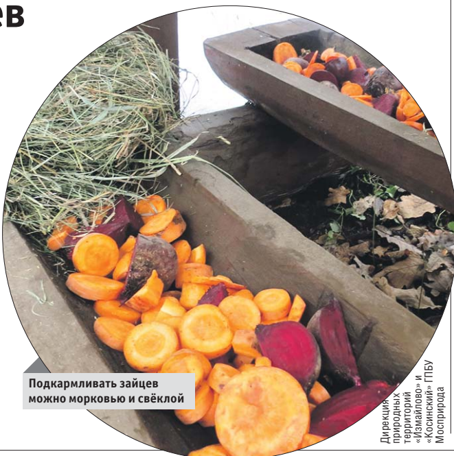
Подкармливать зайцев можно морковью и свёклой

Схемы размещения кормушек можно найти на сайте www.mosecovao.info