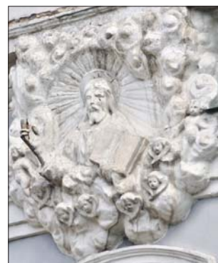
Украшение на фасаде церкви

веке появились подобные сооружения, в них устраивали либо купальню, либо фонтан ( grotto в переводе с итальянского — «пещера»). Трёхчастное барочное здание построил архитектор Фёдор Аргунов в 1756-1761 годах, задавшись целью представить в камне стихию воды.