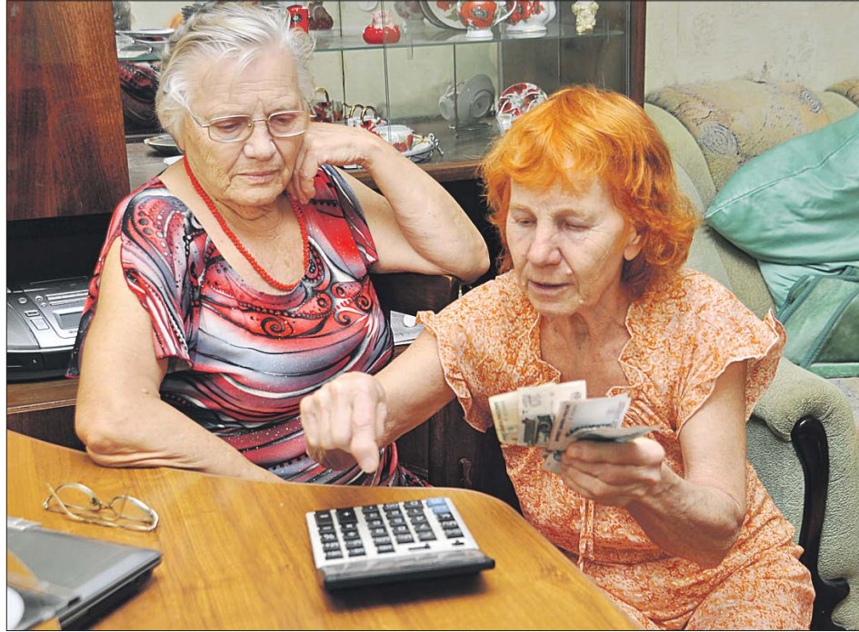
Минимальную пенсию в Москве увеличили на 3 тысячи рублей

Как неоднократно заявлял мэр, социальная защита остаётся одним из приоритетов при формировании расходной части городского бюджета. Москва не только выполняет все текущие обязательства, но и увеличивает размер выплат, расширяет линейку льгот и активно развивает адресную по-