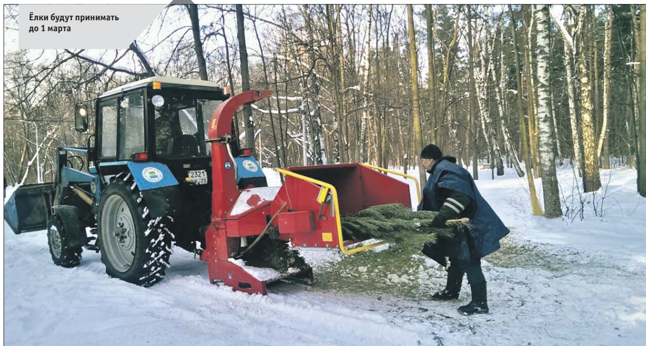
Ёлки будут принимать до 1 марта