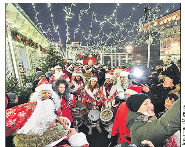
Зимний фестиваль в столице завершится 14 января

Порядка 10,5 млн москвичей и гостей столицы посетили праздничные мероприятия с 30 декабря по 8 января. Об этом на своей странице в «Твиттере» написал мэр Москвы Сергей Собянин.