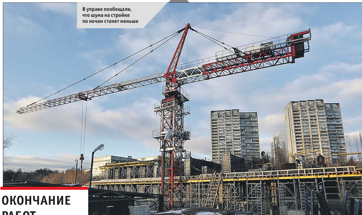
В управе пообещали, что шума на стройке по ночам станет меньше

— Мы обязательно проведём беседу со строителями, чтобы они не проводили шумные работы в ночное время и поддерживали чистоту на стройплощадке и во-