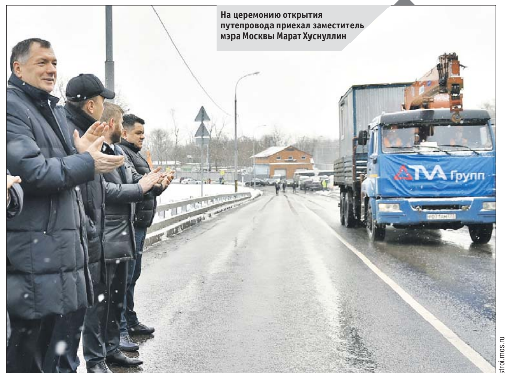
На церемонии открытия путепровода приехал заместитель мэра Москвы Марат Хуснуллин

АВТОБУСЫ 75-ГО МАРШРУТА ТЕПЕРЬ СНОВА ХОДЯТ ОТ МЕТРО «БУЛЬВАР РОКОССОВСКОГО» ДО МЕТРО «СОКОЛЬНИКИ»