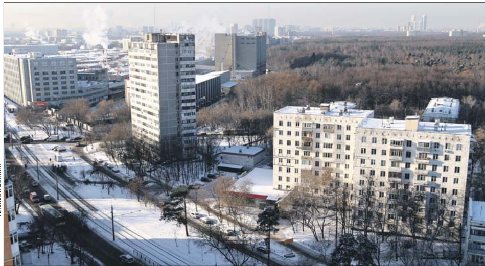
Район Метрогородок сегодня