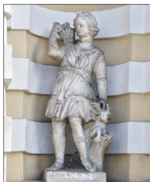
Фасад грота украшен скульптурами