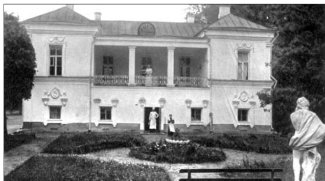
Итальянский домик. 1912 год