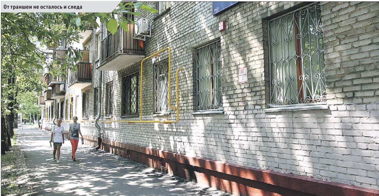
От траншеи не осталось и следа