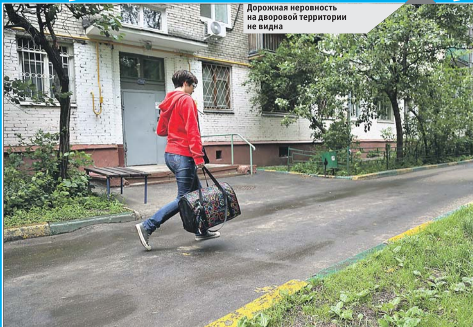
Дорожная неровность на дворовой территории не видна