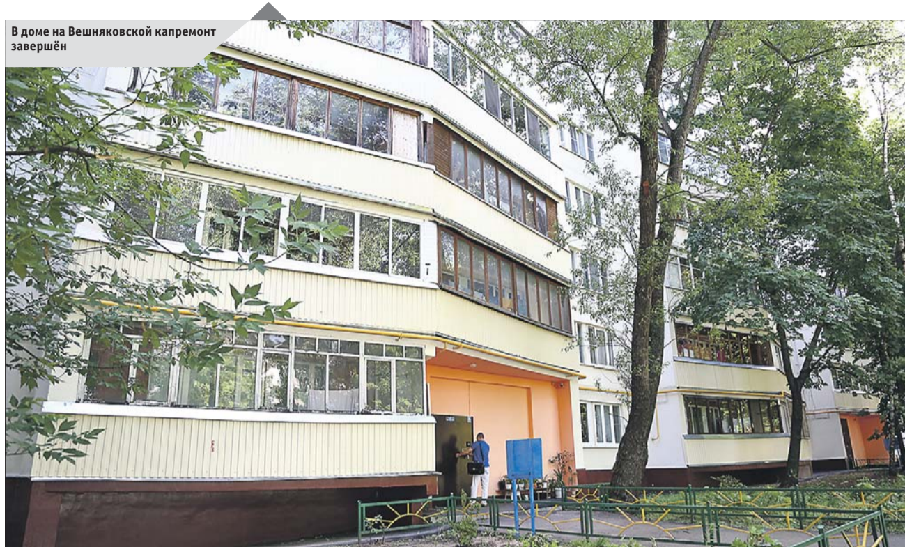
В доме на Вешняковской капремонт завершён