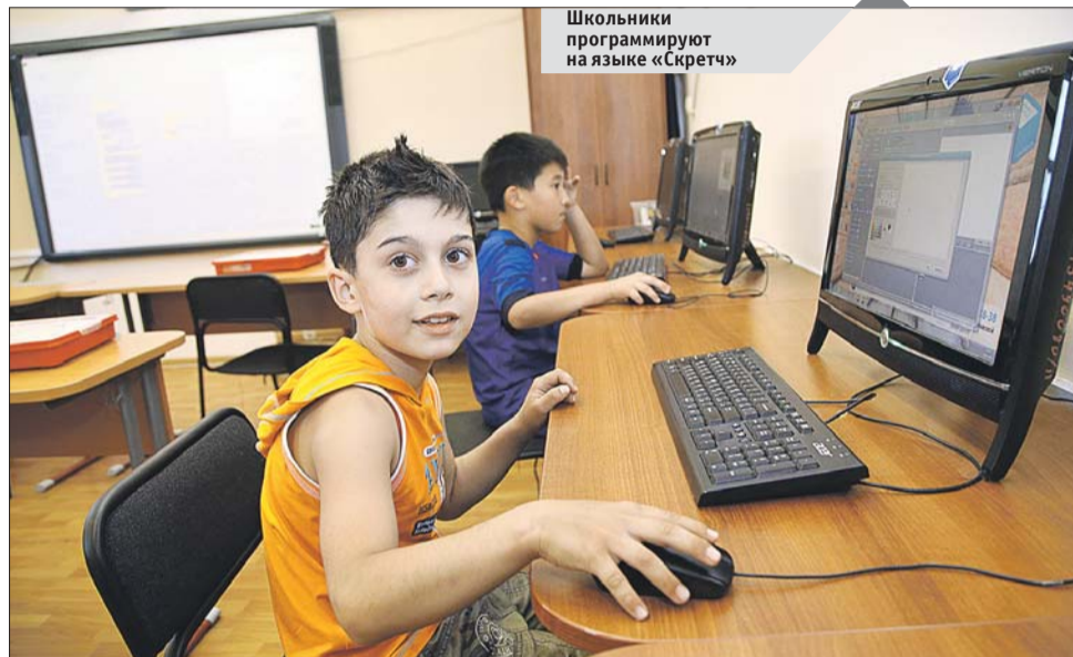
Школьники программируют на языке «Скретч»

Образовательная смена на базе школы №1346 — единственная в районе Богородское. В целом в столице в программе «Московская смена» для детей от 7 до 14 лет участвуют