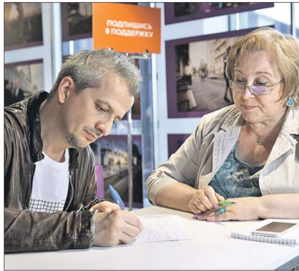
Режиссёр Константин Богомолов вошёл в предвыборный штаб Собянина

— Казалось бы, деньги в бюджете есть, можно выполнить любую работу, нанять сиделок для ухода за пожилыми, больными, пристроить брошенных животных и так далее и тому подобное. Но вы знаете, если город будет так делать без участия волонтерского движения, это будет город без души. Вы внесите совершенно неповторимую атмосферу во