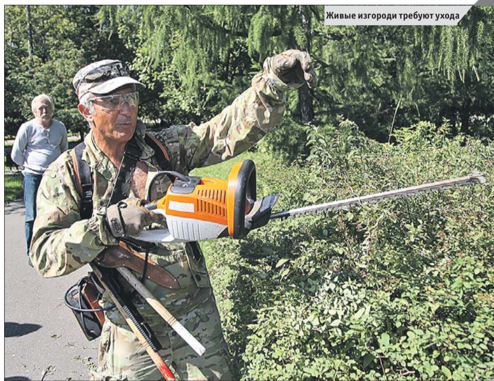
Живые изгороди требуют ухода

Живая изгородь из кизильника блестящего осе-