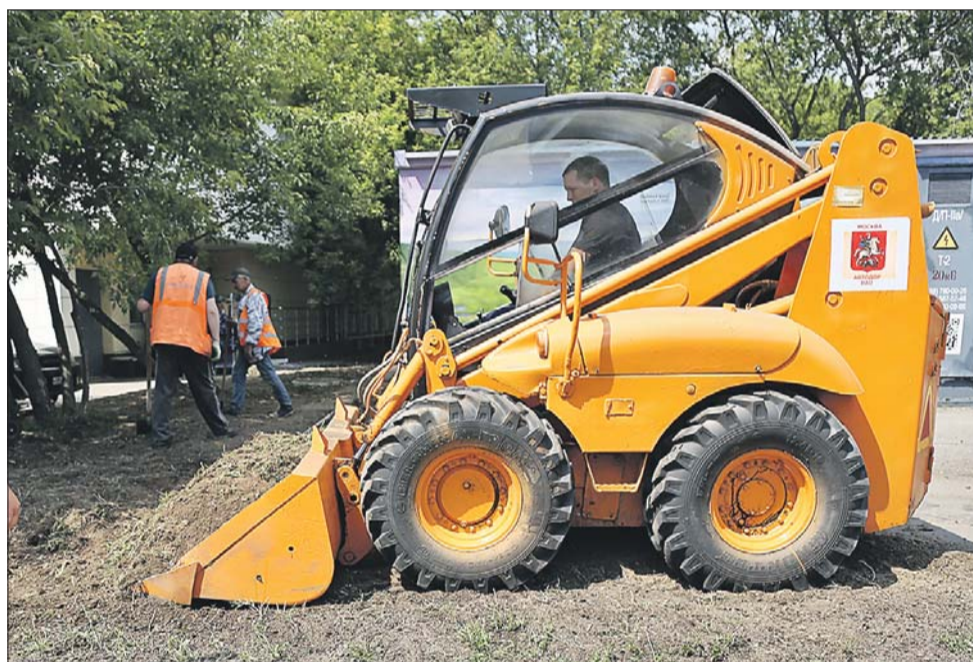
В сквере на Краснобогатырской идут благоустроительные работы

За время реализации программы Москва неоднократно выходила с инициативами по совершенствованию федеральной нормативной базы для осуществления региональных программ капитального ремонта. По инициативе Москвы, например, в федеральные правовые акты была внесена поправка, разрешаю-