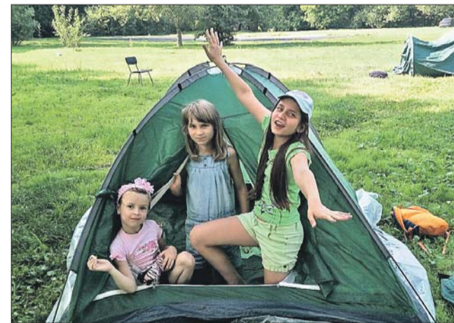
Поставить палатку — в два счёта!

Сбор в 14.30 на ул. Сталеваров, 18, корп. 1. Справки по тел. 8-963-771-2262, сайт клубсфера.рф