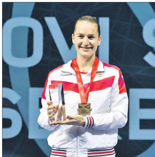
На пьедестале опять Софья Великая

Пресс-служба Федерации фехтования России