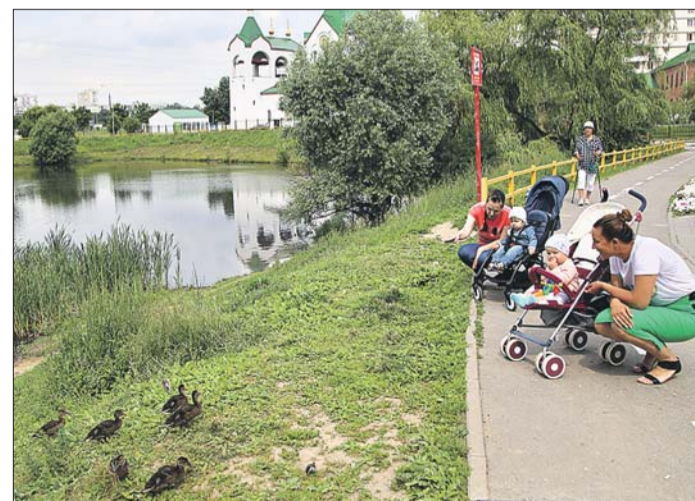
У пруда на Суздальской будет светло, как днём