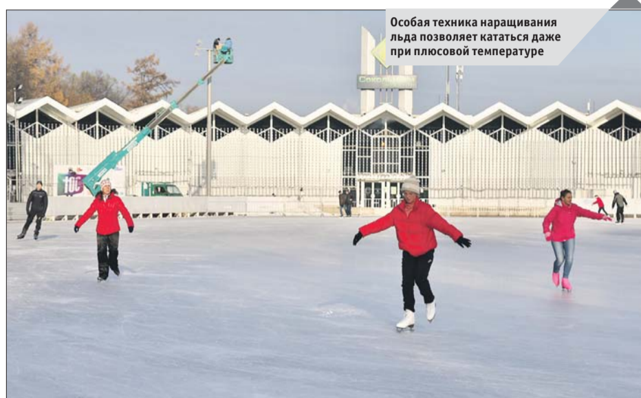
Особая техника наращивания льда позволяет кататься даже при плюсовой температуре

С 1 по 5 ноября жители смогли опробовать лёд бесплатно, взяв с собой свои коньки. Теперь каток заработал в обычном графике с платным входом, а также открылись два пункта проката спортивного инвентаря. Для посетителей пригото-