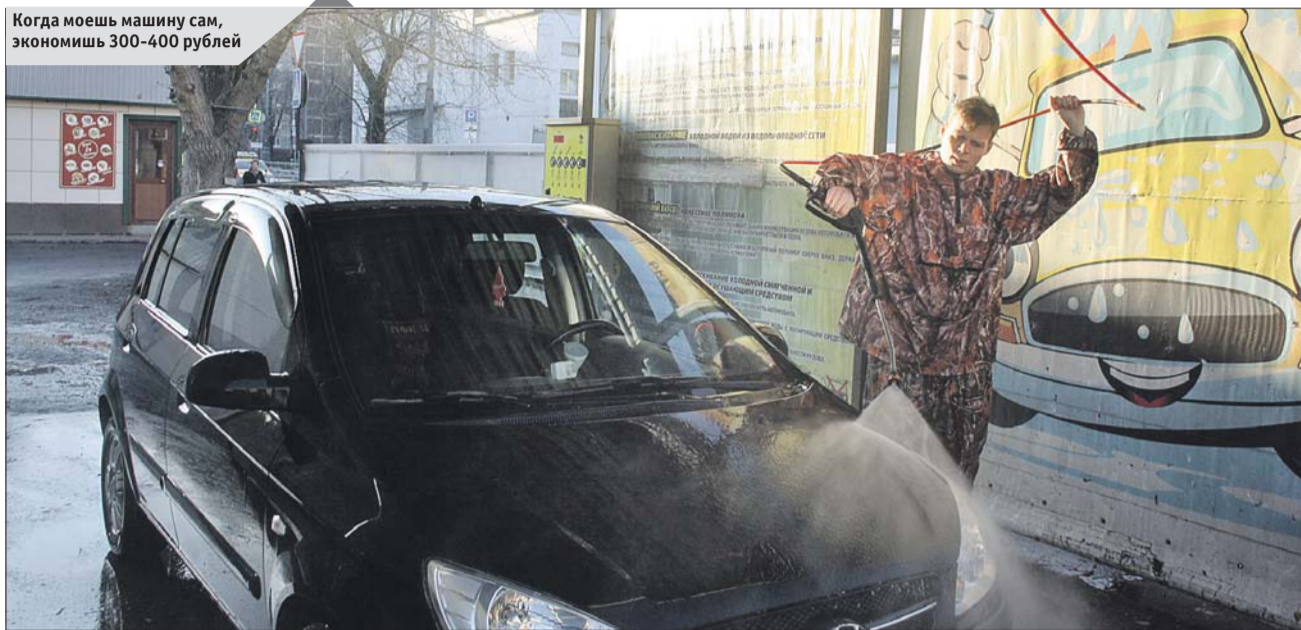
Когда моешь машину сам, экономишь 300-400 рублей

Затем оплачиваю ещё две минуты и перехожу к основному этапу мойки. Из шланга теперь льётся пена. Покрываю ею кузов и жду, чтобы она стекла: так всегда делают на обычных мойках. Чтобы смыть пену, оплачиваю две минуты воды. Старательно поливаю кузов, но на капоте всё равно остаются три развода от упавших листьев.