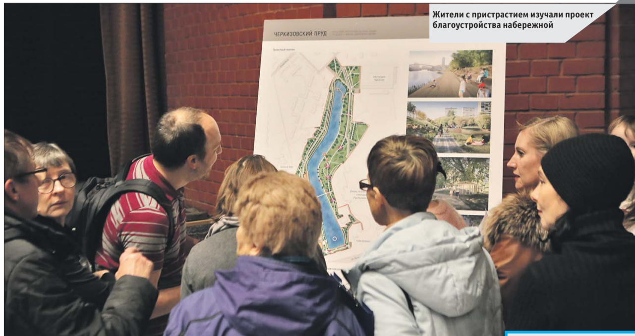
Жители с пристрастием изучали проект благоустройства набережной

Жители приняли участие в обсуждении проекта благоустройства набережной Шитова