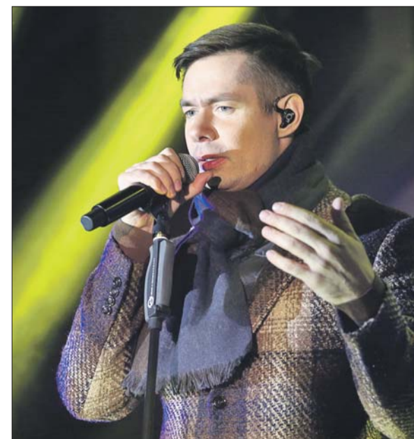
Чтобы послушать Пьеху, люди приехали в Новокошино со всего округа