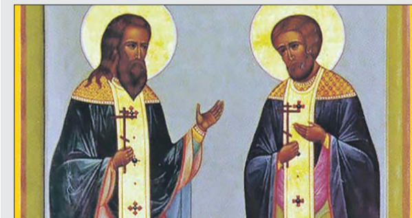
Священномученики Александр Смирнов и Фёдор Ремизов

Их долго и мучительно казнили. А через несколько дней этот отряд карателей был весь уничтожен под соседним селом.