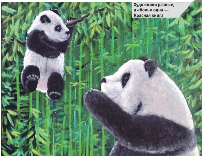
Художники разные, а «боль» одна — Красная книга

В Перове, в отделении на Мартеновской, 7, посетителей ждут сразу две выставки. До 15 ноября