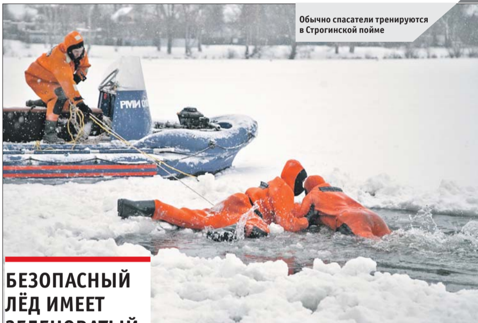
Обычно спасатели тренируются в Стрiginской пойме