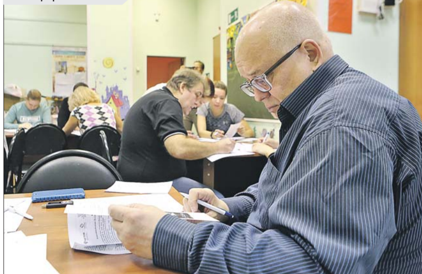
Корреспондент «ВО» вспоминает всё, что знает об этнографии