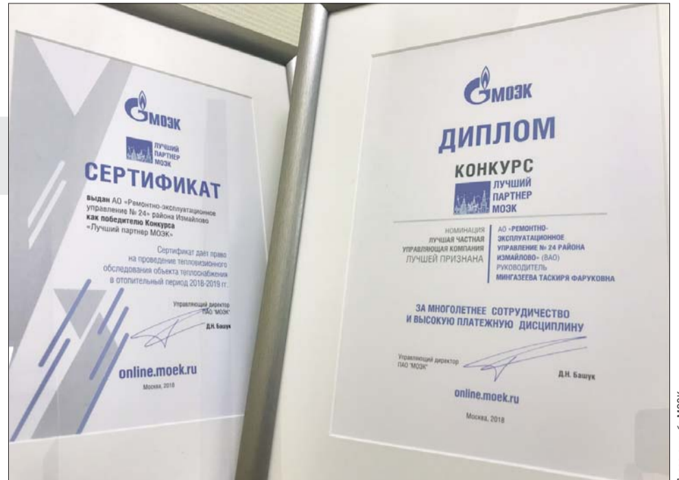
Лучшие управляющие компании отмечены дипломами и сертификатами на обследование тепловизором — в целях выявления утечек тепла и сокращения потерь при платежах

Между тем ситуация с платежами за поставленное тепло и горячую воду в Москве не слишком оп-