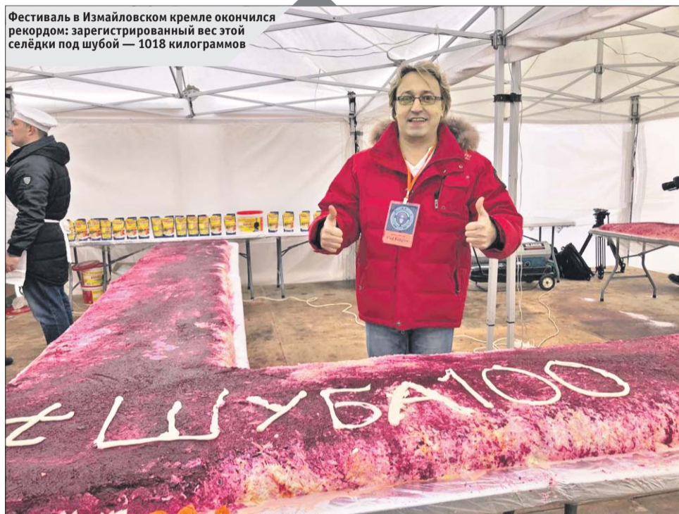
Фестиваль в Измайловском кремле окончился рекордом: зарегистрированный вес этой селёдки под шубой — 1018 килограммов

дадут блюду свежий вкус, а яйца можно использовать как для украшения, так и в качестве дополнительного слоя. А вот от майонеза отказаться нельзя: без него вкус будет совершенно иным.