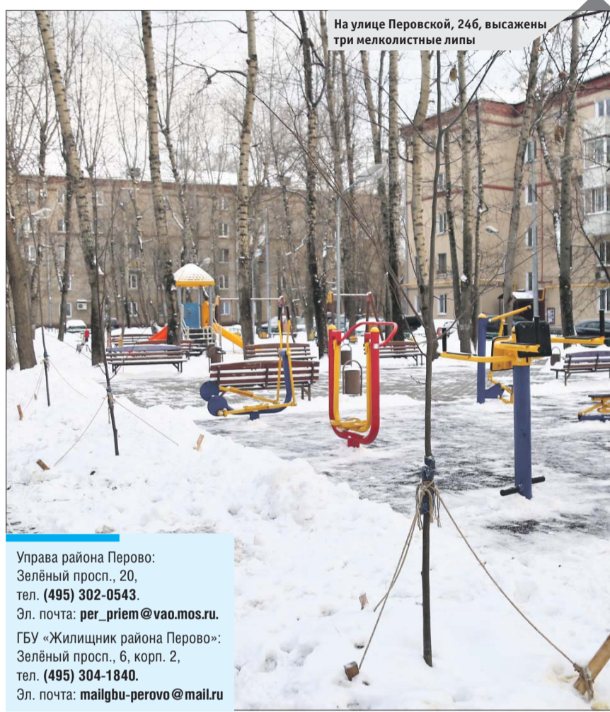
На улице Перовской, 24б, высажены три мелколистные липы

Управа района Перово: Зелёный просп., 20, тел. (495) 302-0543. Эл. почта: per_priem@vao.mos.ru. ГБУ «Жилищник района Перово»: Зелёный просп., 6, корп. 2, тел. (495) 304-1840. Эл. почта: mailgbu-perovo@mail.ru