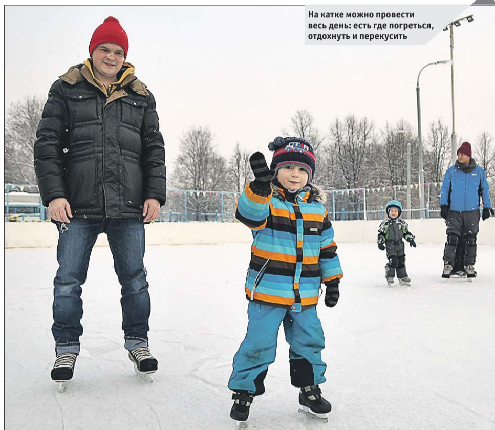
На катке можно провести весь день: есть где погреться, отдохнуть и перекусить

ки на льду. С графиком работы каждого катка и расписанием мероприятий можно ознакомиться на информационных стендах, которые оборо-