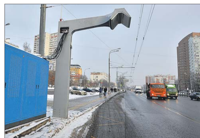
Так выглядит станция подзарядки электробусов

В ГУП «Мосгортранс» сообщили, что сейчас по улицам столицы курсирует 21 электробус. Вес-