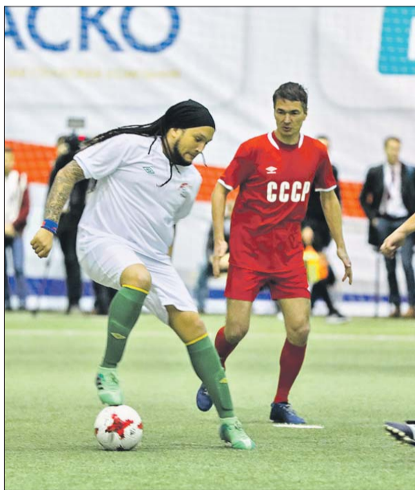
Артисты хотят чаще встречаться на футбольном поле