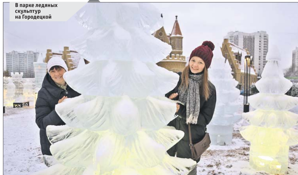
В парке ледяных скульптур на Городецкой