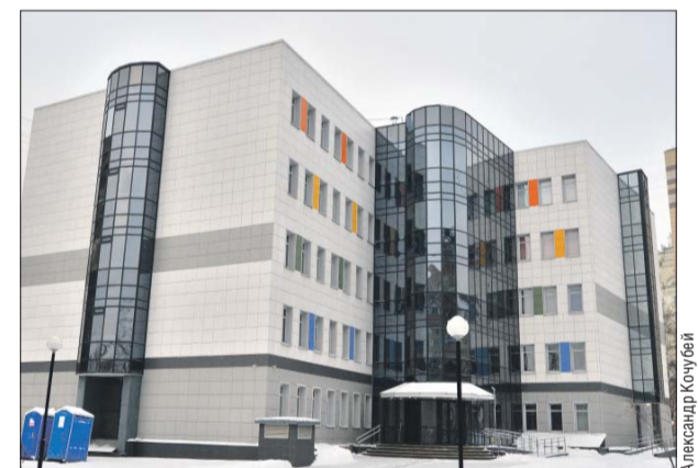
За одну смену новую клинику смогут посещать до 530 пациентов