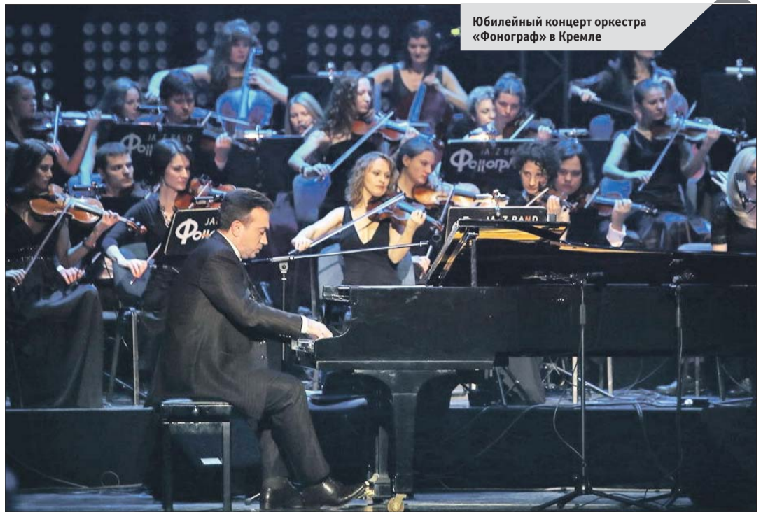
Юбилейный концерт оркестра «Фонограф» в Кремле

мом деле. Если речь идёт о занятиях для общего развития, то это всегда полезно, и не важно, сколько времени тратится на музыку. Но если строятся профессиональные планы, то тут уже другие задачи и другой подход. Нужно заниматься много по определённому индивидуальному плану с педагогом, который знает, как выстраивать методику подобных занятий. Это как профессиональный спорт: главное — правильно мотивировать ребёнка, заинтересовать его. Знаете, как мне бабушка длительности нот объяснила? Посадила за стол, взяла яблоко. «Вот яблоко — это целая нота, понял?» Киваю. Она режет яблоко пополам. «А вот половинки. Если ещё разрезать, получится четыре четверти. Потом восьмые. Потом шестнадцатые. Ровно столько длительностей в такте: целые, половинки, четверти, восьмые, шестнадцатые. Понял? Теперь можешь всё съесть».