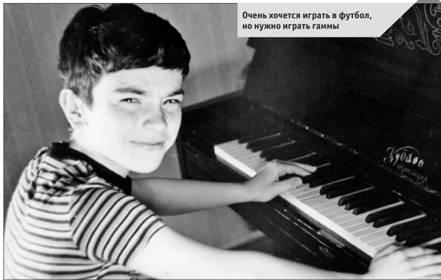
Очень хочется играть в футбол, но нужно играть гаммы