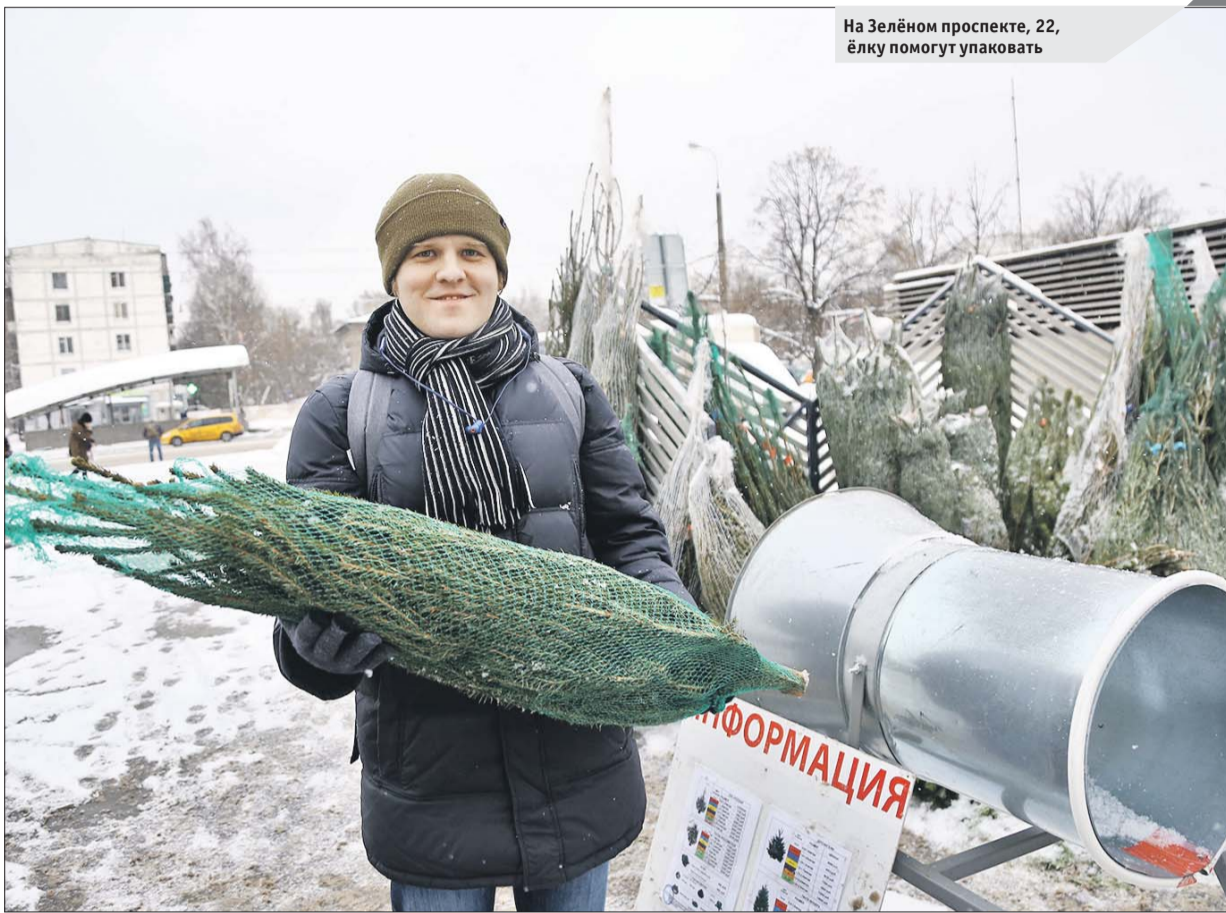
На Зелёном проспекте, 22, ёлку помогут упаковать

■ Адреса в Перове: Зелёный просп., вл. 2 и 23/43