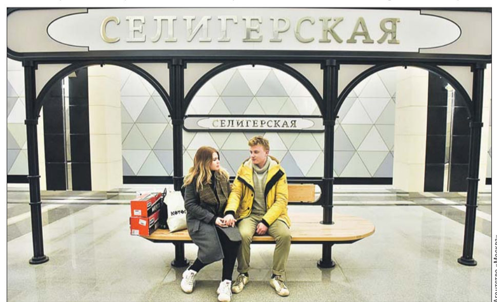
Станцию «Селигерскую» на «салатовой» ветке открыли совсем недавно

В текущем году были построены участки Северо-Восточной хорды — от улицы Фестивальной до Дмитровского шоссе