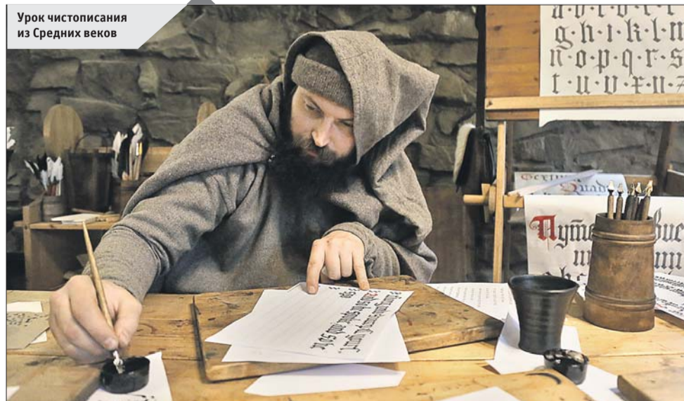
Урок чистописания из Средних веков

Полная программа фестиваля «Путешествие в Рождество» размещена на сайте mos.ru в разделе «Проекты», подраздел «Московские сезоны»