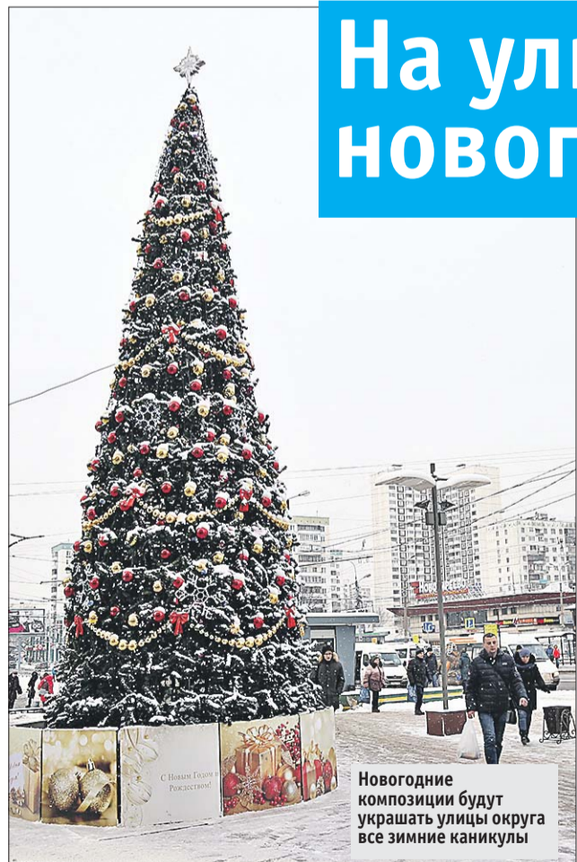
Новогодние композиции будут украшать улицы округа все зимние каникулы