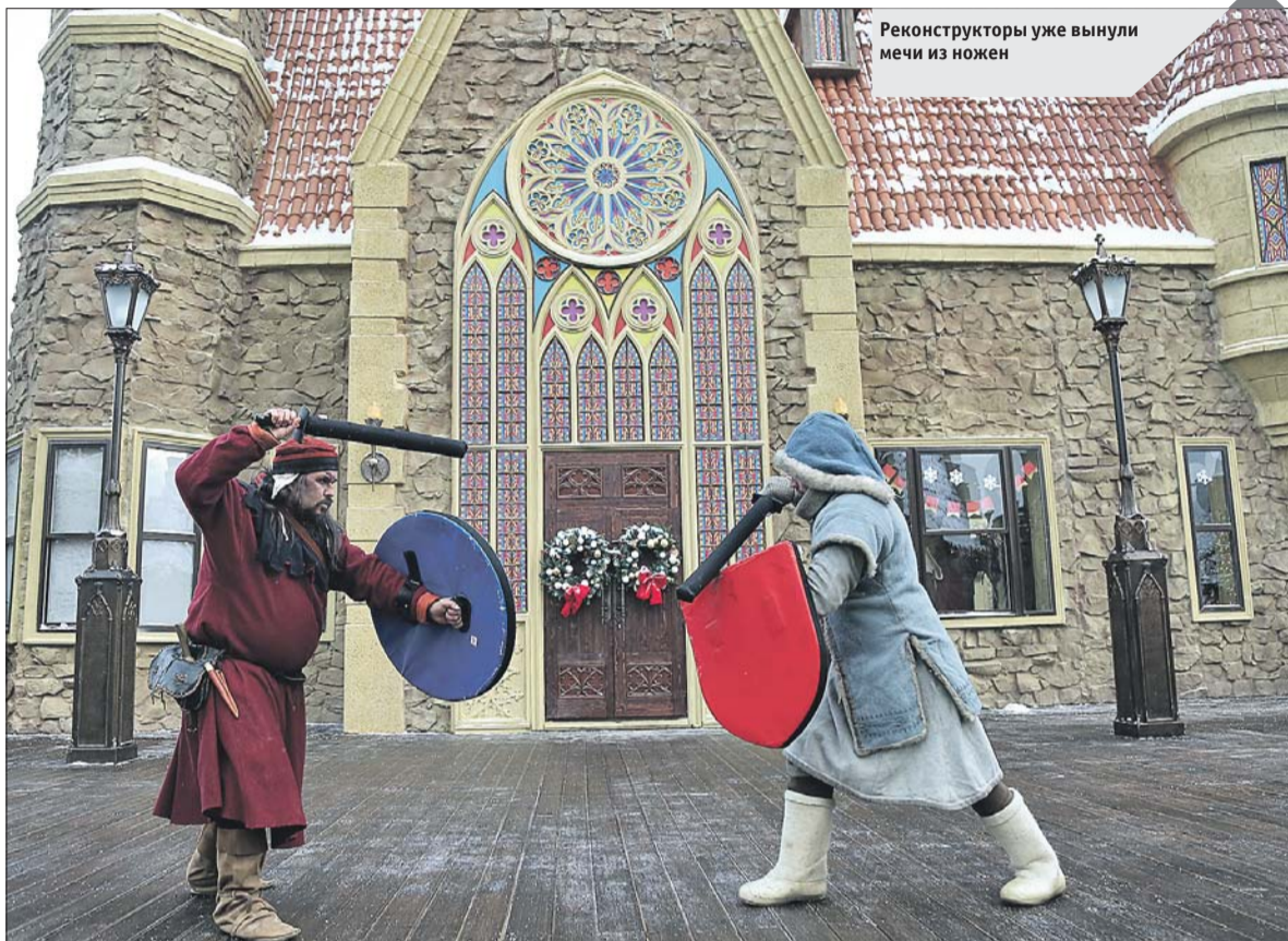
Реконструкторы уже вынули мечи из ножен

В восьми торговых шале в форме средневековых замков продаются авторские сувениры и но-