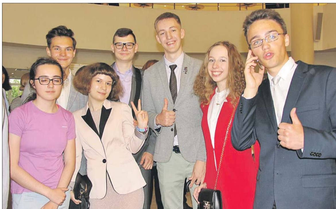
Победители Всероссийской олимпиады на торжественном приёме в Московском доме музыки