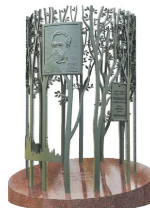
Памятный знак установят к началу сентября