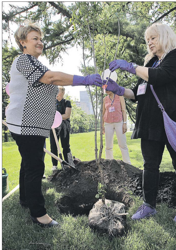
Коллекция Сиреневого сада пополняется каждый год