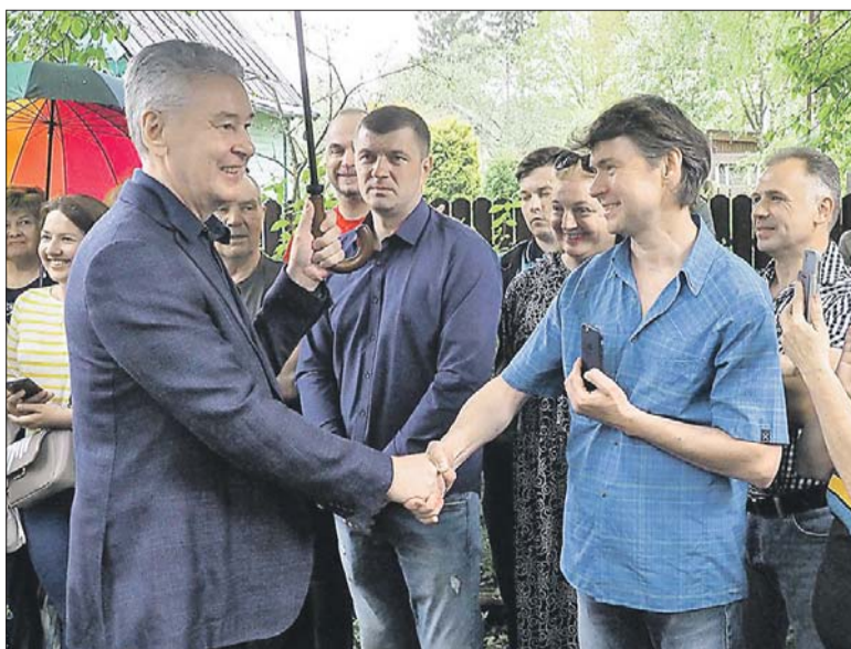
Москва поможет области организовать вывоз мусора и даст денег на закупку новых машин скорой помощи

Он заявил, что благоустройство дачных посёлков и садоводческих товариществ, расположенных в Московской области и в других