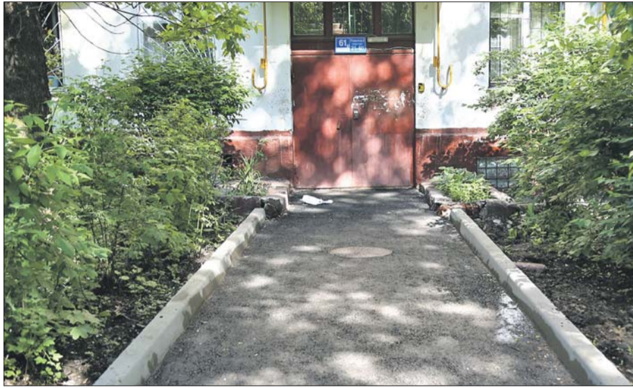
В этом подъезде живёт много пожилых людей, и скамейку здесь обязательно поставят