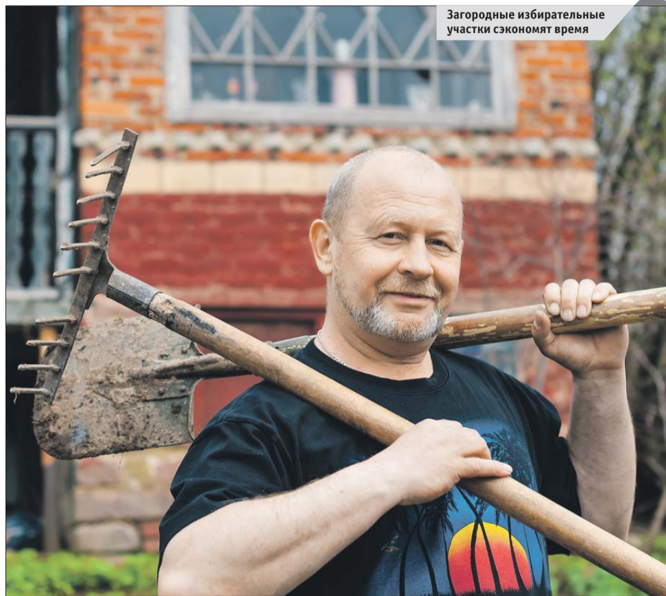
Загородные избирательные участки сэкономят время

В этом году единый день голосования приходится на второе воскресенье сентября — самый пик дачного сезона, когда более 3 млн москвичей выезжают за пределы города на выходные. К тому же многие столичные пенсионеры проживают на дачах и садовых участках до поздней осени.