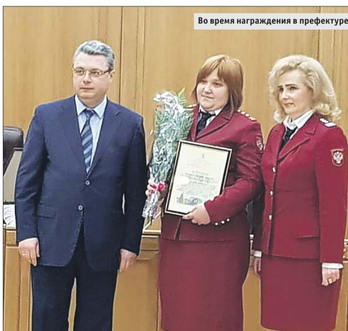
Во время награждения в префектуре