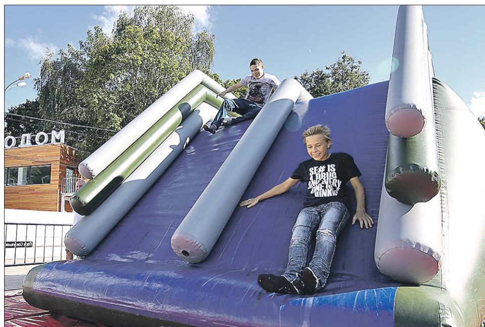
Сегодня в парке «Сокольники» действует 14 современных детских площадок

— В этом году у нас появился ещё один уникальный объект — «Всепогорка» — единственная в городе круглогодичная и самая длинная тубинговая горка. В этом сезоне здесь впервые пройдёт летний фестиваль «БаттлСани». Недавно открылись ещё два объекта — панда-парк на металли-