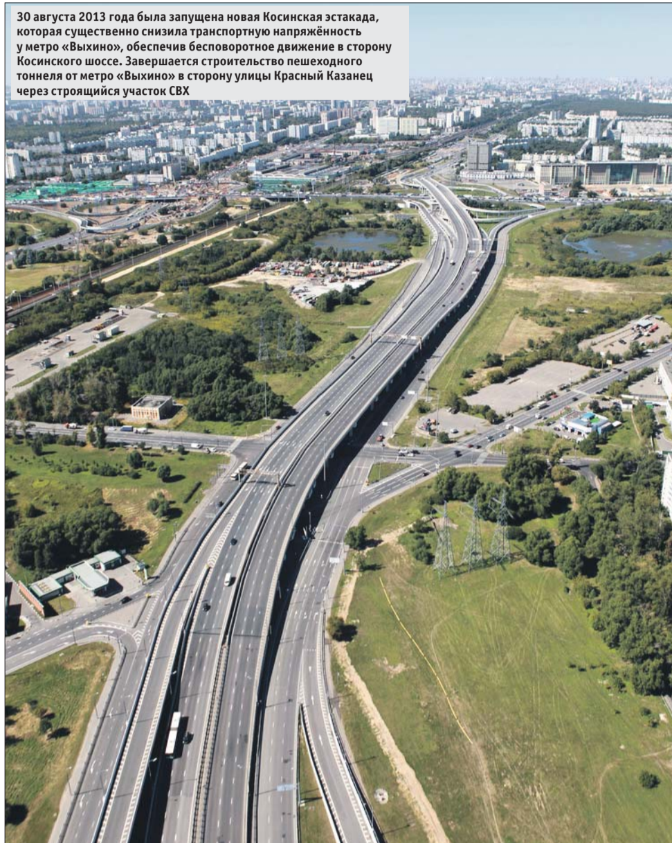
30 августа 2013 года была запущена новая Косинская эстакада, которая существенно снизила транспортную напряжённость у метро «Выхино», обеспечив бесповоротное движение в сторону Косинского шоссе. Завершается строительство пешеходного тоннеля от метро «Выхино» в сторону улицы Красный Казанец через строящийся участок СВХ