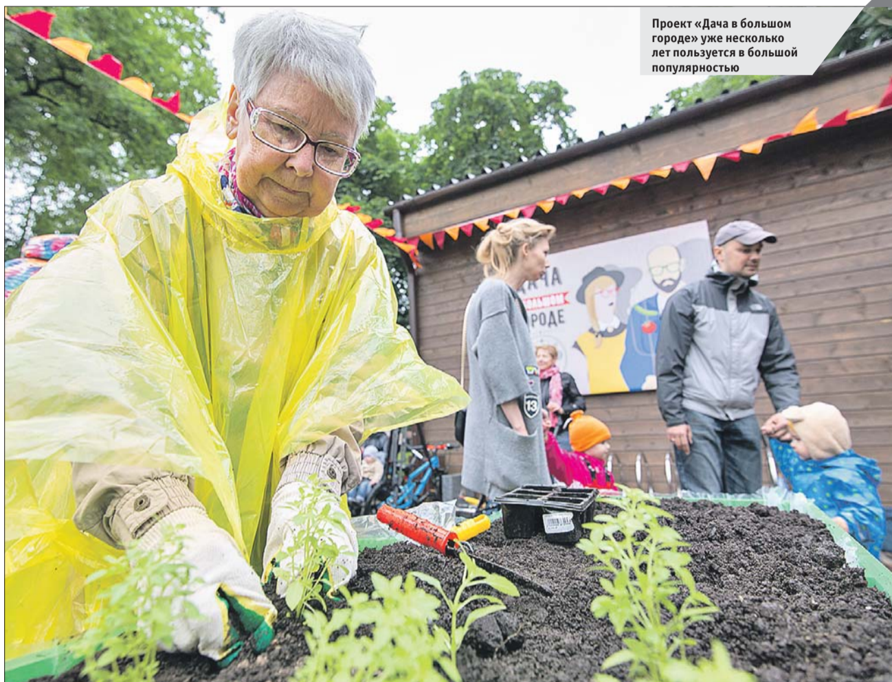
Проект «Дача в большом городе» уже несколько лет пользуется в большой популярностью

— Проект «Московское долголетие» реализуется на двух наших территориях: в Перовском парке и в парке у прудов Радуга. В Перовском уже с апреля идут занятия по скандинавской ходьбе — по вторникам и четвергам с 11.00 до 12.00. В мае группа скандинавской ходь-