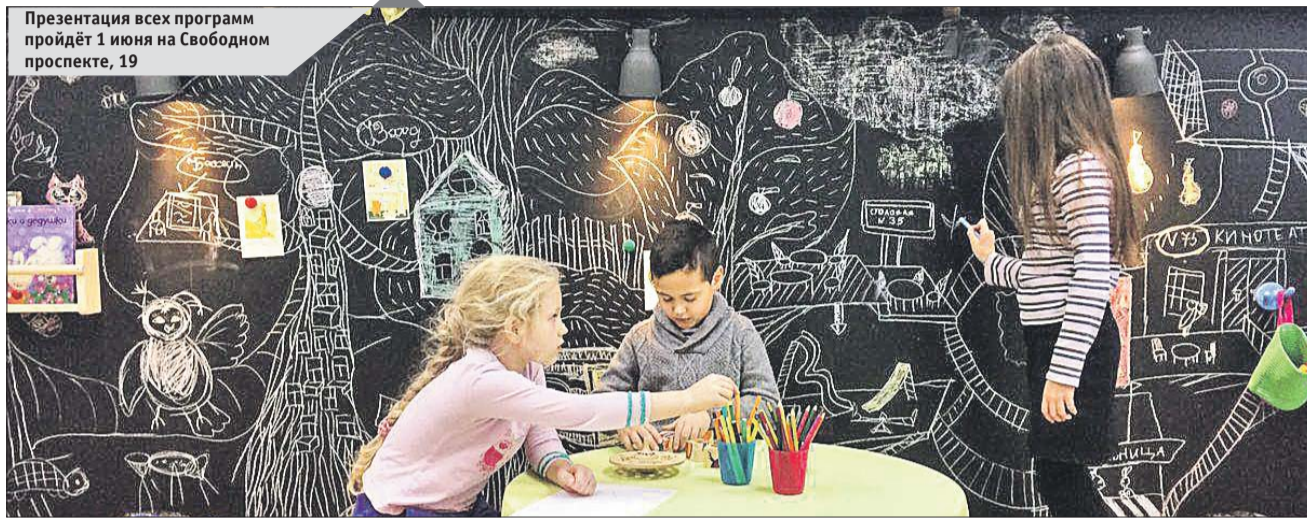
Презентация всех программ пройдёт 1 июня на Свободном проспекте, 19

В фэшен-лаборатории будут изучать историю костюма, знакомиться с тка-