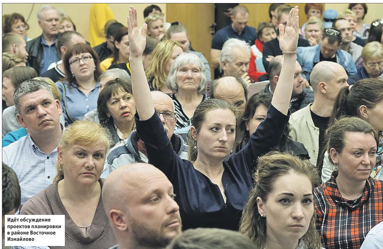
Идёт обсуждение проектов планировки в районе Восточное Измайлово

Как отмечают в Стройкомплексе, публичное обсуждение проектов планировок необходимо для того, чтобы создать кварталы, максимально комфортные для всех жителей района. А кроме этого, только после обсуждения и согласования проектов можно начи-