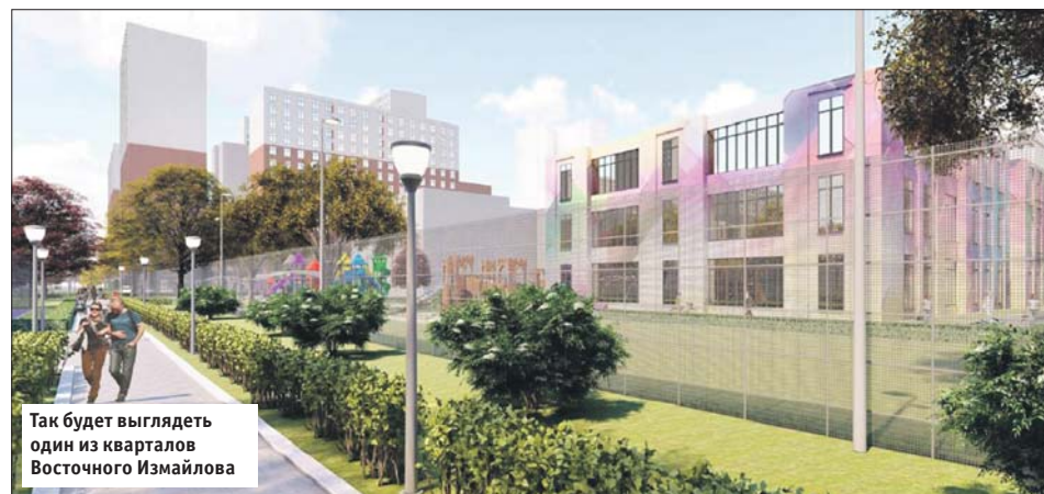
Так будет выглядеть один из кварталов Восточного Измайлова