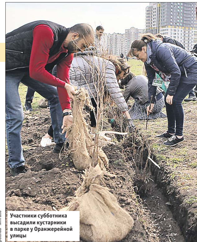
Участники субботника высадили кустарники в парке у Оранжерейной улицы

телесюжет, который будет размещён в Интернете.