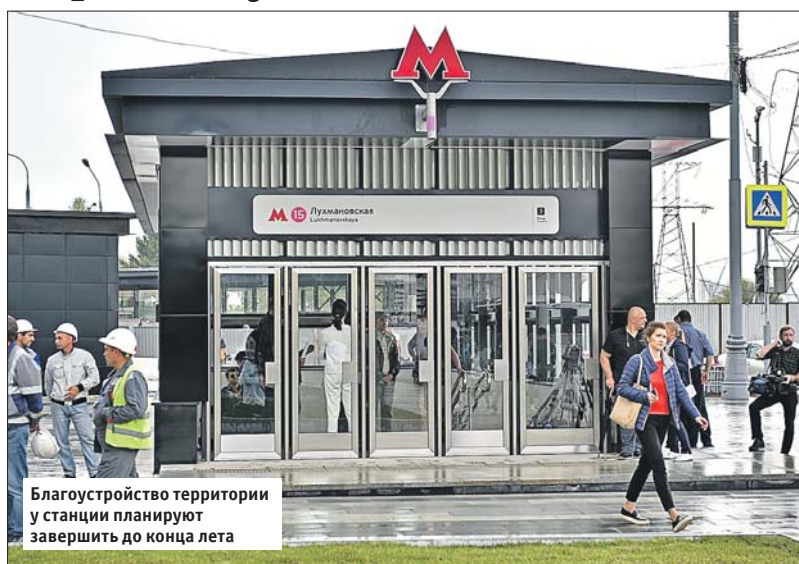
Благоустройство территории у станции планируют завершить до конца лета