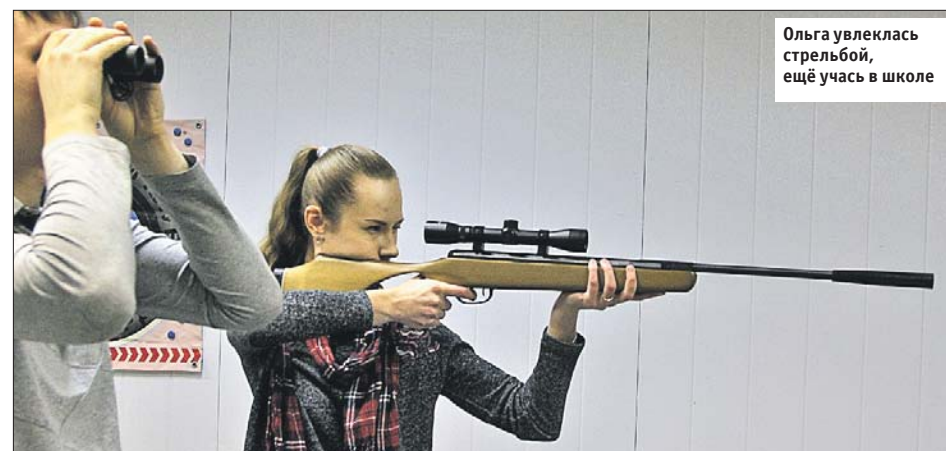
Ольга увлеклась стрельбой, ещё участвовала в школе