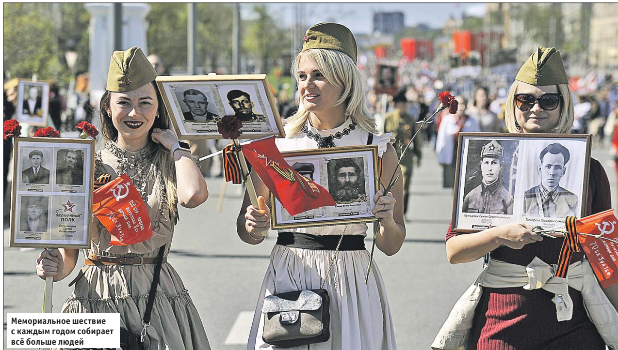
Мемориальное шествие с каждым годом собирает всё больше людей

«Бессмертный полк» объединяет людей независимо от возраста и профессии. В едином строю по Красной площади каждый год с портретом своего отца проходит Президент России Владимир Путин, принимает участие в акции и мэр Москвы Сергей Собянин. Присоединяются к ним и лидеры других стран, такие как, например, премьер-министр Израиля Биньямин Нетаньяху и президент Сербии Александр Вучич. Активно популяризируют акцию народный артист СССР Василий Лановой и даже иностранные актёры: в прошлом году гостем мероприятия стал Стивен Сигал.