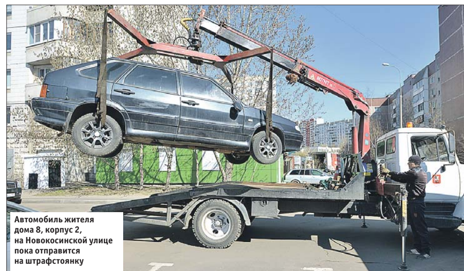
Автомобиль жителя дома 8, корпус 2, на Новокозинской улице пока отправится на штрафстоянку