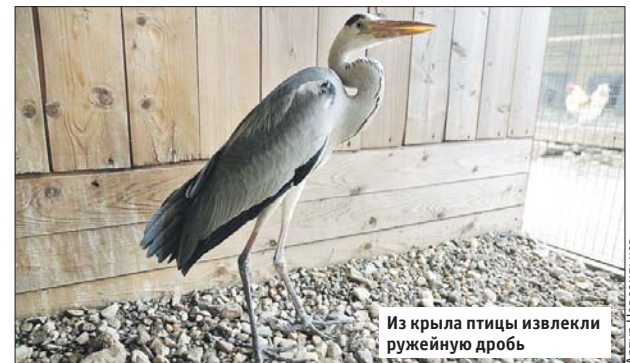
Из крыла птицы извлекли ружейную дробь