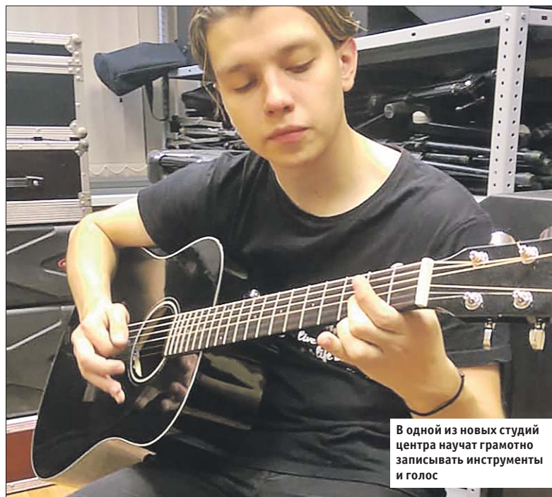
В одной из новых студий центра научат грамотно записывать инструменты и голос

— Студийцы получают базовые знания о природе звука и законах акустики, научатся правильно записывать музыкальные инструменты и голос, поработают с современным оборудованием и получают практические навыки ведения живых концертов,