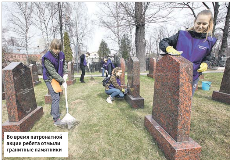
Во время патронатной акции ребята отмыли гранитные памятники