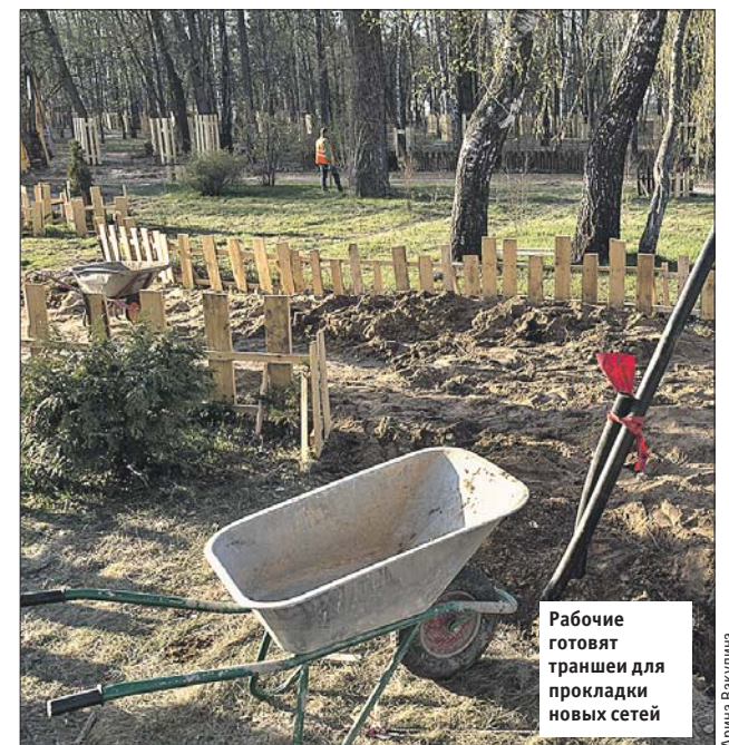
Рабочие готовят траншеи для прокладки новых сетей