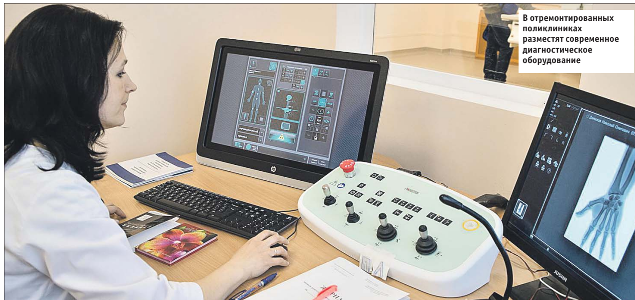
В отремонтированных поликлиниках разместят современное диагностическое оборудование

Кроме того, при реализации нового стандарта будут стремиться к тому, чтобы кабинеты узких специалистов располагались на одном этаже с кабинетами врачей функциональной диагностики. Например, пациен-