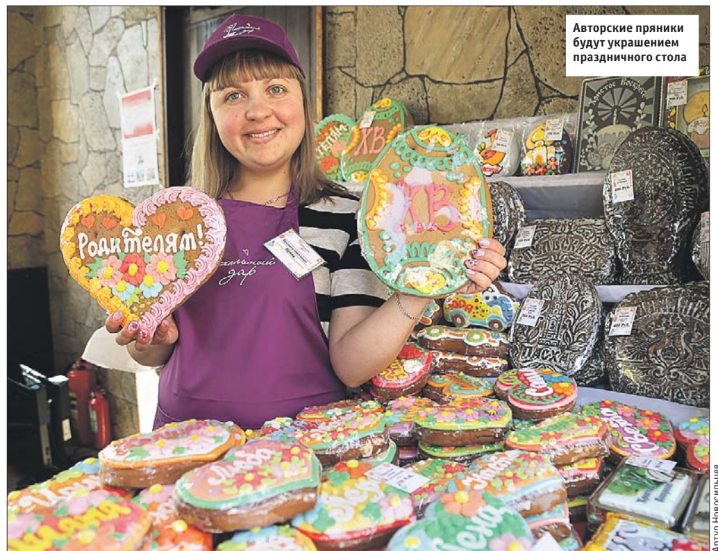
Авторские пряники будут украшением праздничного стола

Подробное расписание «Пасхального дара» — на сайте moscowseasons.com