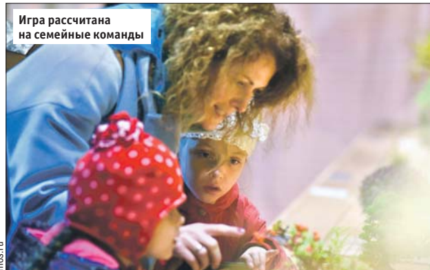
Игра рассчитана на семейные команды

Начало в 12.00 на площадке «У тайного холма», в 300 метрах от входа в Измайловский лесопарк с 5-й Парковой улицы. Тел. (499) 367-8918