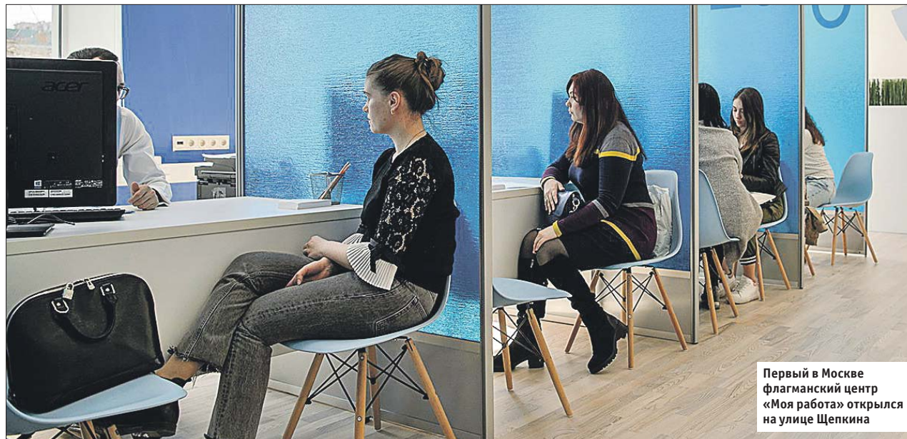
Первый в Москве флагманский центр «Моя работа» открылся на улице Щепкина

Состоять она будет из трёх основных элементов: — обычных центров занятости, которые теперь будут располагаться не в старых помещениях, а в комфортных офисах «Мои документы»; — флагманских офисов «Моя работа» с рас-