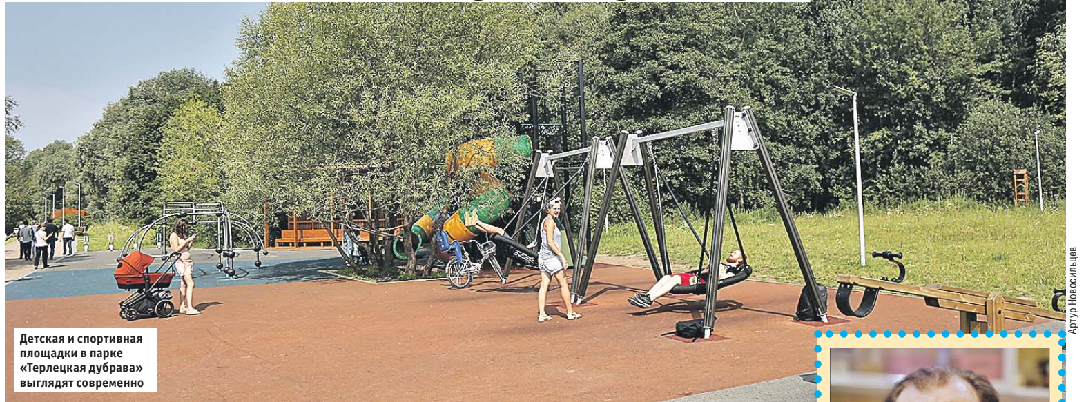
Детская и спортивная площадки в парке «Терлецкая дубрава» выглядят современно

Во время реконструкции построены восемь пешеходных переходов: три подземных (ш. Энтузиастов, 74/2, 82/2, 98) и пять надземных (ш. Энтузиастов, 16, 64/2, 86, корп. 1, 88; ул. Магнитогорская, 2).