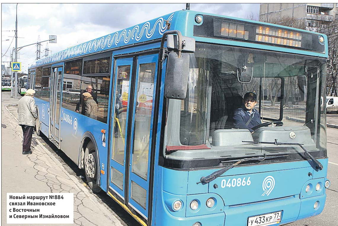
Новый маршрут №884 связал Ивановское с Восточным и Северным Измайловом

— Хотелось бы и в нашем районе получить ярмарку с развлечениями в виде средневекового замка. Такую уже построили в соседнем Новокосине. И для неё есть место: можно для этого использовать территорию за магазином «Перекрёсток» на улице Магнитогорской, 2.