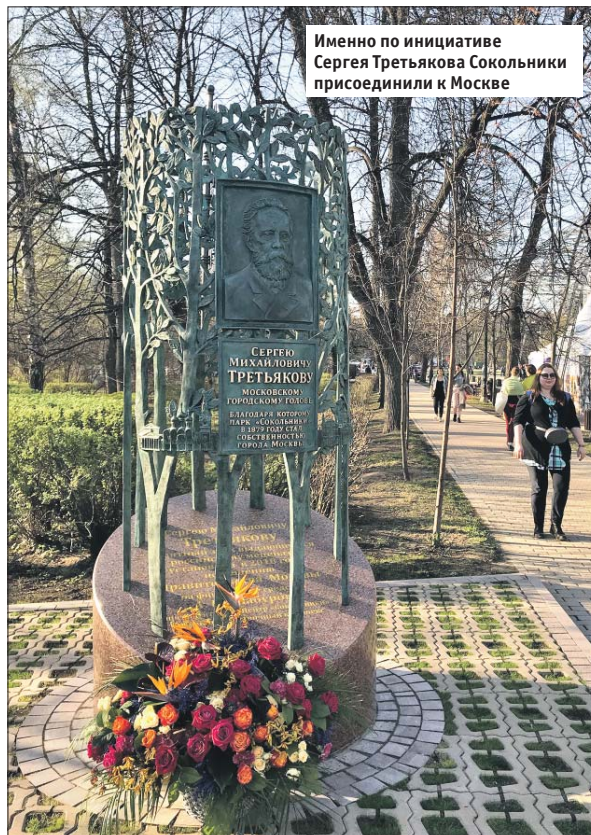
Именно по инициативе Сергея Третьякова Сокольники присоединили к Москве