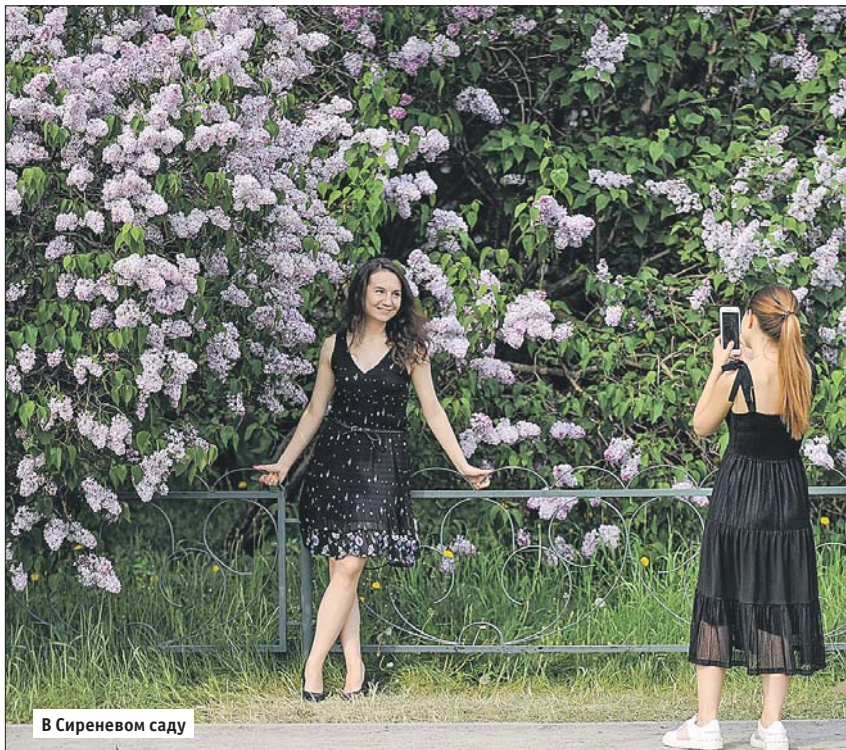
В Сиреневом саду