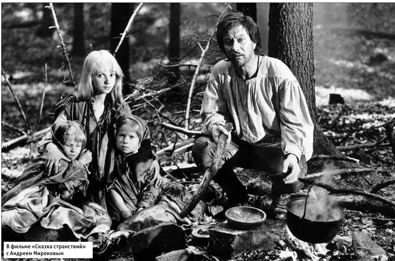
В фильме «Сказка странствий» с Андреем Мироновым

развивать нашу студию, по парку вечером даже ходить было страшно. Было темно, и за кустами прятались какие-то криминальные люди. Дорога была такой неприятной, что я даже детей поодиночке не отпускала: собирались вместе и шли до метро. Теперь тут всё по-другому.