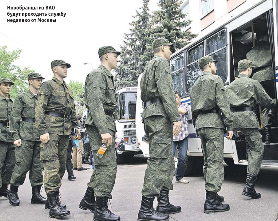
Новобранцы из ВАО будут проходить службу недалеко от Москвы

Призывная комиссия учитывает пожелания ребят