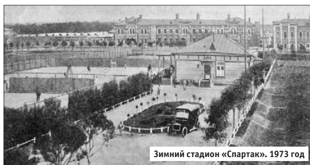
Зимний стадион «Спартак». 1973 год