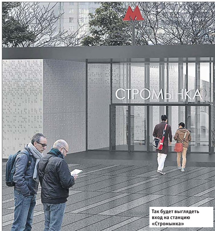
Так будет выглядеть вход на станцию «Стромынка»

В рамках программы «Мой район» прошло комплексное благоустройство улиц Стромынки и Русаковской. Вдоль них заменили или обновили пешеходные зоны и тротуары. Проезжую часть расширили на две полосы. Были отремонтированы фасады 12 жилых домов. В зданиях на улицах, где шла реконструкция, поменяли деревянные оконные блоки на пластиковые рамы.