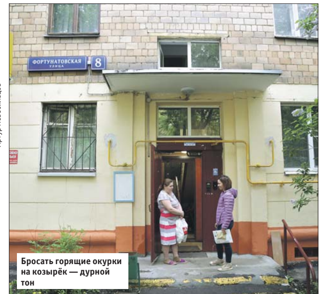
Бросать горящие окурки на козырёк — дурной тон

Ремонтно-эксплуатационное управление №20 района Соколиная Гора: ул. Зверинецкая, 25, тел. (499) 369-1145. Эл. почта: reu-20@mail.ru