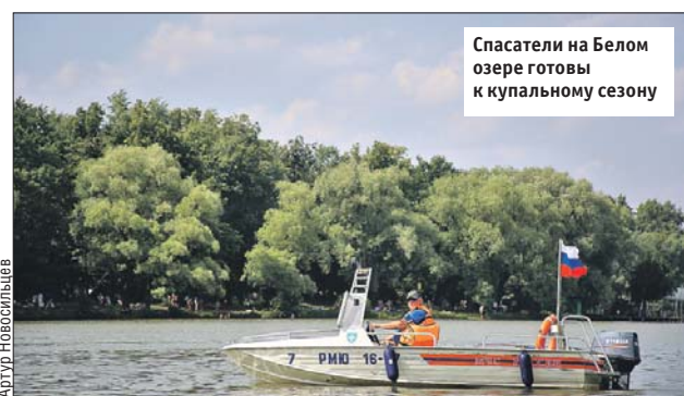
Спасатели на Белом озере готовы к купальному сезону

— Криминалисты не выявили признаков насильственной смерти. Скорее всего, человек был в состоянии алкогольного опьянения и погиб по неосторожности, — сообщил начальник 1-го региональ-