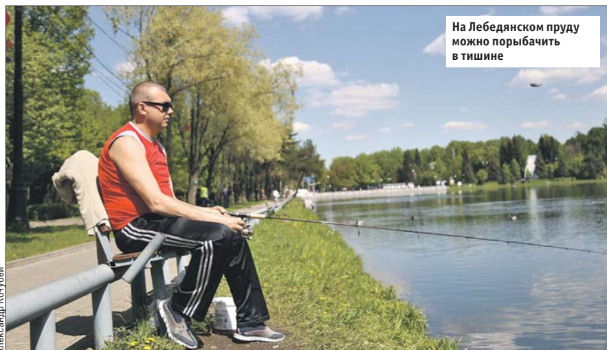
На Лебедянском пруду можно порыбачить в тишине

Жители четырёх районов Восточного округа могут повлиять на формирование проекта благоустройства зоны отдыха «Лебедянские пруды» в Измайловском парке: в «Активном гражданине» стартовало новое голосование. Принять в нём участие могут москвичи из Восточного Измайлова, Ивановского, Измайлова и Новогиреева.