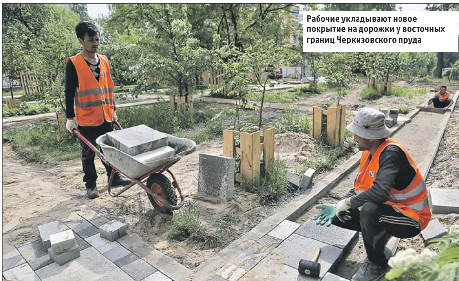
Рабочие укладывают новое покрытие на дорожки у восточных границ Черкизовского пруда