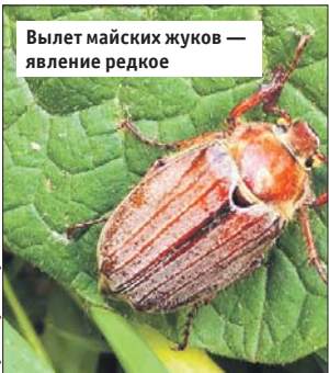
Вылет майских жуков — явление редкое