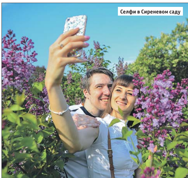
Селфи в Сиреновом саду