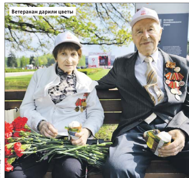
Ветеранам дарят цветы