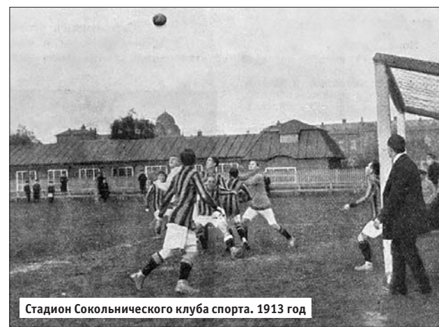
Стадион Сокольнического клуба спорта. 1913 год

пионами мира и Европы. В манеже, построенном в 1970 году, можно проводить соревнования по различным видам спорта.