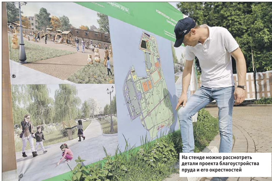
На стенде можно рассмотреть детали проекта благоустройства пруда и его окрестностей

По просьбам горожан набережную Шитова пре-