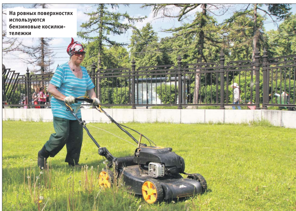
На ровных поверхностях используются бензиновые косилки-тележки