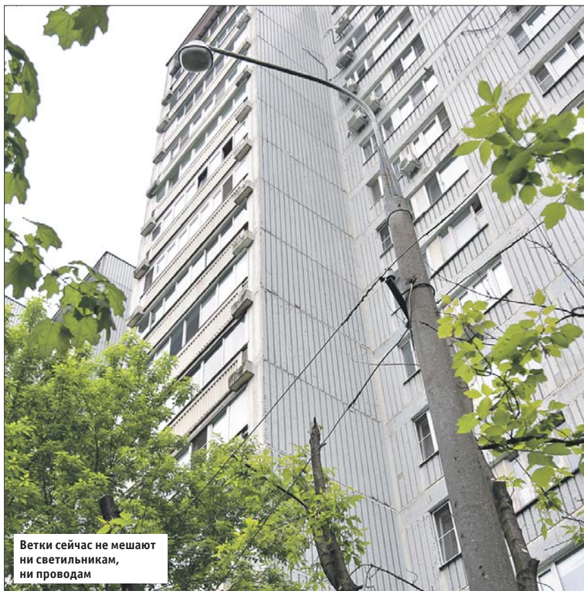
Ветки сейчас не мешают ни светильникам, ни проводам