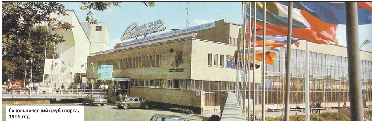
Сокольнический клуб спорта. 1909 год

Сейчас по адресу: Строммынка, 4, находится Олимпийский центр им. братьев Знаменских, основанный в 1961 году и названный в честь знаменитых советских бегунов, спортсменов-спартаковцев Георгия и Серафима Знаменских. В спортивной школе культивируются все олимпийские виды лёгкой атлетики: спринтерский бег, бег на средние и длинные дистанции, барьерный бег, прыжки в высоту и в длину, тройной прыжок, прыжки с шестом, метание диска и копья, толкание ядра, спортивная ходьба и многоборье. Лучшие из воспитанников центра стали олимпийскими чемпионами, чем-