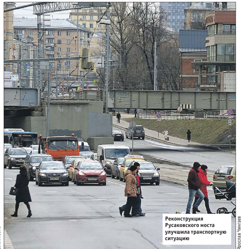
Реконструкция Русаковского моста улучшила транспортную ситуацию