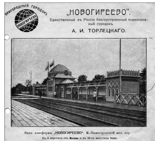
Вид платформы „НОВОГИРЕЕВО“, М.-Нижегородской жел. дор. В 8 верстах от Москвы и в 30-ти минутах езды.