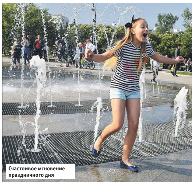
Счастливые мгновения праздничного дня