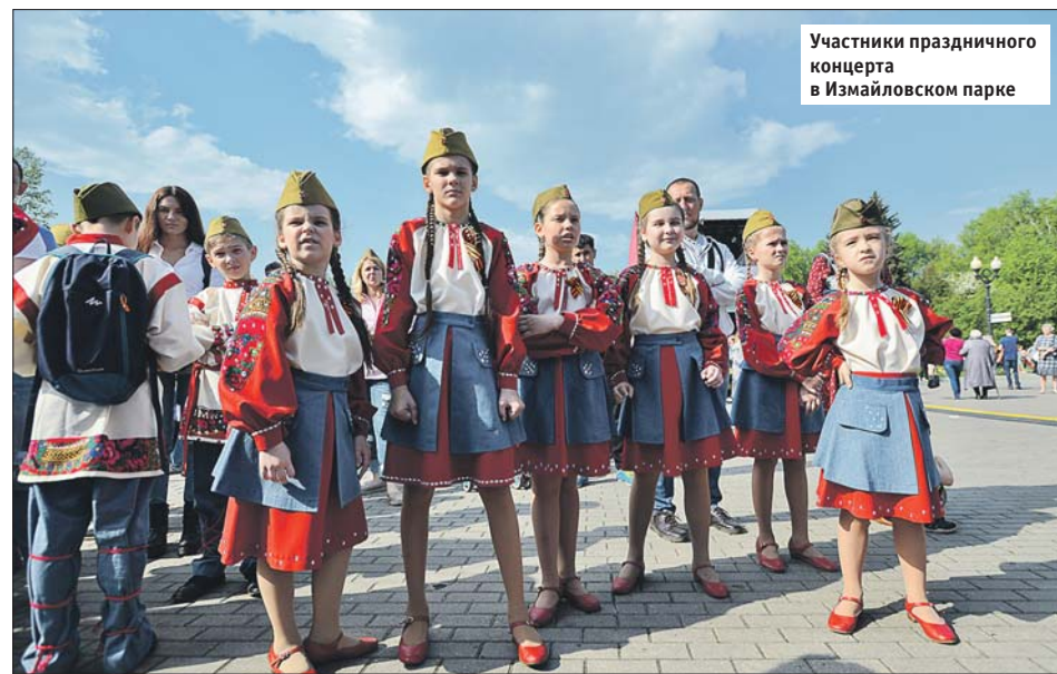
Участники праздничного концерта в Измайловском парке