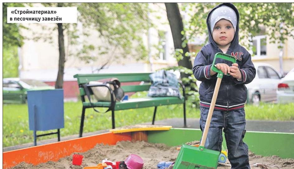
«Стройматериал» в песочницу завезён

Управа района Новогиреево: Зелёный просп., 20, тел. (495) 302-6234. Эл. почта: novogir@vao.mos.ru , novogir_priem@vao.mos.ru