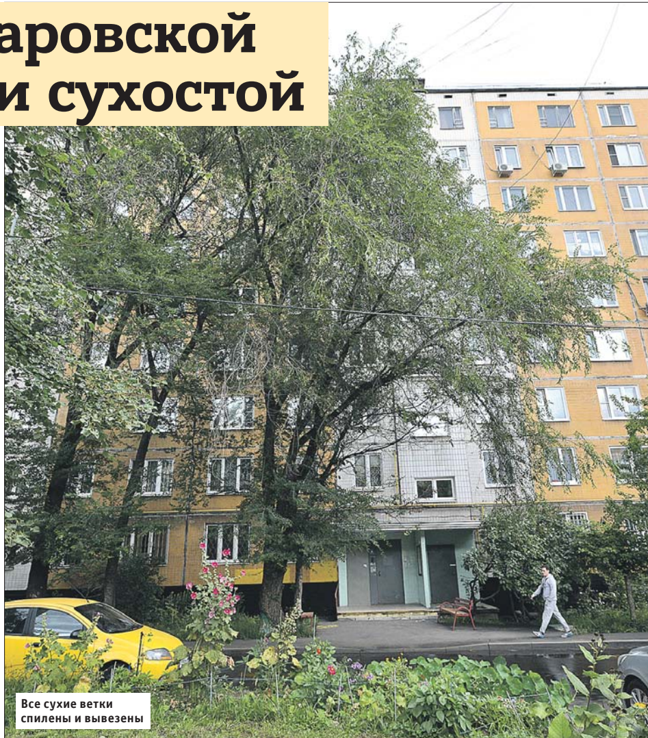
Все сухие ветки спилены и вывезены

Управа района Гольяново: ул. Курганская, 8, тел. (495) 467-6584. Сайт: golyanovo.mos.ru