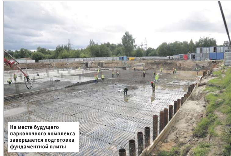
На месте будущего парковочного комплекса завершается подготовка фундаментной плиты