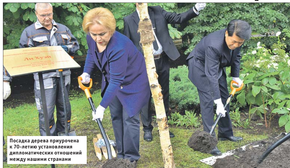
Посадка дерева приурочена к 70-летию установления дипломатических отношений между нашими странами