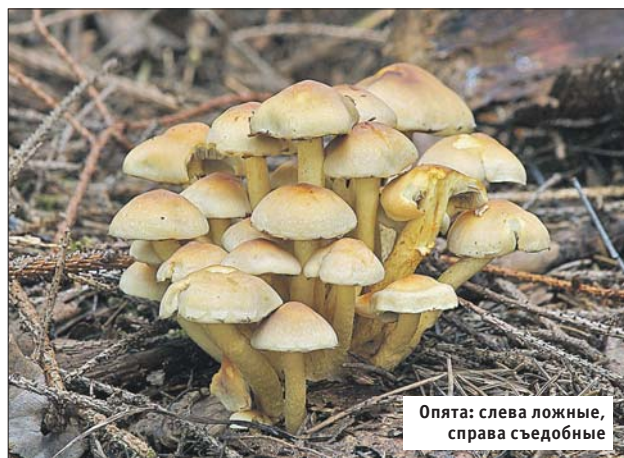
Опята: слева ложные, справа съедобные