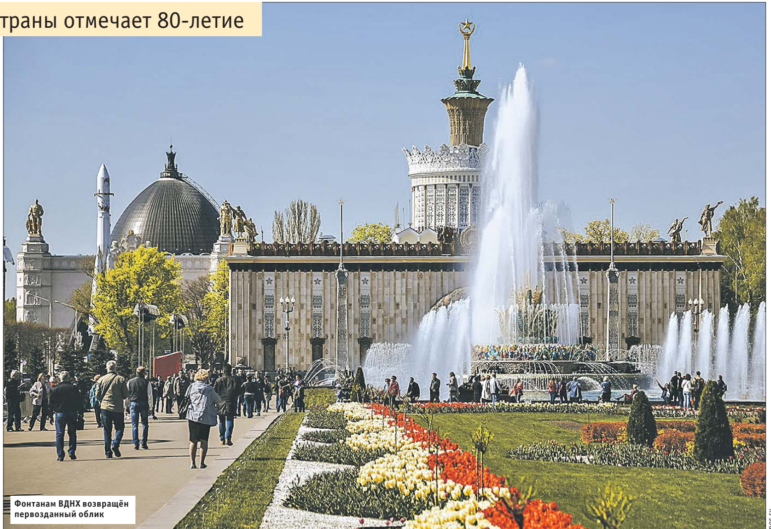
Фонтанам ВДНХ возвращён первозданный облик

Как отметили в пресс-службе ВДНХ, чтобы вернуть выставке