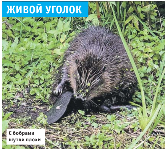
С бобрами шутки плохи