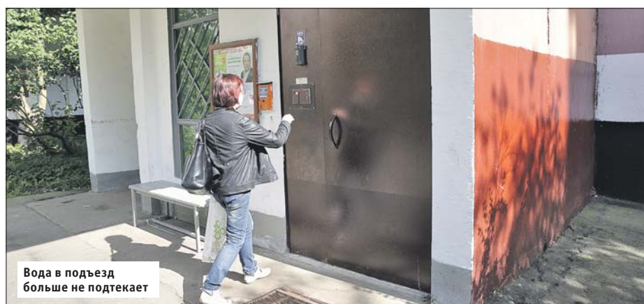
Вода в подъезд больше не подтекает

Управа района Новокосино: ул. Суздальская, 20, тел. (495) 701-4465. Сайт: novokosino.mos.ru . ГБУ «Жилищник района Новокосино»: ул. Суздальская, 34а, тел. (495) 701-0735. Сайт: gbunovokosino.ru