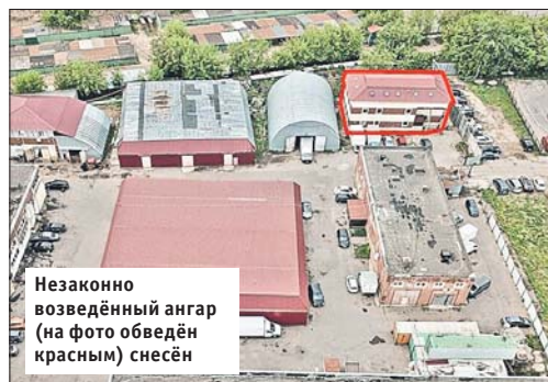
Незаконно возведённый ангар (на фото обведён красным) снесён