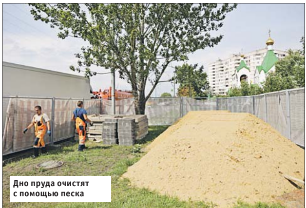
Дно пруда очистят с помощью песка