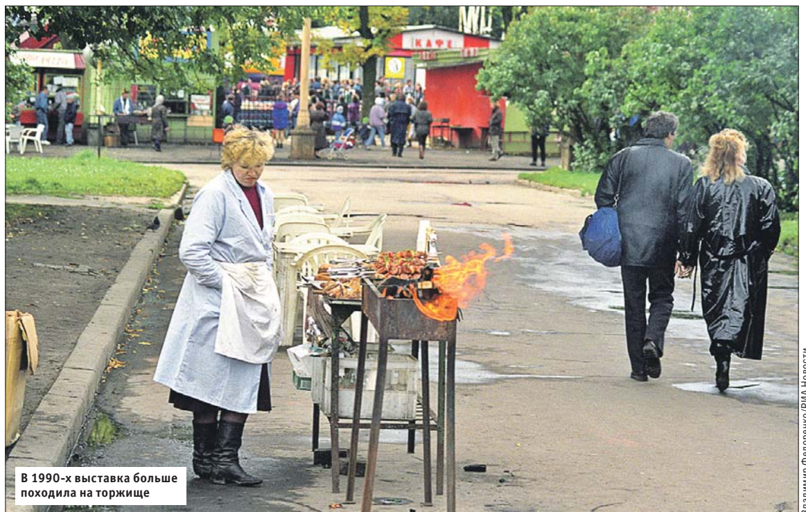
В 1990-х выставка больше походила на торжище

Работы по восстановлению ВДНХ ещё не закончены, но