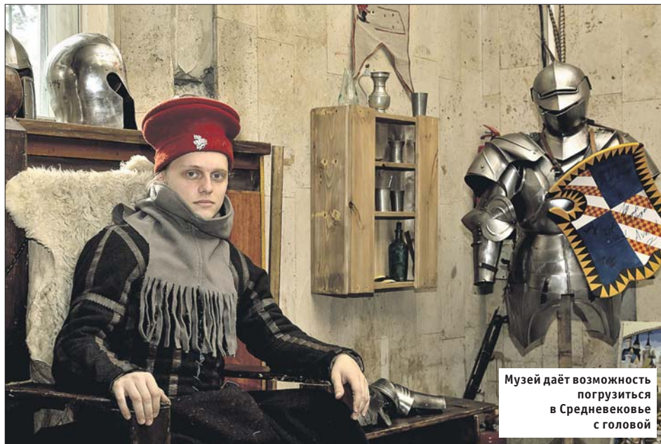
Музей даёт возможность погрузиться в Средневековье с головой

— Слово сочетание «современное рыцарство» звучит несколько странно, — говорит специалист по культмассовой работе