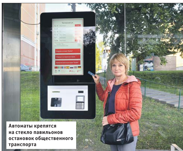
Автоматы крепятся на стекло павильонов остановок общественного транспорта