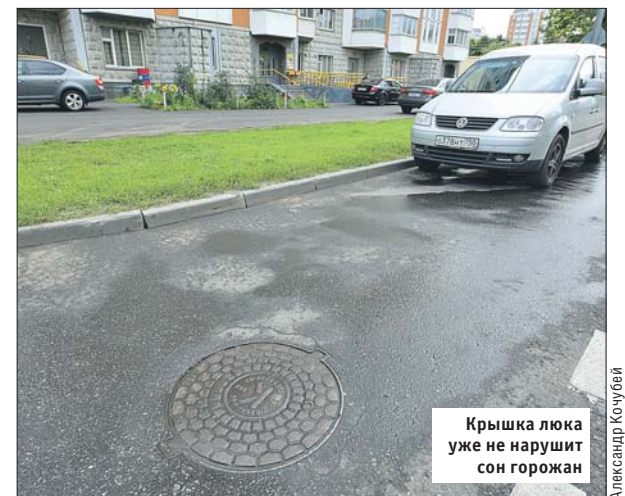
Крышка люка уже не нарушит сон горожан

Управа района Гольяново: ул. Курганская, 8, тел. (495) 467-6584. Эл. почта: gol@vao.mos.ru