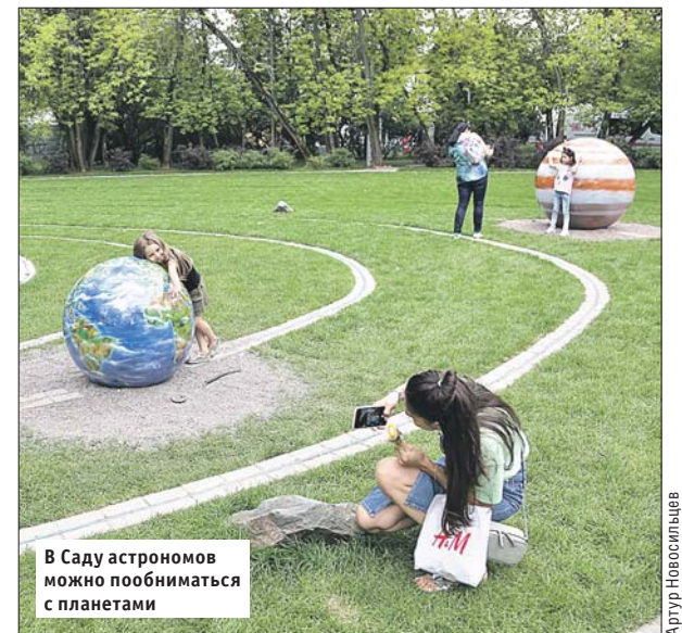
В Саду астрономов можно пообщаться с планетами