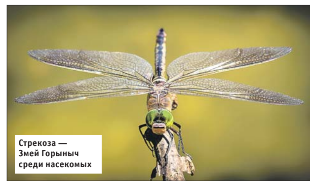
Стрекоза — Змей Горыныч среди насекомых

Место встречи: детская площадка «У тайного холма» на входе в лесопарк с 5-й Парковой улицы. Тел. для справок и регистрации (499) 367-8918