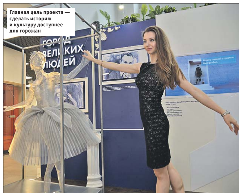
Главная цель проекта — сделать историю и культуру доступнее для горожан