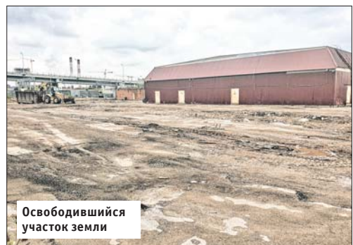
Освободившийся участок земли