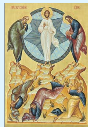
Икона «Преображение Господне»

Есть в этом месяце ещё один праздник такого же ранга — Успение Пресвятой Богородицы, приходящийся на 28 августа. А вот так называемые Медовый и Ореховый Спасы — это праздники меньшего значения: Происхождение Честных Древ Животворящего Креста