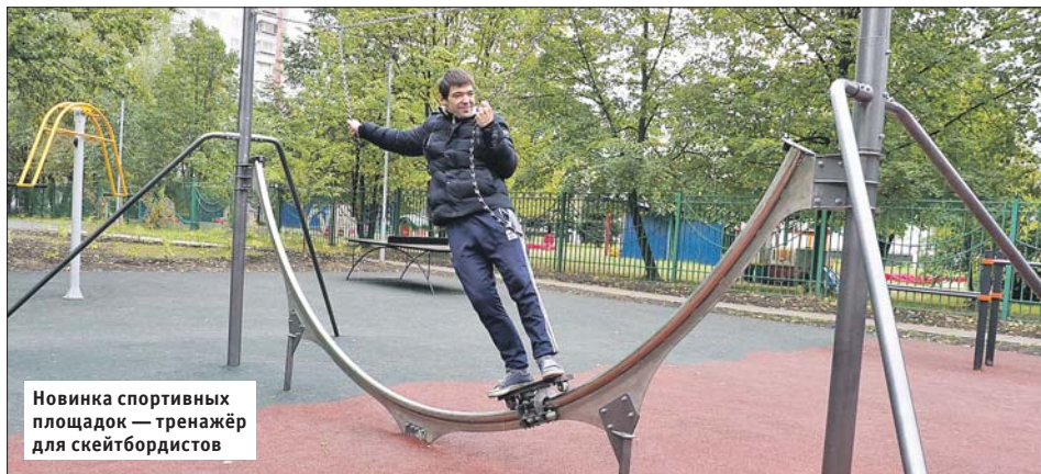
Новинка спортивных площадок — тренажёр для скейтбордистов

Все остальные дворовые территории также благоустроивали с учётом мнения жителей. Например, по их просьбам на игровых и спортивных площадках было уложено безопасное покрытие из