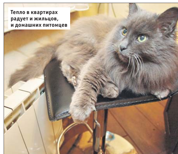
Тепло в квартирах радует и жильцов, и домашних питомцев

Горячая линия МОЭК: (495) 539-5959. Круглосуточная городская горячая линия: 8-800-100-2329