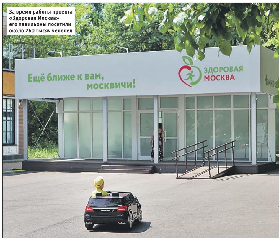
За время работы проекта «Здоровая Москва» его павильоны посетили около 260 тысяч человек

— В снижении веса самое главное — дисциплина. Питание — правильное, дробное, три-четыре раза в день с суммарной калорийностью примерно 1200 ккал, как можно больше двигательной активности. При соблюдении этих нехитрых правил видимый результат будет уже через две недели.