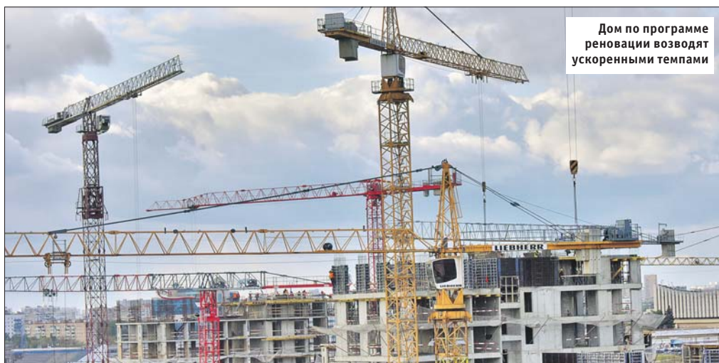
Дом по программе реновации возводят ускоренными темпами