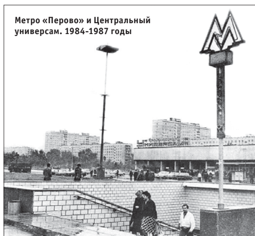
Метро «Перово» и Центральный универсам. 1984-1987 годы