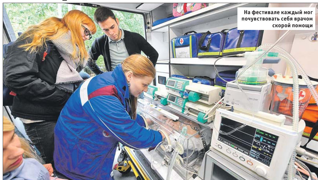
На фестивале каждый мог почувствовать себя врачом скорой помощи

В парке «Сокольники» прошёл фестиваль, посвящённый 100-летию станции скорой и неотложной медицинской помощи им. Пучкова. Гости фестиваля ознакомились с фотовыставкой «100 лет московской скорой», осмотрели выставку редких исторических и современных автомобилей скорой помощи. Врачи рассказали, как узнавать симптомы и принимать решения, от которых часто зависит жизнь человека.