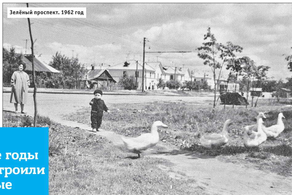
Зелёный проспект. 1962 год

Большинство поселковых построек были деревянными, но в первые послевоенные годы Перово превратилось в большую строительную площадку. Новые капитальные здания возводили при уча-