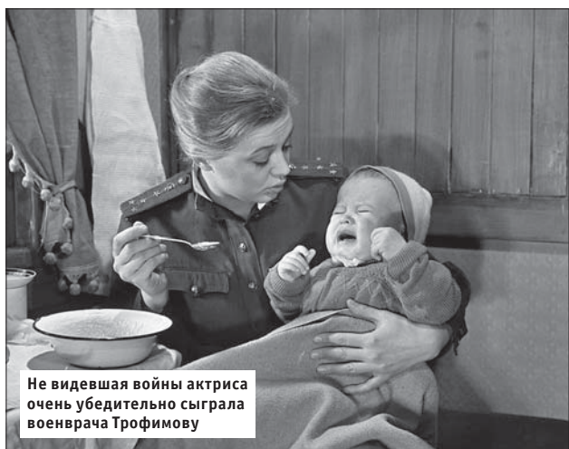
Не видевшая войны актриса очень убедительно сыграла военврача Трофимову