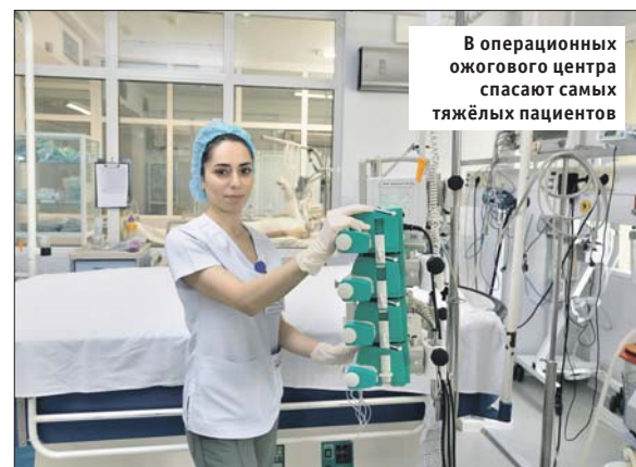
В операционных ожогового центра спасают самых тяжёлых пациентов