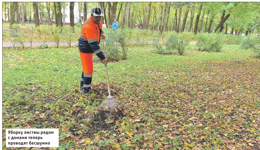
Уборку листвы рядом с домами теперь проводят бесшумно

Управа района Гольяново: ул. Курганская, 8, тел. (495) 467-6584. Сайт: golyanovo.mos.ru