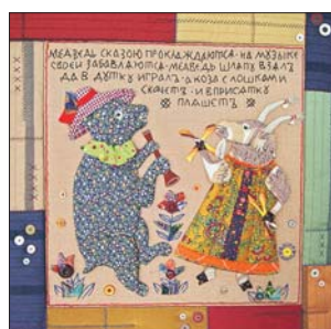
Типичный лубок, только из лоскутов

работы с тканью. Это роспись, вышивка, аппликация.