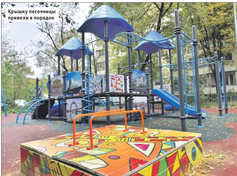
Крышку песочницы привели в порядок

? Треснул край крышки песочницы на детской площадке во дворе между домами 25 и 27 на Русаковской улице. Крышка очень тяжёлая, поднимать её в таком состоянии опасно, можно поранить руки.