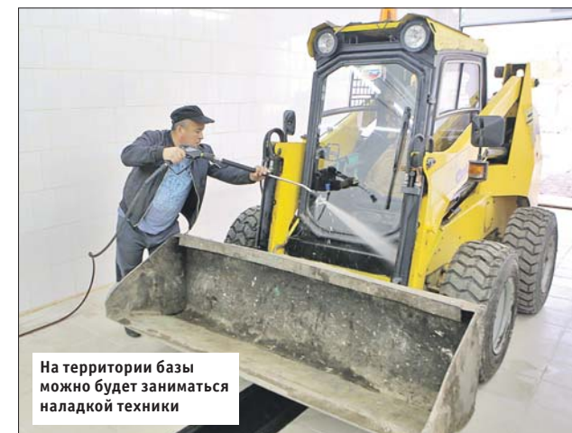
На территории базы можно будет заниматься наладкой техники