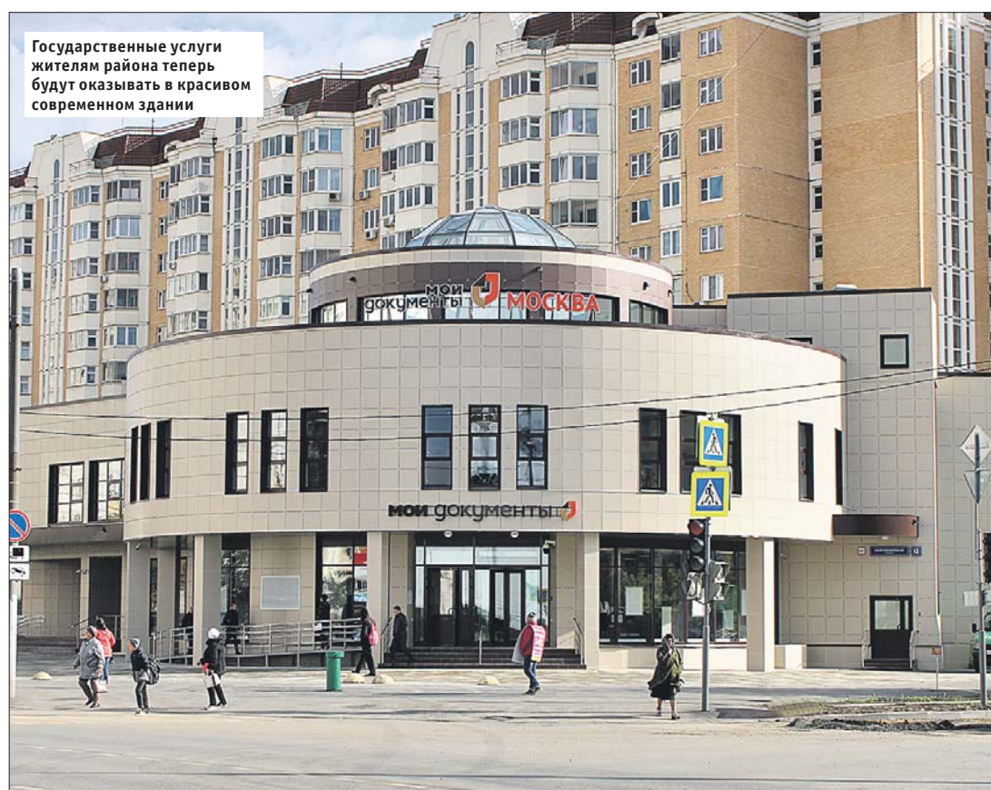
Государственные услуги жителям района теперь будут оказывать в красивом современном здании

В новом помещении МФЦ открыто 54 окна для приёма посетителей