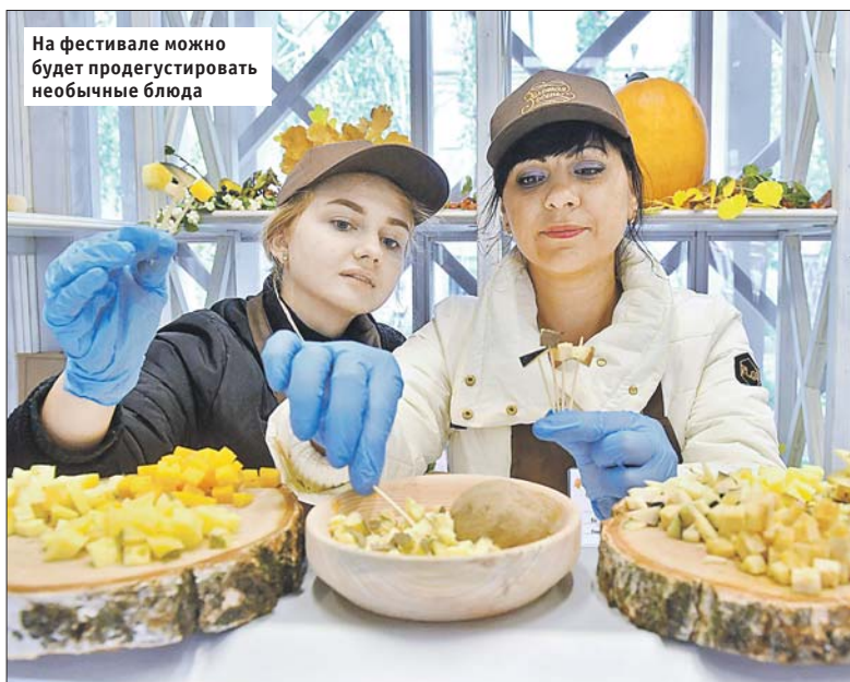
На фестивале можно будет продегустировать необычные блюда

На концертах гостей фестиваля порадуют игрой на старинных инструментах