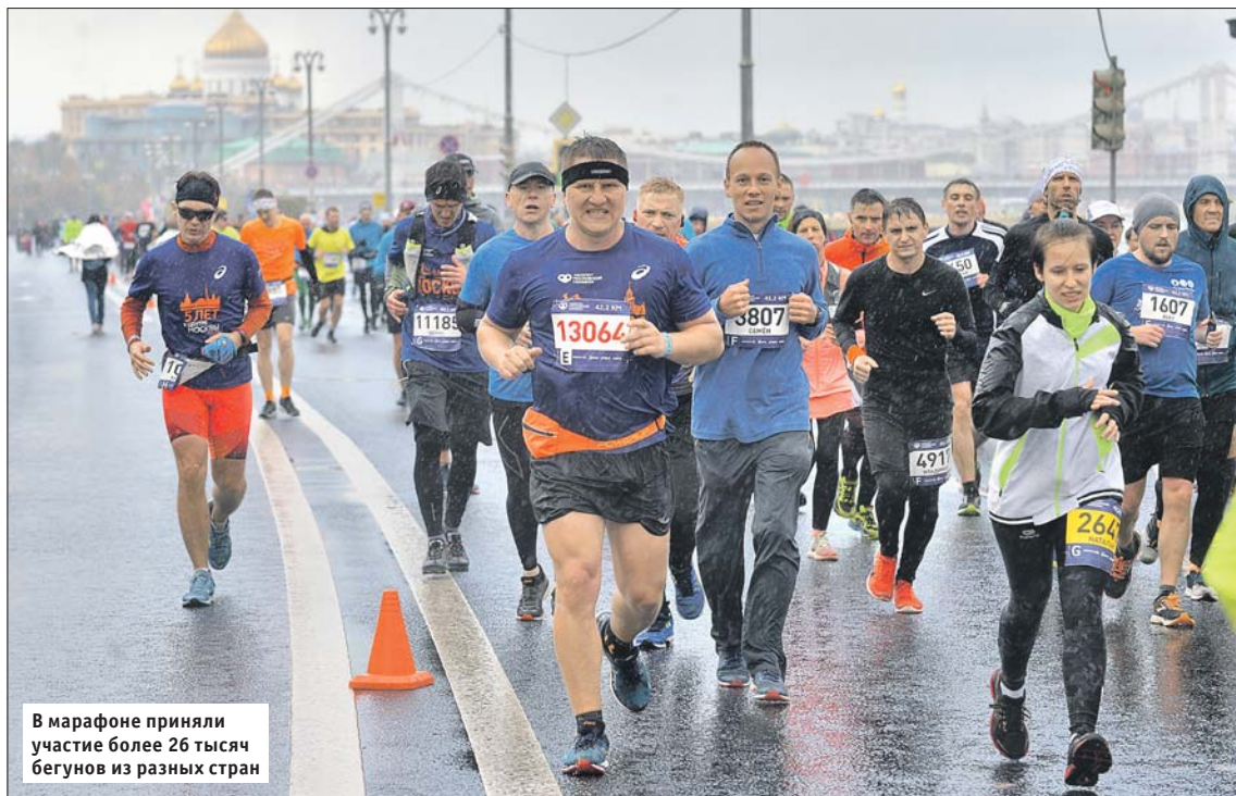
В марафоне приняли участие более 26 тысяч бегунов из разных стран