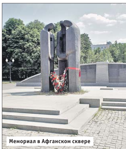
Мемориал в Афганском сквере