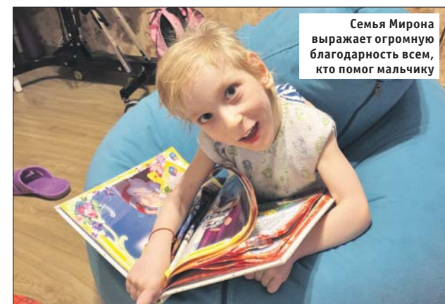
Семья Мирона выражает огромную благодарность всем, кто помог мальчику