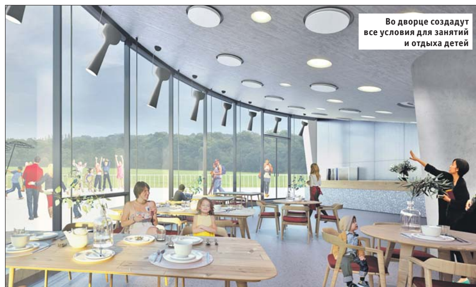
Во дворце создадут все условия для занятий и отдыха детей