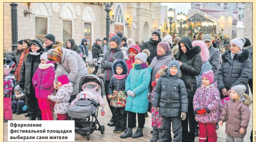
Оформление фестивальном площадки выбирали сами жители

в ходе голосования на портале «Активный гражданин». Её создали в стиле традиционной архитектуры Крыма — с ажурными башенками, фигурными арками и скульптурами львов. В центре — стилизованный маяк, а на прогулочной территории — копия севастьяпольского памятника затопленным кораблям.