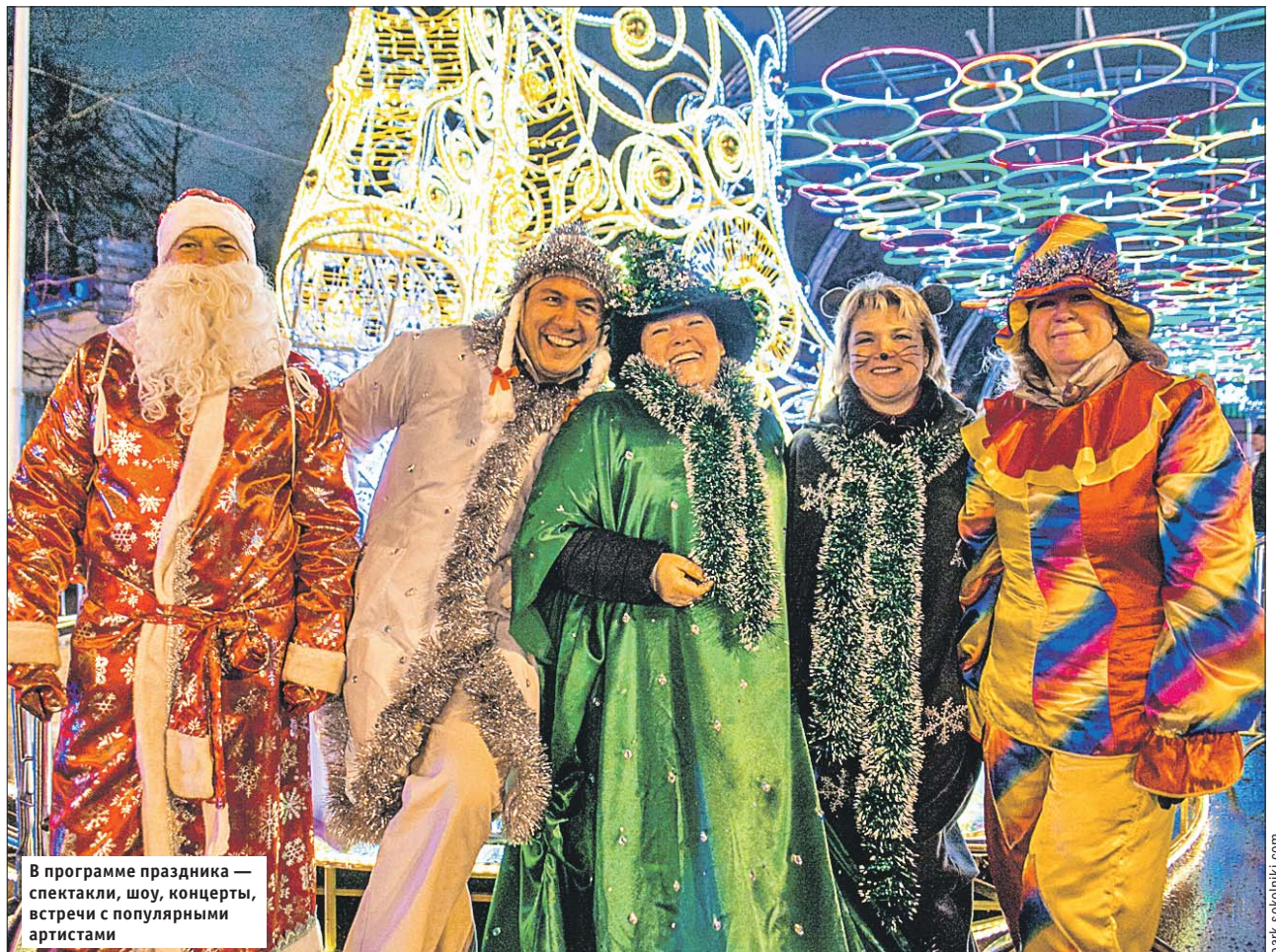
В программе праздника — спектакли, шоу, концерты, встречи с популярными артистами