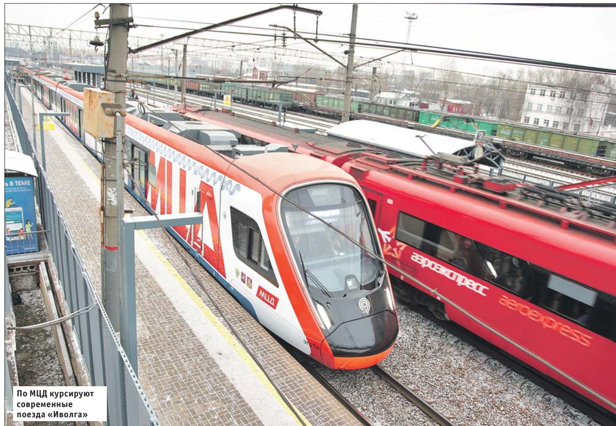
По МЦД курсируют современные поезда «Иволга»

— В пятёрку самых востребованных станций, до которых пассажиры строят свой маршрут, входят Курская, Баковка, Шереметьевская, Тушинская и Царицыно, — рассказали в пресс-службе столичного Департамента транспорта.