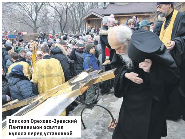
Епископ Орехово-Зуевский Пантелеимон освятил купола перед установкой

На храм Святого князя Владимира в Новогирееве установили купола с крестами. Освятил купола перед установкой епископ Орехово-Зуевский Пантелеимон, викарий Патриарха Московского и всея Руси по Восточному округу.