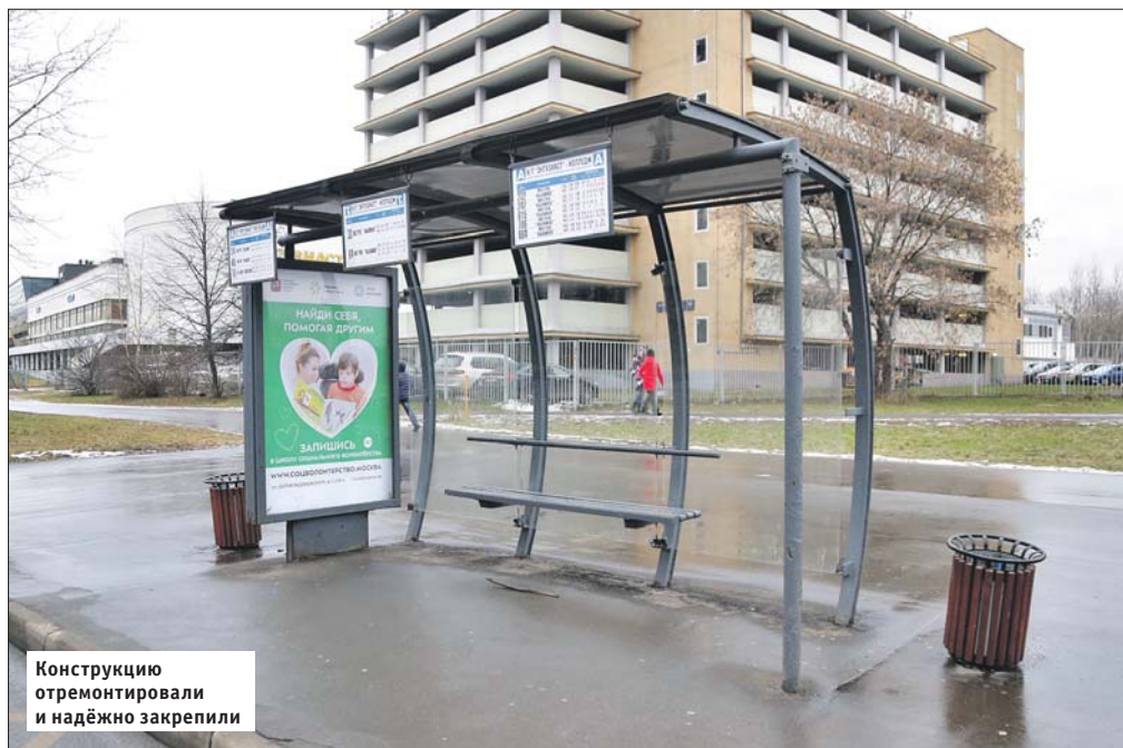
Конструкцию отремонтировали и надёжно закрепили