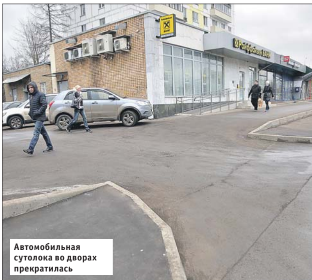
Автомобильная сутолока во дворах прекратилась

Управа района Перово: Зелёный просп., 20, тел. (495) 302-0543. Эл. почта: per_priem@vao.mos.ru