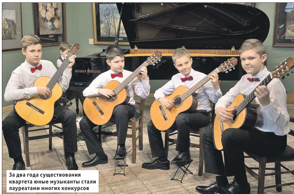
За два года существования квартета юные музыканты стали лауреатами многих конкурсов