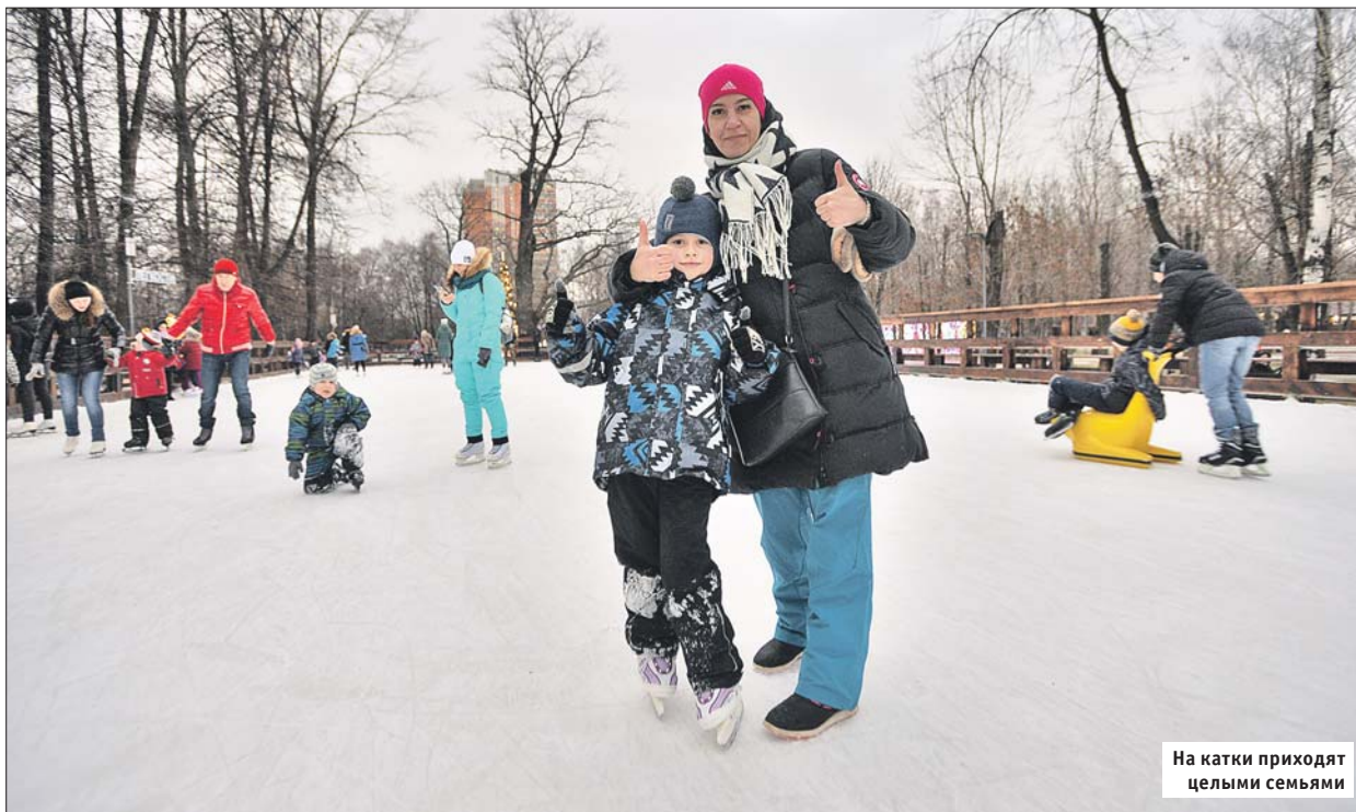
На катки приходят целыми семьями