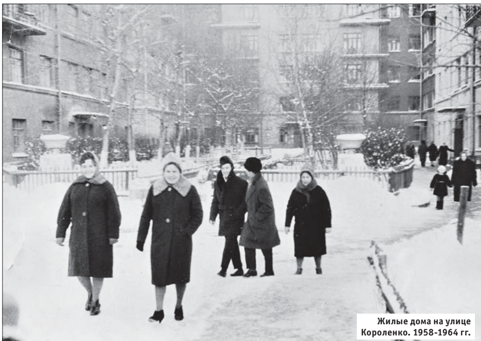
Жилые дома на улице Короленко. 1958-1964 гг.