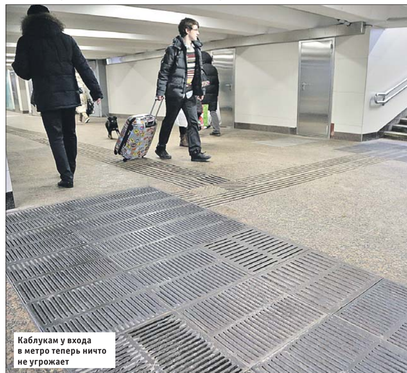
Каблукам у входа в метро теперь ничто не угрожает