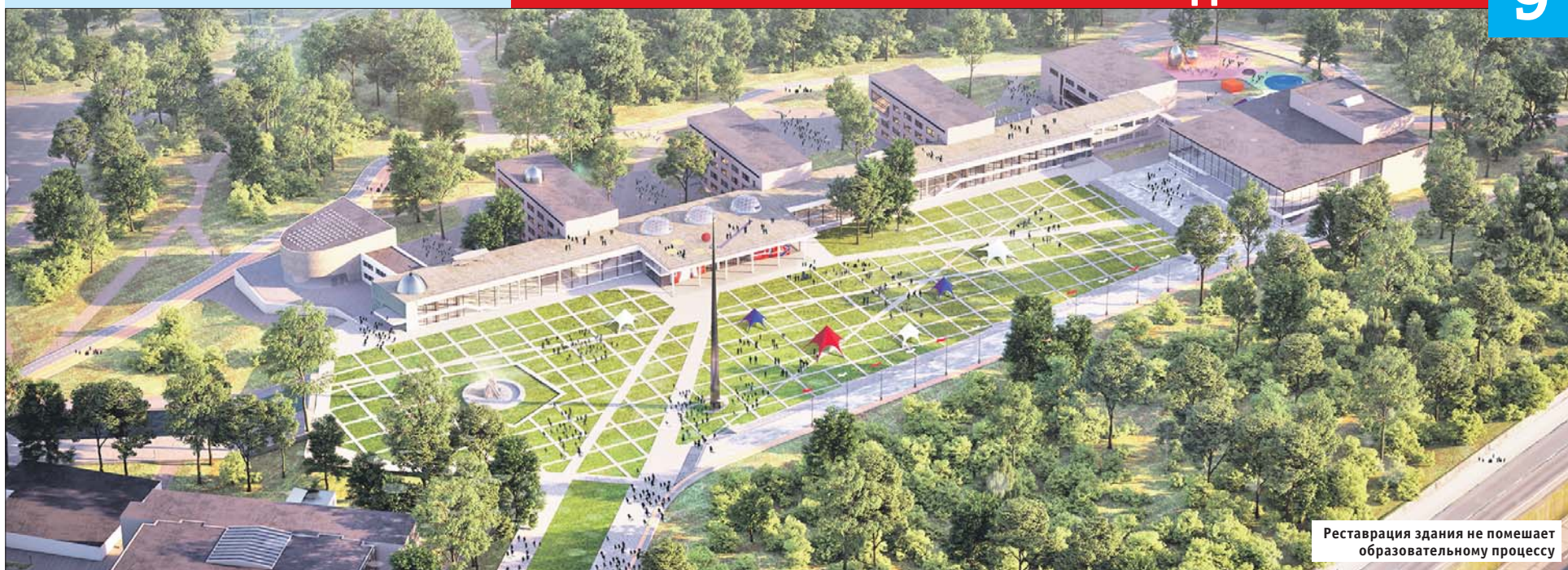
Реставрация здания не помешает образовательному процессу