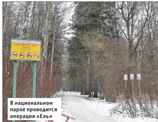
В национальном парке проводится операция «Ель»