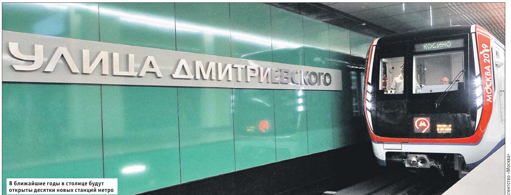
В ближайшие годы в столице будут открыты десятки новых станций метро