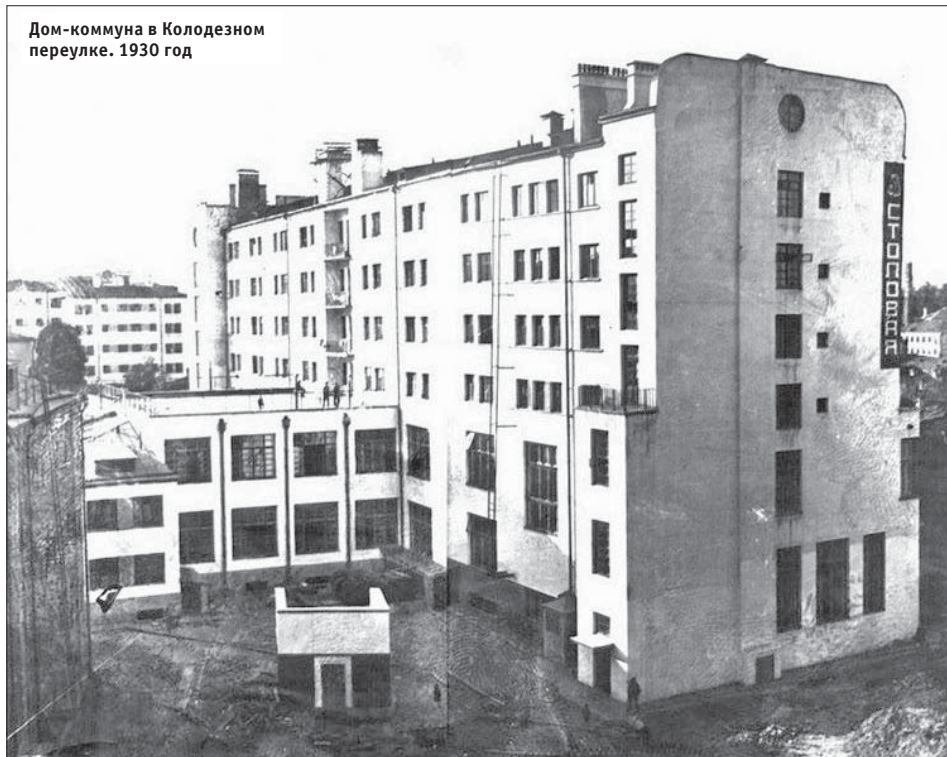
Дом-коммуна в Колодезном переулке. 1930 год