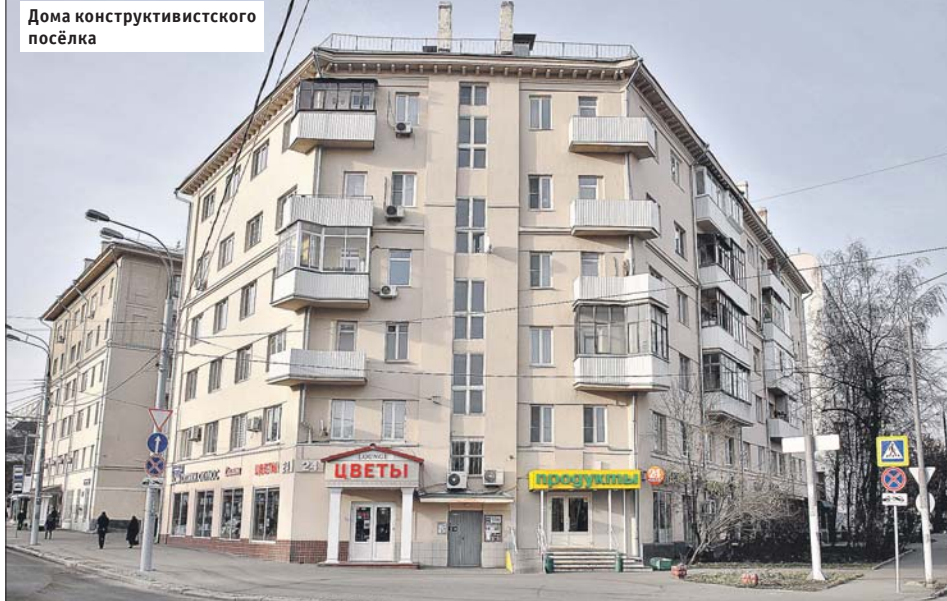
Дома конструктивистского посёлка

Владимир Маяковский. Конструктивизм в архитектуре характеризуется строгостью, лаконичностью форм, монументальностью внешнего облика зданий. Дома рабочего городка были построены на улицах Короленко и Стромынке, на Колодезной улице, в Колодезном переулке. Самое большое здание возвели в 1927 году в Колодезном переулке (дом 14) с коридорной планировкой жилых секций и столовой на 1-м и 2-м этажах. Это