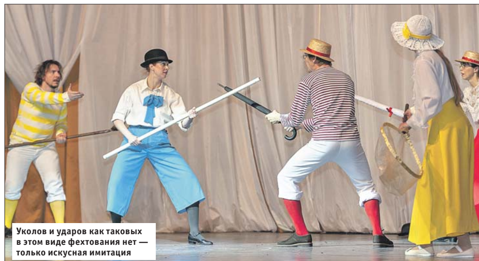
Уколов и ударов как таковых в этом виде фехтования нет — только искусная имитация

— Артистическое фехтование — спортивная дисциплина, часть фехтовального спорта, — говорит Зыков. — Это маленький, на несколько минут, костюмированный спектакль, поставленный по какому-либо фильму, литературному произведению и так далее. Главная часть спектакля — поединок. Соответственно, в отличие от спортивного фехтования участники поединка тут