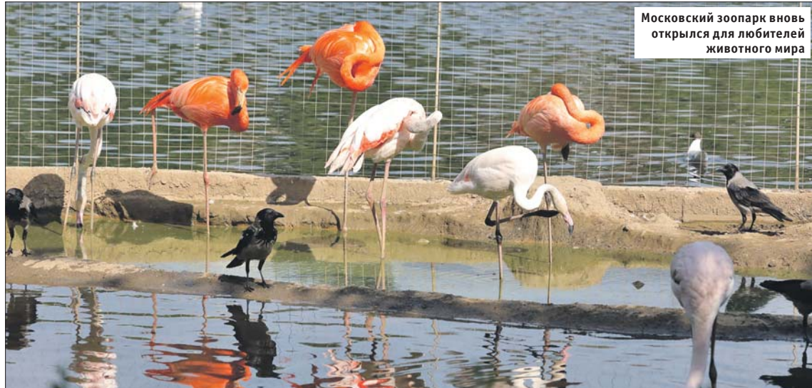
Московский зоопарк вновь открылся для любителей животного мира