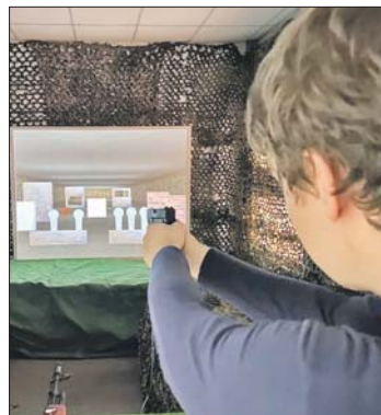
Стреляют в интерактивном тире из точных аналогов боевого оружия