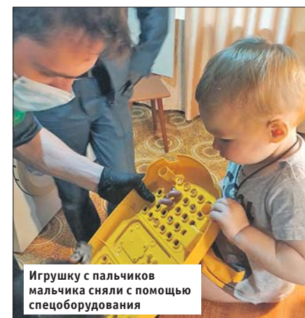
Игрушку с пальчиков мальчика сняли с помощью спецоборудования