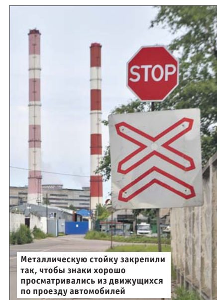
Металлическую стойку закрепили так, чтобы знаки хорошо просматривались из движущихся по проезду автомобилей