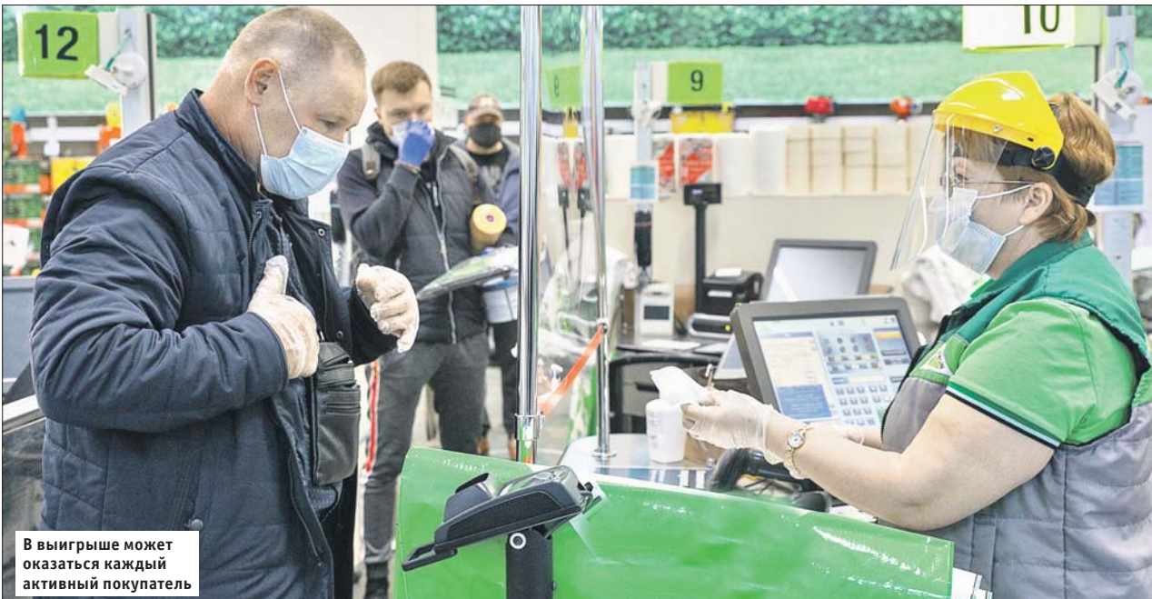
В выигрыше может оказаться каждый активный покупатель

Бизнес и власти разыграют подарочные сертификаты, чтобы горожане смогли купить больше товаров