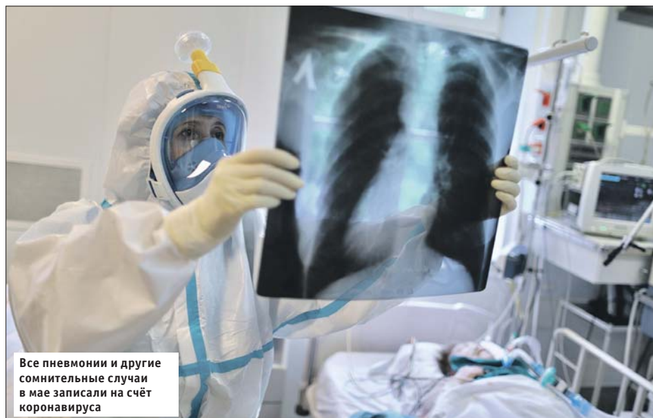
Все пневмонии и другие сомнительные случаи в мае записали на счёт коронавируса

да оставались свободные койки для новых пациентов. Город был готов к худшему сценарию, который, к счастью, не реализовался.