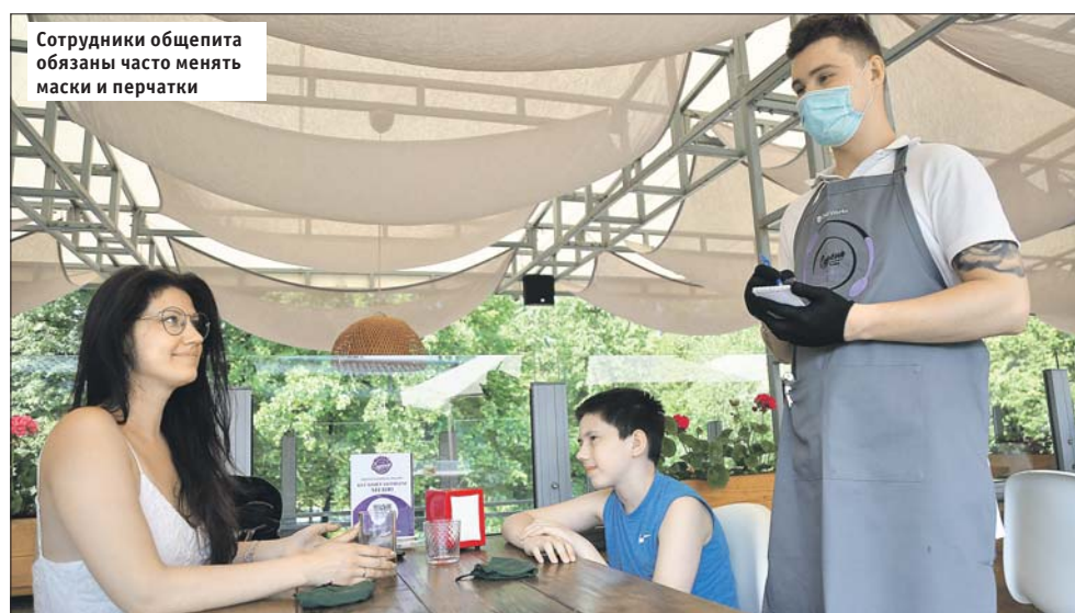
Сотрудники общепита обязаны часто менять маски и перчатки