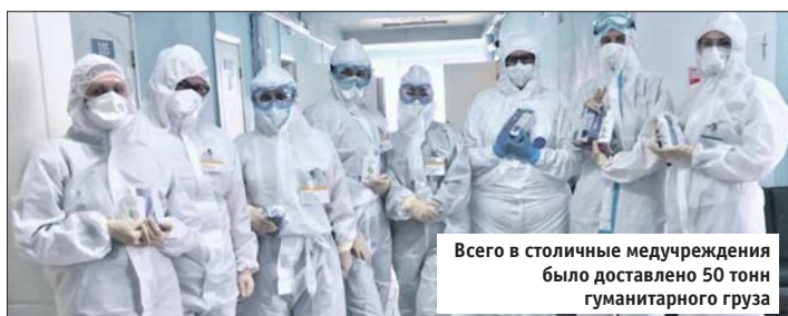
Всего в столичные медучреждения было доставлено 50 тонн гуманитарного груза

В течение месяца в рамках акции «Мы вместе» территориальная организация профсоюза учреждений здравоохранения ВАО доставила в поликлиники №191, 66, 64, 69, 175, консультативно-диагностический центр №2 средства личной гигиены: кремы для рук, лица, гели и шампуни. Это особенно актуально для тех медицинских работников, которые ежедневно работают в масках и в комбинезонах. Ак-