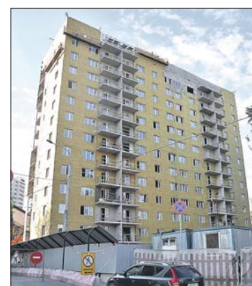
Строители прокладывают коммуникации и занимаются отделкой фасада

В сообщении уточняется, что около нового дома пройдёт благоустройство. На территории оборудуют детскую и спортивную площадки.