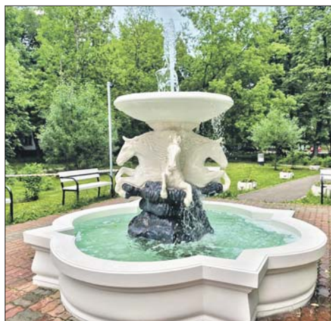
Фонтан на Большой Черкизовской улице