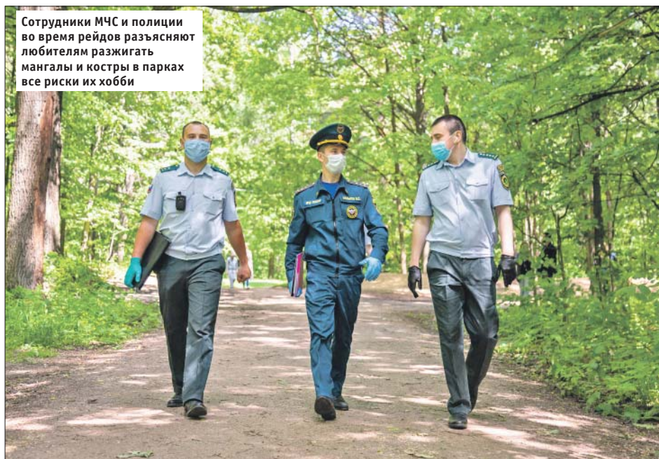
Сотрудники МЧС и полиции во время рейдов разъясняют любителям разжигать мангалы и костры в парках все риски их хобби

Посиделки с шашлыками уже начались и на других зелёных территориях округа. Около десятка таких компаний обнаружил 15 июня в Терлецком парке патруль сотрудников МЧС, полиции и ГБУ «Мосприрода».