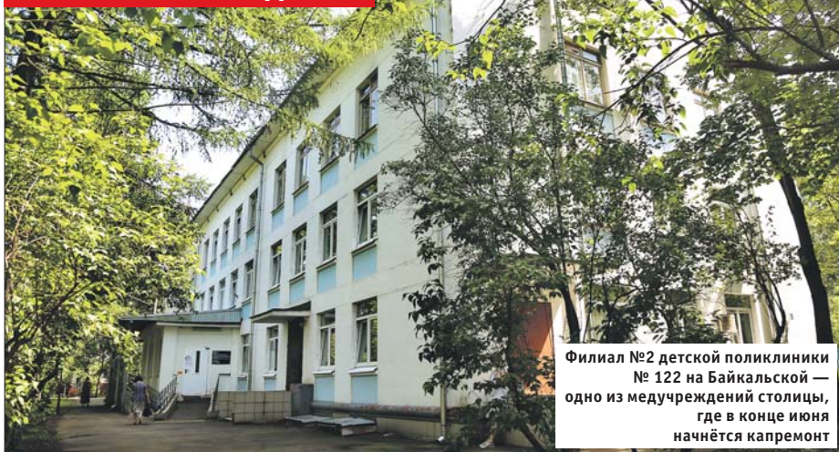
Филиал №2 детской поликлиники №122 на Байкальской — одно из медучреждений столицы, где в конце июня начнётся капремонт