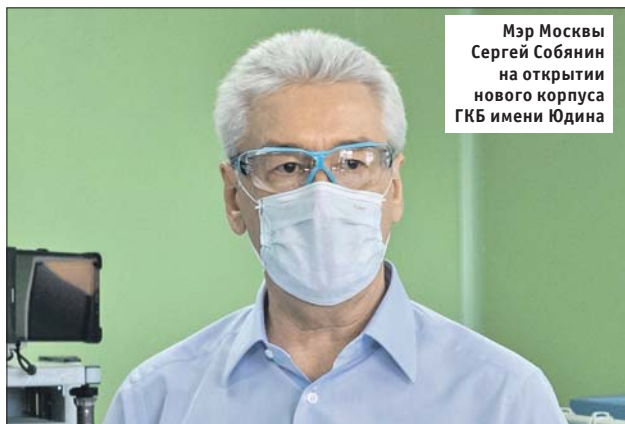
Мэр Москвы Сергей Собянин на открытии нового корпуса ГКБ имени Юдина

Врачи уверены, что использование средств защиты в значительной степени снижает риск заболеть