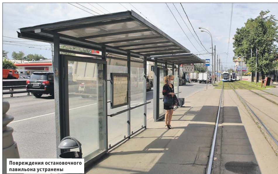
Повреждения остановочного павильона устранены