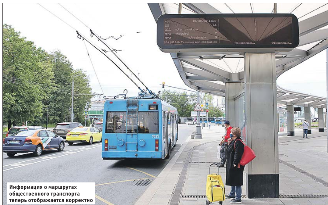
Информация о маршрутах общественного транспорта теперь отображается корректно