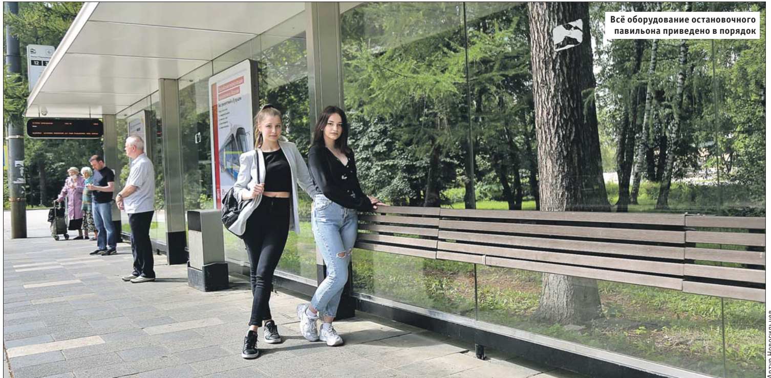
Всё оборудование остановочного павильона приведено в порядок