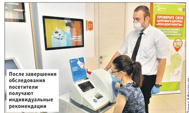
После завершения обследования посетители получают индивидуальные рекомендации