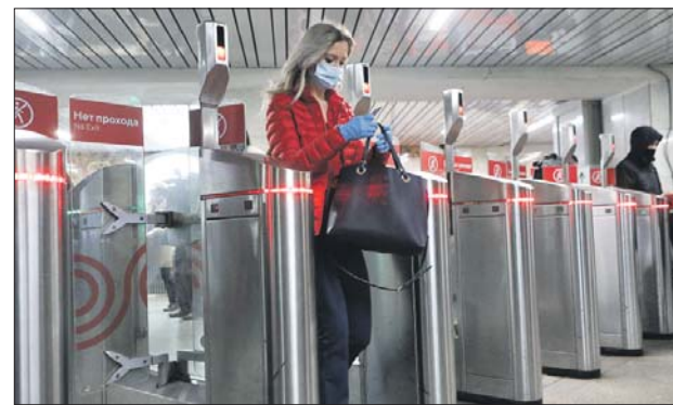
Маски в метро по-прежнему обязательны