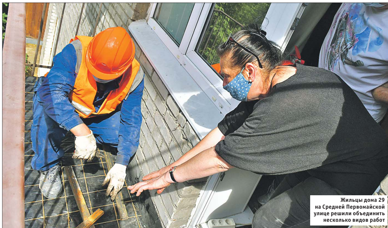
Жильцы дома 29 на Средней Первомайской улице решили объединить несколько видов работ

В округе возобновили капитальный ремонт домов