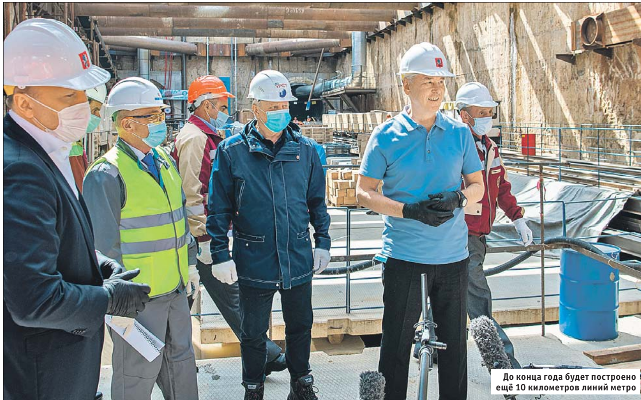
До конца года будет построено ещё 10 километров линий метро

После открытия Коммунарской линии метро станет доступнее для более миллиона человек, живущих и работающих