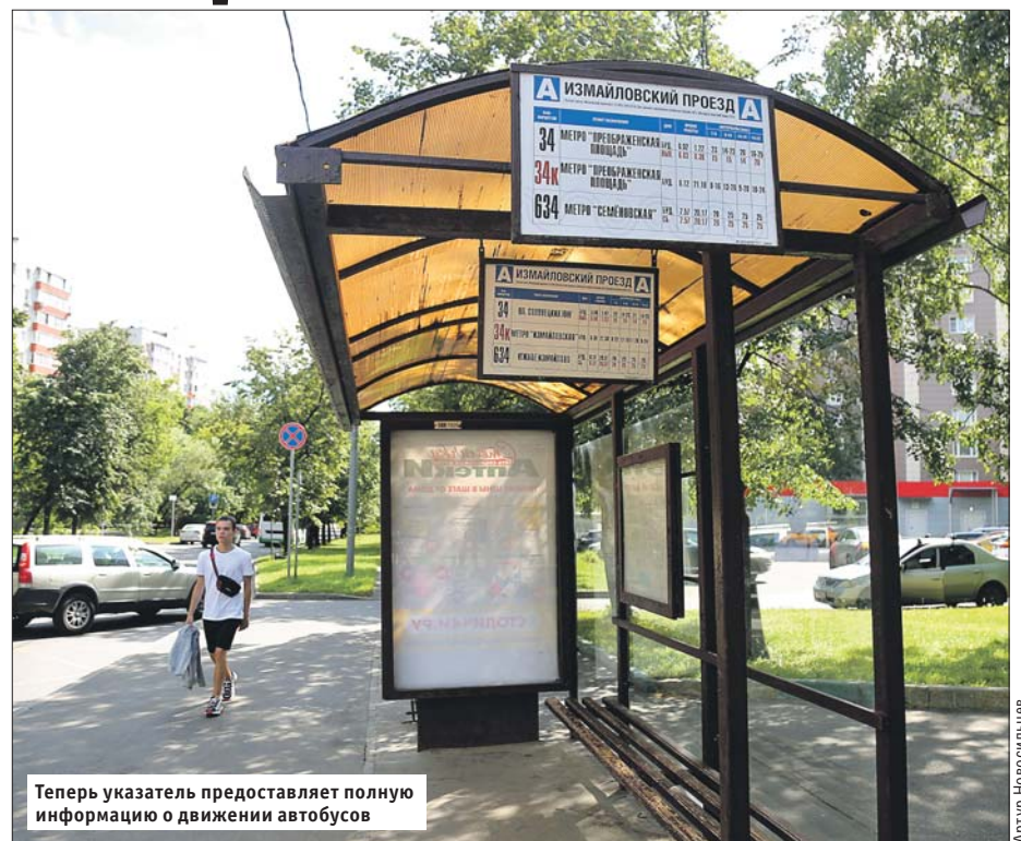
Теперь указатель предоставляет полную информацию о движении автобусов