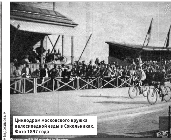
Циклодром московского кружка велосипедной езды в Сокольниках. Фото 1897 года