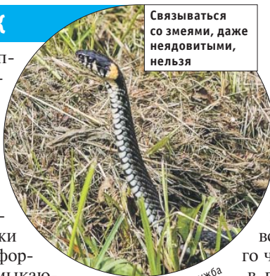
Связываться со змеями, даже неядовитыми, нельзя

— Сейчас для ужей самая прекрасная пора: тепло и сыро, — рассказывает независимый эколог Анастасия Зайцева. — К тому же их основная добыча, мыши, из-за сильных и частых ливней покидает норки. Мышей там просто заливает, и они постоянно находятся на