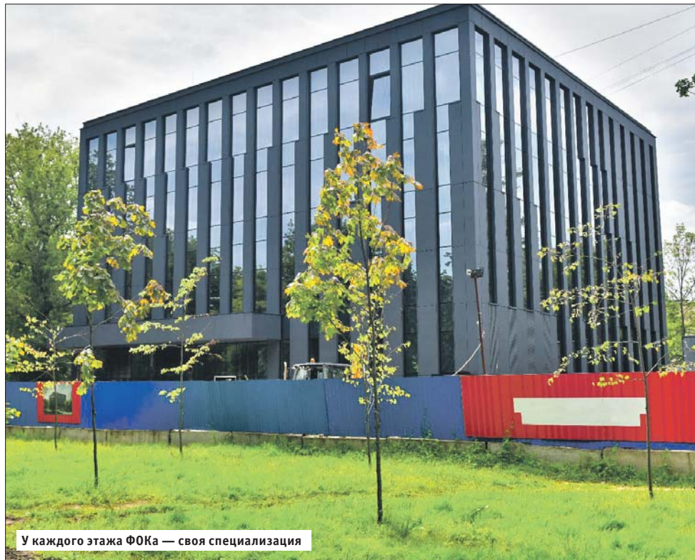
У каждого этажа ФОКа — своя специализация