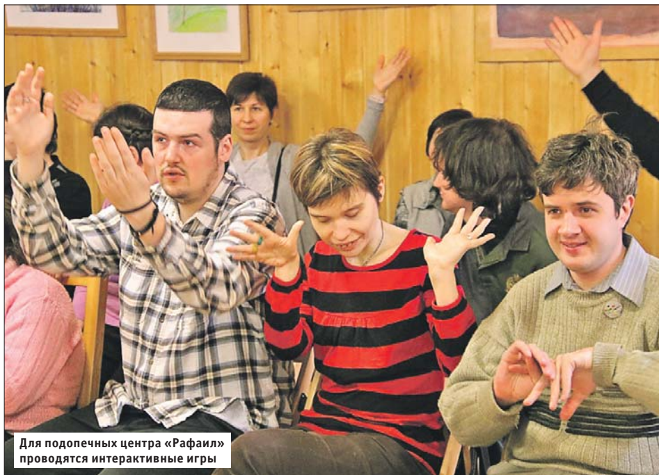
Для подопечных центра «Рафаил» проводятся интерактивные игры