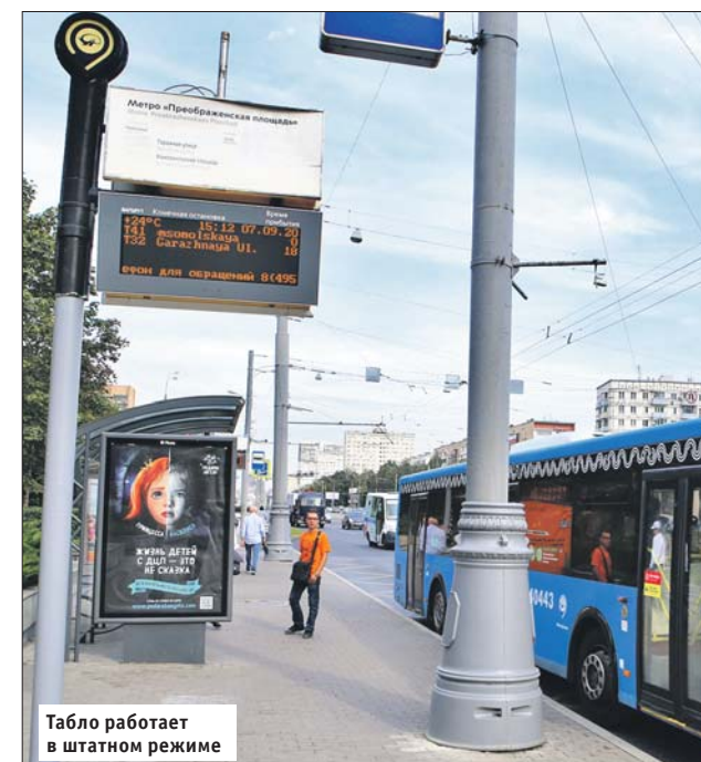
Табло работает в штатном режиме