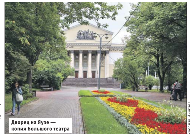
Дворец на Яузе — копия Большого театра

построили кинотеатры в Твери и в Смоленске.