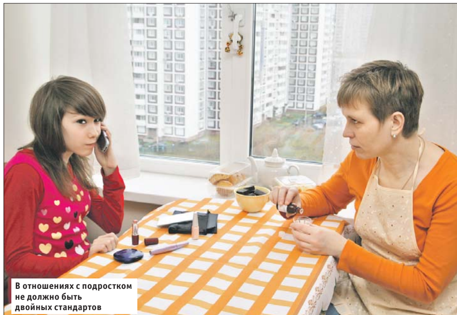
В отношениях с подростком не должно быть двойных стандартов

Как научиться договариваться с колючим подростком, рассказала психолог из Преображенского