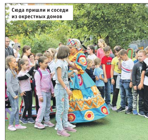
Сюда пришли и соседи из окрестных домов