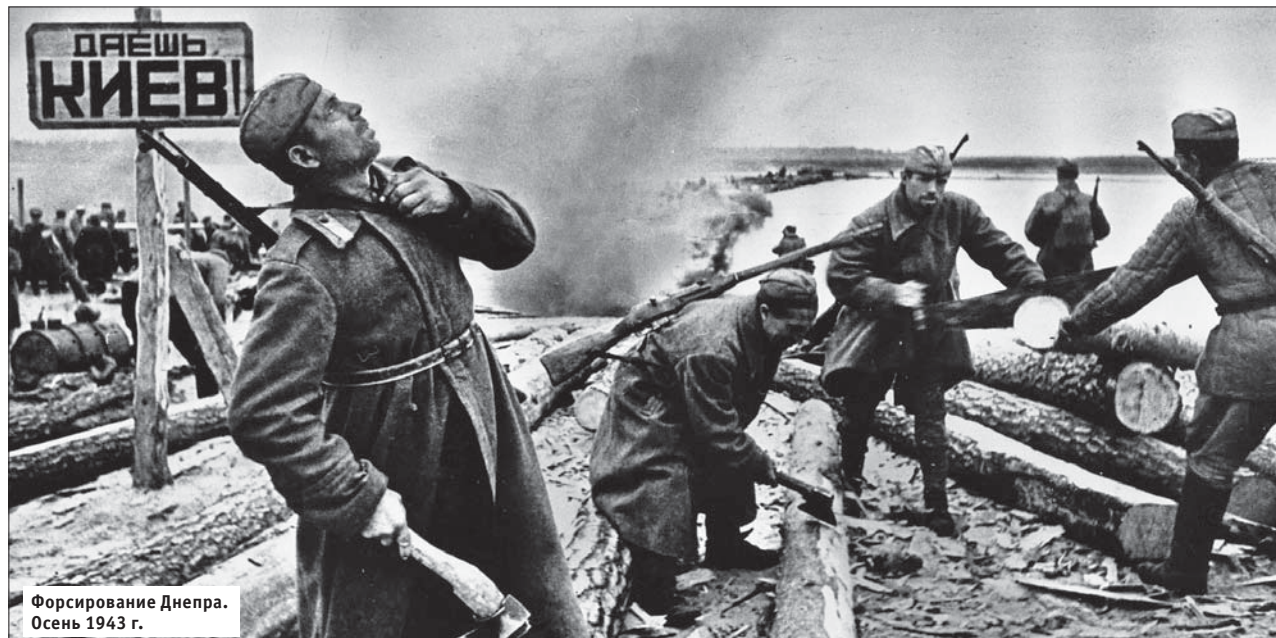
Форсирование Днепра. Осень 1943 г.