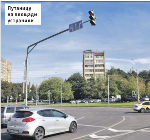
Путаницу на площади устранили

? На площади Бельи Куна есть дорожный знак, который указывает автовладельцам направление движения по полосам, но он не соответствует разметке — неверное количество полос. Просьба проверить и заменить его.