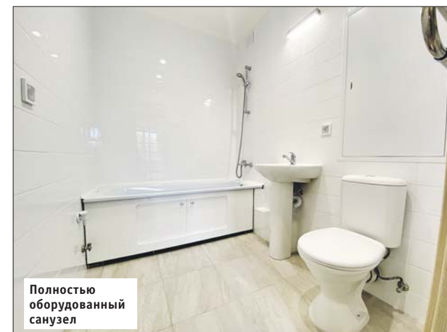
Полностью оборудованный санузел

полы в коридоре, на кухне, в ванной и в туалете — из керамогранита. В комнатах — из ламината со звукоизоляционной подложкой. На стенах наклеены обои на флизелиновой основе под покраску светлых тонов. В каждой квартире есть остеклённая лоджия.