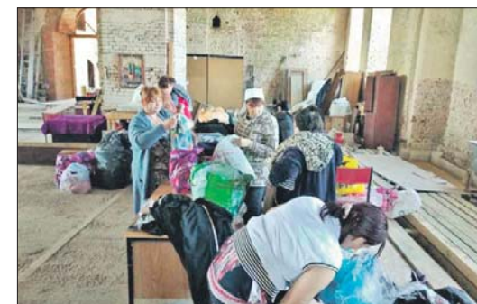
В храме идёт сортировка вещей для нуждающихся