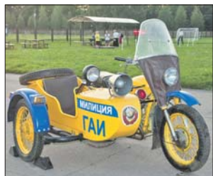
На таких «Уралах» ездили сотрудники ГАИ

дующему мотоциклу приступим?» Так и появился школьный мотокружок «Урал» — детям, — говорит учитель.