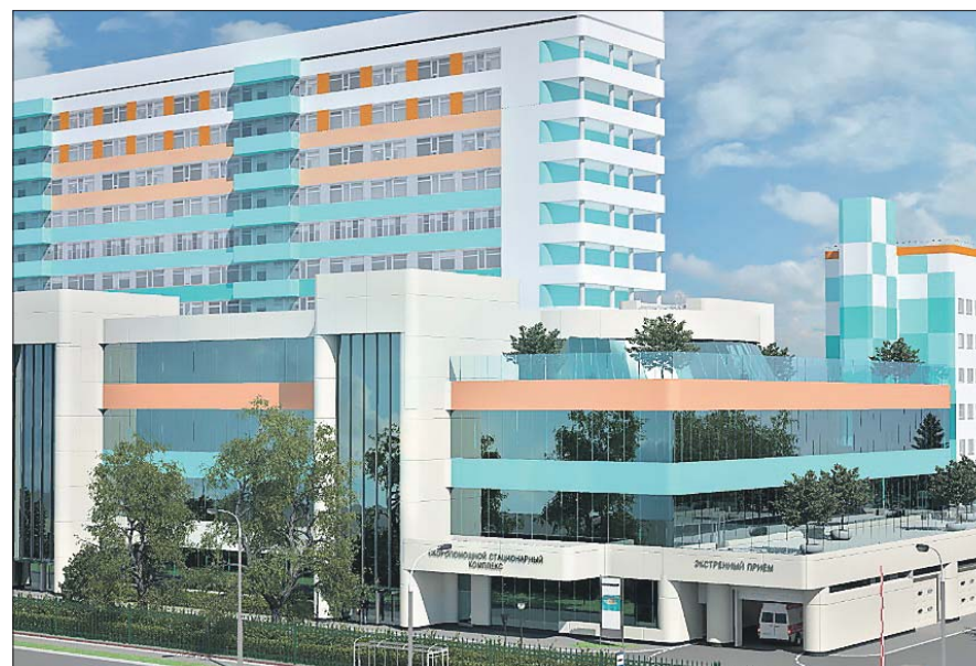
Раньше в больнице было только приёмное отделение, теперь будет целый корпус скорой помощи