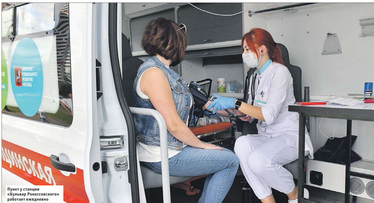
Пункт у станции «Бульвар Рокоссовского» работает ежедневно