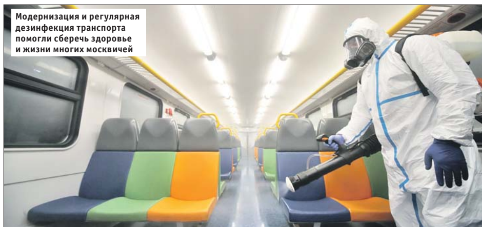
Модернизация и регулярная дезинфекция транспорта помогли сберечь здоровье и жизни многих москвичей

Тысячи жизней были спасены, тысячи людей сохранили работу, тысячи бизнесов избежали банкротства благодаря реализации программы развития Москвы, которой мы посвятили предыдущие 10 лет.