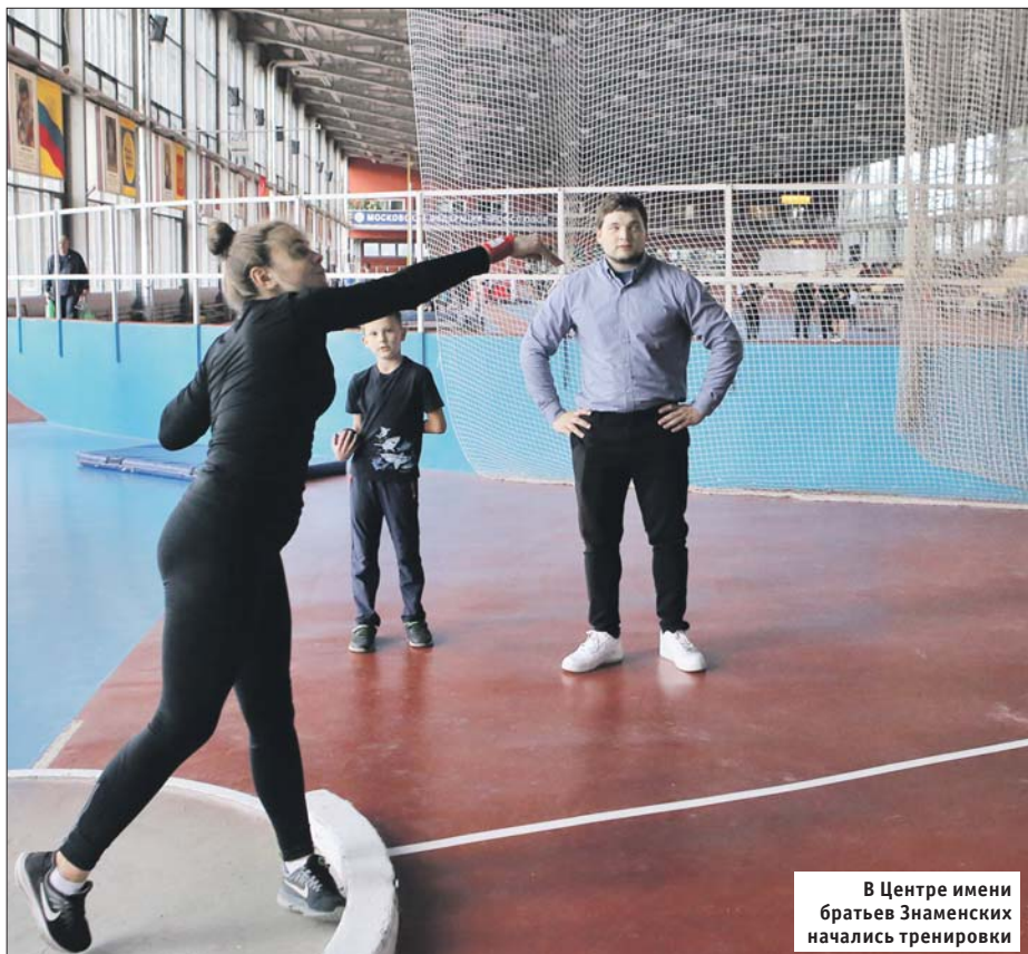
В Центре имени братьев Знаменских начались тренировки

В секцию мы принимаем детей от 9 до 17 лет. Никакая особая подготовка не требуется, всему научим! У нас работает ветеранская группа, куда