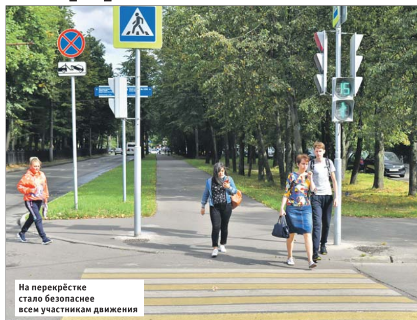
На перекрестке стало безопаснее всем участникам движения