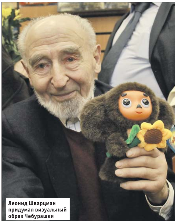
Леонид Шварцман придумал визуальный образ Чебурашки