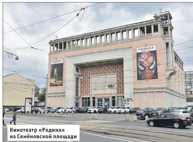
Кинотеатр «Родина» на Семёновской площади