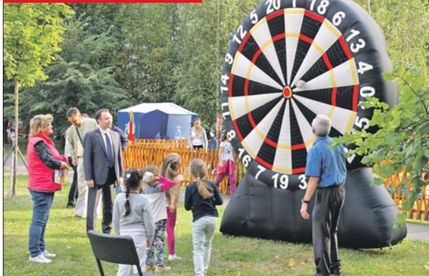
В такой дартс-дворе ещё не играла

Очередной праздник двора, или, как его называют сами участники, день доброго соседа, прошёл у дома 35 на улице Руднёвке. Сюда пришли и соседи из окрестных домов. Самым массовым стал конкурс по перетягиванию каната. Взрослые и дети играли в дартс, боулинг с гигантскими кеглями и другие весёлые игры. Здесь же организовали мастер-классы.