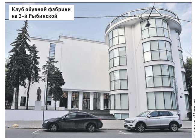
Клуб обувной фабрики на 3-й Рыбинской

Строительство рабочих клубов в Москве в 1920-е годы велось очень активно. Советские власти видели в них и центры просвещения, и место для культурного досуга рабочих без алкоголя и драк. Одно из них — клуб обувной фабрики «Буревестник», который стоит на 3-й Рыбинской ул., 17.