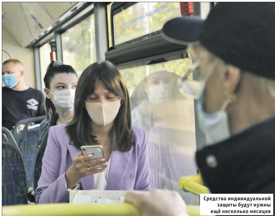
Средства индивидуальной защиты будут нужны ещё несколько месяцев

Эксперты Всемирной организации здравоохранения напоминают основные меры, которые помогают снизить риск заражения как коронавирусной инфекцией, так и другими сезонными болезнями, передающимися воздушно-капельным путём.