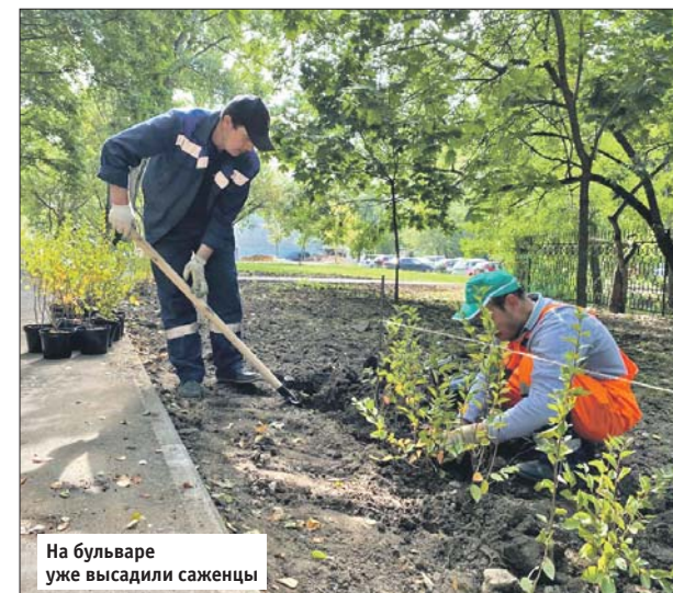
На бульваре уже высадили саженцы