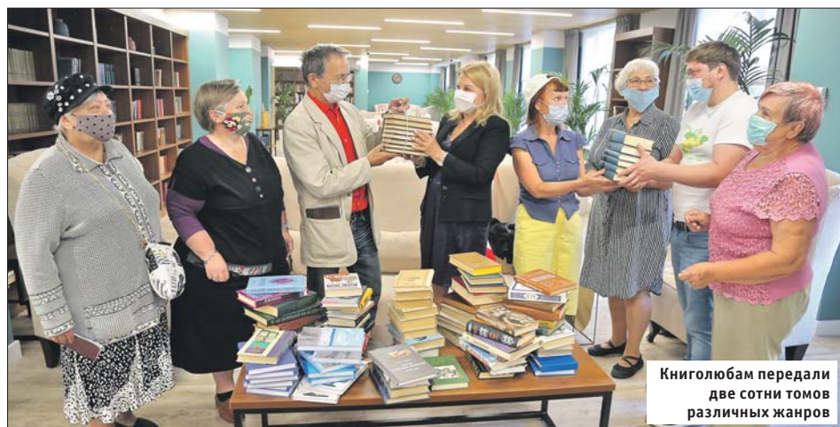
Книголюбам передали две сотни томов различных жанров

— К нам обратились пожилые люди из клуба «Вечерние Сокольники»: не могли бы мы помочь приключенческой, исторической литературой, а также поэзией и