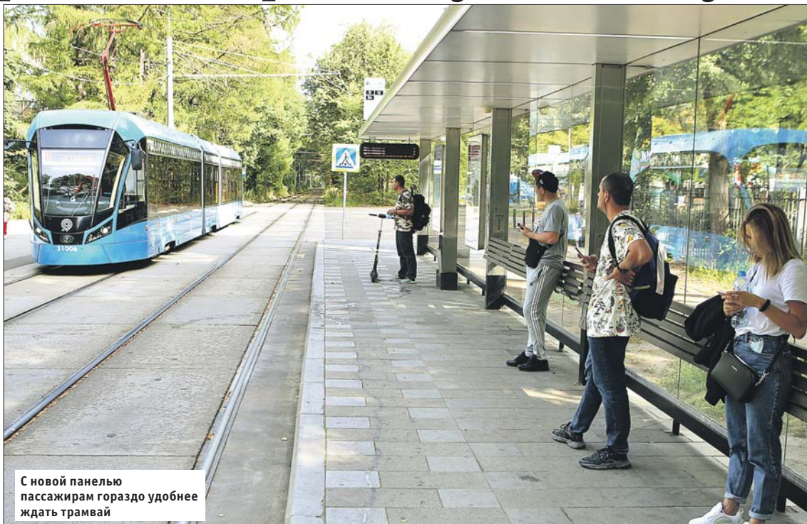
С новой панелью пассажирам гораздо удобнее ждать трамвай