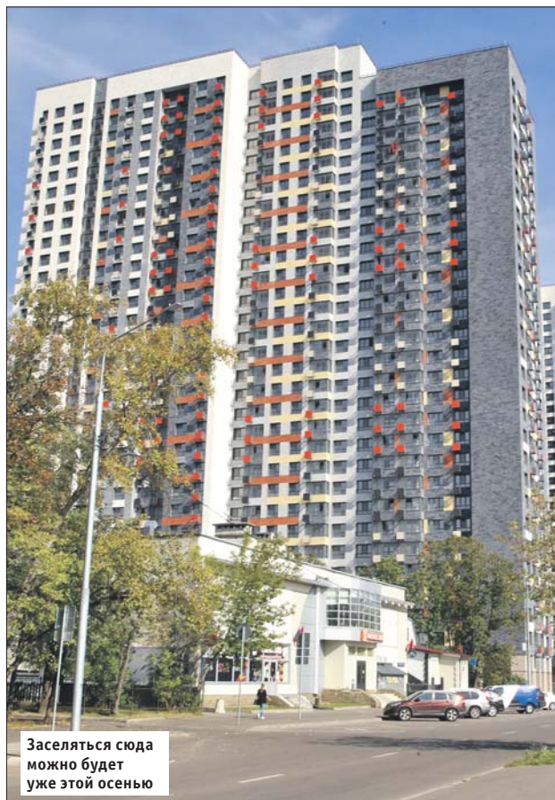
Заселяться сюда можно будет уже этой осенью

В новом жилом доме 1090 квартир: 234 однокомнатных, 748 двухкомнатных и 108 трёхкомнатных. Каждая с отделкой: