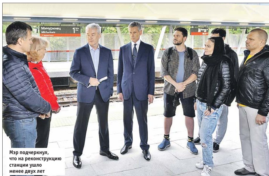
Мэр подчеркнул, что на реконструкцию станции ушло менее двух лет

почти 40 минут, а электричка идёт всего 28 минут. По оценкам экспертов, поток пассажиров через новую станцию вы-