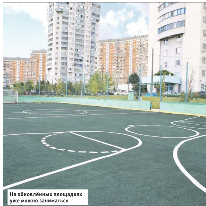
На обновлённых площадках уже можно заниматься

Управа района Косино-Ухтомский: ул. Большая Косинская, 20, корп. 1. Тел.: (495) 700-3707, (495) 700-0044. Эл. почта: vao-kos_uht@mos.ru. Сайт: kosino-uhomski.mos.ru