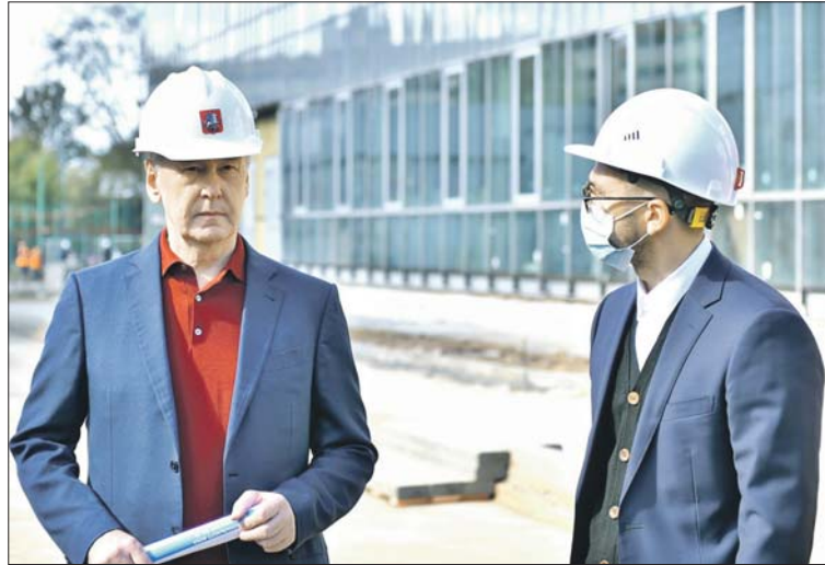
Сергей Собянин во время посещения стройплощадки на Тушинской

— Город тоже вкладывает в эту инфраструктуру. Здесь, в Покровском-Стрешневом, возводится новый спортивный комплекс с двумя бассейнами, с первоклассным игровым залом, — сообщил Сергей Собянин.