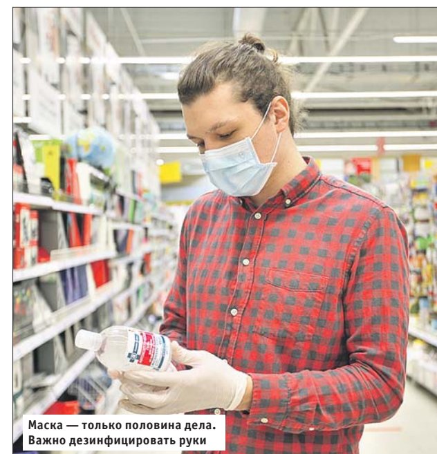
Маска — только половина дела. Важно дезинфицировать руки

В инструкции по применению должно быть указано время обработки рук и количество средства, которое необходимо для однократной обработки. На это следует обратить внимание. Вти-