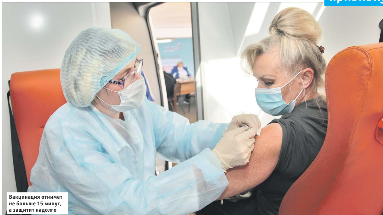
Вакцинация отнимет не больше 15 минут, а защитит надолго