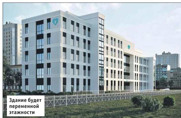
Здание будет переменной этажности