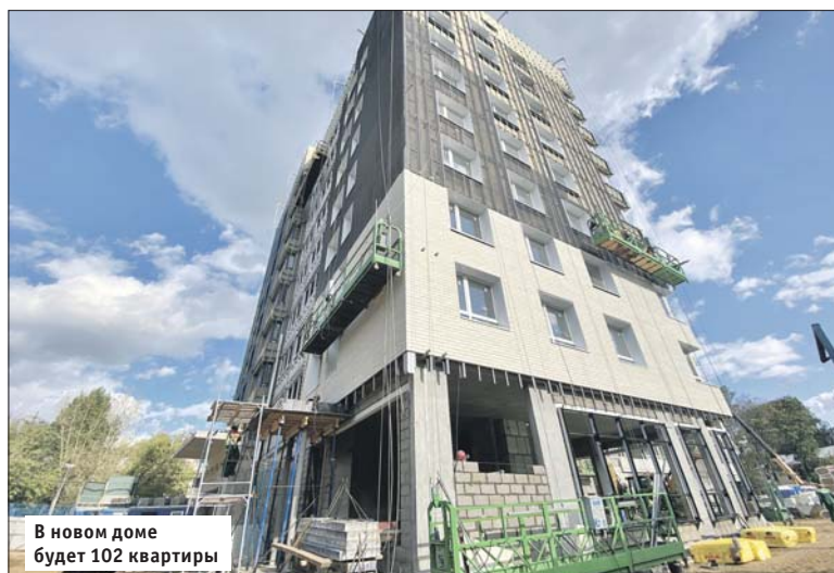
В новом доме будет 102 квартиры

На первом этаже откроется центр информирования. Здесь будут работать специалисты