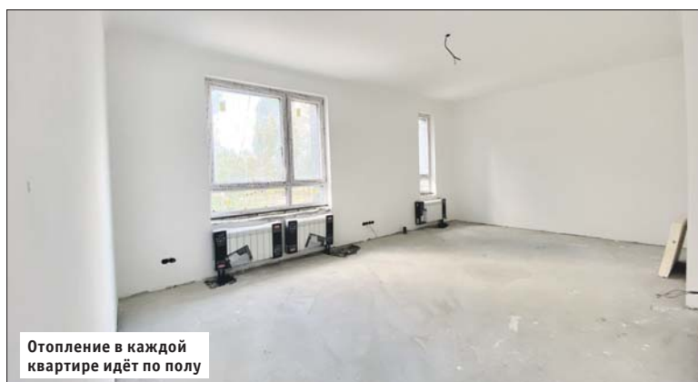
Отопление в каждой квартире идёт по полу