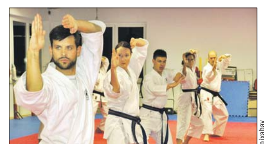
В центре заработала секция каратэ

ГБУ «Досуговый центр «Богородское»: ул. Бойцовая, 24, корп. 3, и 17, корп. 3, ул. Миллионная, 11, корп. 1, тел. (499) 160-1465. Сайт: dc-bogorodskoe.moskva.ru . Страница в соцсетях: vk.com/dc_bogorodskoe