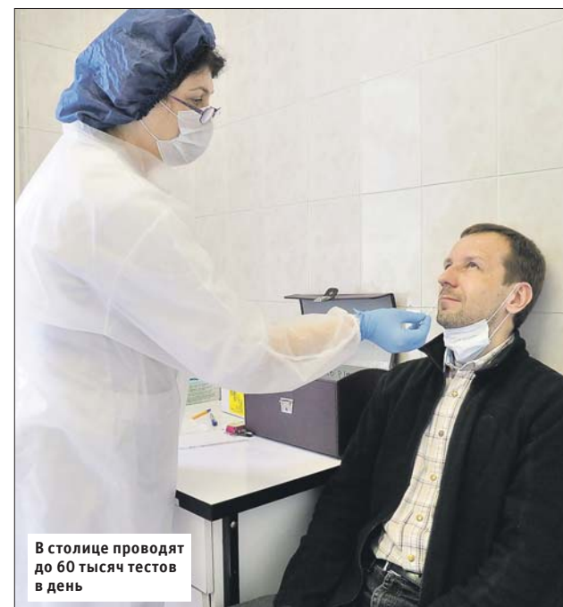
В столице проводят до 60 тысяч тестов в день

Более 60% коечного фонда, специально выделенного под ковид, сейчас свободно. Кроме того, город обладает мощностями законсервированных временных госпиталей, если понадобится, они могут быть развернуты в течение двух-трёх дней. Аппараты искусственной вентиляции лёгких свободны на 90%: в Москве сейчас всего 145 человек на ИВЛ. Сформировали огромный запас (752 литра) донорской