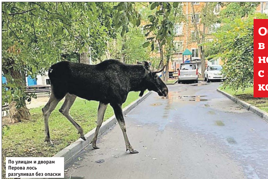
По улицам и дворам Перова лось разгуливал без опаски

Обнаружив лося в жилой зоне, не пытайтесь с ним контактировать