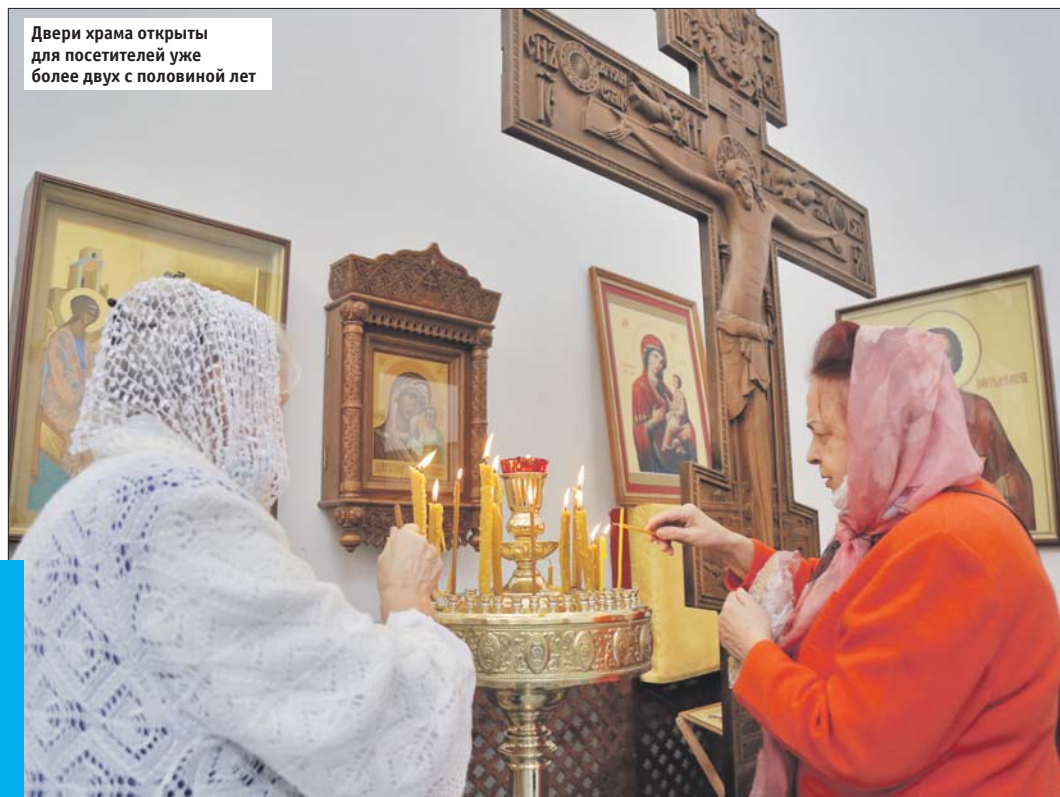
Двери храма открыты для посетителей уже более двух с половиной лет

собирается народ Божий. Дай Бог, чтобы среди этого народа было побольше молодёжи и детей, потому что будущее Церкви будет во многом зависеть от