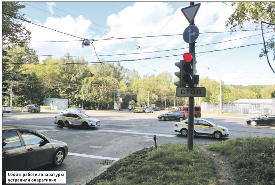
Сбой в работе аппаратуры устранили оперативно