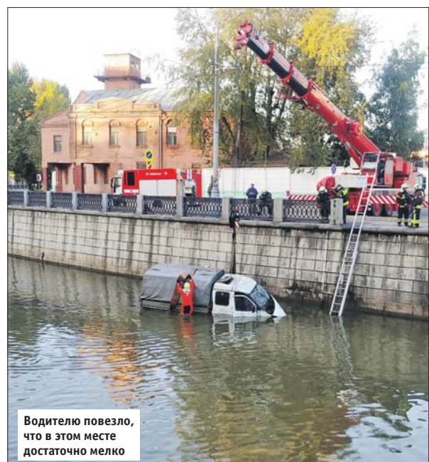
Водителю повезло, что в этом месте достаточно мелко