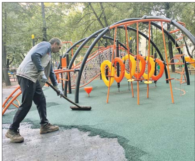
Площадку на Семёновском Валу покрыли резиновой крошкой