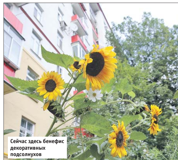
Сейчас здесь бенефис декоративных подсолнухов