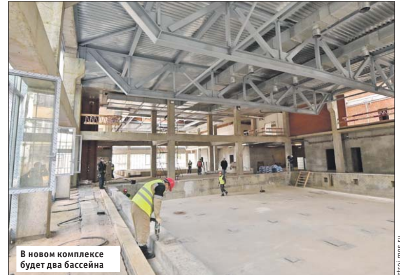
В новом комплексе будет два бассейна

Отличительной особенностью внешнего вида спорткомплекса станут фасады из тонких вертикальных металлических панелей. Они будут поворачи-