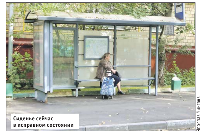
Сиденье сейчас в исправном состоянии