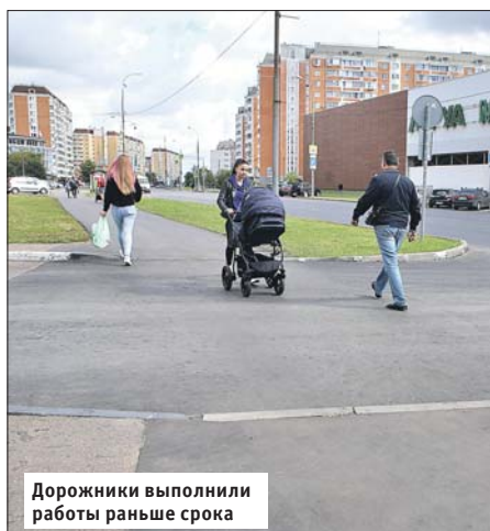
Дорожники выполнили работы раньше срока