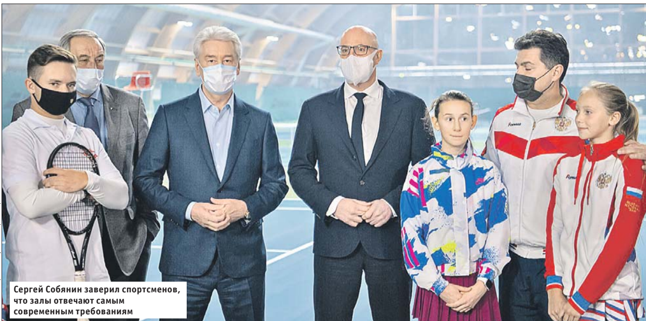
Сергей Собянин заверил спортсменов, что залы отвечают самым современным требованиям

— Город со своей стороны старается помогать инвесторам, упрощая процедуры согласований, снижая стартовую цену на землю. Это всё даёт новые возможности для занятий спортом москвичам, — сообщил Собянин.