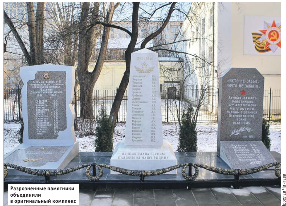
Разрозненные памятники объединили в оригинальный комплекс