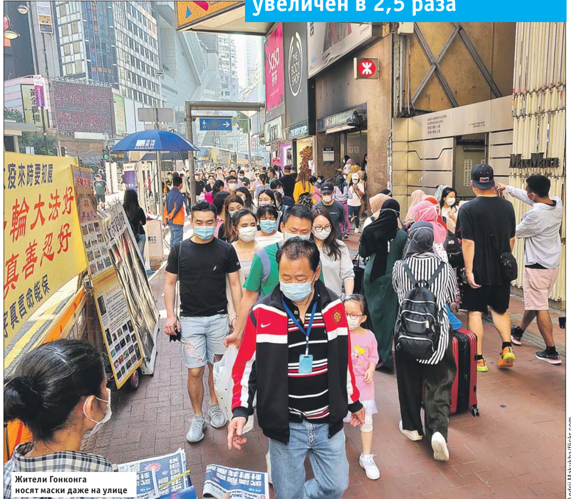
Жители Гонконга носят маски даже на улице

До 30 декабря продлён комендантский час в Тунисе — с 20.00 до 5.00 запрещено находиться на улице. Также в стране сохранён