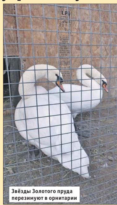
Звёзды Золотого пруда перезимуют в орнитарии