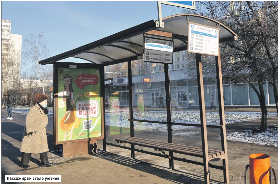
Пассажирам стало уютнее