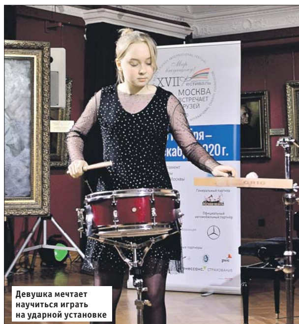
Девушка мечтает научиться играть на ударной установке