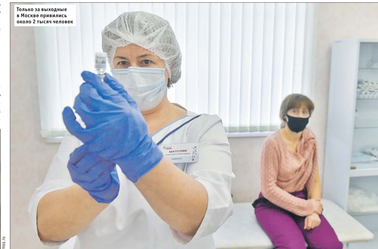
Только за выходные в Москве привились около 2 тысяч человек

СЕМЬ УСЛОВИЙ Вы можете сделать прививку против COVID-19, если: ■ вы работаете в медицинских и образовательных организациях (частные и государственные) или в городской социальной службе; ■ вам от 18 до 60 лет, у вас нет хронических заболеваний; ■ вы прикреплены к московской поликлинике; ■ вы не участвуете в клиническом исследовании вакцины от COVID-19; ■ вы не болели ОРВИ в течение двух недель до прививки и не болеете в момент вакцинации; ■ в последние 30 дней вы не делали прививок; ■ вы не беременны и не кормите грудью.