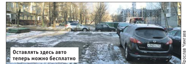
Оставлять здесь авто теперь можно бесплатно