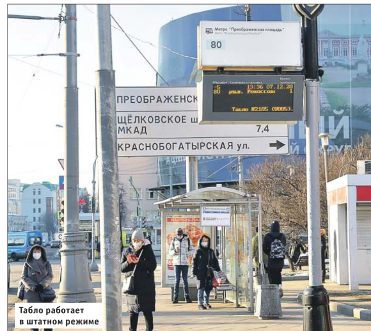
Табло работает в штатном режиме