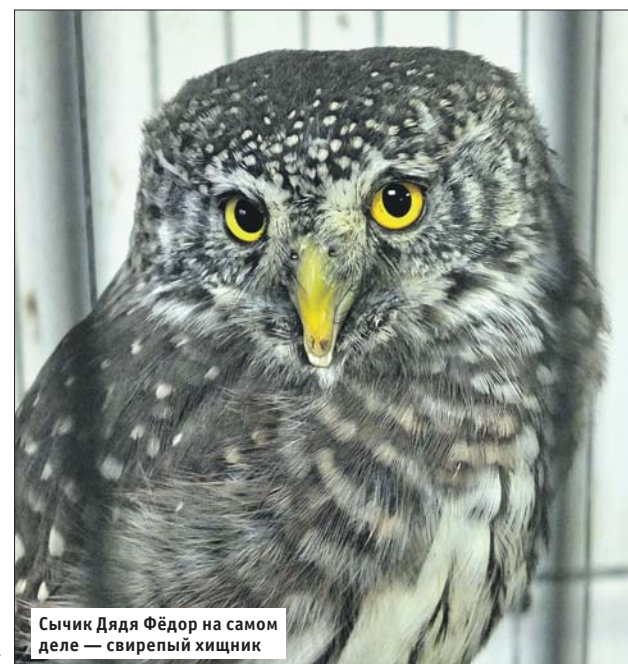
Сычик Дядя Фёдор на самом деле — свирепый хищник