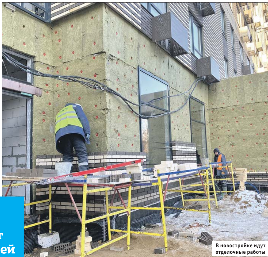
В новостройке идут отделочные работы

Из старых пятиэтажек сюда переедут более 300 семей