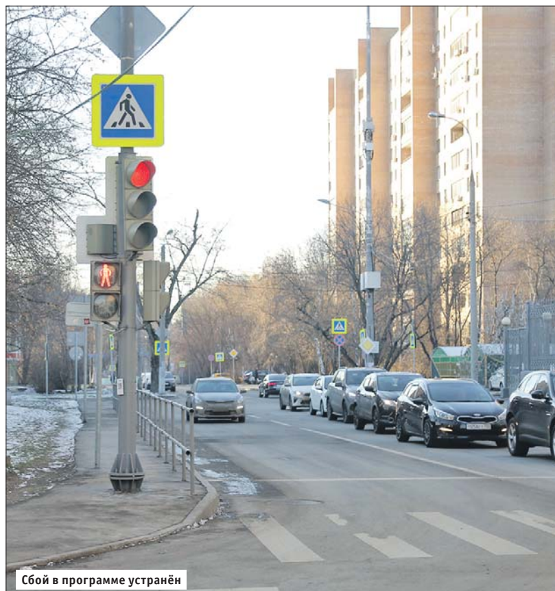
Сбой в программе устранён