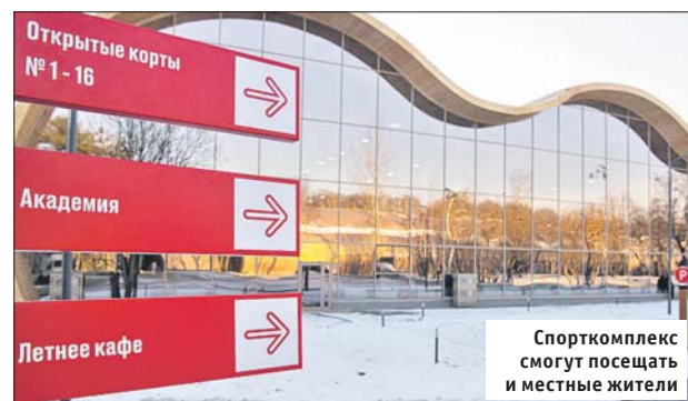
Спорткомплекс смогут посещать и местные жители

Теннисный центр в «Сокольниках» построили с учётом всех требований по сохранению окружающей среды, отметил участвовавший в осмотре спорткомплекса заместитель председателя Правительства России Дмитрий Чернышенко. По его словам, сегодня это один из