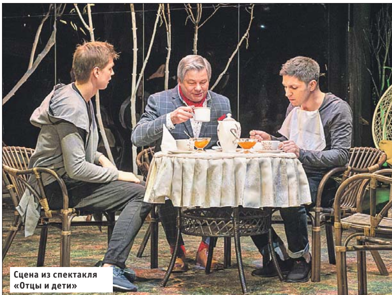
Сцена из спектакля «Отцы и дети»