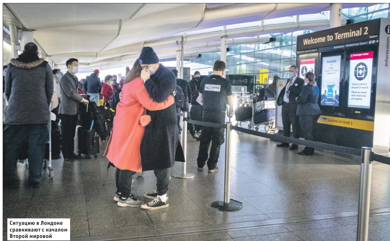
Ситуацию в Лондоне сравнивают с началом Второй мировой

В британской столице объявлен максимальный уровень угрозы заражения