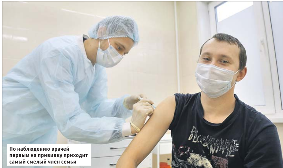
По наблюдению врачей первым на прививку приходит самый смелый член семьи

Перед вакцинацией тестирование на наличие коронавирусной