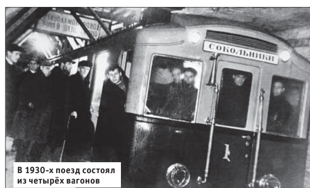
В 1930-х поезд состоял из четырёх вагонов