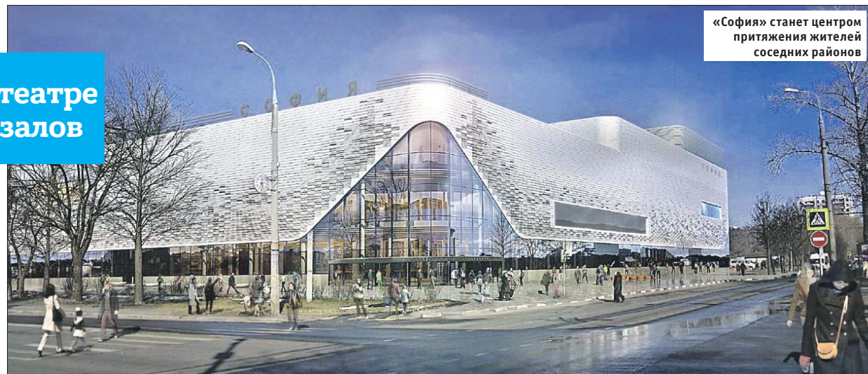
«София» станет центром притяжения жителей соседних районов