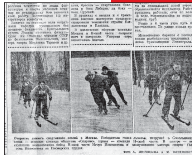
Электронный архив библиотеки имени И.А. Некрасова