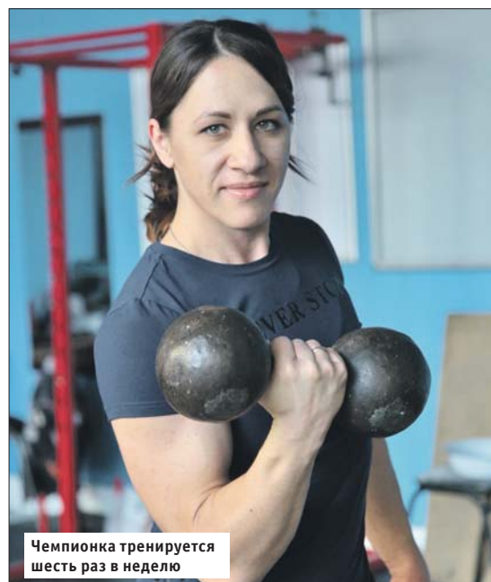
Чемпионка тренируется шесть раз в неделю