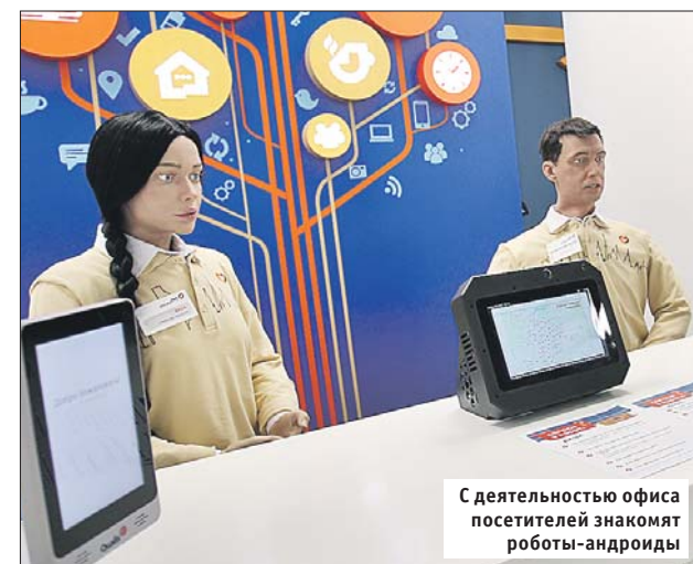
С деятельностью офиса посетителей знакомят роботы-андроиды