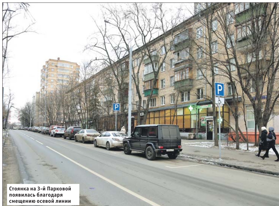
Стоянка на 3-й Парковой появилась благодаря смещению осевой линии

В ЦОДД напомнили: в 2020-м односторонними стали ещё два участка дорог в ВАО. Это отрезок 5-го проспекта Новогиреева от Федеративного проспекта до Сапёрного проезда (движение в сторону Сапёрного проезда) и часть Сапёрного проезда от 5-го до 1-го проспекта Новогиреева (движение в сторону 1-го проспекта). Причиной изменений стало обращение местных жителей, просивших организовать дополнительные парковочные места. Ввод одностороннего движения позволил увеличить их количество с 23 до 157.