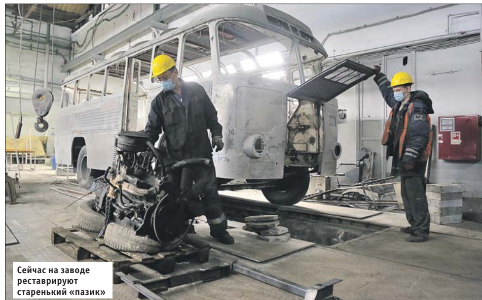
Сейчас на заводе реставрируют старенький «пазик»