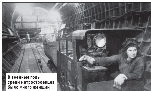
В военные годы среди метростроевцев было много женщин