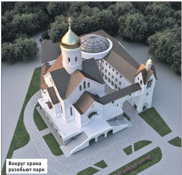
Вокруг храма разобьют парк