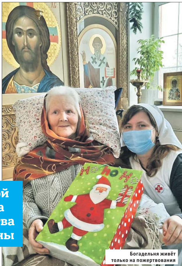
Богадельня живёт только на пожертвования

Сёстры милосердия, работающие в богадельне, рассказали корреспонденту «ВО», что их подопечным подарили тёплые