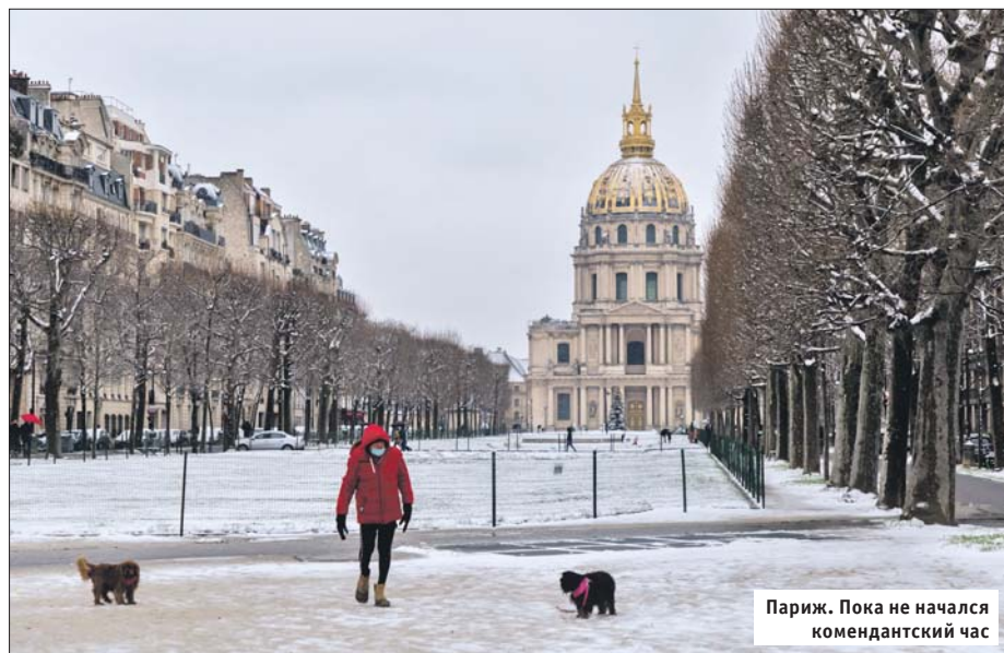
Париж. Пока не начался комендантский час

По всей Франции с 16 января увеличили продолжительность введённого ранее комендантского часа: теперь он начинается не в 20.00, а в 18.00 и длится до 6.00. Пока он будет действовать в течение двух недель. В первый день расширенного комендантского часа в стране оштрафовали почти 6 тысяч человек за его несоблюдение. Штраф за нарушение правил, принятых во Франции из-за