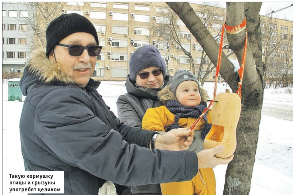
Такую кормушку птицы и грызуны употребят целиком

Кормушки для птиц можно сделать из подручных материалов, которые есть в каждом доме