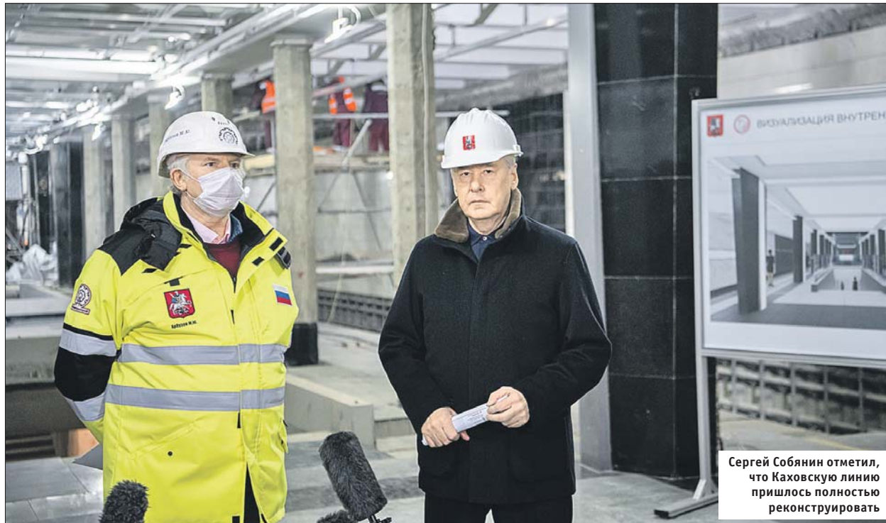
Сергей Собянин отметил, что Каховскую линию пришлось полностью реконструировать

Сергей Собянин проинспектировал ход работ на «Каховской»