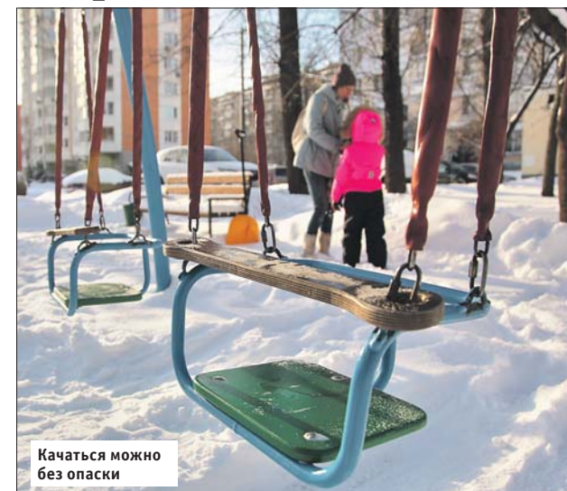
Качаться можно без опаски