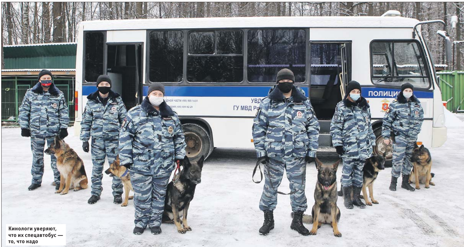
Кинологи уверяют, что их спецавтобус — то, что надо

В Богородском производят спецмашины для экстренных служб и броню для атомных станций