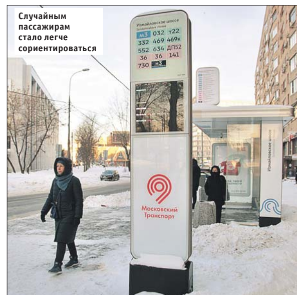
Случайным пассажирам стало легче ориентироваться

Как пояснили в ГУП «Мосгортранс», оборудование пострадало от вандалов. Сейчас инфор-