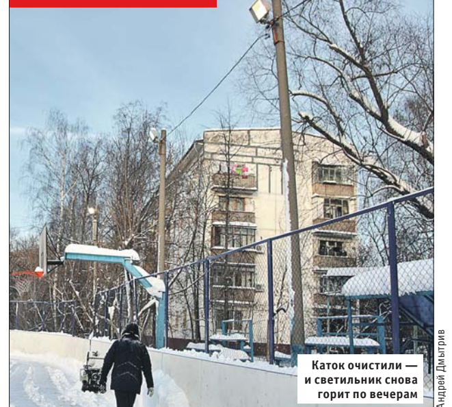
Каток очистили — и светильник снова горит по вечерам