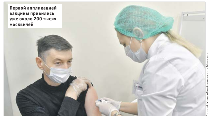
Первой аппликацией вакцины привились уже около 200 тысяч москвичей