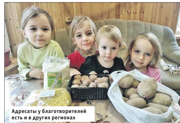
Адресаты у благотворителей есть и в других регионах