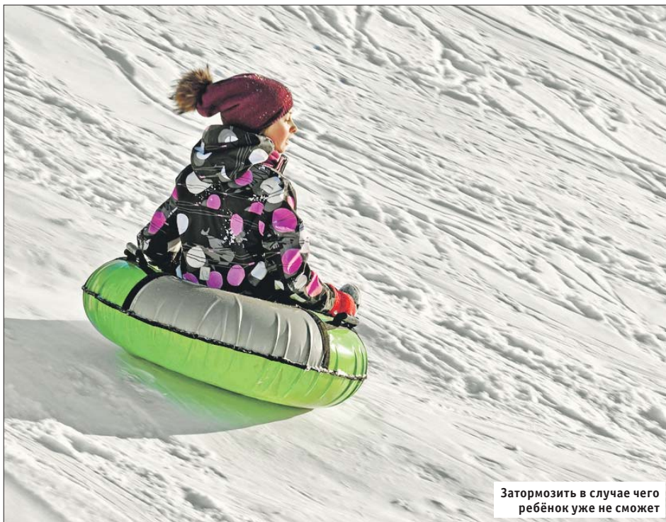
Затормозить в случае чего ребёнок уже не сможет