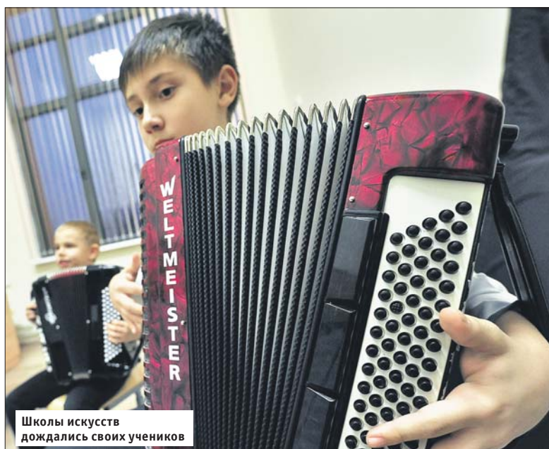
Школы искусств дождались своих учеников