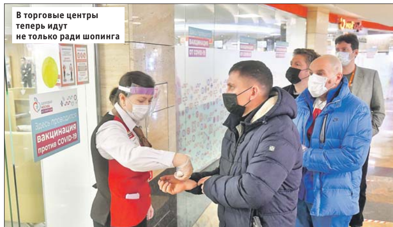
В торговые центры теперь идут не только ради шопинга

Получить инъекцию вакцины от коронавируса стало ещё проще