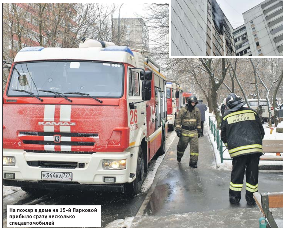
На пожар в доме на 15-й Парковой прибыло сразу несколько спецавтомобилей

Вторая по распространённости причина воз-