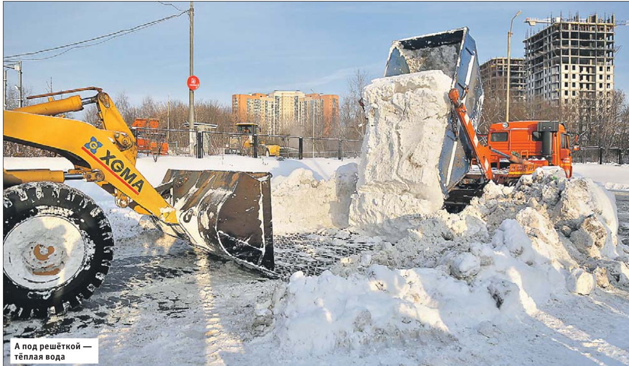
А под решёткой — тёплая вода

— Во время снегопада на пункт ехали даже ночью, потому что и в это время коммуналь-