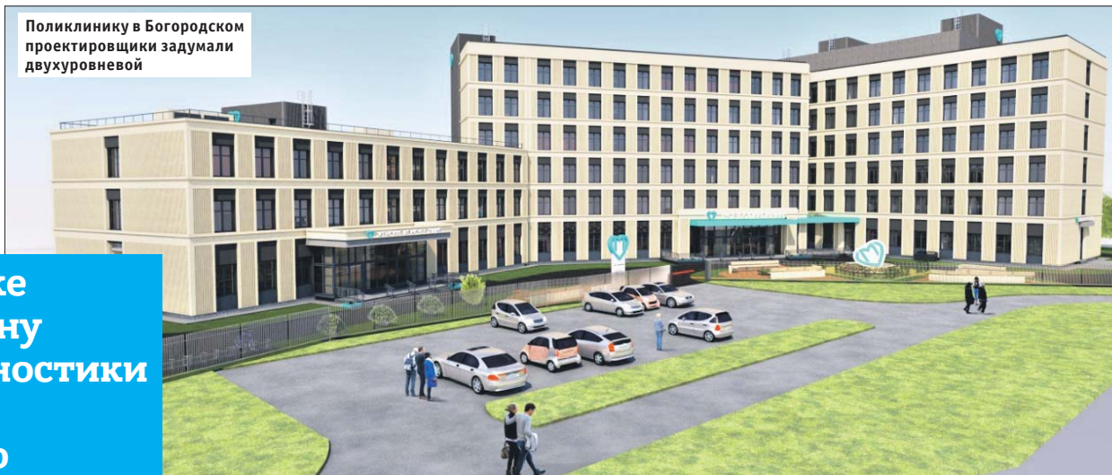
АНО «Развитие социальной инфраструктуры»

Поликлинику в Богородском проектировщики задумали двухуровневой