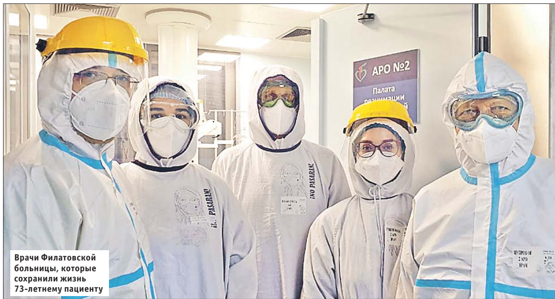
Врачи Филатовской больницы, которые сохранили жизнь 73-летнему пациенту