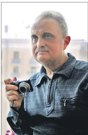
Из личного архива