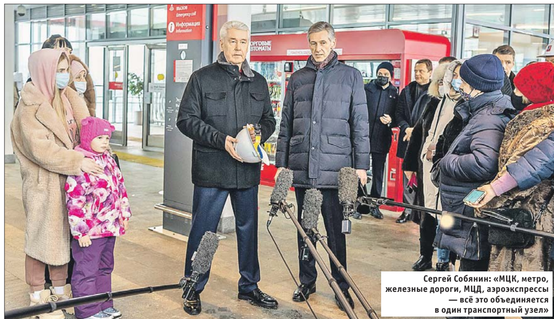
Сергей Собянин: «МЦК, метро, железные дороги, МЖД, аэроэкспрессы — всё это объединяется в один транспортный узел»

Первых пассажиров вокзал примет 29 мая. На Восточный будут прибывать 27 поездов дальнего следования, ранее они высаживали пассажиров на Курском вокзале. Здесь будет конечная для «Ласточки» и «Стрижа» из Нижнего Новгорода и Иванова.