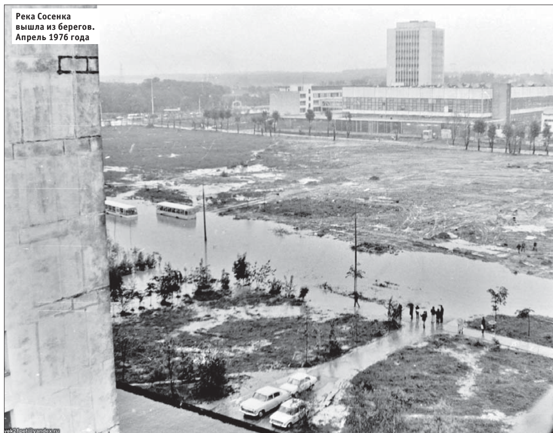
Река Сосенка вышла из берегов. Апрель 1976 года