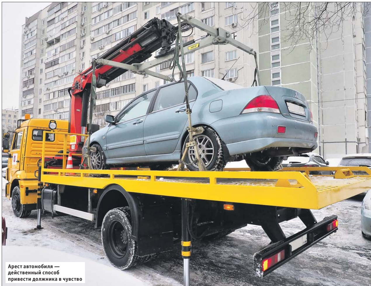
Арест автомобиля — действенный способ привести должника в чувство

Этот случай в районе не единственный. Недавно