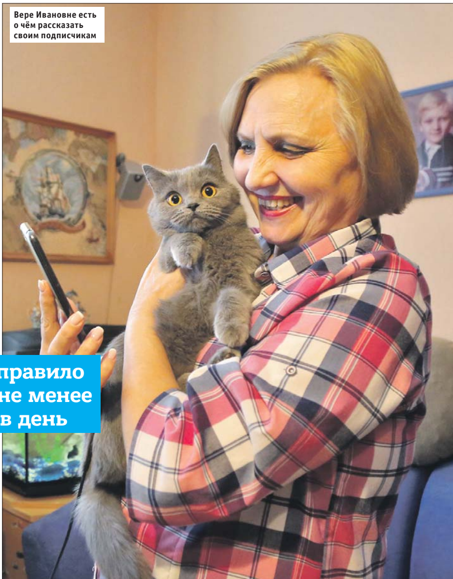
Вере Ивановне есть о чём рассказать своим подписчикам

чатлениями, — говорит блогер. — Взяла за правило публиковать не менее одного поста в день. И что бы ни случилось, от него не отступаю.