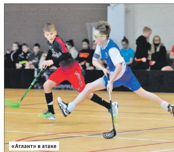
«Атлант» в атаке