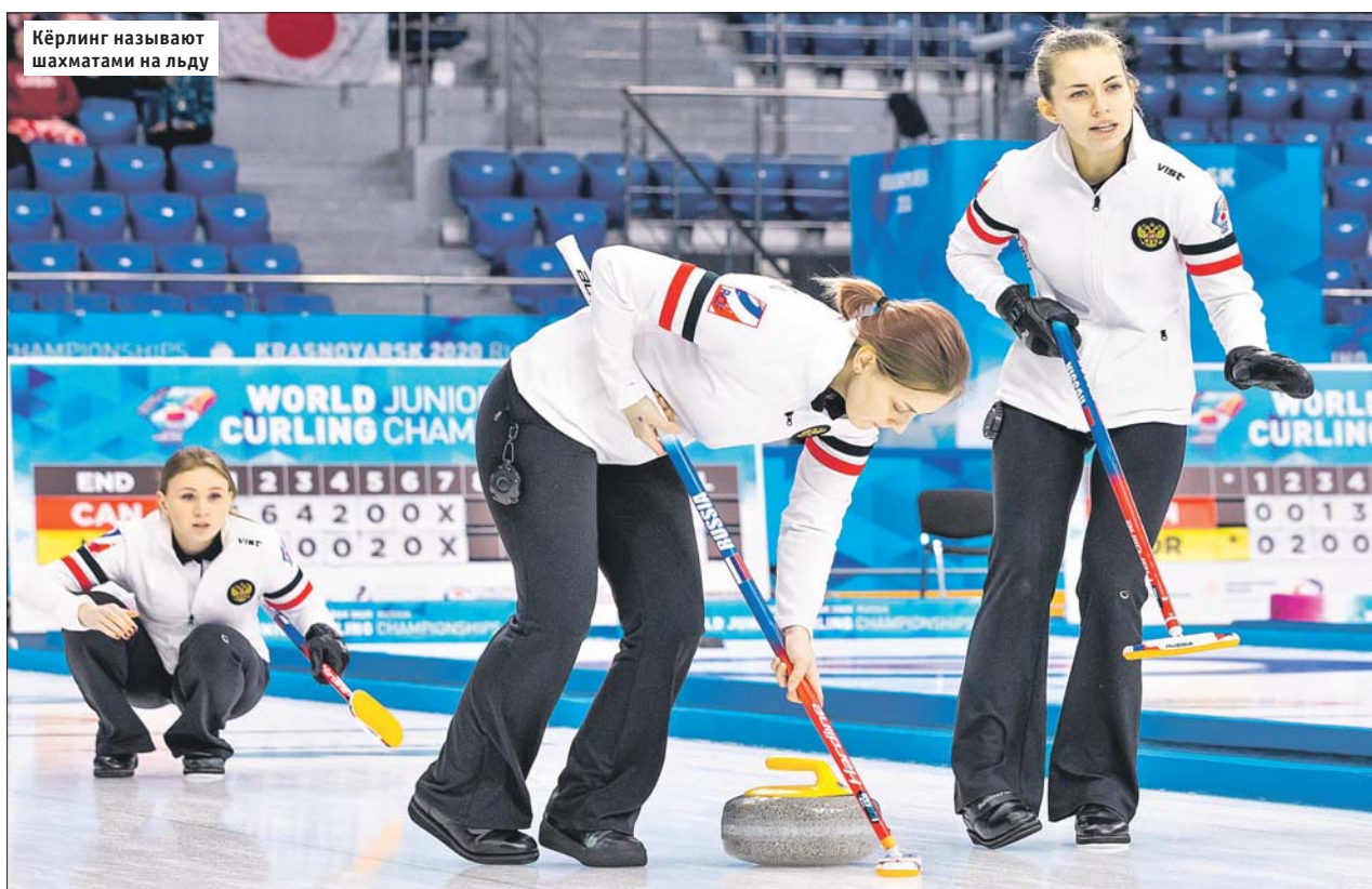
Кёрлинг называют шахматами на льду