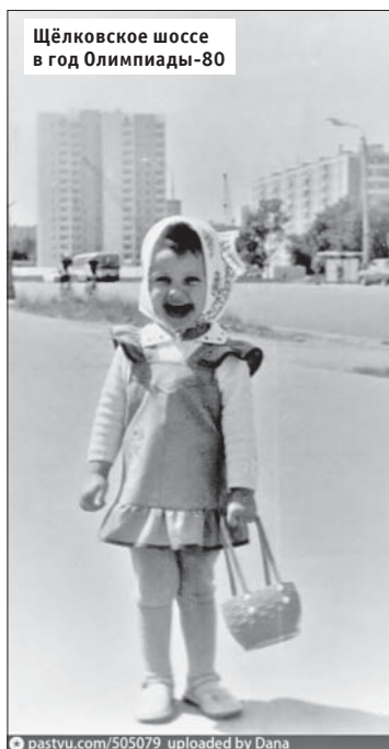
Щёлковское шоссе в год Олимпиады-80