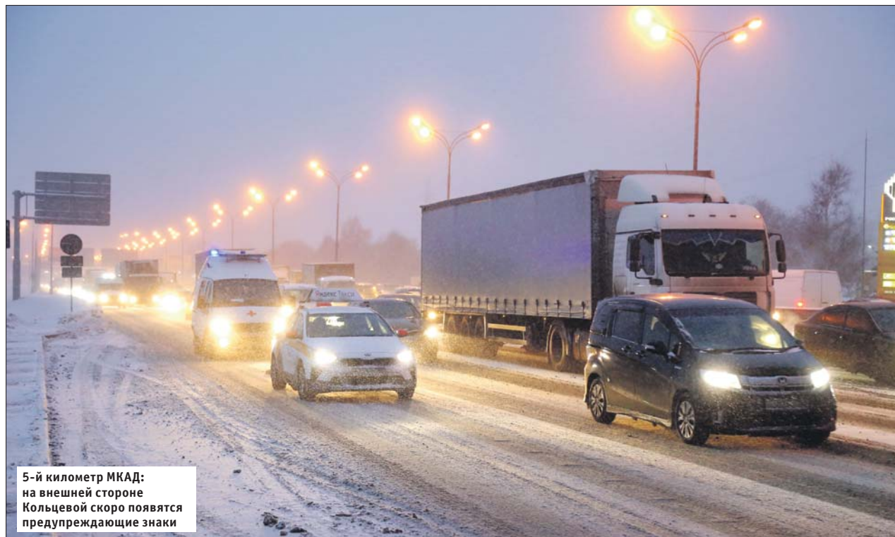
5-й километр МКАД: на внешней стороне Кольцевой скоро появятся предупреждающие знаки

Почему на МКАД предлагают снизить скорость до 80 километров в час