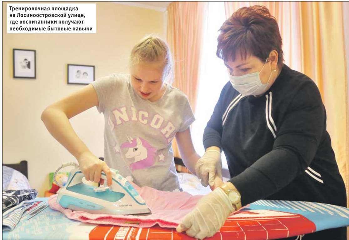
Тренировочная площадка на Лосиноостровской улице, где воспитанники получают необходимые бытовые навыки

У ребят из центра содействия семейному воспитанию появилась надежда на собственное жильё