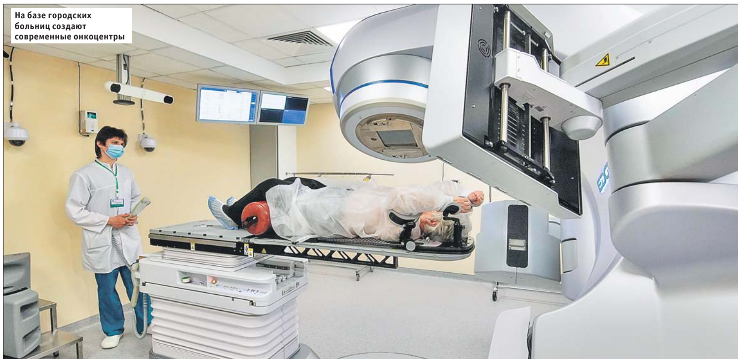
На базе городских больниц создают современные онкоцентры

В столице реализуется новый стандарт онкологической помощи