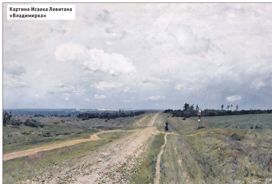
Картина Исаака Левитана «Владимирка»

Истории знаменитой дороги можно послушать бесплатно