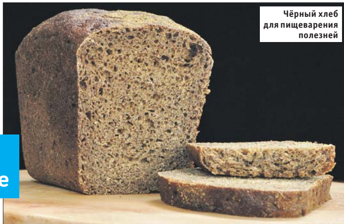
Чёрный хлеб для пищеварения полезней