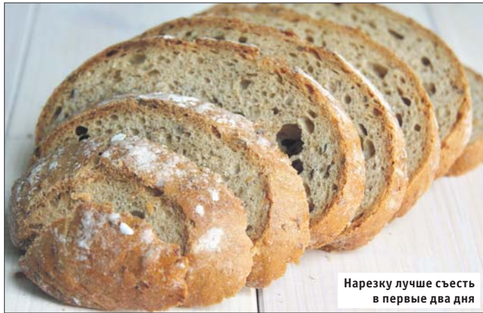
Нарезку лучше съесть в первые два дня