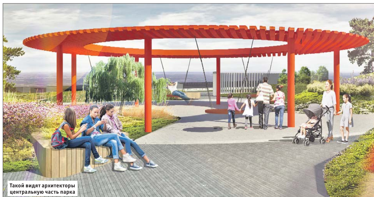
Такой видят архитекторы центральную часть парка

— Проект благоустройства Семёновского парка разработан с учётом исторической значимости этой территории. Рядом с расположенным в парке храмом Воскресения Христова обустроим сад памяти: установим там сохранившиеся мемориальные скульптуры и обелиски. У главно-