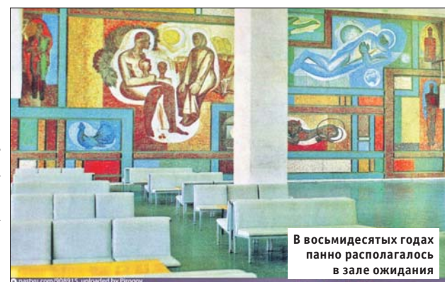
В восьмидесятых годах панно располагалось в зале ожидания

Новый автовокзал на Щёлковском шоссе, построенный в стиле советского модернизма по проекту архитектора Александра Рочегова (он также проектировал здание гостиницы «Ленинградская» и универмага «Мо-