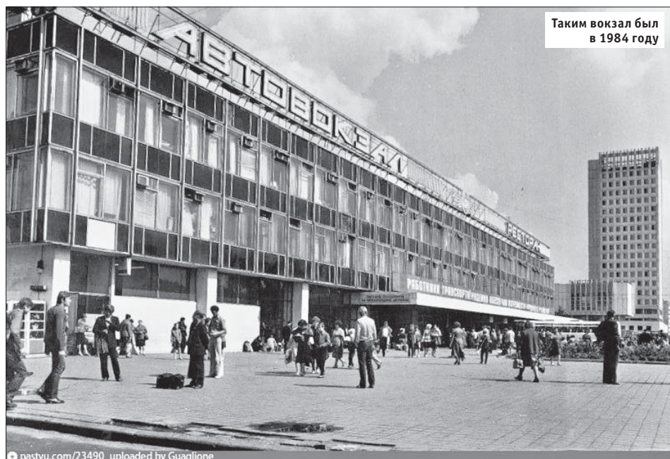
Таким вокзал был в 1984 году

Автовокзал обслуживал до 30 тысяч пассажиров в день