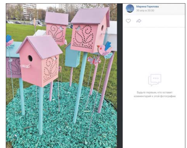
Подготовила Виола СЕРГЕЕВА