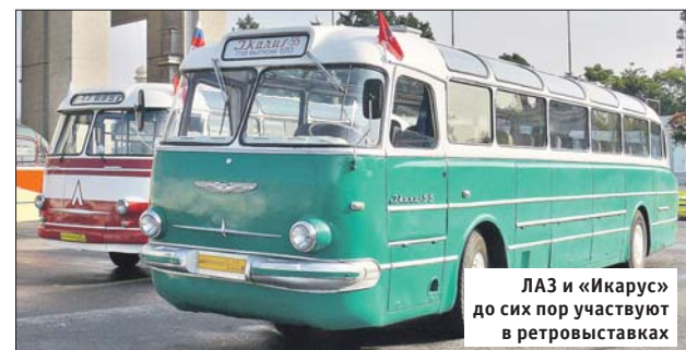
ЛАЗ и «Икарус» до сих пор участвуют в ретровыставках