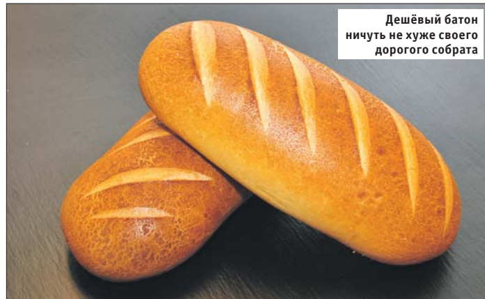
Дешёвый батон ничуть не хуже своего дорогого собрата

Для приготовления продукта, который может храниться пять-семь суток, разрешено