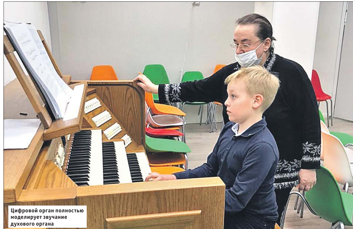
Цифровой орган полностью моделирует звучание духового органа

Начался приём детей в музыкальные школы округа