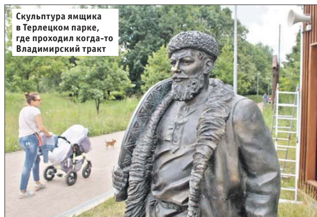
Скульптура ямщика в Терлецком парке, где проходил когда-то Владимирский тракт