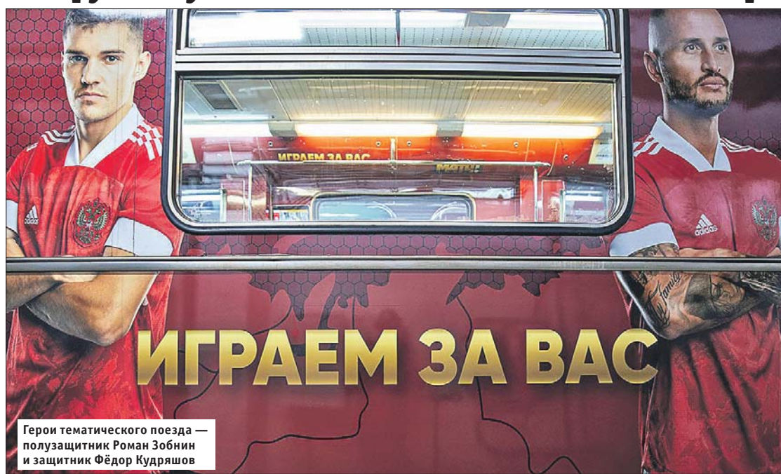
Герои тематического поезда — полузащитник Роман Зобнин и защитник Фёдор Кудряшов