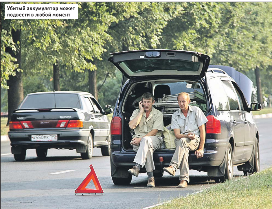
Убитый аккумулятор может подвести в любой момент

Несколько эффективных и дешёвых способов продлить жизнь автомобилю