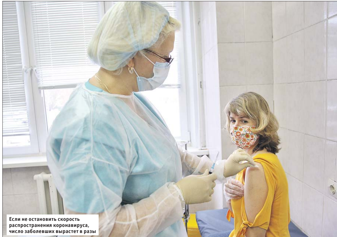
Если не остановить скорость распространения коронавируса, число заболевших вырастет в разы

▶ По решению мэра Москвы Сергея Собянина с 13 по 20 июня 2021 года временно приостанавливается работа детских игровых комнат и фуд-кортков в торговых центрах. В парках и скверах закрыты аттракционы, детские и спортивные площадки, пункты проката, беседки. Рестораны, бары, ночные клубы должны закрываться в 23.00 (разрешено обслуживать вынос).