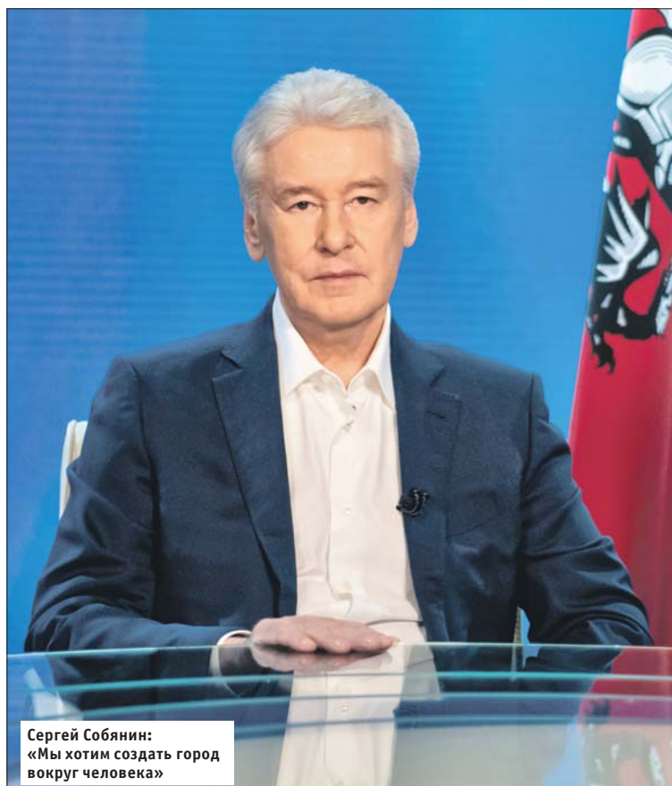
Сергей Собянин: «Мы хотим создать город вокруг человека»

Но сегодня мы хотим создать город вокруг человека. Вокруг его желаний и потребностей. Самых разных — от желания погулять с детьми в парке возле дома до потребности получить качественную медицинскую помощь. Город, в центре которого — человек. Каждый житель Москвы. Удобный, красивый, безопасный, зелёный, современный, умный город.