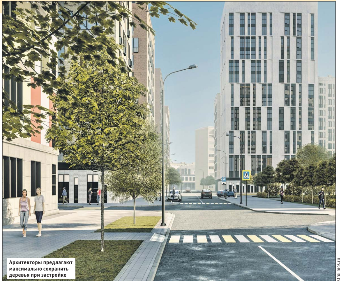
Архитекторы предлагают максимально сохранить деревья при застройке

Кроме того, хорошие шансы на успех в конкурсе у проекта застройки квартала 19б площадью более 12 га между МЦК,