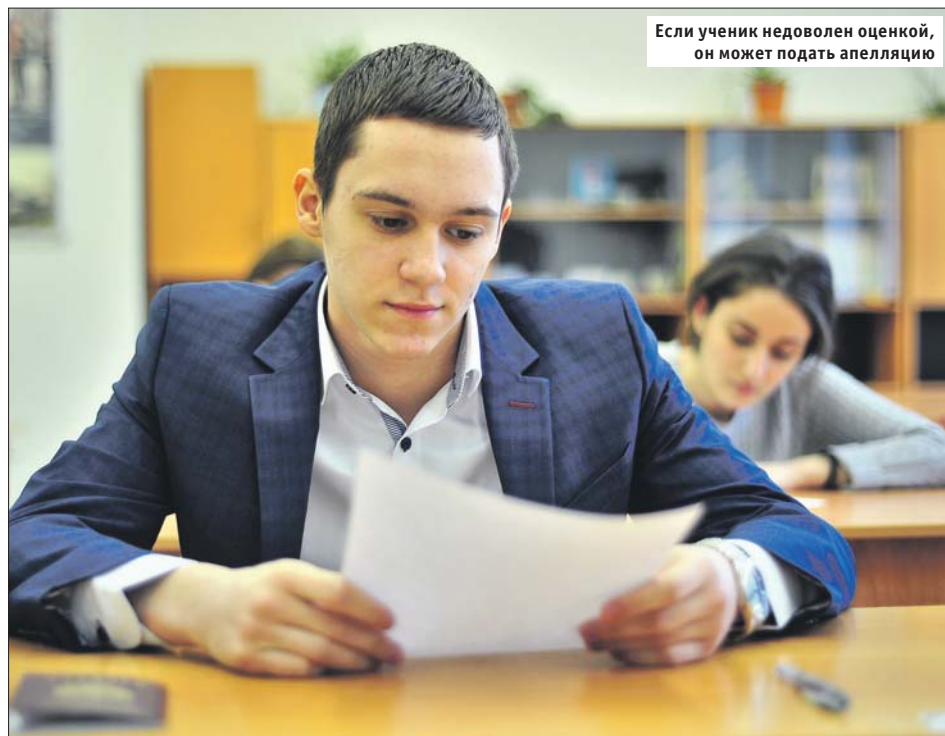
Если ученик недоволен оценкой, он может подать апелляцию

Если выпускник завалил ЕГЭ по русскому языку, он имеет право на пересдачу.