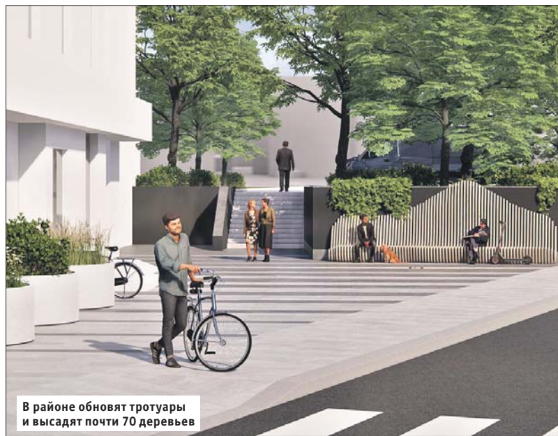
В районе обновят тротуары и высадят почти 70 деревьев