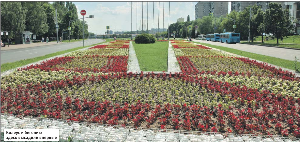
Колеус и бегонию здесь высадили впервые

В этом году цветников в Восточном округе стало больше