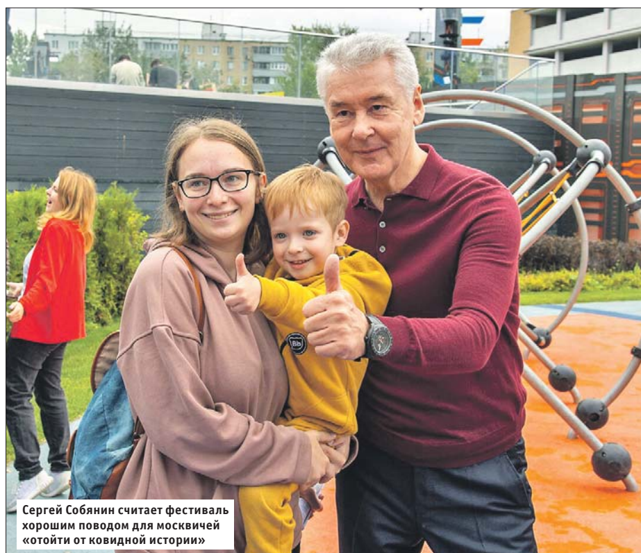
Сергей Собянин считает фестиваль хорошим поводом для москвичей «котить от ковидной истории»

Фестиваль по многочисленным просьбам жителей столицы подготовили на смену гастрономической ярмарке «Лето в городе», которая продлится до 29 августа. Он будет проходить со всеми ковидными ограничениями. Жители смогут не только посетить дизайнерские сады и фотолокации, но и попробовать летние блюда и десерты от участников «Лета в городе», которые тоже примут участие в фестивале «Цветочный джем».