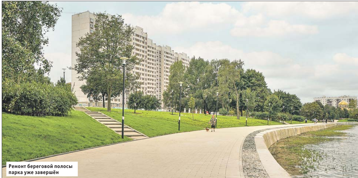
Ремонт береговой полосы парка уже завершён

В рамках благоустройства на территории парка проведено функциональное зонирование. Около дома 7 на Алтайской улице решено создать спортивный кластер. Что это значит? Прежде всего обновлённое футбольное поле с искусственным травяным покрытием, корт для большого тенниса и площадка для игры в волейбол и баскетбол. Также здесь предусмотрены зона с уличными