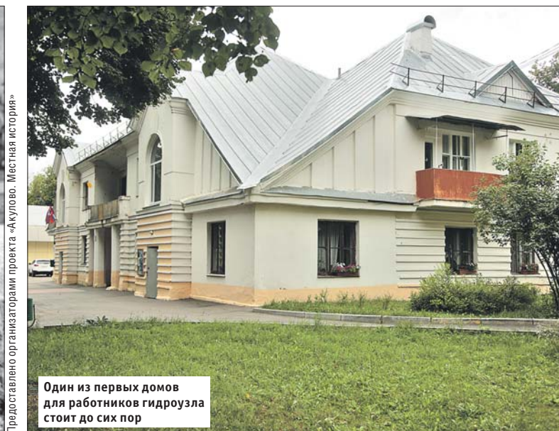
Один из первых домов для работников гидроузла стоит до сих пор