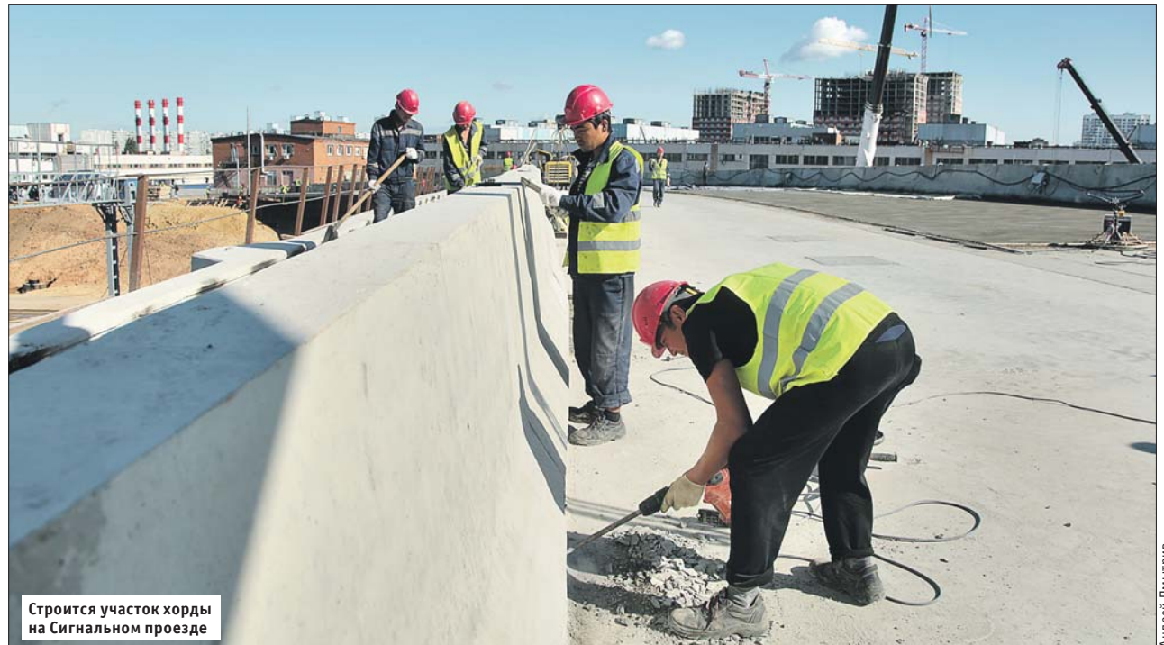
Строится участок хорды на Сигнальном проезде

Рафик Загрутдинов сообщил, что участок между Открытым и Ярославским шоссе планируют достроить в этом году. Он пройдёт рядом с путями МЦК. На развязке можно будет повернуть на Ярославку