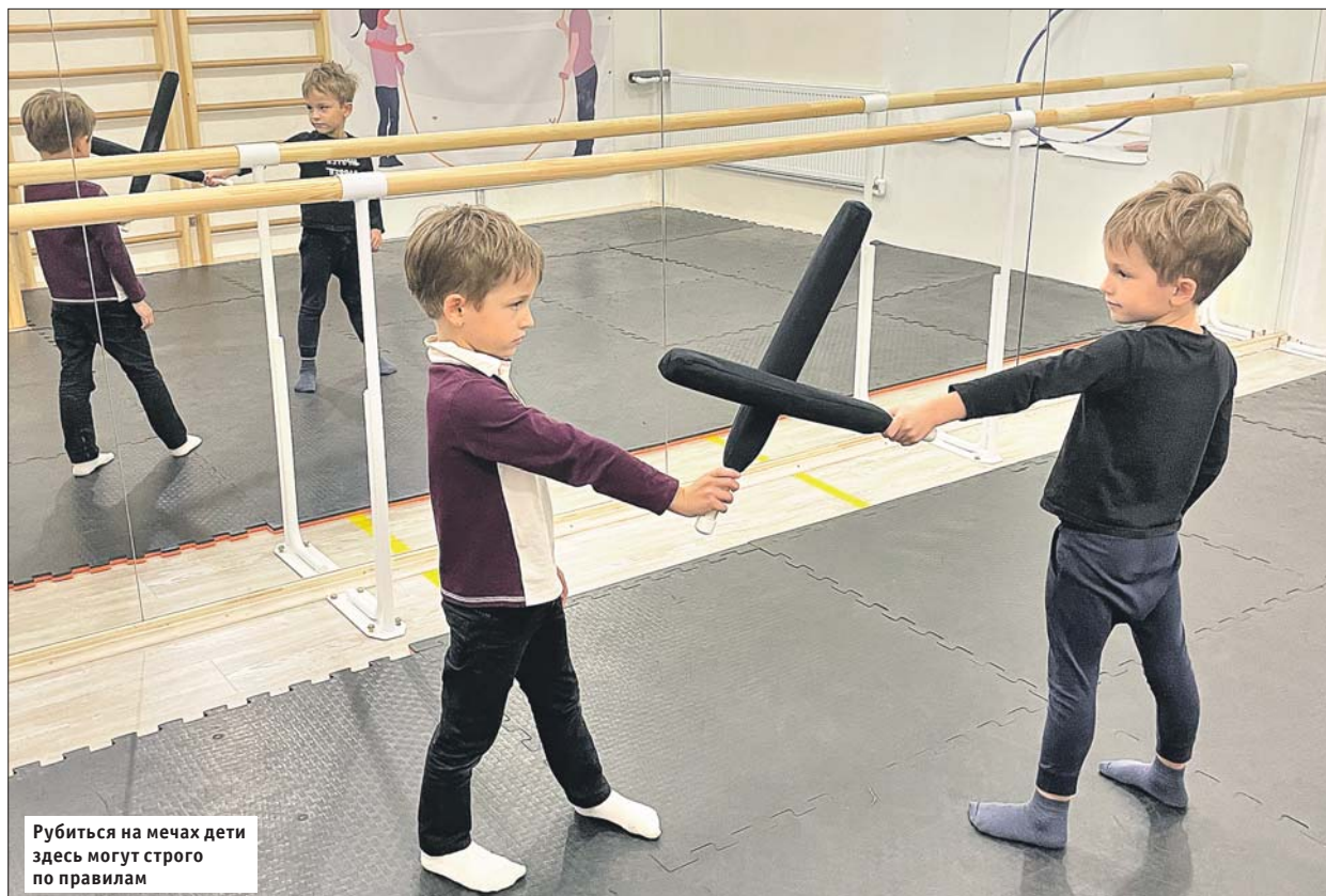
Рубиться на мечах дети здесь могут строго по правилам