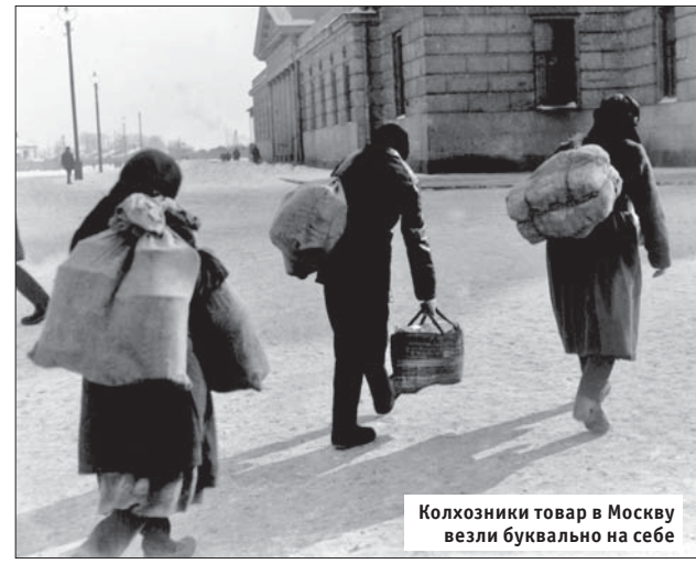
Колхозники товар в Москву везли буквально на себе