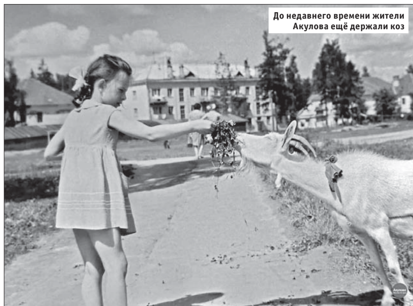
До недавнего времени жители Акулово ещё держали коз

Наш корреспондент заехал в самый дальний уголок ВАО