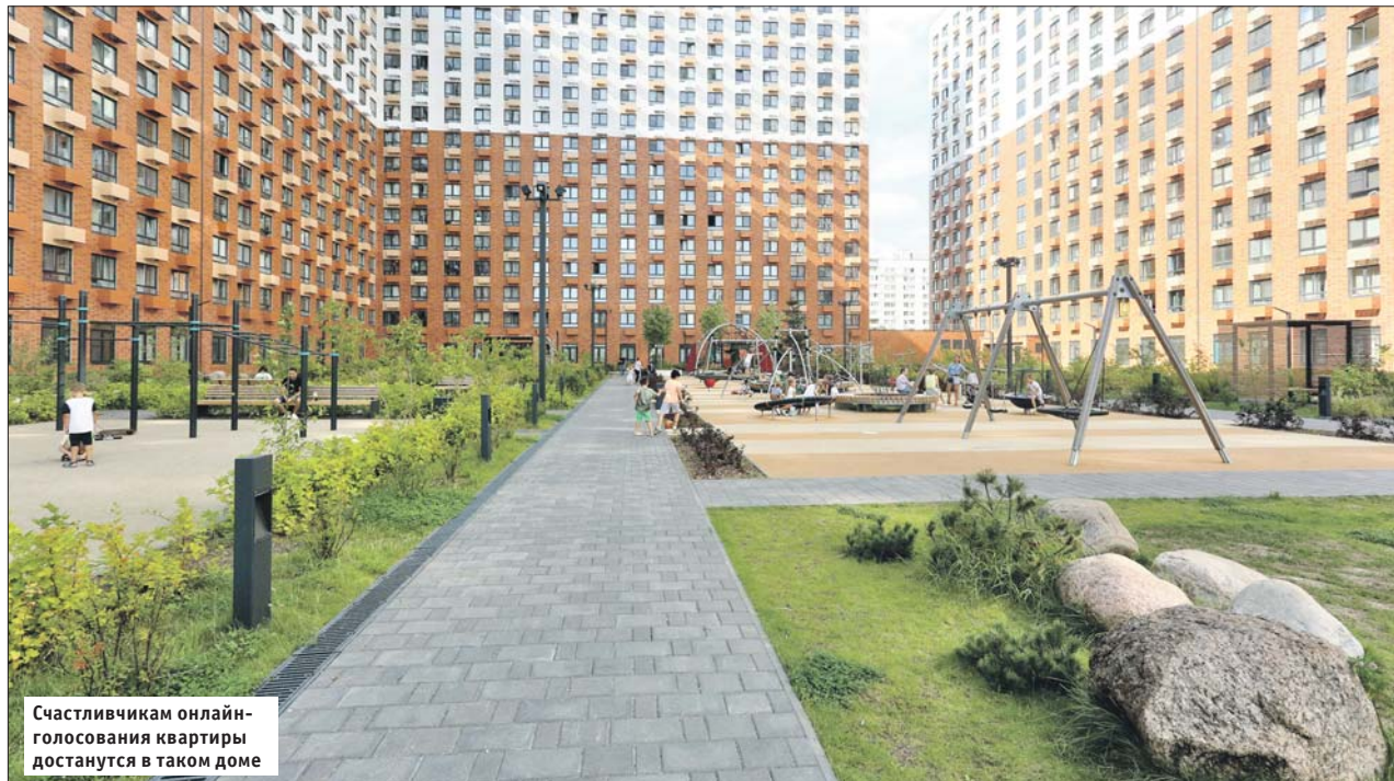
Счастливым онлайн-голосования квартиры достигнуты в таком доме

Данные желающих принять участие в выборах в режиме онлайн обязательно проверяет ЦИК России. Это не зависит от того, где и как гражданин подал заявление, но необходимо