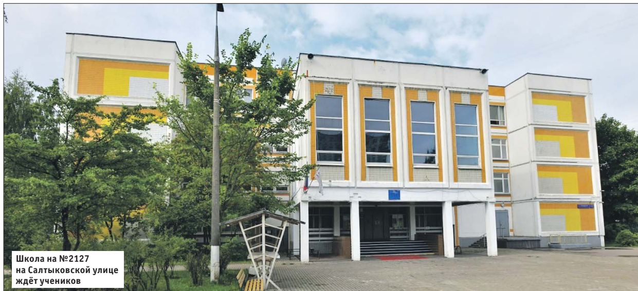
Школа на №2127 на Салтыковской улице ждёт учеников

Всего начиная с 2011 года в Москве было построено 316 детских садов и 117 школ. Строительство ведётся с активным привлечением инвесторов. Так, за счёт частных средств возвели более трети образовательных учреждений. А до 2023 года в столице планируется построить более 90 новых зданий школ и детских садов за счёт городского бюджета и примерно столько же за счёт инвесторов.