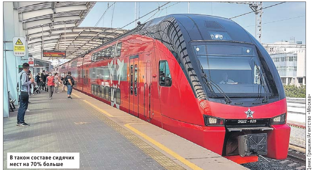
В таком составе сидячих мест на 70% больше