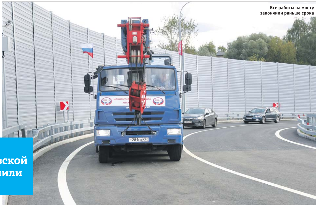
Все работы на мосту закончили раньше срока