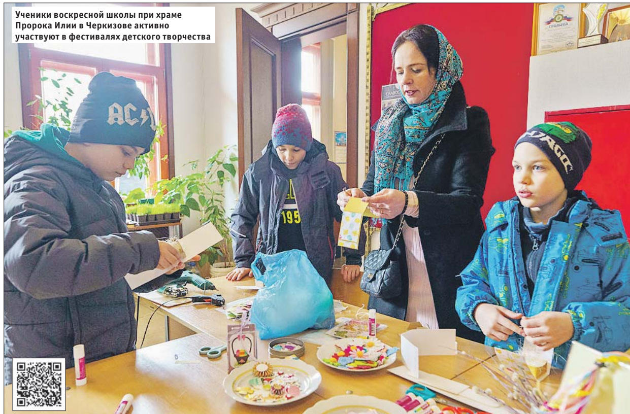
Ученики воскресной школы при храме Пророка Илии в Черкизове активно участвуют в фестивалях детского творчества

В этом году возобновляются занятия по самообороне на базе молодежного спортивного клуба «Ильин светоч», приостановленные во время пандемии.