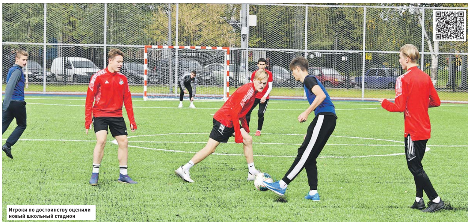
Игроки по достоинству оценили новый школьный стадион