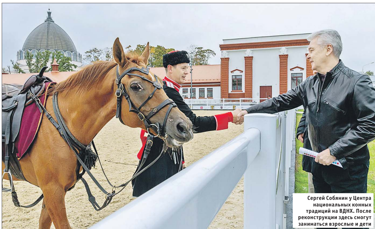
Сергей Собянин у Центра национальных конных традиций на ВДНХ. После реконструкции здесь смогут заниматься взрослые и дети

В выходные выставку посещают до 250 тысяч человек