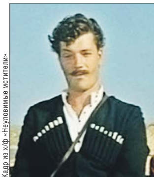
Кадр из х/ф «Неуловимые мстители»

Изделия известного советского актёра носят до сих пор