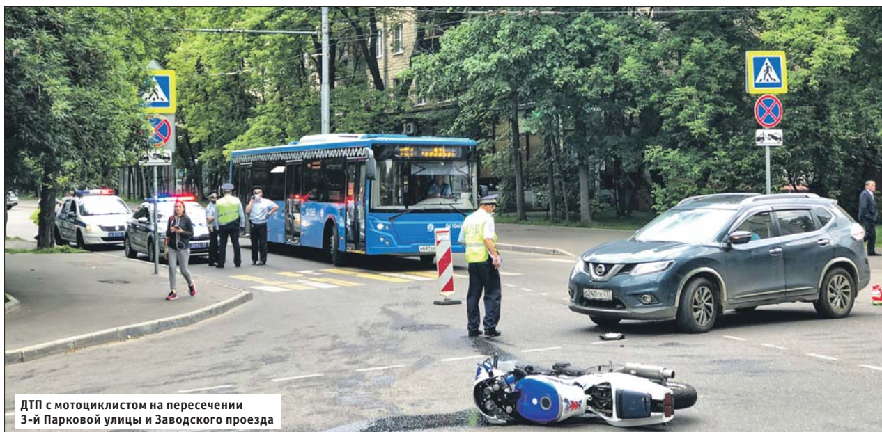
ДТП с мотоциклистом на пересечении 3-й Парковой улицы и Заводского проезда

Как избежать тяжёлых ДТП с участием «двухколёсных»