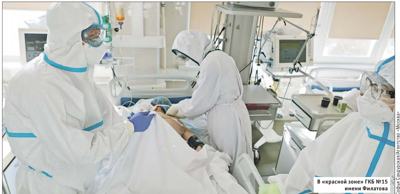
В «красной зоне» ГКБ №15 имени Филатова

— В реанимации всё больше молодых людей в крайне тяжёлом состоянии, которым требуется искусственная вентиляция лёгких. Реанимация работает в напряжённом режиме. Пациентов с каждым днём становится всё больше и больше. Избежать этой ситуации можно только одним способом — соблюдать режим