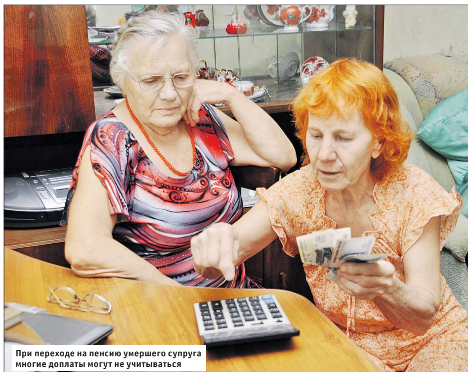
При переходе на пенсию умершего супруга многие доплаты могут не учитываться

Пенсия по потере кормильца, так же как и по старости, состоит из двух частей: фиксированной и страховой. В этом году фиксированная выплата для пенсии по старости — 6044,48 рубля, для пенсии по потере кормильца — в два раза меньше.