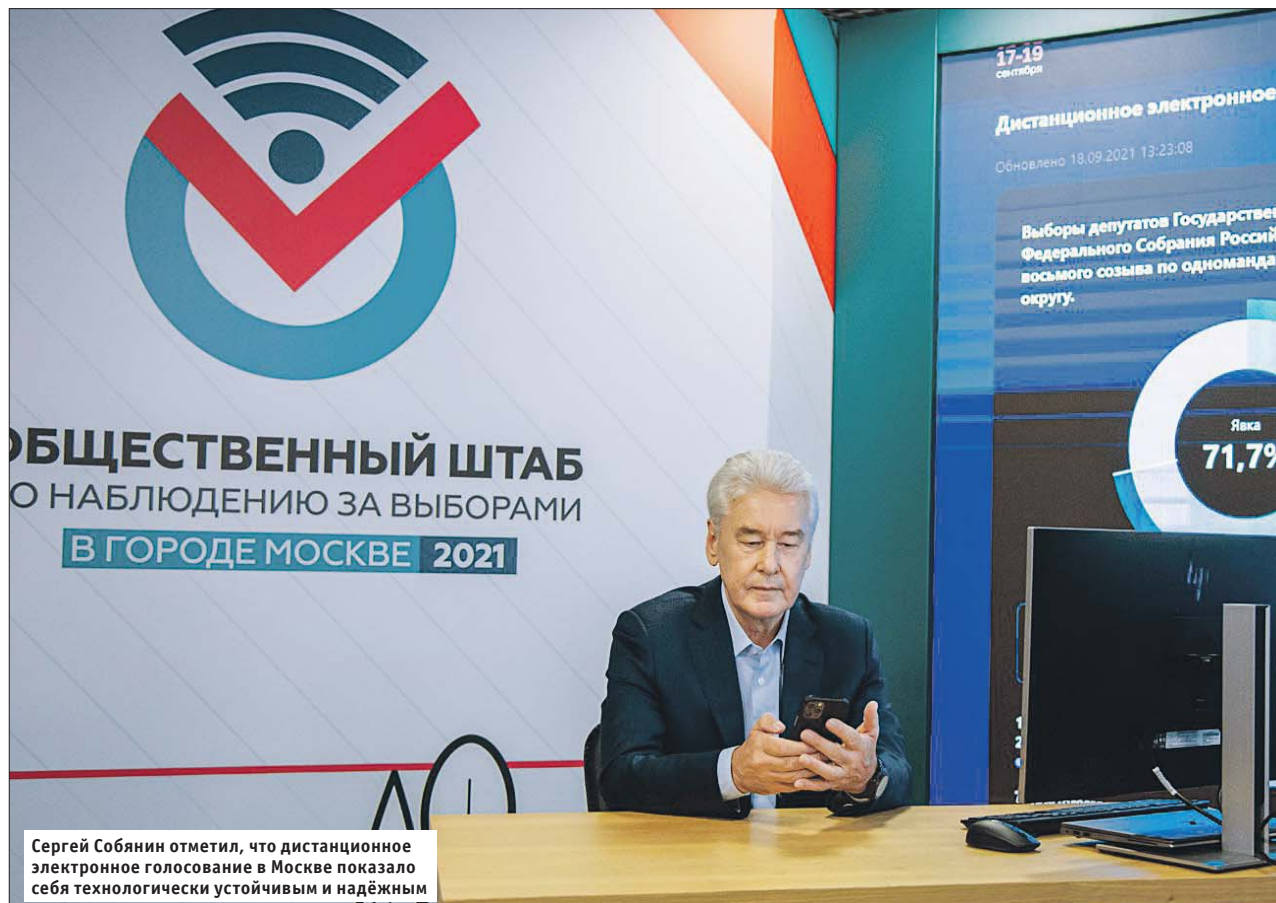
Сергей Собянин отметил, что дистанционное электронное голосование в Москве показало себя технологически устойчивым и надёжным

— ДЭГ не только простой в использовании, но и удобный инструмент, которым будут пользо-