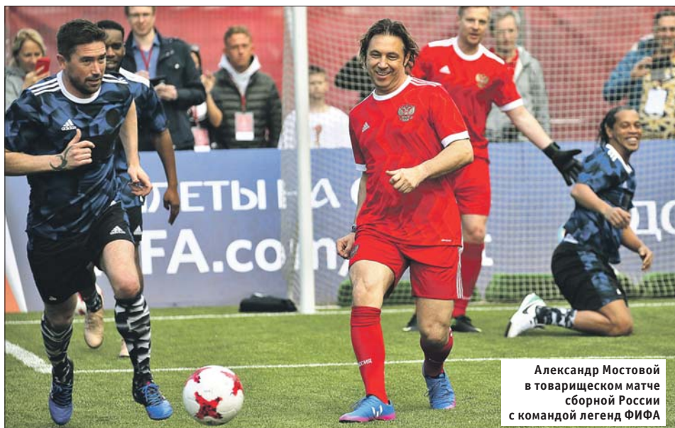
Александр Мостовой в товарищеском матче сборной России с командой легенд ФИФА

Автор благодарит за содействие в подготовке интервью спортивное интернет-радио «Движение»