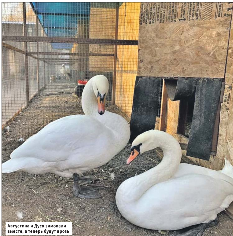
Августина и Дуся зимовали вместе, а теперь будут врозь