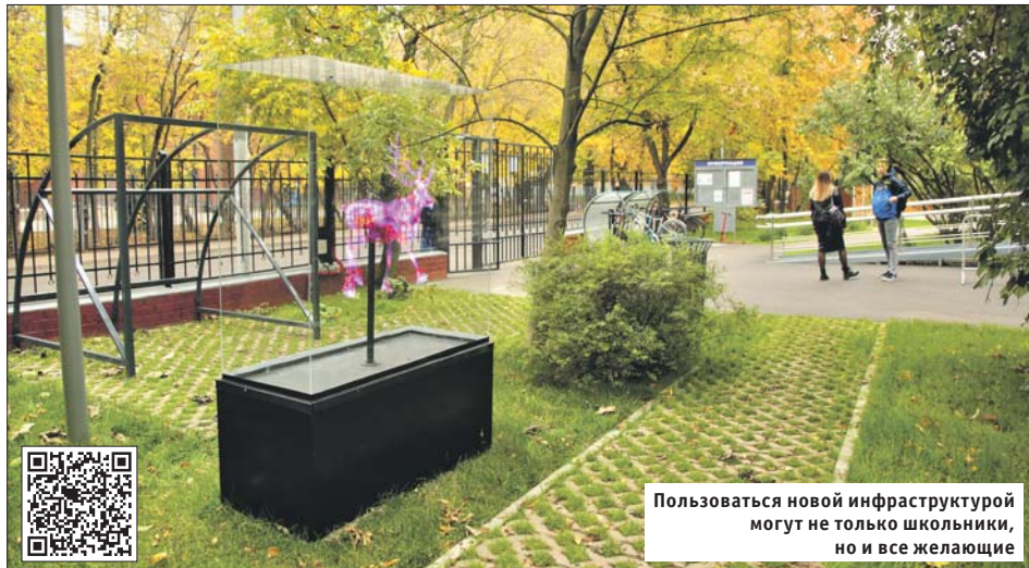
Пользоваться новой инфраструктурой могут не только школьники, но и все желающие

Плюс здесь уложили новые асфальтовые дорожки, постелили газон, поменяли уличное освещение. Также оборудовали воркаут-площадку, беговую дорожку и площадку для игр в баскетбол, волейбол, мини-футбол и хоккей. На территории смонтировали и ам-