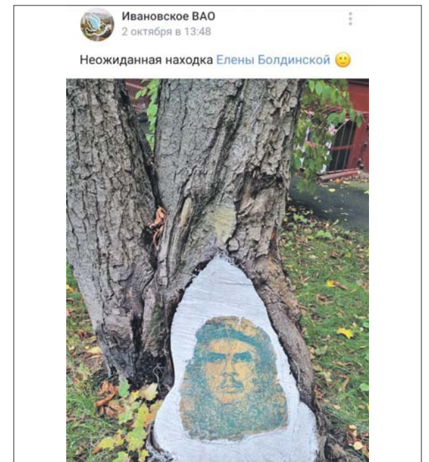
Подготовила Виола СЕРГЕЕВА