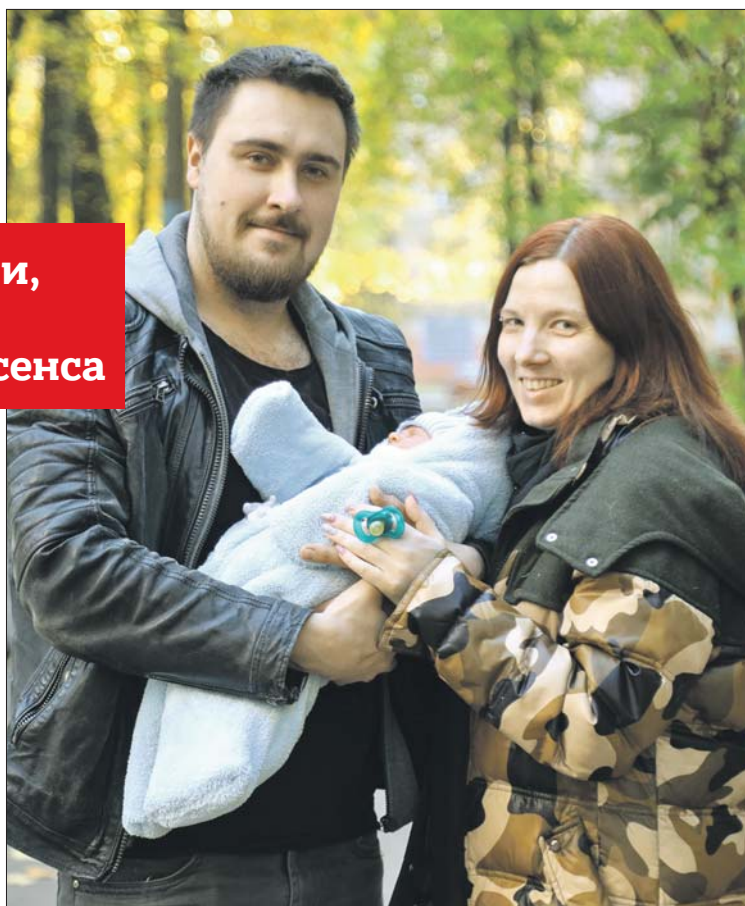
На днях супруги вышли с малышом на первую прогулку