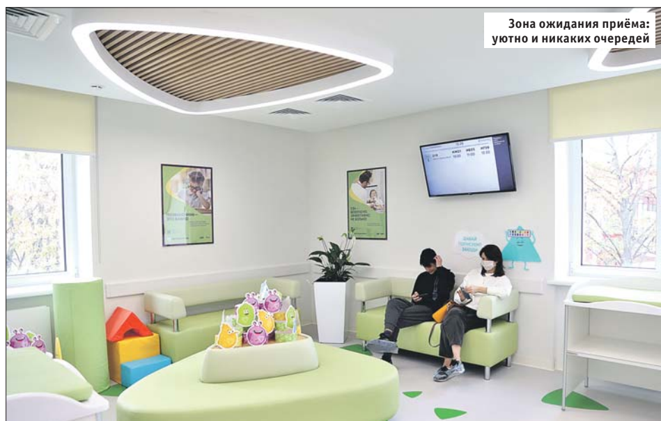
Зона ожидания приёма уютно и никаких очередей

В зонах комфортного ожидания — большое информационное табло с указанием номеров кабинетов, фамилий врачей и времени приёма пациентов. На удобных диванах