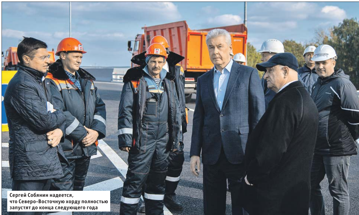
Сергей Собянин надеется, что Северо-Восточную хорду полностью запустят до конца следующего года

Длина новой дороги — около 3 км. Теперь добраться из районов Западное и Восточное Дегунино, из Тимирязевского, Бескудниковского и Головинского на севере в районы Отрадное, Марфино и Останкинский на северо-востоке города проще. К примеру, автомобилистам больше не надо выезжать на Ботаническую улицу и Алтуфьевское шоссе, чтобы попасть в Отрадное. Теперь для этого достаточно выехать на построен-