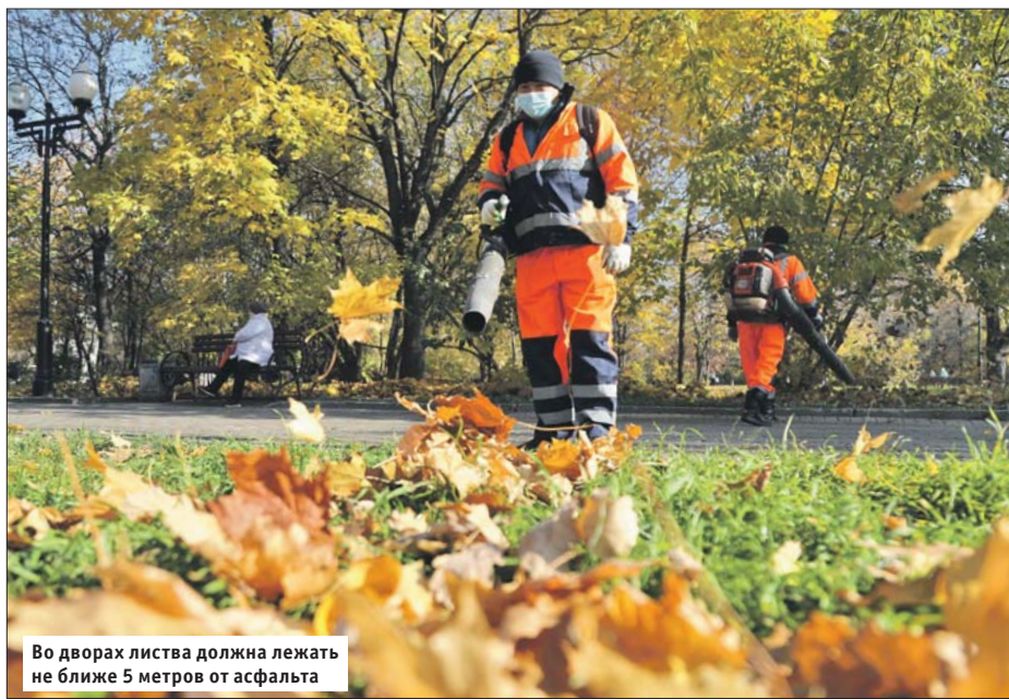
Во дворах листва должна лежать не ближе 5 метров от асфальта

Почему на различных участках с листопадом борются по-разному