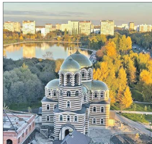
Представлено храмом Святителя Ермогена на Уральской