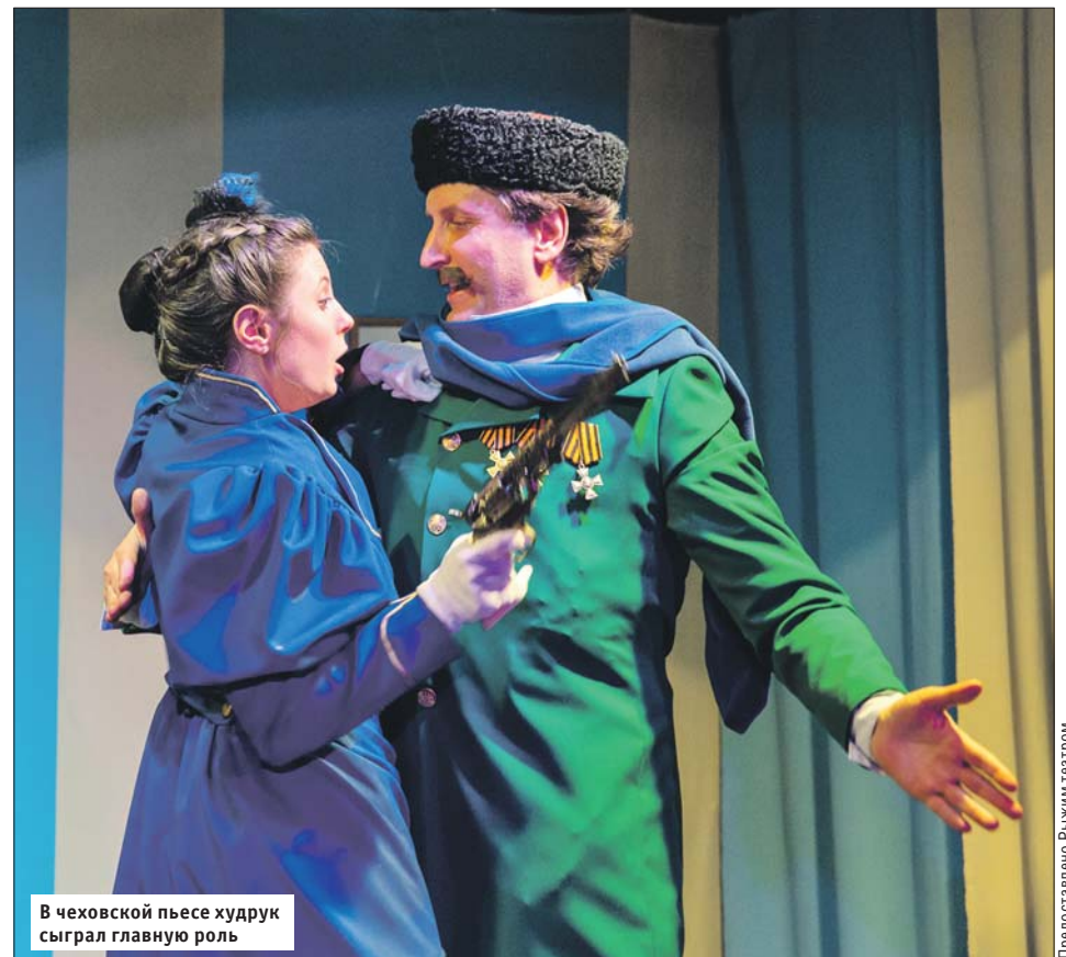
В чеховской пьесе худрук сыграл главную роль