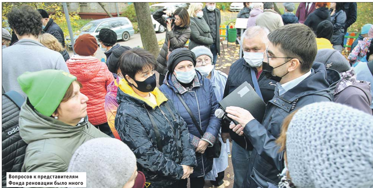
Вопросов к представителям Фонда реновации было много

На детской площадке во дворе домов 16, корпуса 1-4, на Байкальской улице установили столы с информационными стендами и буклетами, где отражены характеристики новостройки на площади Белы Куна. У этого дома будет два подъезда и 294 квартиры: 92 однушки, 157 двушек и 45 трёшек. Отделка в каждой — по стандартам программы реновации. В цоколе строители сделают автостоянку, а во дворе благоустроят места для тихого отдыха, детские и спортивную площадки.