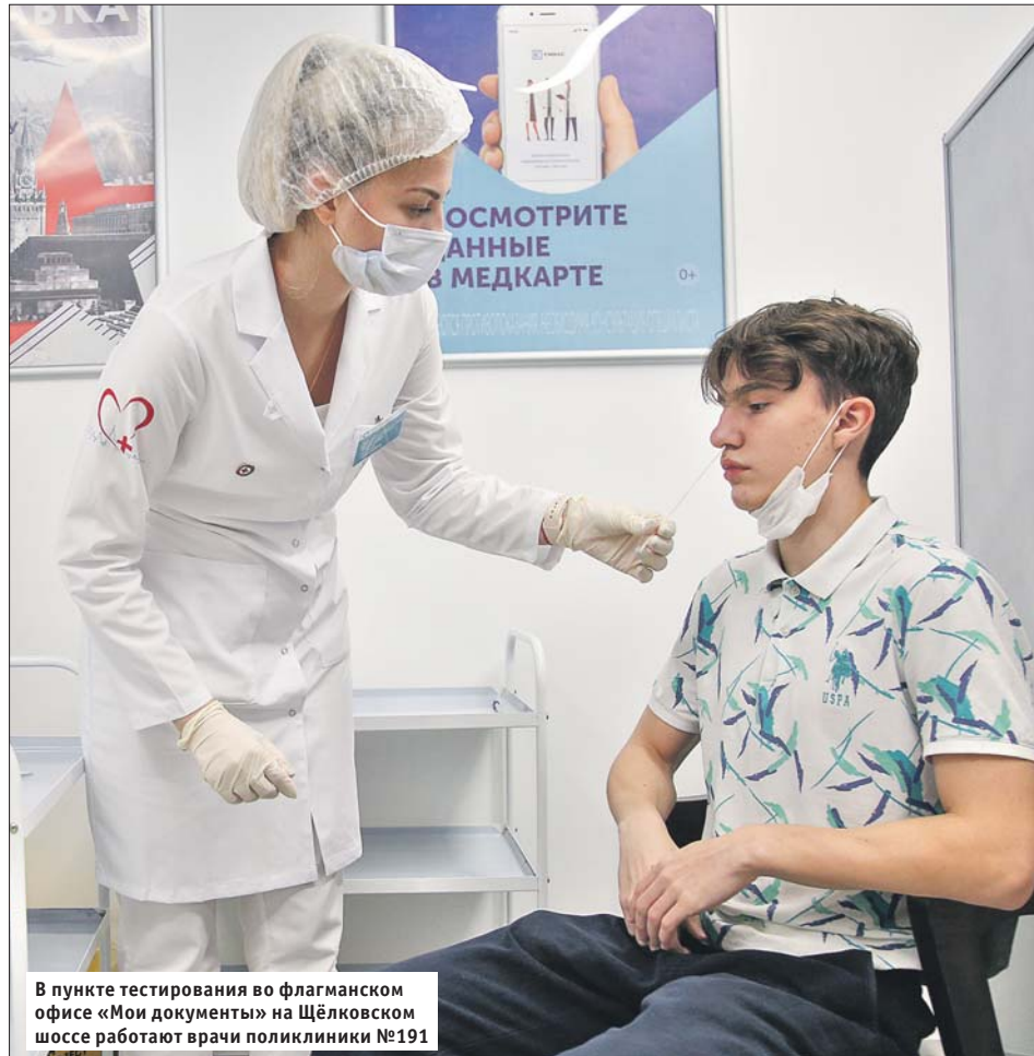
В пункте тестирования во флагманском офисе «Мои документы» на Щёлковском шоссе работают врачи поликлиники №191