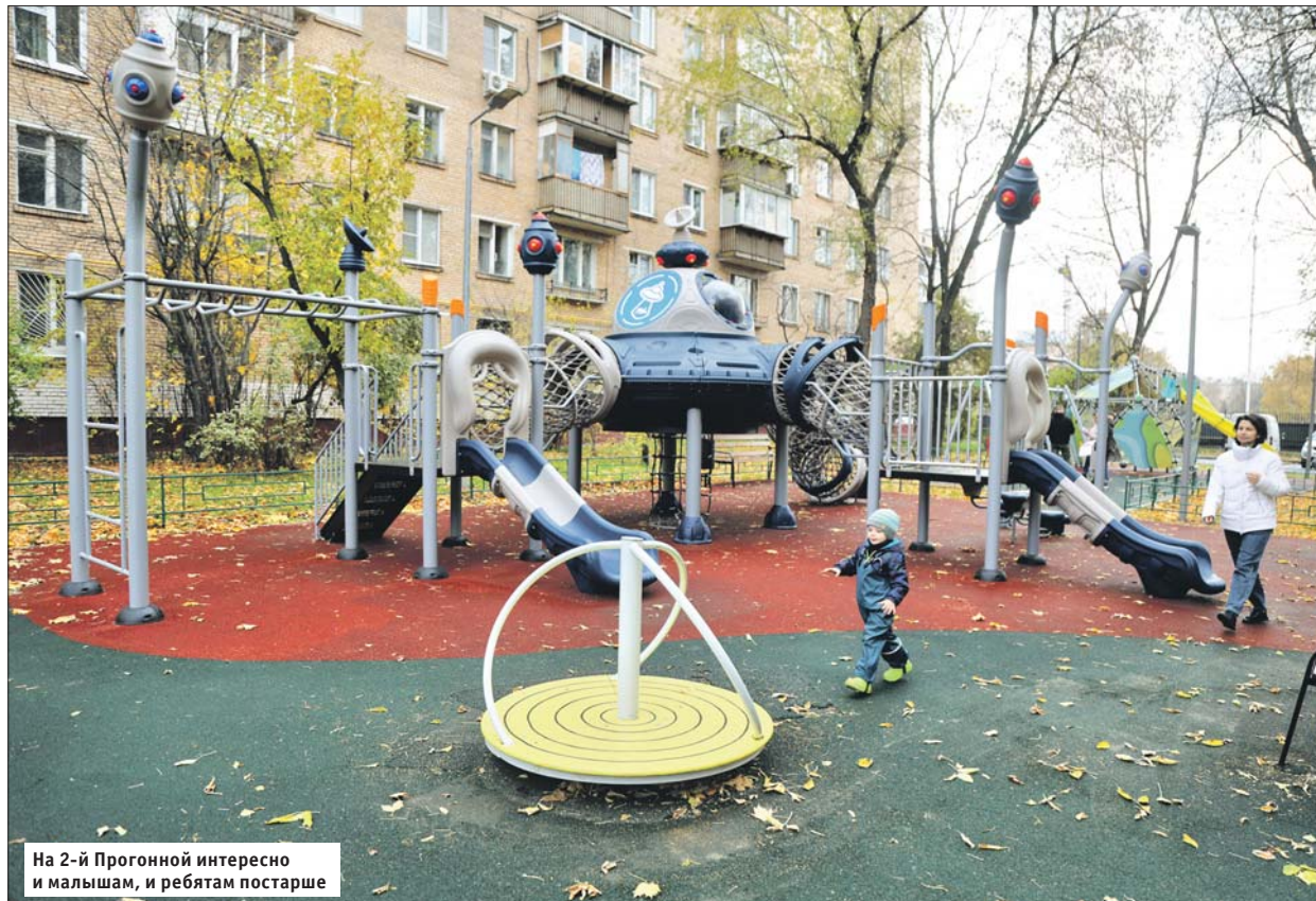
На 2-й Прогонной интересно и малышам, и ребятам постарше

— В этом году по программе «Мой район» мы благоустроили 145 детских площадок. Современные площадки дают массу возможностей для разностороннего развития ребёнка, — отметил префект ВАО Николай Алешин. — Особое внимание уделяется их безопасности. Устанавливается только сертифицированное игровое оборудование. Покрытие тоже не должно быть травмоопасным, поэтому в последнее время применяют резиновую крошку. Она отвечает всем требованиям безопасности и представлена обширной цветовой гаммой.