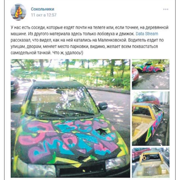
Подготовила Виола СЕРГЕЕВА