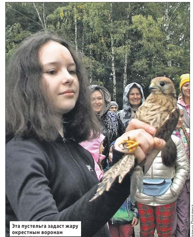
Эта пустельга задала жару окрестным воронам