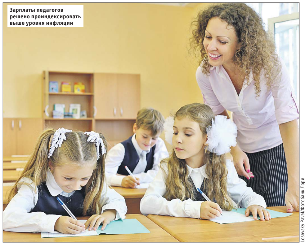
Зарплаты педагогов решено проиндексировать выше уровня инфляции

Начнётся строительство участка метро от «Щёлковской» до района Гольяново