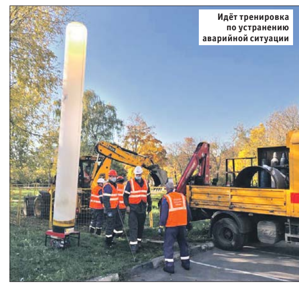
Идёт тренировка по устранению аварийной ситуации