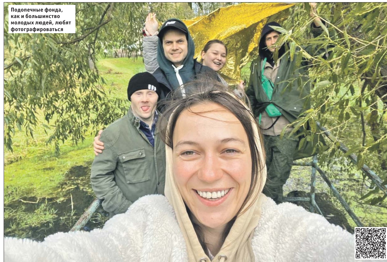
Подопечные фонда, как и большинство молодых людей, любят фотографироваться

Людей с ментальными расстройствами учат готовить еду и снимать фильмы