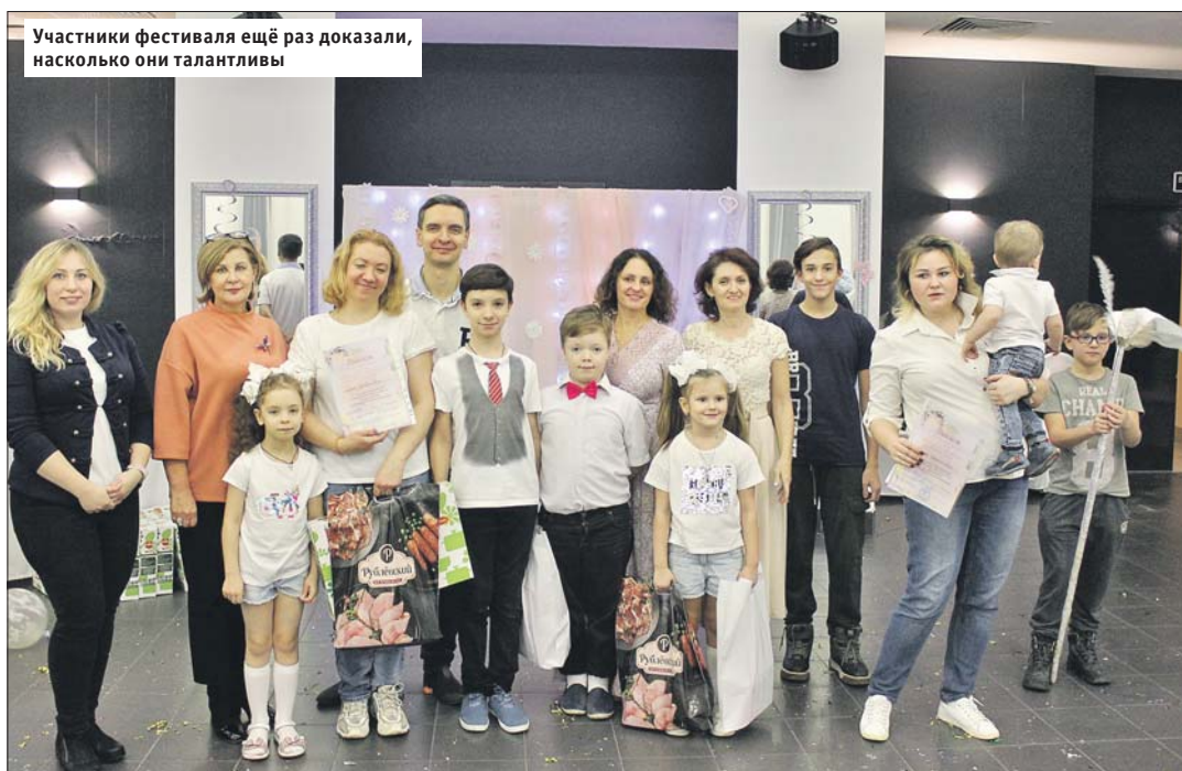
Участники фестиваля ещё раз доказали, насколько они талантливы