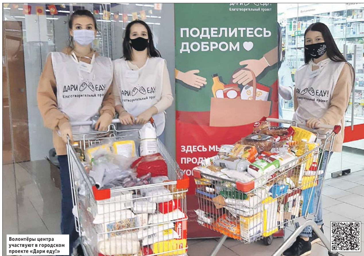
Волонтеры центра участвуют в городском проекте «Дари еду!»

В районе Новокосино работает центр помощи многодетным семьям