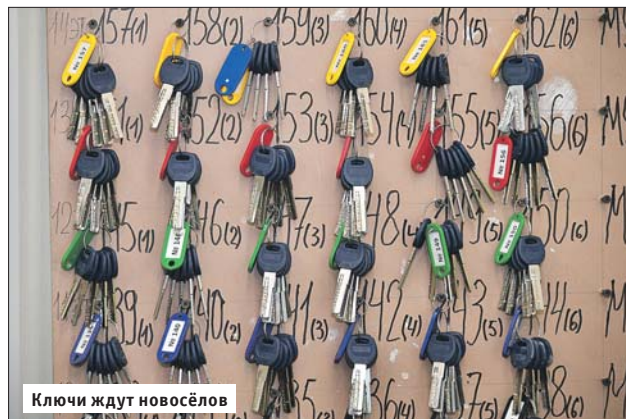
Ключи ждут новосёлов