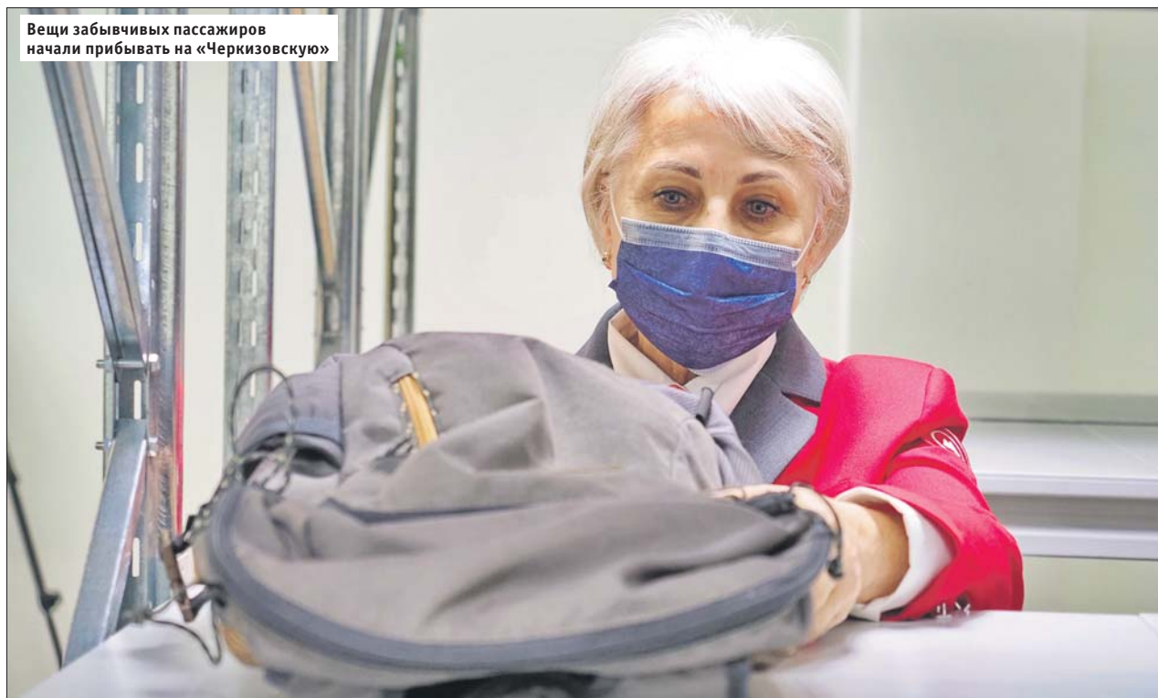
Вещи забывчивых пассажиров начали прибывать на «Черкизовскую»