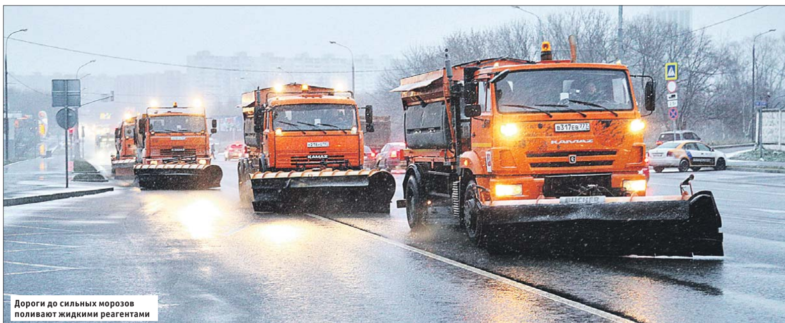
Дороги до сильных морозов поливают жидкими реагентами

Какими реагентами посыпают улицы и дороги округа