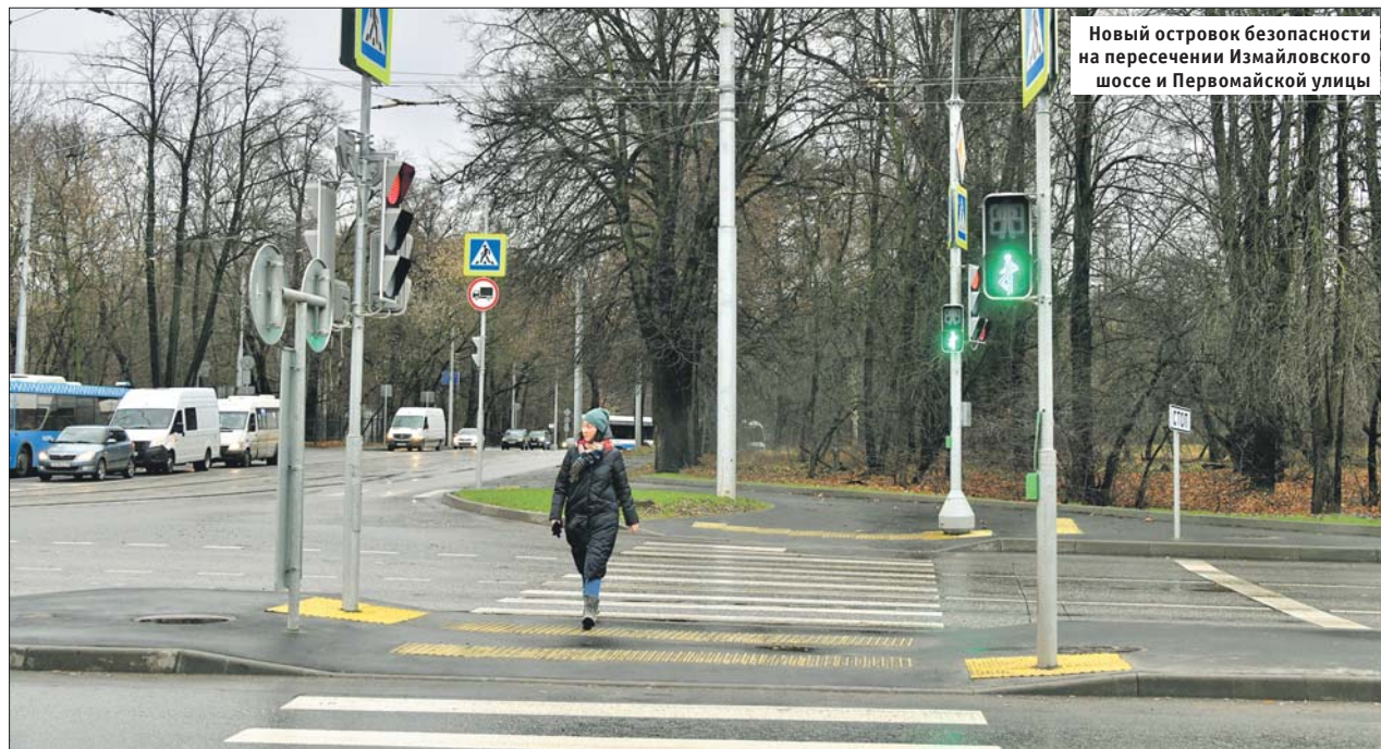
Новый островок безопасности на пересечении Измайловского шоссе и Первомайской улицы

Островки безопасности могут быть сделаны с помощью разметки или бордюра. Их создают рядом с пешеходными переходами, причём не важно, стоят у «зебры» светофоры или нет. Машинам на островки въезд запрещён. Особенно важны та-