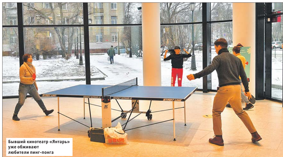
Бывший кинотеатр «Янтарь» уже обживают любители пинг-понга

Программа реконструкции старых кинотеатров началась в 2014 году. 39 районных кинозалов передали частному инвестору. В нашем округе после ре-