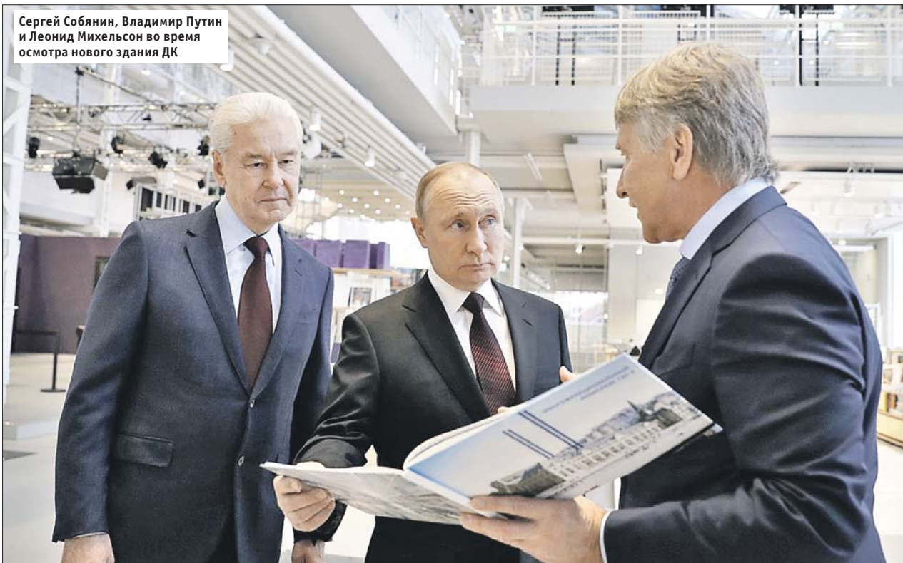
Сергей Собянин, Владимир Путин и Леонид Михельсон во время осмотра нового здания ДК

для крепления конструкций была использована классическая клёпка — никакой сварки или винтовых соединений», — сообщил столичный градоначальник.