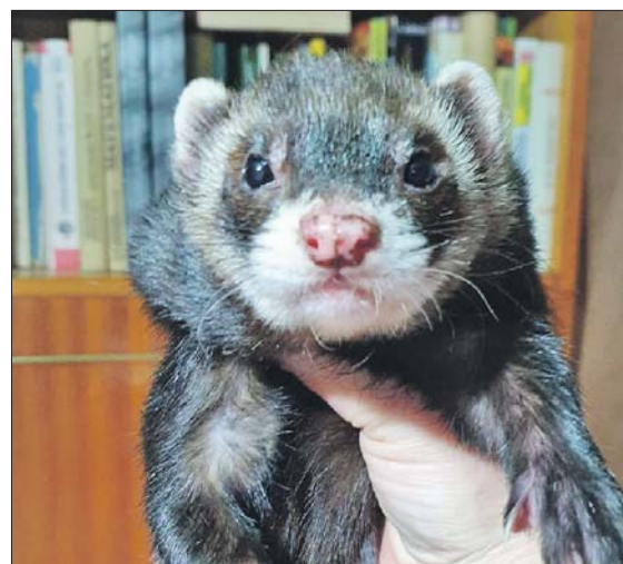
Один из найдёнышей уже нашёл нового хозяина