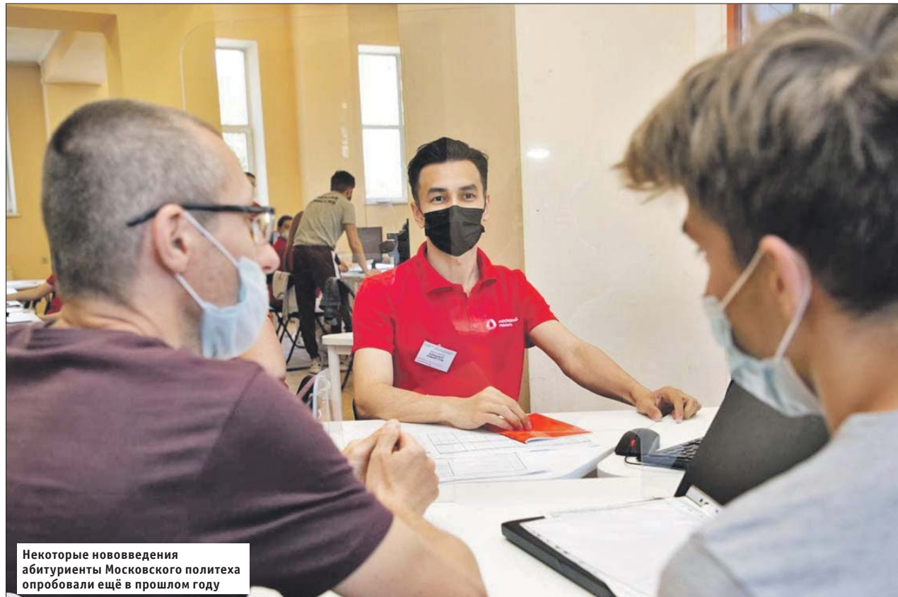
Некоторые нововведения абитуриенты Московского политеха опробовали ещё в прошлом году

Какие новшества ждут абитуриентов в этом году