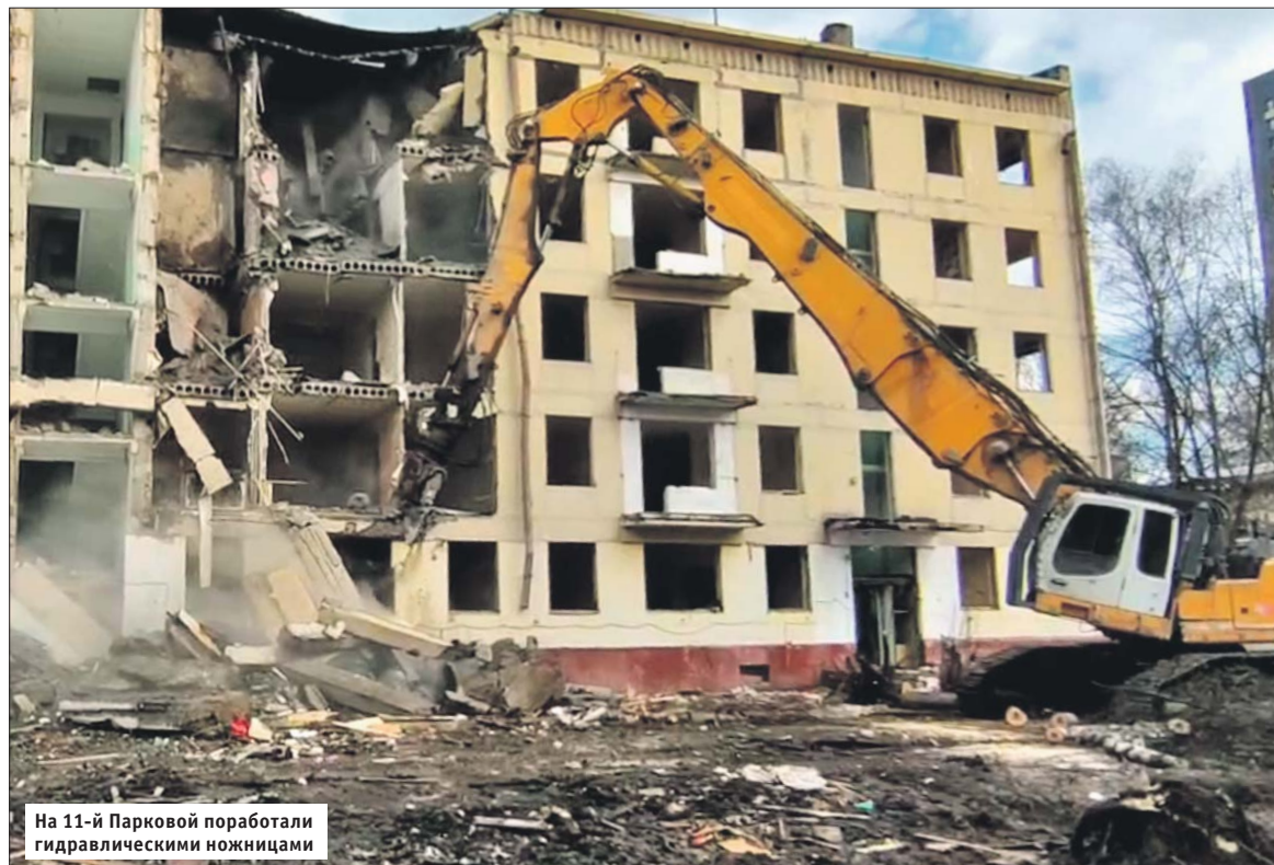
На 11-й Парковой поработали гидравлическими ножницами