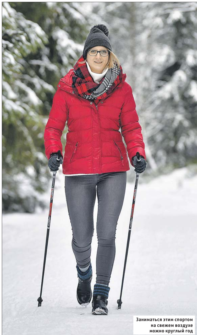
Заниматься этим спортом на свежем воздухе можно круглый год

Кстати, начинать надо только в секции, под руководством тренера, чтобы не навредить себе. Приведу пример: мужчина пришёл к нам с палками, длину которых подобрал по формулам в Интернете. Но стал жаловаться на боль в плечах. Тренер посмотрел и понял: из-за особенностей позвоночника нужны палки короче.