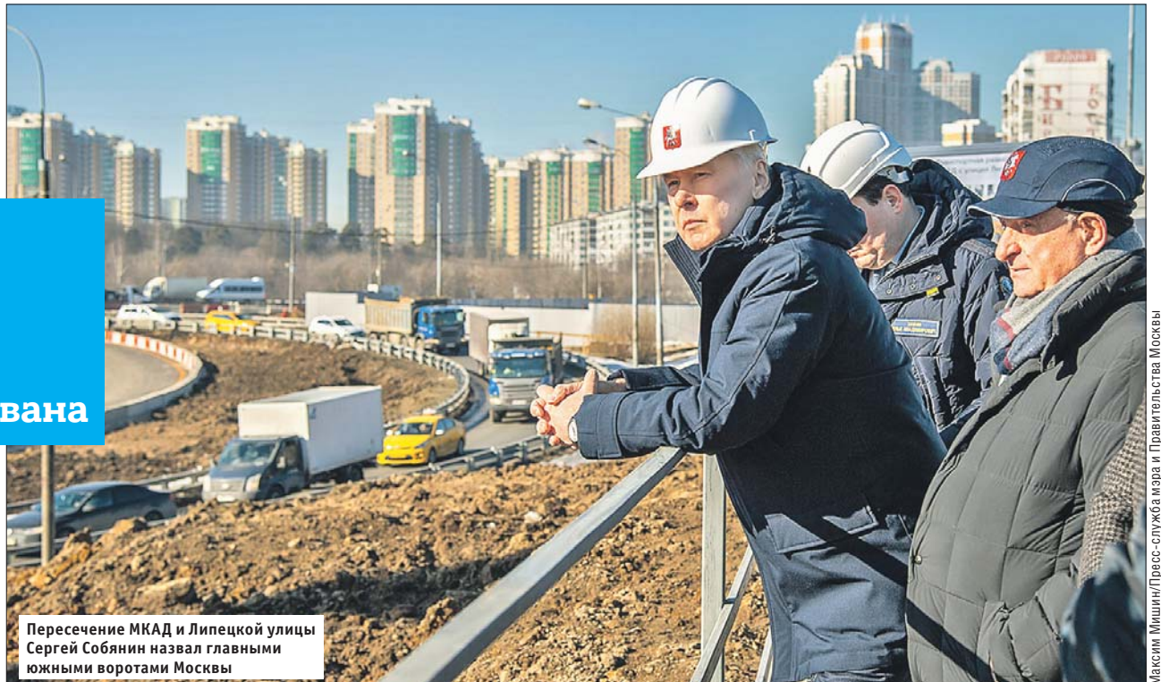
Пересечение МКАД и Липецкой улицы Сергей Собянин назвал главными южными воротами Москвы