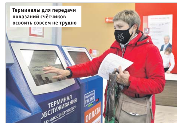
Терминалы для передачи показаний счётчиков освоить совсем не трудно