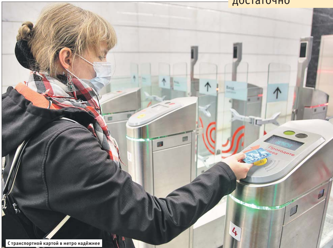
С транспортной картой в метро надёжнее

Способов оплаты поезда в метро достаточно