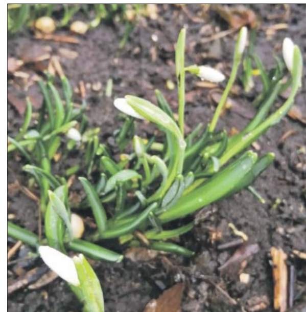
Подготовила Виола СЕРГЕЕВА