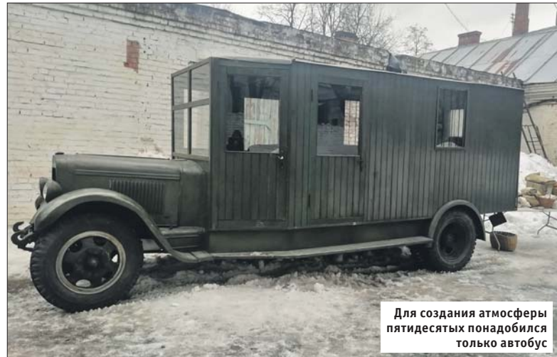
Для создания атмосферы пятидесятых понадобился только автобус