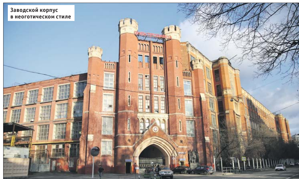
Заводской корпус в неоготическом стиле