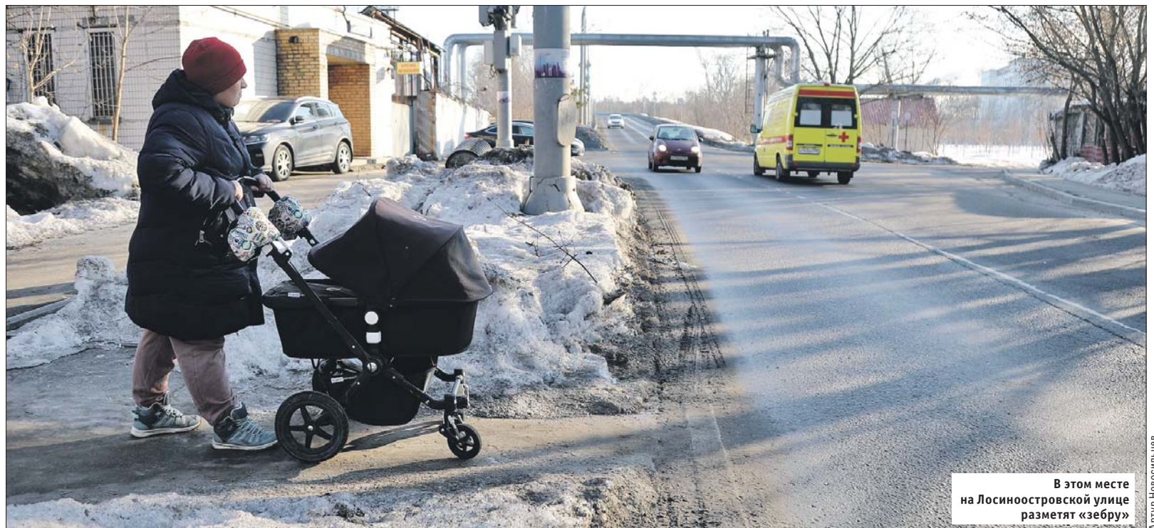
В этом месте на Лосиноостровской улице разметят «зебру»

Искусственные дорожные неровности планируются по 36 адресам