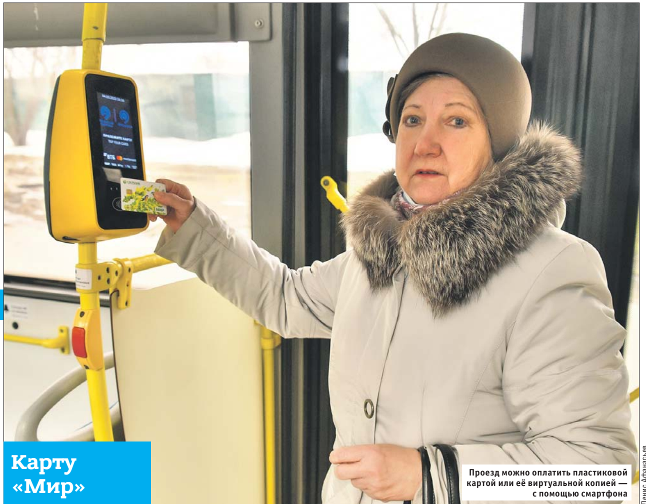
Проезд можно оплатить пластиковой картой или её виртуальной копией — с помощью смартфона

По карте «Мир» можно приобретать товары и услуги со скидкой. Они предоставляются в супермаркетах, в магазинах с товарами для животных и др.