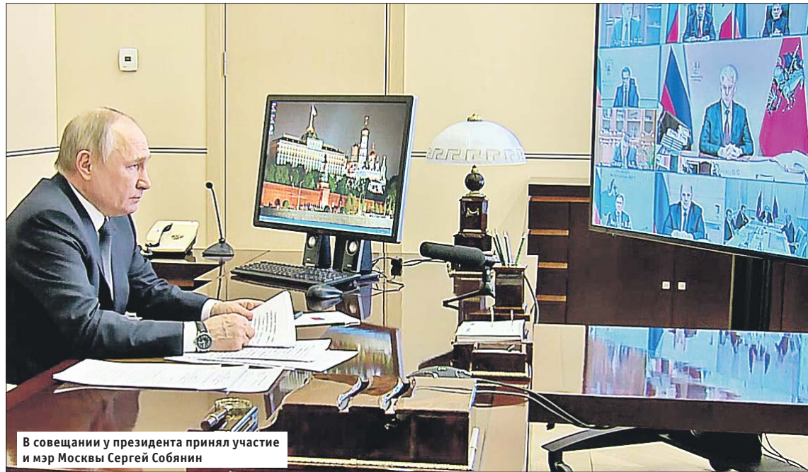
В совещании у президента принял участие и мэр Москвы Сергей Собянин

В столице продолжают реализацию всех принятых программ