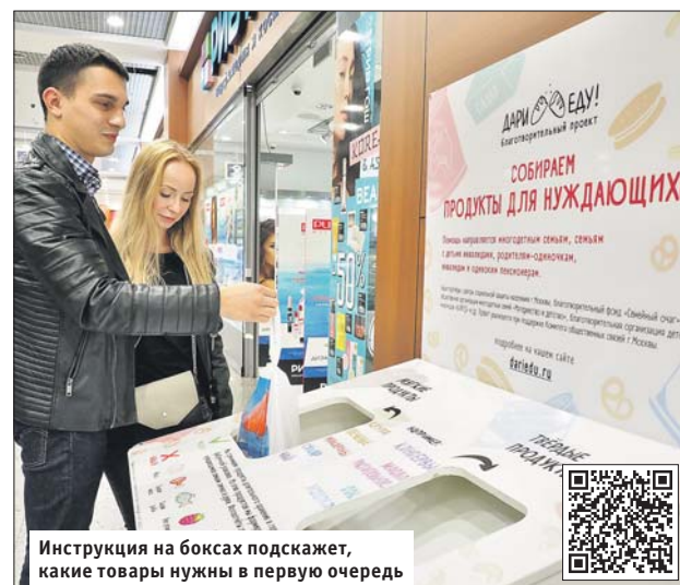
Инструкция на боксах подскажет, какие товары нужны в первую очередь

Коробки, как правило, установлены возле касс, чтобы их заметили посе-