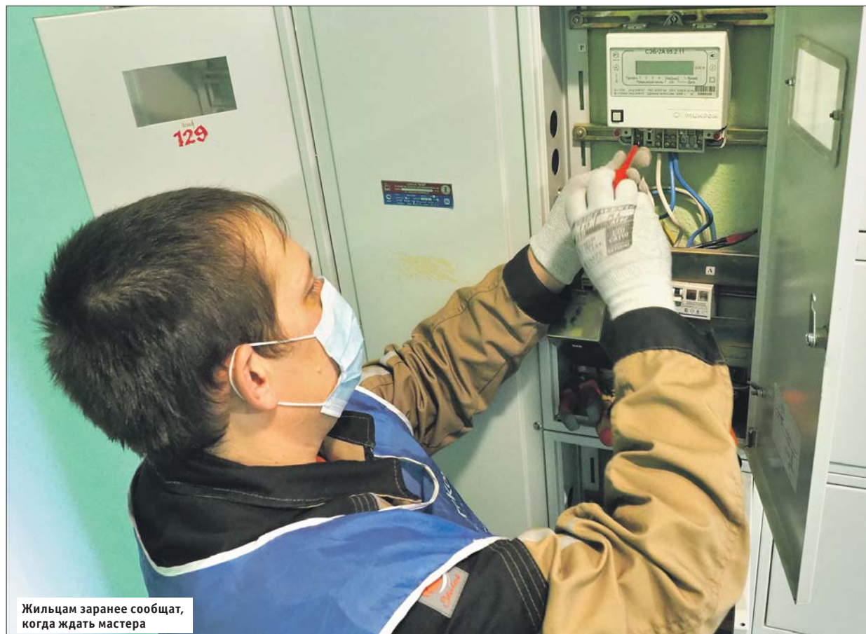
Жильцам заранее сообщат, когда ждать мастера

В домах Москвы планируют ставить приборы российского производства. График замены в ближайшее время появится на сайте АО