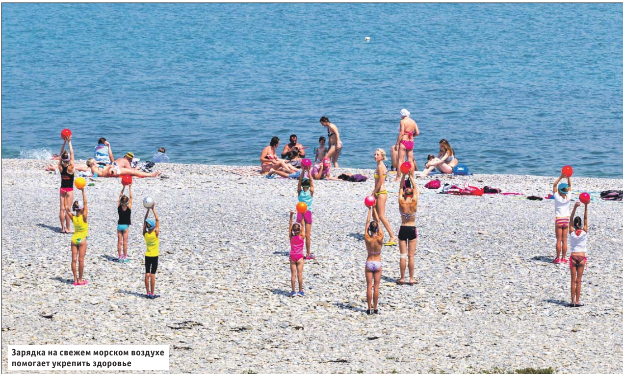
Зарядка на свежем морском воздухе помогает укрепить здоровье

Как получить бесплатную путёвку для ребёнка-инвалида