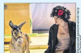
Московский драматический театр на Переславской

Куда сходить в округе на «Ночь театров» стр. 14