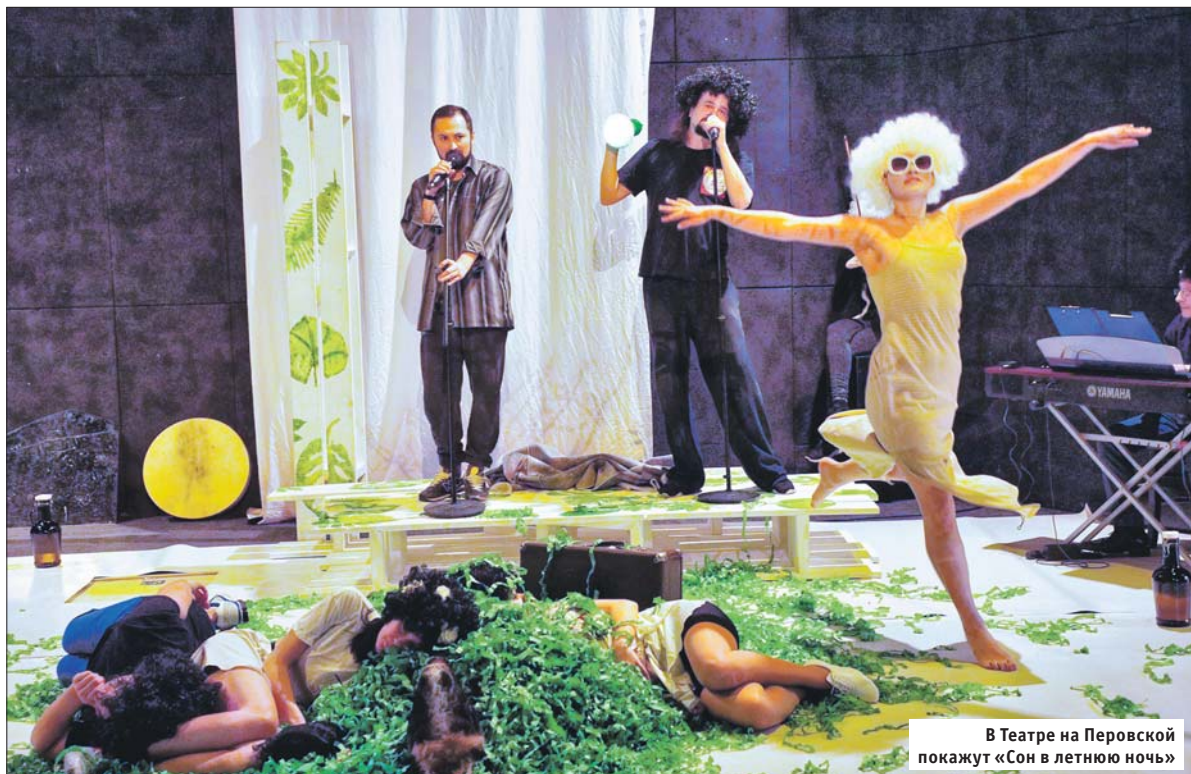
В Театре на Перовской покажут «Сон в летнюю ночь»

Регистрация по ссылке http://theater-perovo.ru/spectacle/2912/