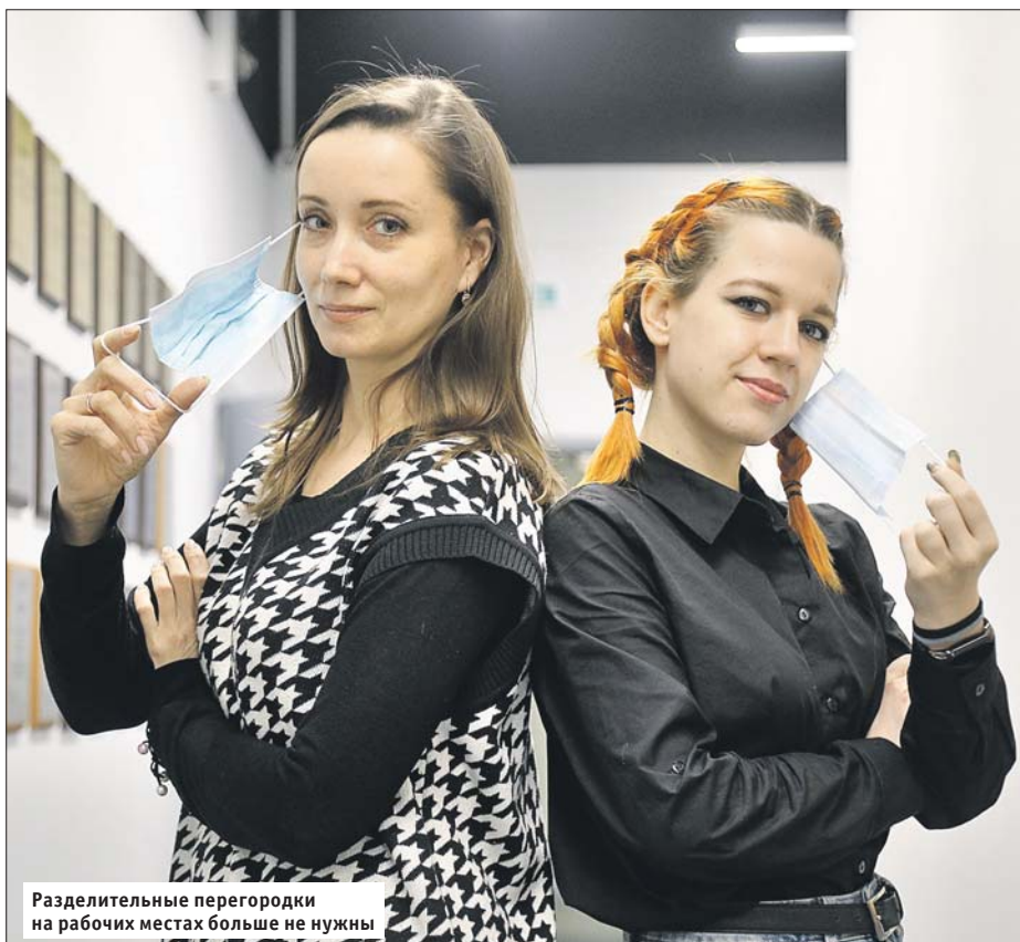
Разделительные перегородки на рабочих местах больше не нужны

В Москве отменены строгие ограничения по коронавирусу