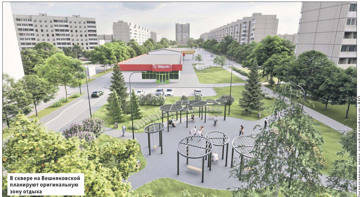
В сквере на Вешняковской планируют оригинальную зону отдыха