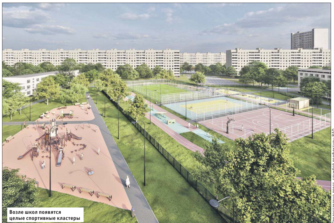
Возле школ появятся целые спортивные кластеры