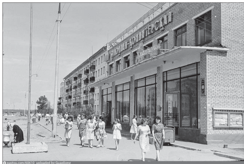
Предоставлено Innocenti Guaglione