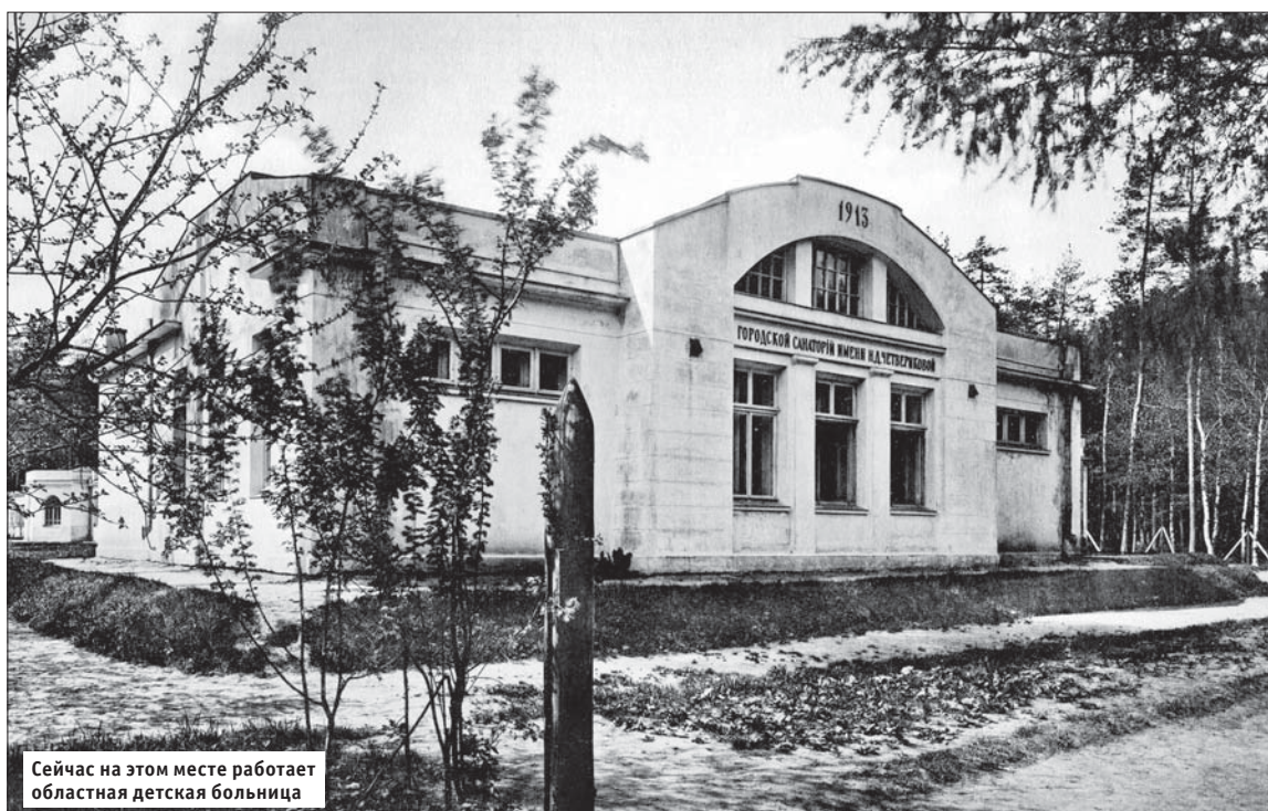
Сейчас на этом месте работает областная детская больница

«Все заразные болезни вместе взятые, както: тиф, дифтерит, оспа, корь и др., не дают такого количества смертей, как