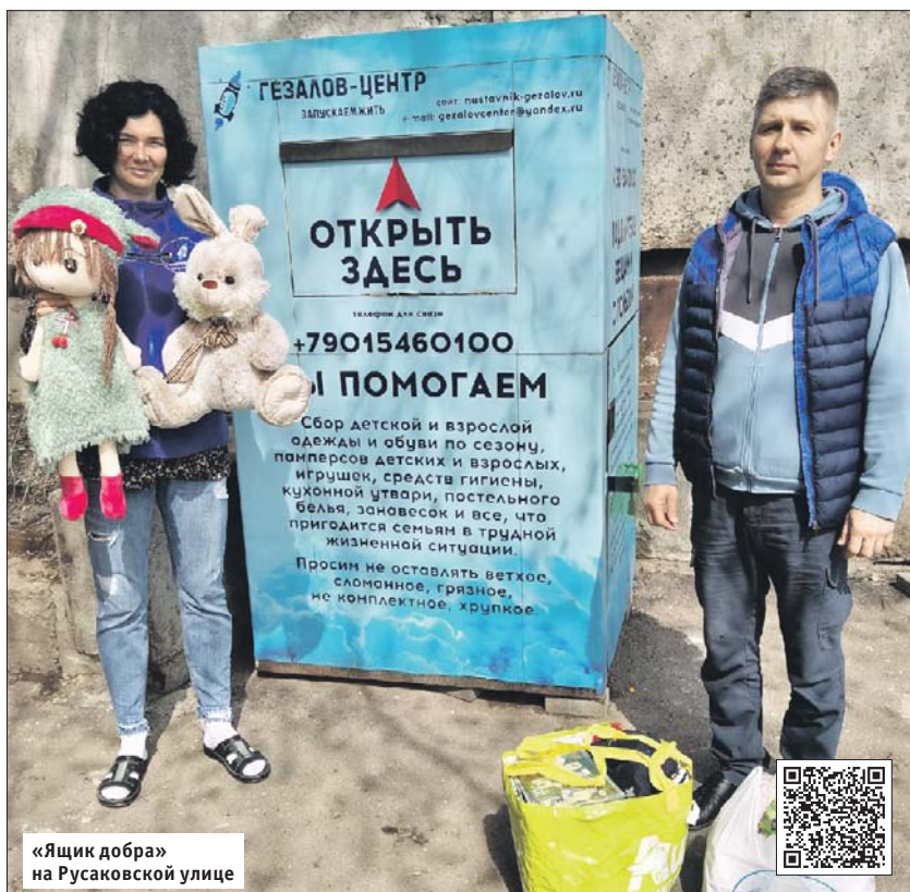
«Ящик добра» на Русаковской улице