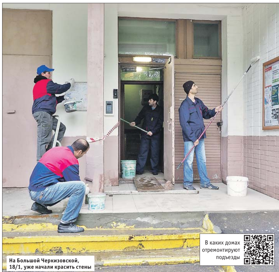
На Большой Черкизовской, 18/1, уже начали красить стены

— Время проведения и перечень работ должны выбрать сами жители на общем собрании. В протоколе всё должно быть подробно расписано. Например, в этом году на ул. Косинской, 18, в Вешняках жители не за-