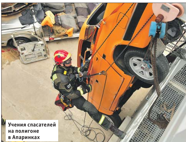
Учения спасателей на полигоне в Апаринках