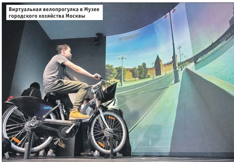
Виртуальная велопрогулка в Музее городского хозяйства Москвы