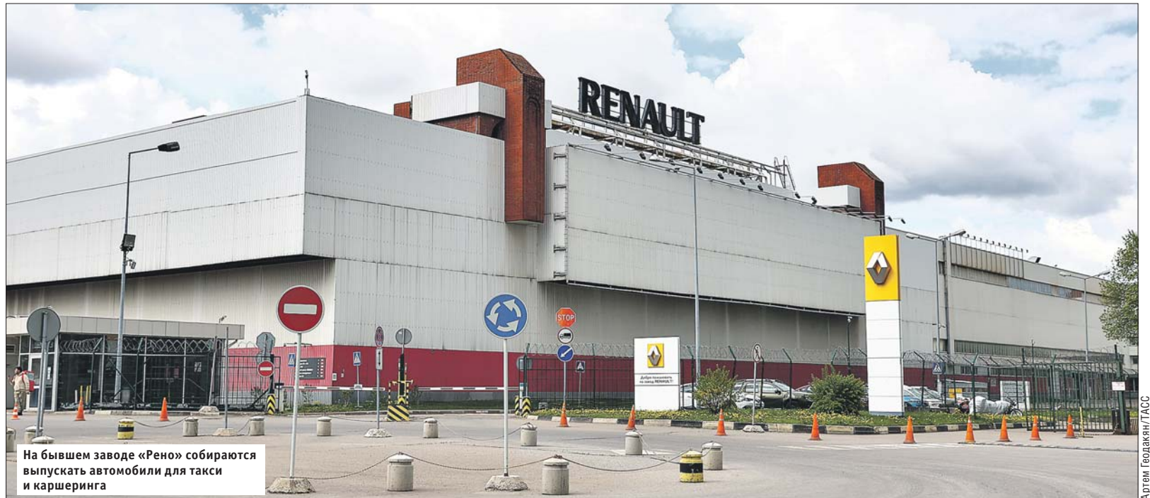
На бывшем заводе «Рено» собираются выпускать автомобили для такси и каршеринга

Основным технологическим партнёром возрождённого Московского автозавода станет «КамАЗ». На первом этапе планируется организовать производство клас-