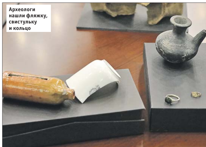
Археологи нашли фляжку, свистульку и кольцо