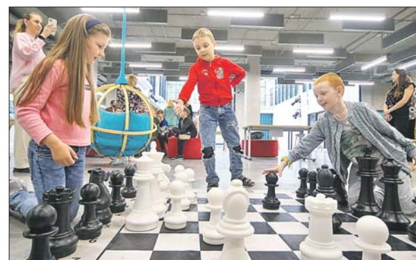
Юные шахматисты в образовательном комплексе «Формула», ЖК «Белые ночи»

Активное строительство социальных объектов в ТиНАО привело к тому, что число жителей Новой Москвы увеличилось с 2012 года более чем в два раза и сейчас составляет почти 650 тысяч человек. Если 10 лет назад лишь 17% москвичей, покупающих новую квартиру, выбирали жильё в ТиНАО, то в 2022 году эта цифра выросла до 60%. Большинство из новосёлов — молодые семьи с детьми.