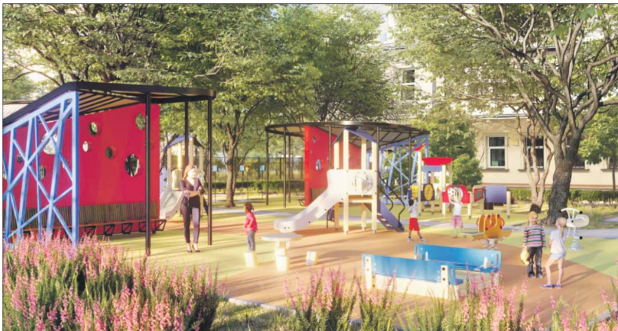
В игровых зонах устанавливают современное и безопасное оборудование