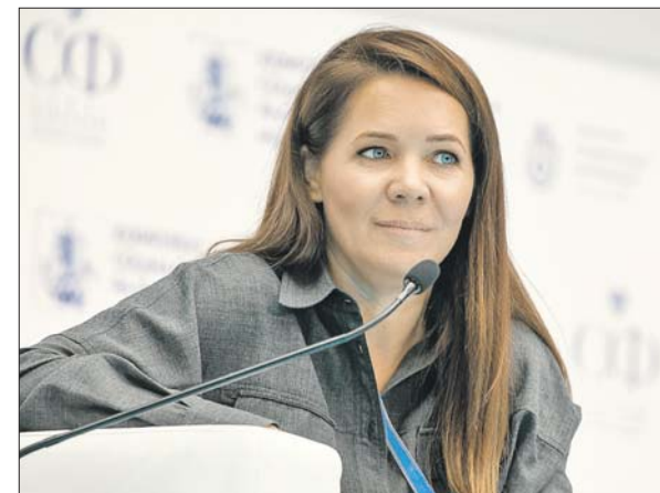
Пресс-служба Комплекса содействия

В столице действует пилотный проект: горожане имеют возможность получить льготные лекарства, административных либо уголовных дел, процедур банкротства и других.