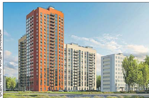
Новый дом будет состоять из четырёх секций, которые образуют полузакрытый двор

Участники программы реновации из Северного Измайлова уже в будущем году смогут получить квартиры в новой многоэтажке на Щёлковском ш., вл. 92, корп. 3.