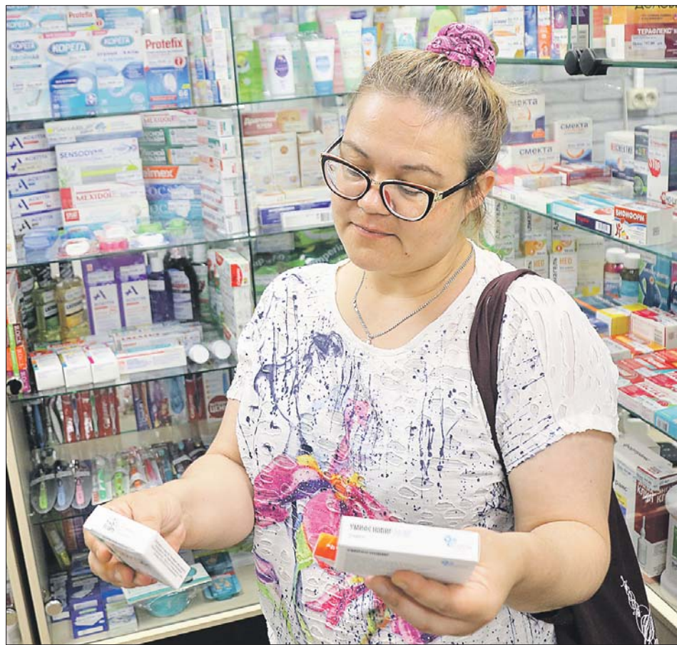
В аптеке на 1-й Парковой представлены все линейки препаратов

ЛЕКАРСТВА ПОДВОЗЯТ РЕГУЛЯРНО, ОЧЕРЕДЕЙ В АПТЕКАХ ВАО НЕТ