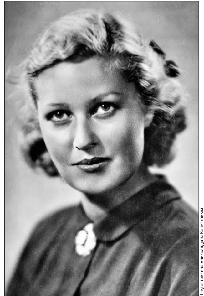
Красавицу актрису многие режиссёры приглашали на главные роли, но она неизменно отказывалась. Фото начала 1950-х