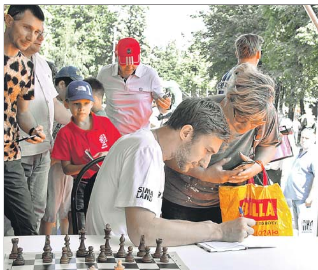
Знаменитый гроссмейстер Сергей Карякин раздавал автографы