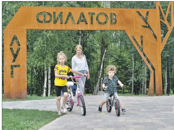
Новый парк «Филатов Луг»

В Новой Москве также можно организовать концерты, выставки, спортивные состязания и фестивали на открытом воздухе.