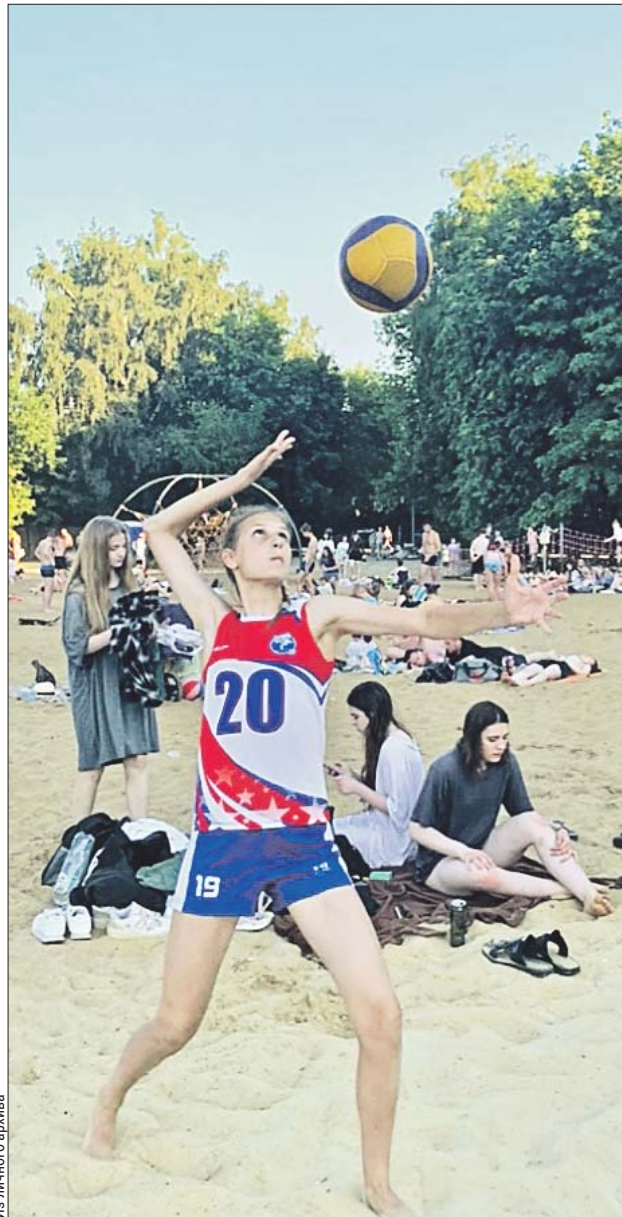
Спортсмены из «Триумфа» нередко занимают призовые места на городских любительских турнирах