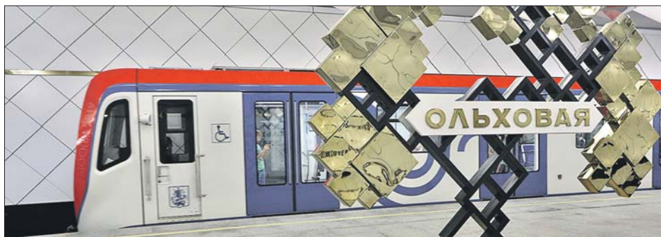
Одна из станций метро в ТиНАО. В ближайшие два года планируется построить ещё семь станций

За последние 10 лет в ТиНАО сформирован транспортный каркас, основой которого стали линии метрополитена и новые дороги. Пассажиры могут пользоваться станциями «Румянцево», «Саларьево», «Фи-