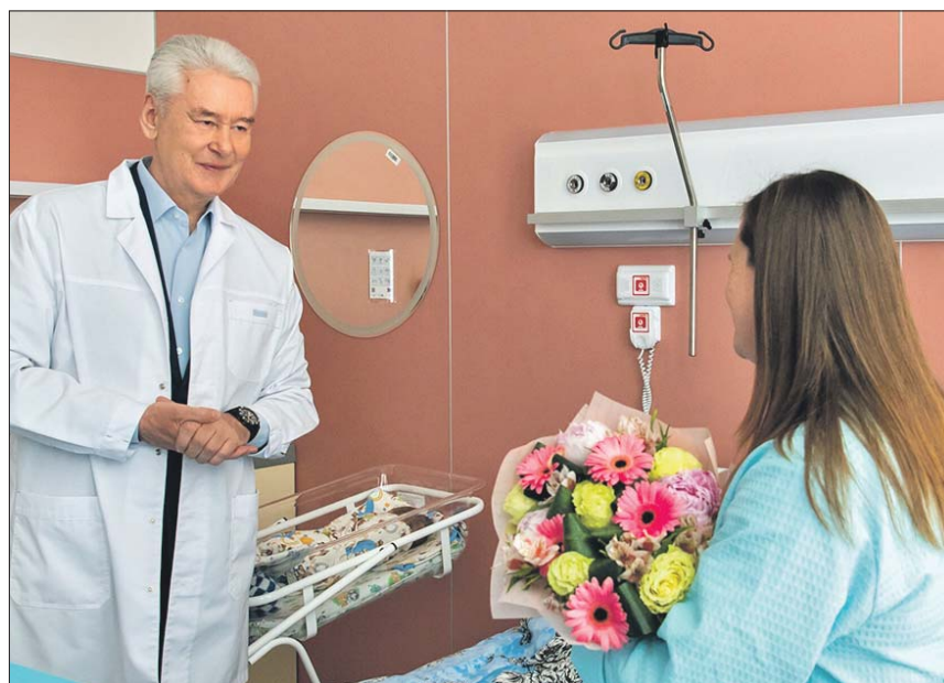
Мэр Москвы Сергей Собянин на открытии нового перинатального центра на территории многопрофильной клиники «Коммунарка» 3 июня 2022 года

За 10 лет в развитие ТиНАО вложено более 3 трлн рублей. При этом 2,4 трлн — деньги инвесторов, а 600 млрд — вклад бюджета. В ближайшие годы город намерен удвоить инвестиции в создание комфортных условий жизни на присоединённых территориях, их объём может превысить 6 трлн рублей.