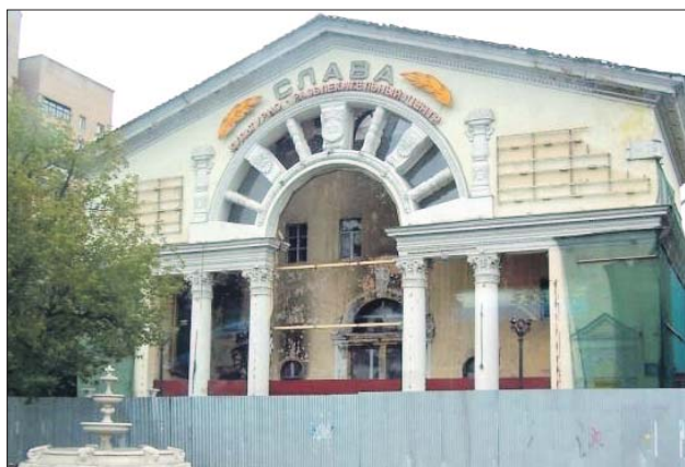
Уникальное здание было построено в 1958 году по проекту Ивана Жолтовского и Николая Сукояна

— Снаружи здания очищены подлинные архитектурные узоры. Старую штукатурку мы снимаем и на специальную сетку наносим