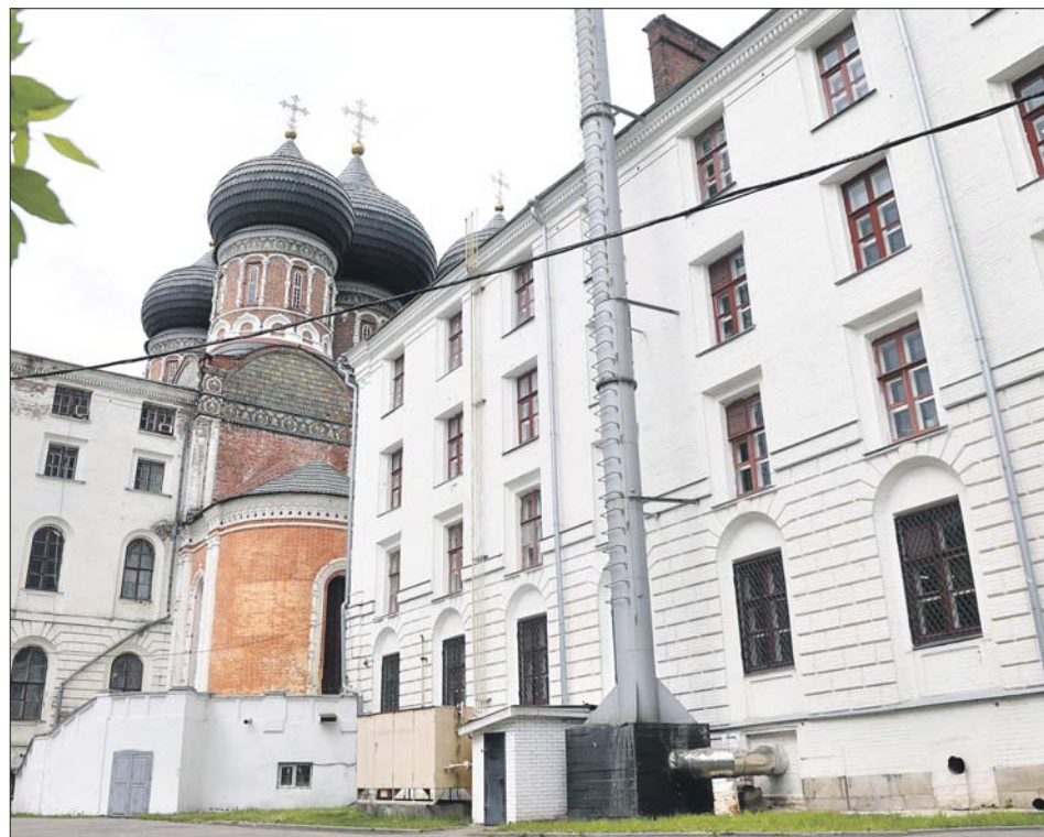
Так выглядит сегодня та самая военная богадельня на Измайловском острове

В 1944 году фильм «Зоя» посмотрели более 20 миллионов зрителей. Он вышел в лидеры проката вместе с кинокартинами «В шесть часов вечера после войны» и «Радуга» (о подвиге украинской партизанки).