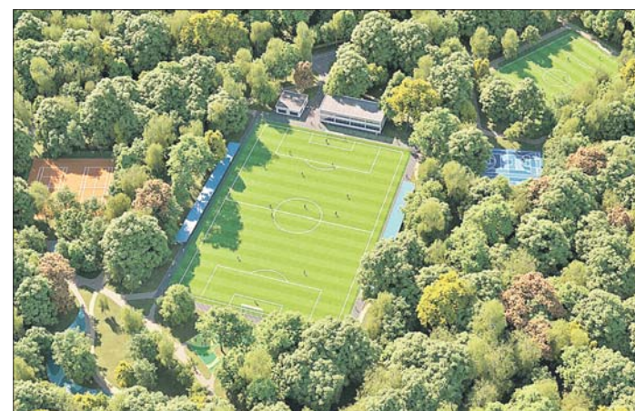
Так будет выглядеть после реконструкции стадион «Фрезер»