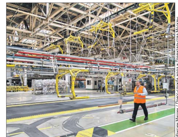
В цехах завода скоро закипит работа