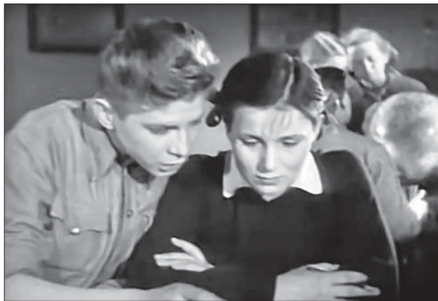
Кадр из фильма «Зоя». Александр Кузнецов в роли Бориса, друга главной героини