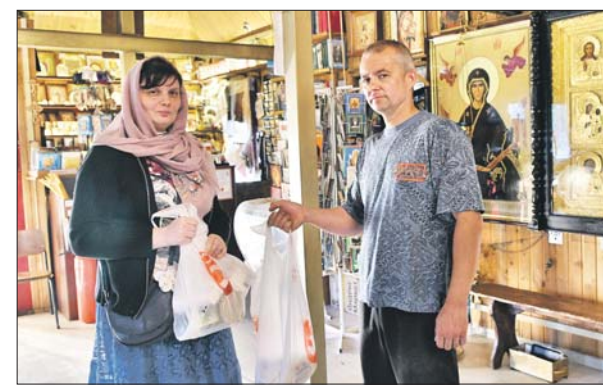
Помощь для беженцев приносят в храм каждый день

Адрес храма: Уральская ул., вл. 21, тел. 8-985-462-5555