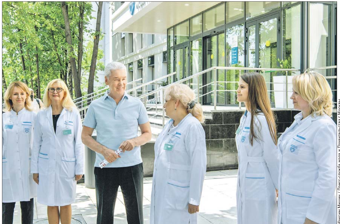
Сергей Собянин поздравил медработников с окончанием ремонта