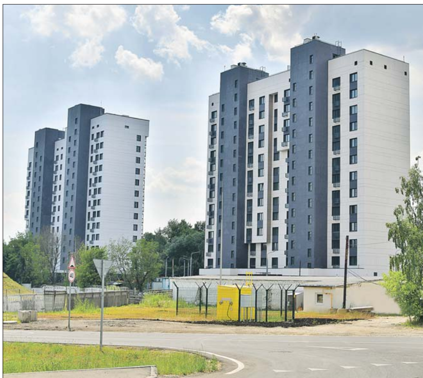
Переселение в многоэтажки на улице 9 Мая должно начаться до конца года