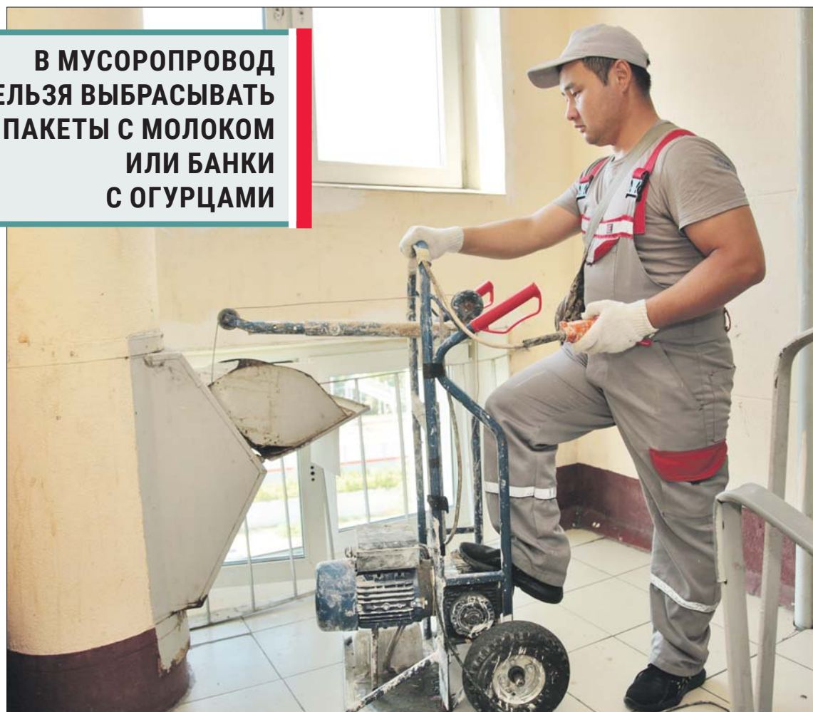
Внутри ствола ходит вниз-вверх огромная щётка-ёршик

В МУСОРОПРОВОД НЕЛЬЗЯ ВЫБРАСЫВАТЬ ПАКЕТЫ С МОЛОКОМ ИЛИ БАНКИ С ОГУРЦАМИ