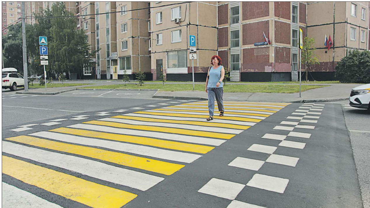
На Суздальской улице, у дома 38, приподняли «зебру»

Перекрёсток Кетчерской улицы и Новогиреевского путепровода небольшой. Но машин тут обычно немало: недалеко МКАД и Северо-Восточная хорда. Раньше проезд регулировался знаками. Те, кто ехал