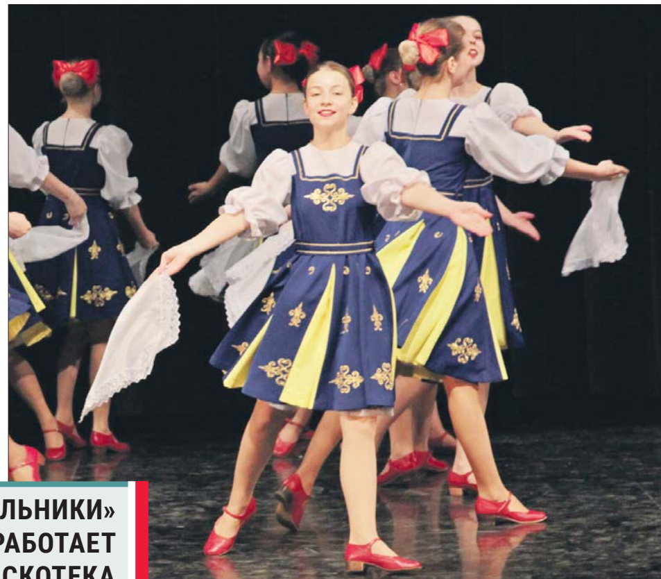
На сцене участники студии «Фантазёры» арт-кластера «Восток»

Расписание: понедельник 16.00-18.00 (группа продвинутого уровня), вторник 14.00-16.00 (новички), среда 15.00-17.00 (группа продвинутого уровня), пятница 14.00-16.00 (новички), суббота 11.00-13.00 (группа про-