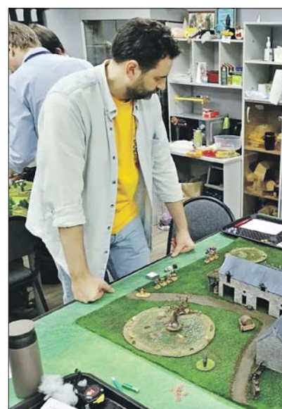
Члены клуба почти всю атрибутику делают своими руками

Игра в солдатики — вовсе не детская забава, а серьёзное увлечение для взрослых. Убедиться в этом приглашает досуговый центр «Соколинка», где открыт клуб «Штандарт».