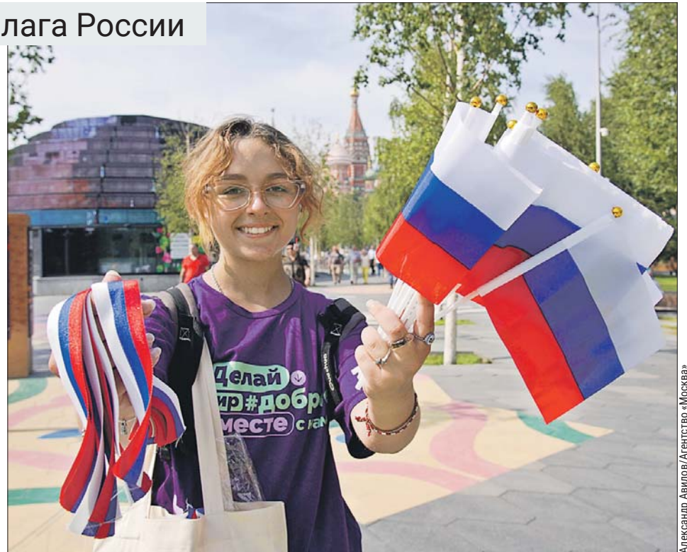
Александр Авлилов/Агентство «Москва»

А вечером на выводном круге ВДНХ запустили программу Центра национальных конных традиций. Посетители увидели показательные выступления всадников Кремлёвской школы верховой езды.