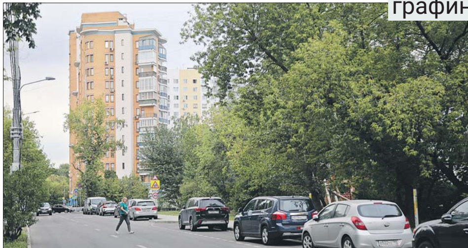
Старослободская улица: здесь полтора века назад располагалась та самая дача-салон