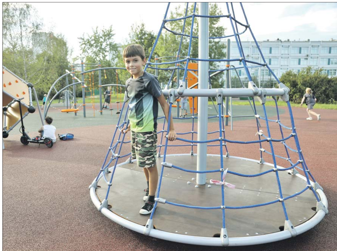
В округе комплексно реконструируются территории у 12 школ и 7 детских садов

В Вешняках сейчас приводят в порядок территорию лесопарка «Кусково». Здесь проведут реабилитацию семи прудов, высадят более 800 деревьев и 7,3 тысячи кустарников, проложат пешеходные, велосипедные и беговые дорожки, сделают 10 новых площадок. На расположенном рядом стадионе «Фрезер» отремонтиру-