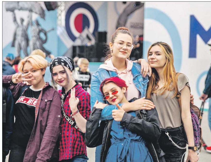
Парк «Сокольники» — излюбленное место отдыха москвичей

Спортивно-досуговый центр «Триумф» (Оранжевая ул., вл. 24, стр. 1) приглашает в парк у Святого озера на Оранжевой улице. Участников ожидают мастер-классы,