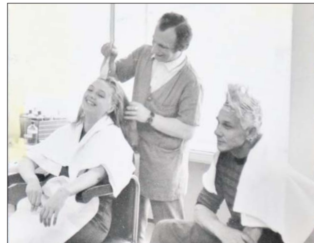
Мастер делает укладку исполнителям главных ролей в фильме «Офицеры» — АLINE Покровской и Георгию Юматову