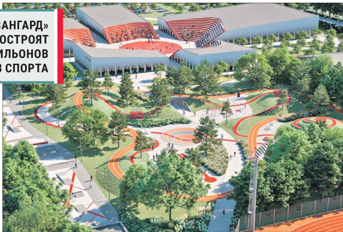
Таким будет стадион «Авангард» после реконструкции