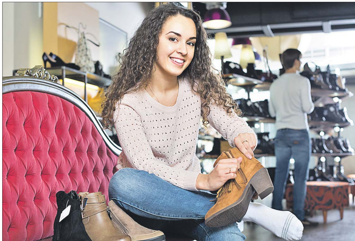
В магазинах широкий ассортимент как импортной, так и отечественной обуви

— Эту добротную обувь европейских марок производят в основном в Китае. Нам её постав-