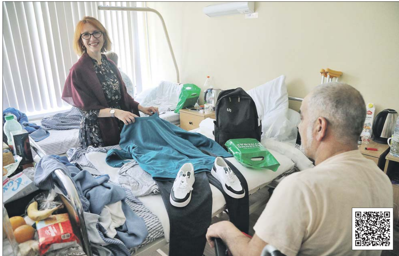
Добровольцы фонда привезли подарки пациентам госпиталя в Сокольниках