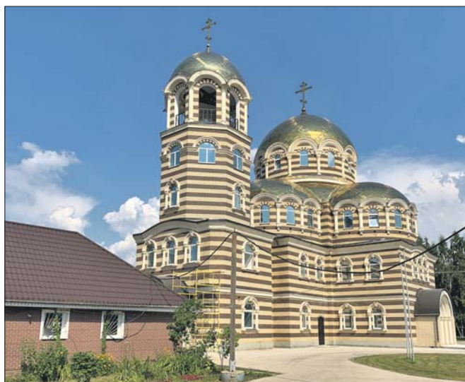
Храм на Уральской улице