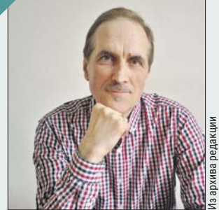
Из архива редакции