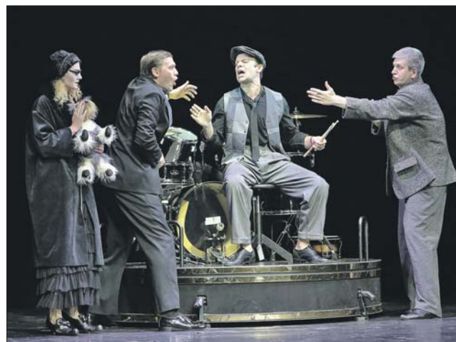
Сцена из спектакля «Плутни Скапена»