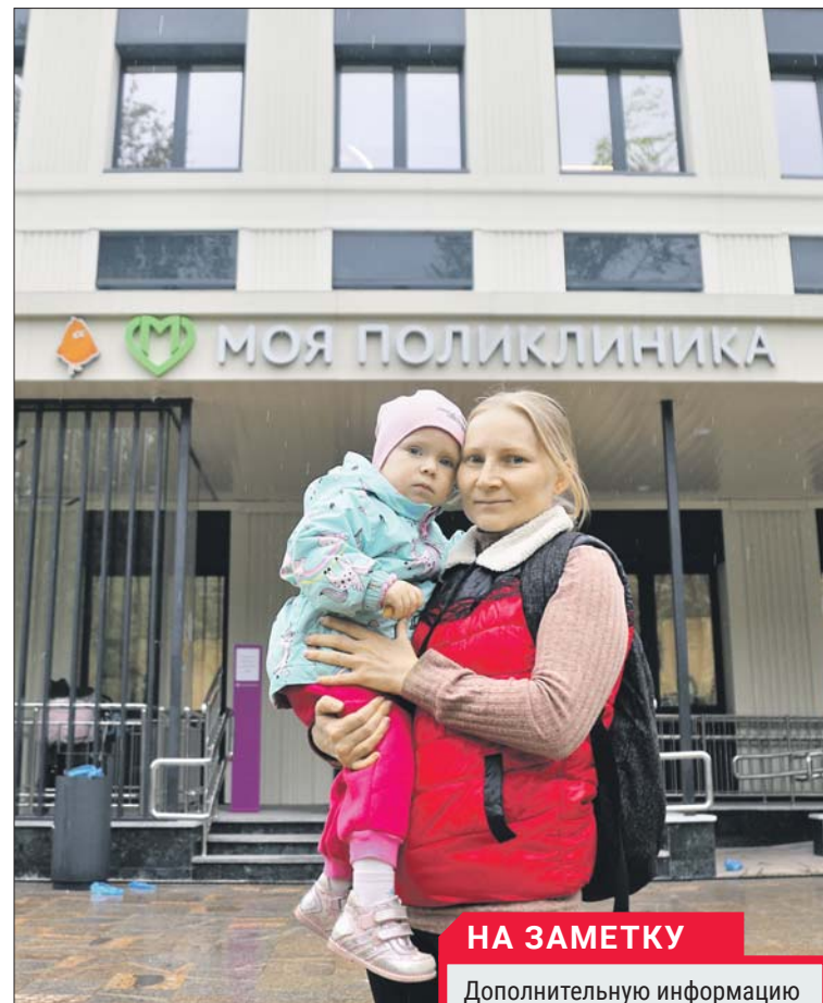
После капремонта в поликлинику вернулись довольные пациенты

Меняется внешний облик зданий, устанавливается новое, современное медицинское оборудо-