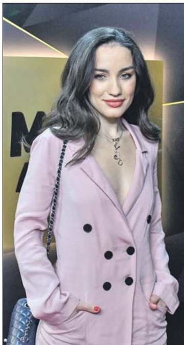
Певица Виктория Дайнеко

В Гольяновском парке (Алтайская ул., 5) 10 сентября в 15.00 начнутся мастер-классы, лазертаг, соревнования по мини-футболу, гиревому спорту, настольному теннису. Также гостей ожидает праздничный концерт, среди выступающих — известная пе-