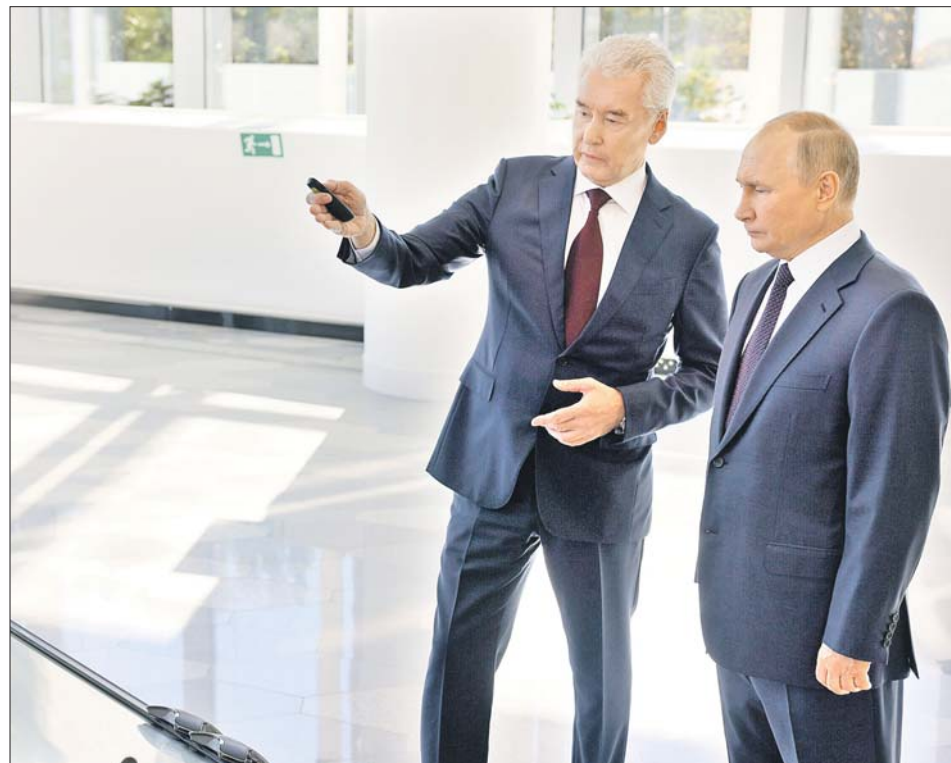
В парке «Зарядье» градоначальник рассказал президенту, как новые хорды изменят Москву