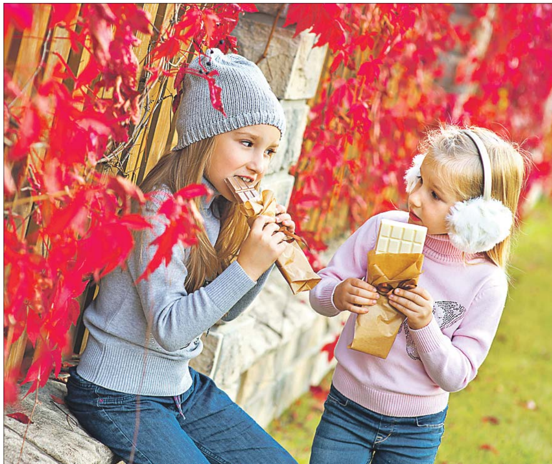
Шоколадка может быть полезнее, чем сухофрукт

Не стоит искать в составе продуктов обозначение ГОСТ: оно не гарантирует качество. Чтобы разнообразить или улучшить про-