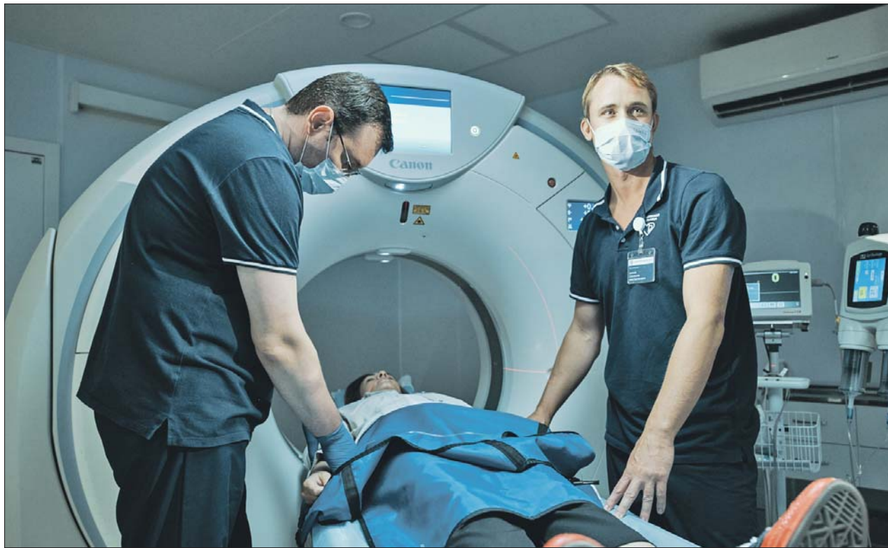
Для обучения персонала предусмотрено более 70 программ и тренингов

— Скорпомощной стационарный комплекс — это не только красивые стены, современная планировка и оснащение, — отметил врач. — В первую очередь это команда, сплочённый