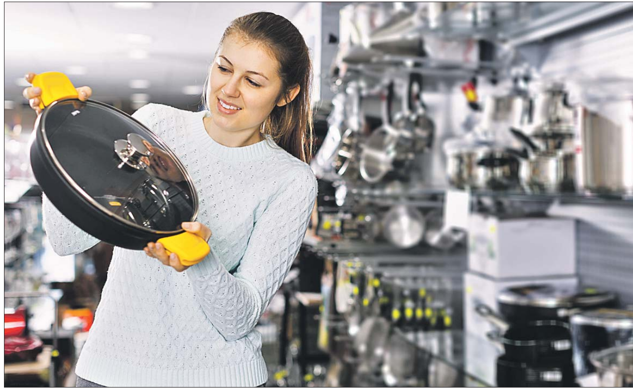
Полки с кухонными принадлежностями хозяек пока не разочаровывают

В магазине через дорогу предлагают импортную утварь из Германии и Швейцарии. Есть сковородки из чугуна, нержавейки, алюминия для всех типов плит. Стоимость товаров ниже, хотя и незначительно.