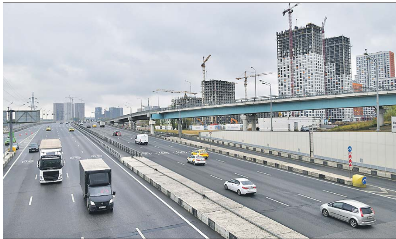
Эстакада соединяет МСД со Щёлковским шоссе

НА ВСЁМ ПРОТЯЖЕНИИ ТРАССЫ РАЗРЕШЕНО ЕХАТЬ СО СКОРОСТЬЮ 90 КМ/Ч