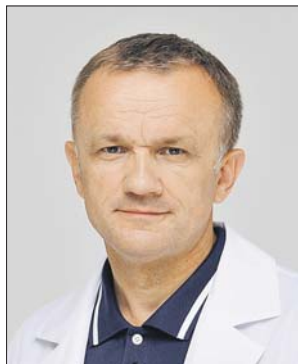
Пресс-служба Депздрава Москвы