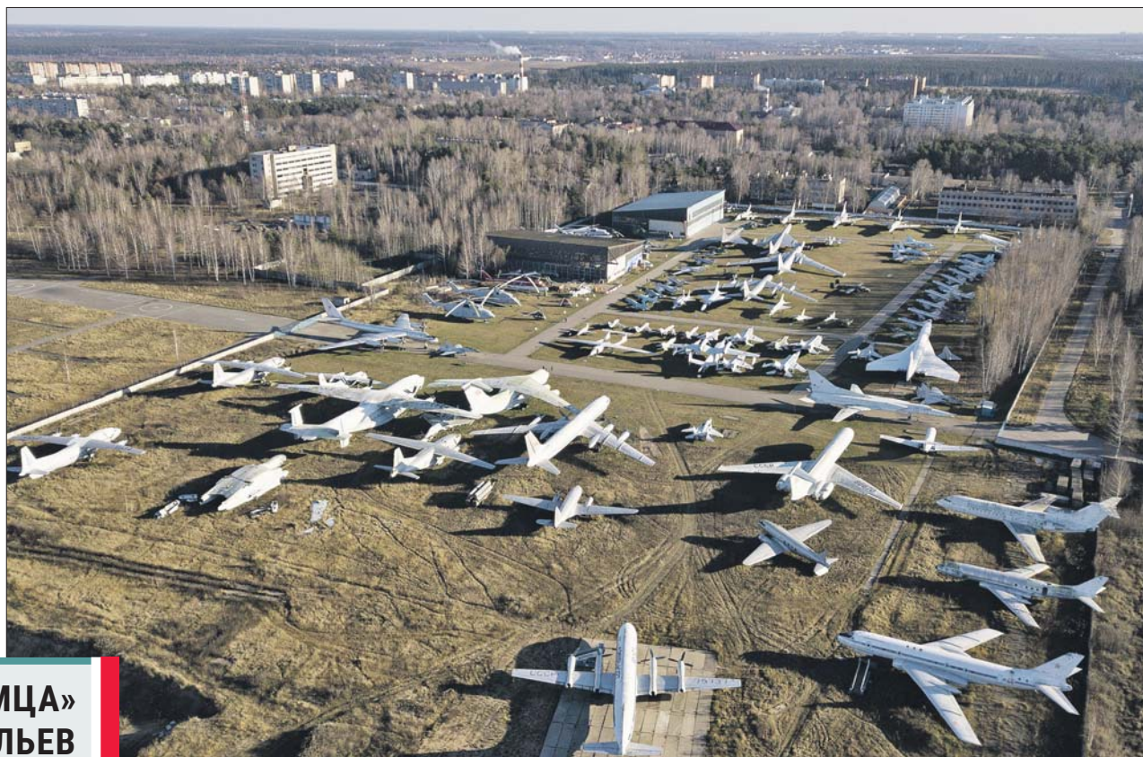
В Монине собрано более 200 летательных аппаратов

Самолёт Ту-114 с виду обыкновенный, но судьба у него необычная. Это