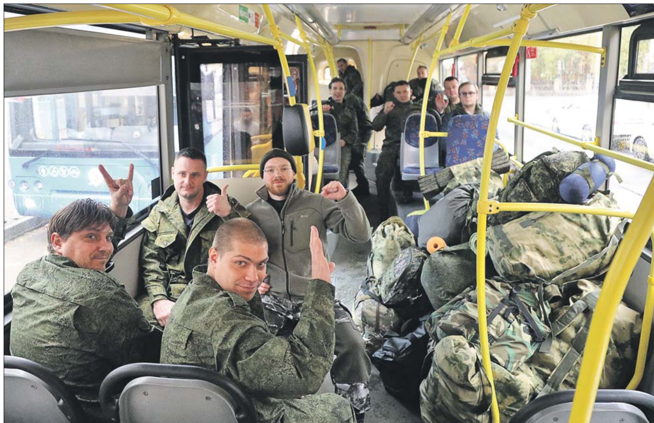
Настрой у ребят позитивный

▶ В Театре Романа Виктюка на улице Стромьнке вторую неделю работает временный пункт мобилизации. Отсюда парни отправляются защищать Родину.