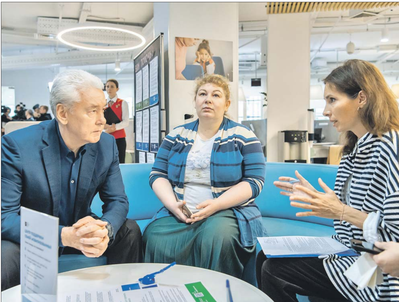
Сергей Собянин посетил городской центр поддержки семей мобилизованных

Они могут получить материальную, юридическую и психологическую помощь