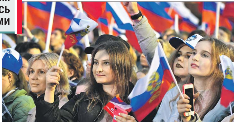
30 сентября на Красной площади состоялся концерт в поддержку присоединения Луганской и Донецкой народных республик, Запорожской и Херсонской областей к России. По сообщению МВД РФ, собрались свыше 180 тысяч человек

Денежной единицей на территориях новых субъектов будет рубль. До конца этого года при наличных и безналичных расчётах допускается обращение украинской гривны. Бюджетное законодательство будет применяться в новых субъек-