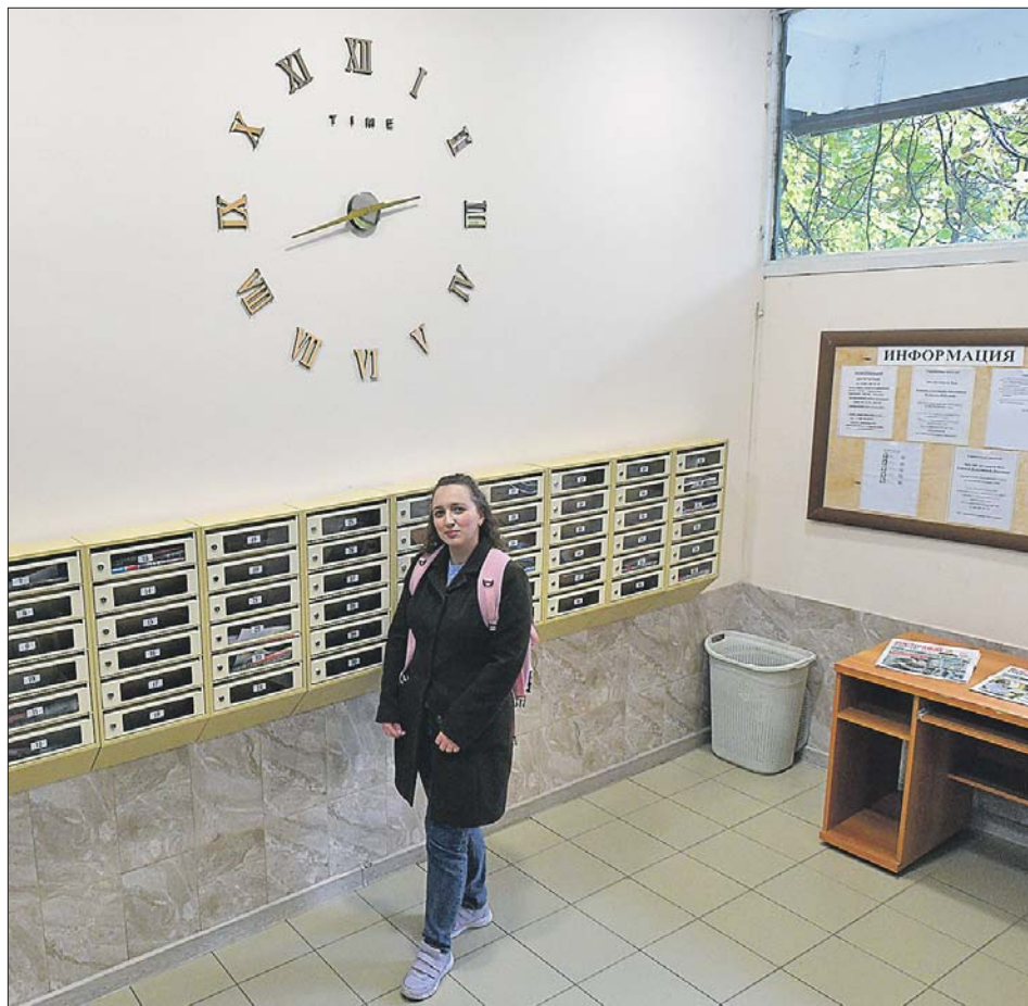
Жители дома №50, корп. 2, на Сокольническом Валу оформили прихожую подъезда большими настенными часами

— Жильцы дома №8 на Сокольническом Валу соорудили помещение для консьержки, а рядом — пандус. Типовой проект дома не предполагал таких пе-