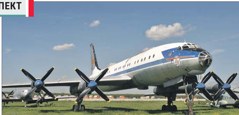
Американцы долго искали высокий трап, чтобы достать до двери Ту-114

борт Никиты Хрущёва, на котором он в 1959 году летал с визитом в Америку.