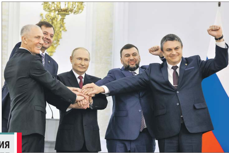
30 сентября. Георгиевский зал Кремля. Так закончилась церемония подписания договоров о принятии в состав России ДНР, ЛНР, Запорожской и Херсонской областей

Президент Владимир Путин подписал законы о принятии в состав РФ Херсонской, Запорожской областей, ДНР и ЛНР