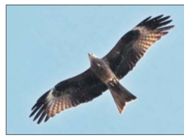
Коршун летает, не делая частых взмахов крыльями, а просто паря в воздухе